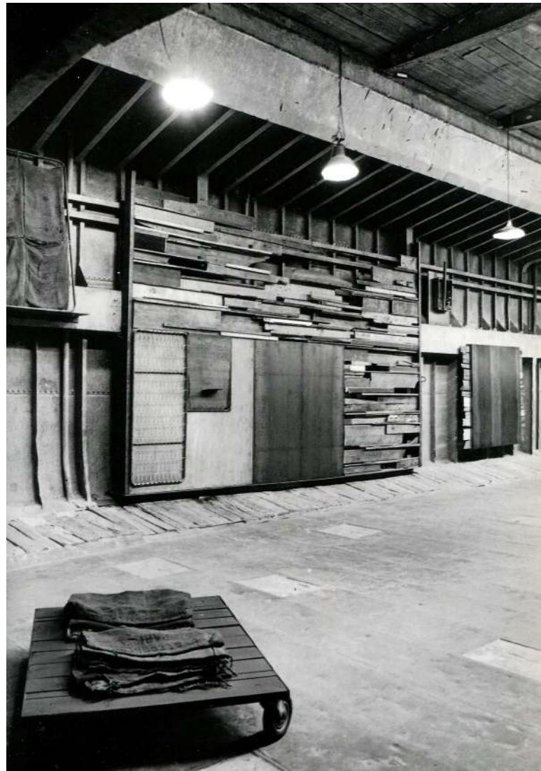
Γιάννη Κουνέλλη, «Ιόνιον», εγκατάσταση (1994).