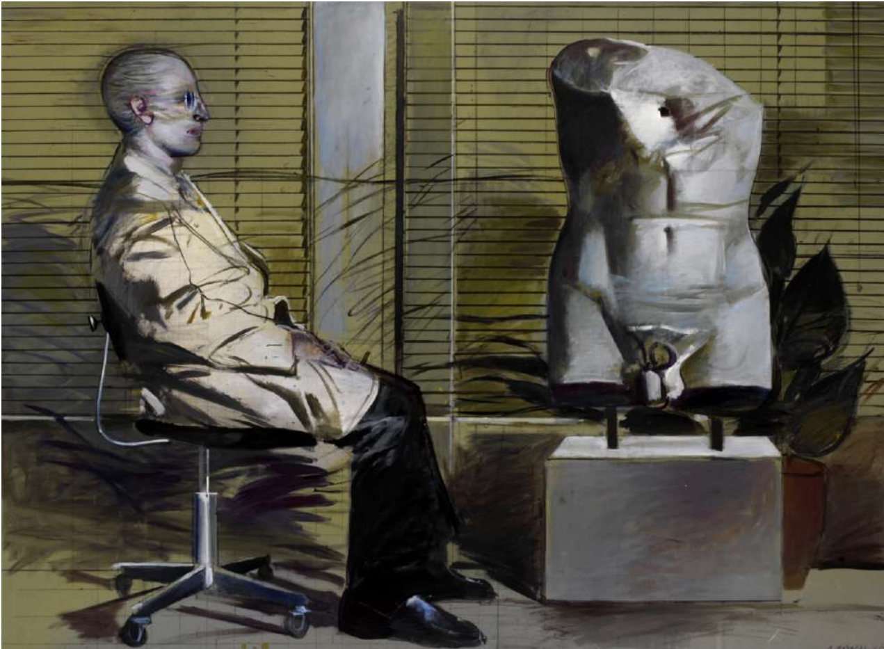
Δημήτρη Μυταρά, «Επιτύμβιο με στόρια», ακρυλικά (1975).