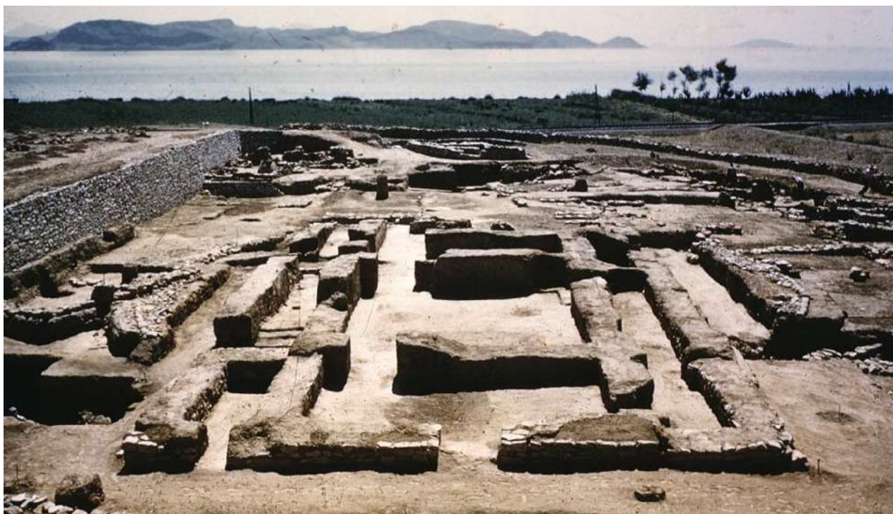
Αποψη από δυτικά της «Οικίας των Κεράμων» (φωτ. University of Texas at Austin, Classics Department).

της Λέρνας βρισκόταν δίπλα σε πηγές πλούτου μεγάλης κλίμακας, καθώς βρισκόταν εντός της πλούσιας και προστατευμένης από τα έντονα καιρικά φαινόμενα αργολικής πεδιάδας, και πολύ κοντά σε πηγή που, ακόμα και σήμερα, παρέχει άφθονο νερό.