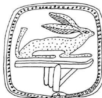
2. Ο ουροβόρος όφις περιβάλλει την μορφή ενός λαού. Απεικόνιση στην εσωτερική επιφάνεια σαρκοφάγου της 21ης Δυναστείας. Αρχαιολογικό Μουσείο Καΐρου, αρ. κατ. J. 29628=29735 (A. Niwiński, «Mummy in the Coffin as the Central Element of Iconographic Reflection of the Theology of the 21st Dynasty in Thebes», Göttinger Miszellen 109, 1989: 56, fig. 3).