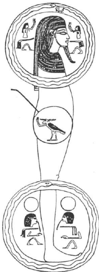
1. Το αρχαιότερο παράδειγμα του αιγυπτιακού ουροβορικού όφεως απεικονίζεται στον χρυσό ναΐσκο του Τουτανκχαμών. Δύο ουροβόροι περιβάλλουν ένα ταριχευμένο σώμα που αντιπροσωπεύει την ένωση του Ρα με τον Όσιρι (A. Piankoff, «Une représentation rare sur l'une des Chapelles de Toutankhamon», Journal of Egyptian Archaeology 35, 1949: 113, fig. 1).

Στην σχετική αιγυπτιολογική εργογραφία ο όφις με την «ουρά στο στόμα» έχει αναγνωριστεί ως ο φαραωνικός πρόγονος του ουροβορικού αρχέτυπου, και έχει χαρακτηριστεί ως το σύμβολο της ατέρμονης γέννησης, της αιώνιας επιστροφής στην πηγή της δημιουργίας, του κυκλικού χρόνου ( nhh ). Προσεκτικότερη, ωστόσο, μελέτη των σχετικών εικονογραφικών και κειμενογραφικών πηγών δεν υποστηρίζει μια τέτοια ταύτιση. Ο αιγυπτιακός