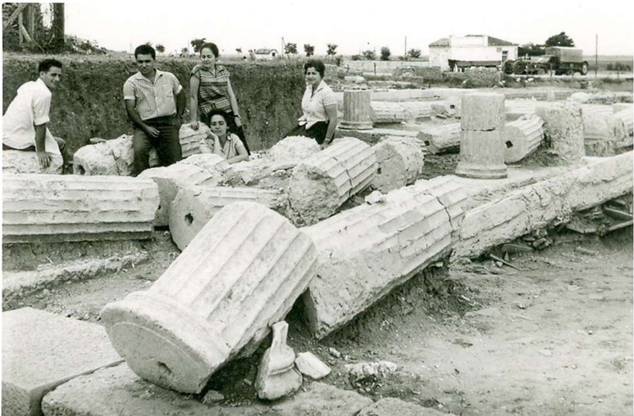
8β. Πέλλα, περιστύλιο. Από αριστερά: Σπ. Τσαβδάρου, Π. Θέμελης, Ι. Μανωλεδάκη, Αλ. Τσίκουλα, Ευγ. Γιούρη.