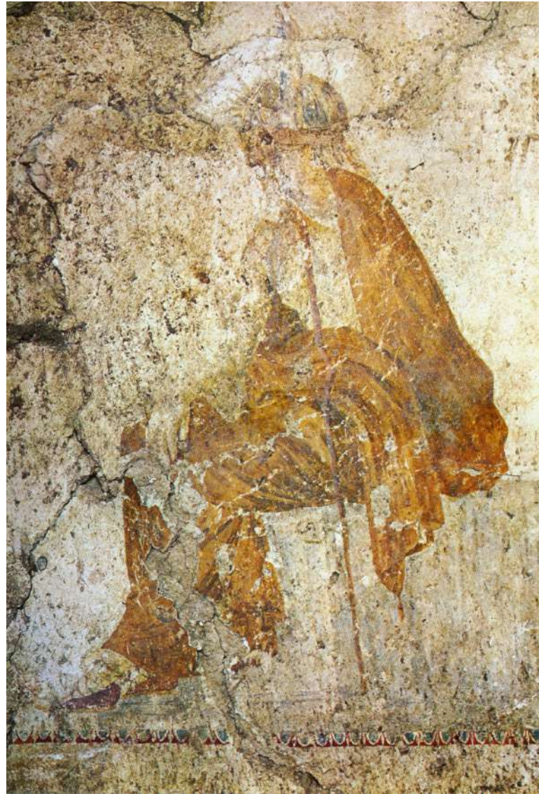
2. Τάφος Λευκαδιών. Τοιχογραφία. Ο κριτής Αιακός (© Προσωπικό Αρχείο Π. Θέμελη).

Ο Πέτσας με μετέφερε κάποια μέρα στον Άνω Κοπανό, με την εντολή να σκάψω έναν λαξευτό ελληνιστικό τάφο, παρόμοιο με πολλούς άλλους στην περιοχή, ο οποίος, δυστυχώς, ήταν συλημένος. Κατά διαστήματα με έπαιρνε μαζί του σε