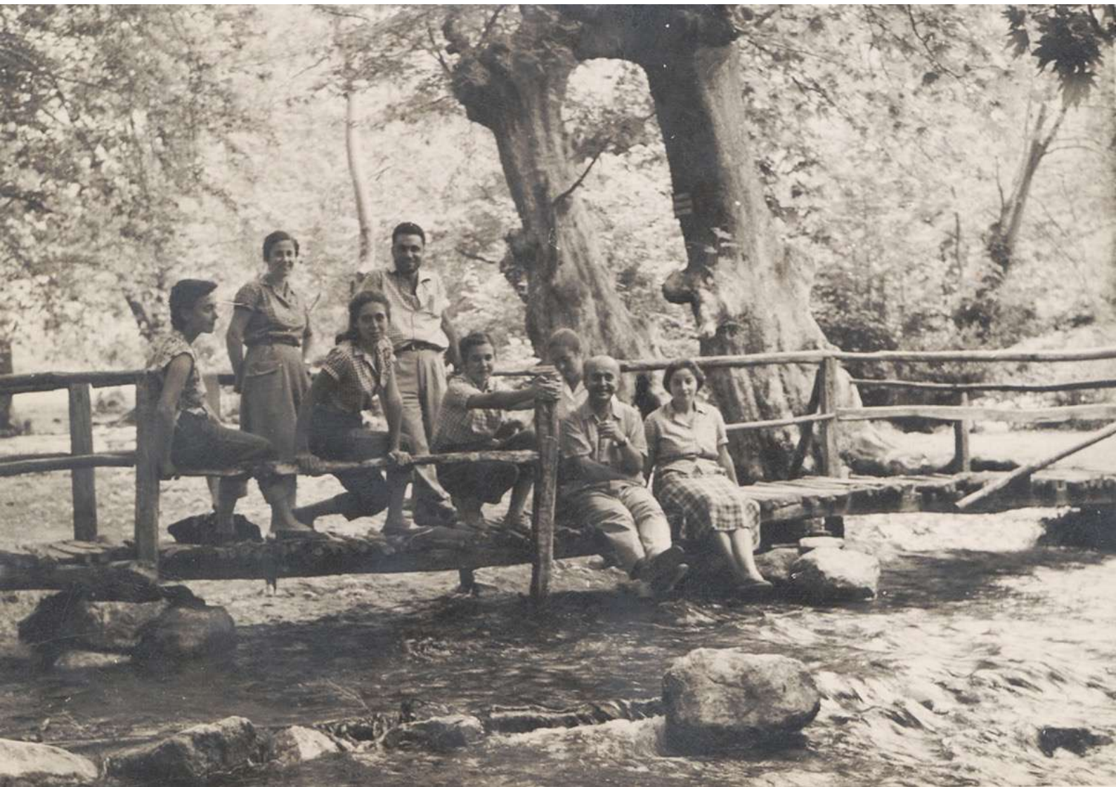
10. Εκδρομή στην Έδεσσα.