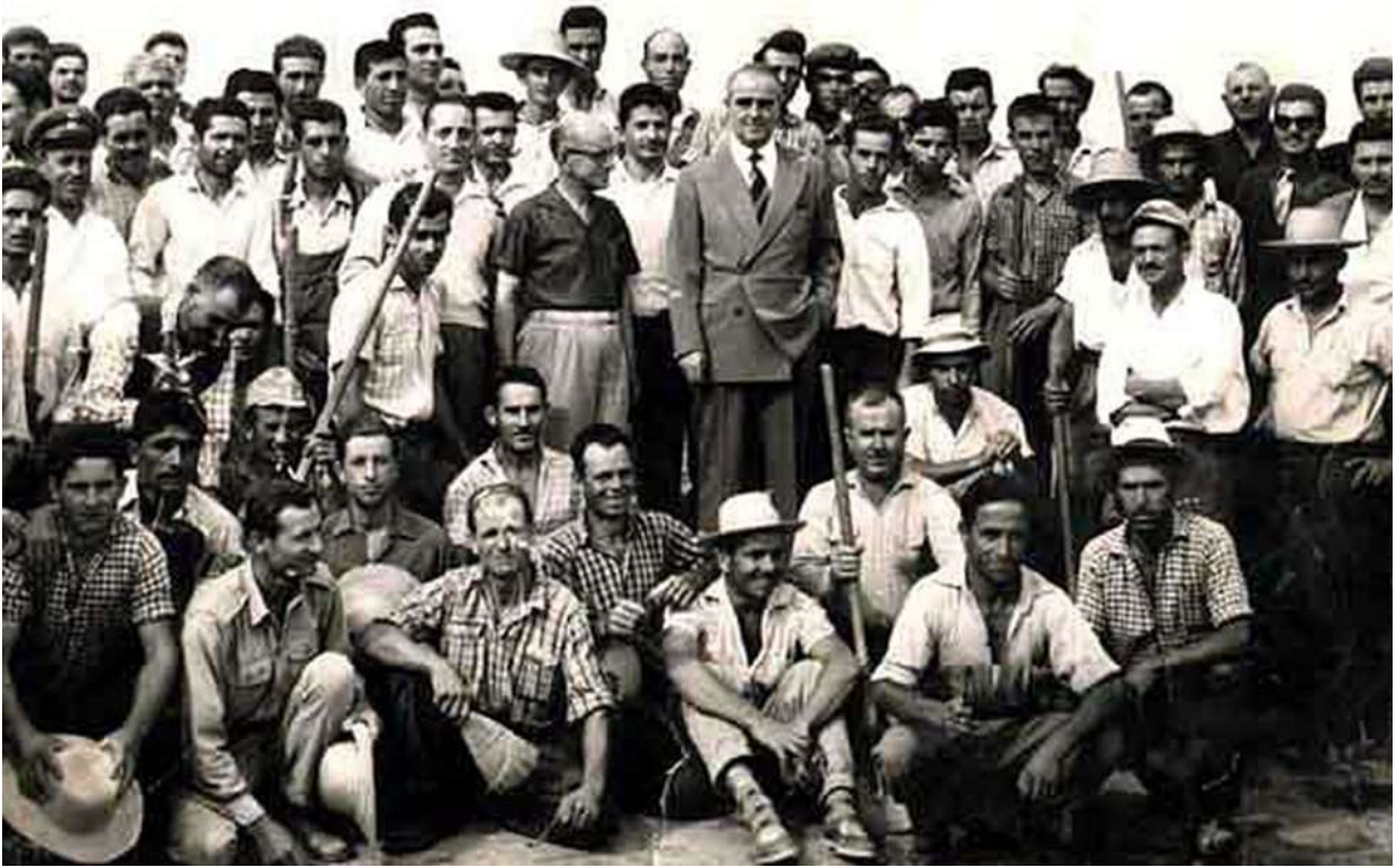
5. Πέλλα. Ο Κωνσταντίνος Καραμανλής στην Πέλλα. Δίπλα του ο Χ. Μακαρόνας και πλήθος εργαζόμενων και μη.