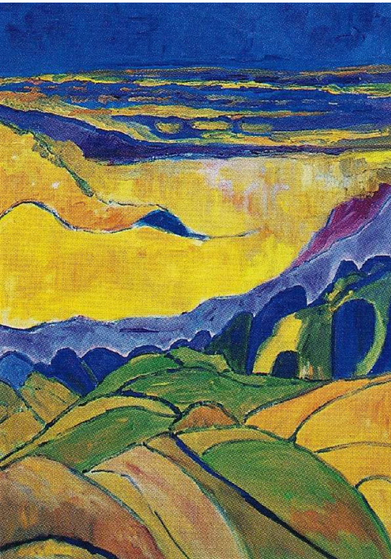
Γιώργου Γαλάβαρη, Εσπέρα , από τη Φυγή στην Αίγυπτο (1989, ελαιογραφία, 76 × 64 εκ.).

κοπέλα τόλμησε να ρωτήσει τον γέροντα πώς είχε καταφέρει να περάσει όλη του τη ζωή στην “ησυχία” και αν είχε μετανιώσει για το παραμύθι που έκρινε τη ζωή του, ο γέροντας απάντησε με γαλήνη: “Υπήρξα ευτυχής. Όλα είναι έρως”».