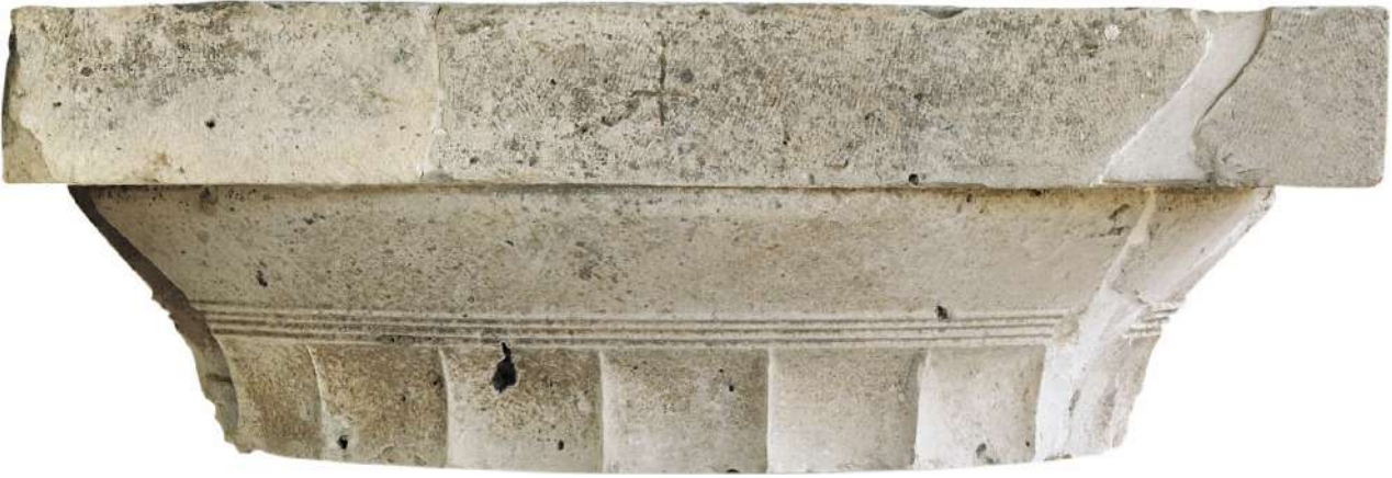
7. Δωρικό κιονόκρανο από τη νότια κιονοστοιχία εκατέρωθεν του προπύλου. Μέσα του 4ου αι. π.Χ. (© Εφορεία Αρχαιοτήτων Πέλλας).

τέλεση των θρησκευτικών καθηκόντων του βασιλιά. Είχε δηλαδή έντονα πολιτικό και θρησκευτικό χαρακτήρα. Το δυτικό (κτήριο II) με πολύ μεγάλη κεντρική αυλή, ίσως εξυπηρετούσε τις συνελεύσεις των ενεργών πολιτών με πλήρη πολιτικά δικαιώματα. Βόρεια του προπύλου και ανάμεσα στα δύο κτήρια υπάρχουν κλιμακοστάσια, διάδρομοι, χώροι με θρησκευτικό χαρακτήρα και άλλα δωμάτια. Βόρεια του κτηρίου I υπήρχε το κτήριο με τα βασι-