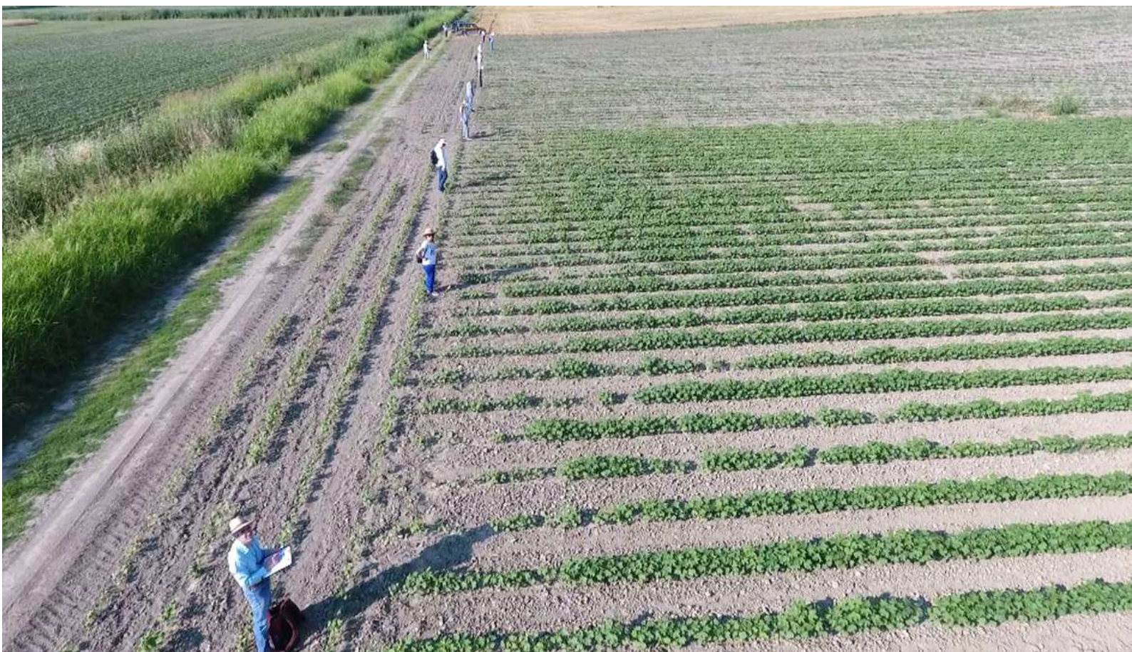
5. Επιφανειακή έρευνα, Ιούνιος 2017.