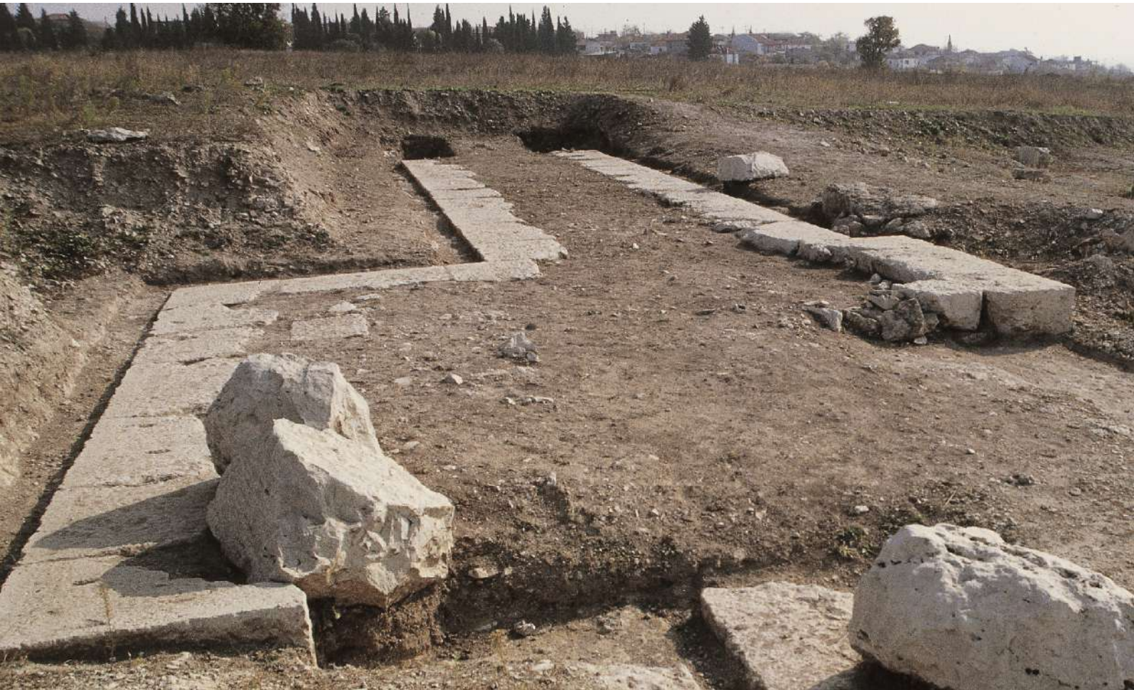
9. Το βόρειο σκέλος της οχύρωσης της αρχαίας Πέλλας και τετραγωνικός πύργος βόρεια του ανακτόρου της Πέλλας.

βασιλική πύλη, η οποία οδηγούσε κατευθείαν στα βασιλικά δώματα.