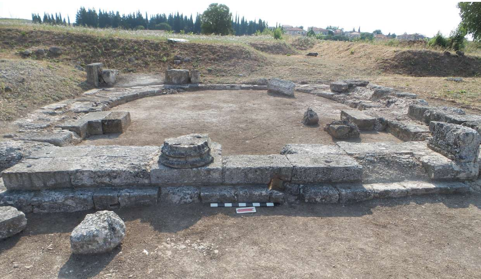
8. Ανατολική εξέδρα του κτηρίου I του ανακτόρου της Πέλλας. Ο χαρακτήρας της ήταν θρησκευτικός και χρονολογείται στο πρώτο ήμισυ του 3ου αι. π.Χ. (© Εφορεία Αρχαιοτήτων Πέλλας).

λικά διαμερίσματα, πάλι με κεντρική αυλή και δυτικά του το κτήριο V, η μεγάλη παλαίστρα του ανακτόρου με το λουτρό. Δυτικά του πυρήνα του ανακτόρου ανασκάφηκαν κτήρια που χρονολογούνται στον 3ο αι. π.Χ. και εξυπηρετούσαν τις ανάγκες του ανακτόρου. Βόρεια του ανακτόρου ήλθε στο φως το βόρειο σκέλος της οχύρωσης της Πέλλας, τμήματα τείχους και ανά διαστήματα τετραγωνικής κάτοψης πύργοι, καθώς και η