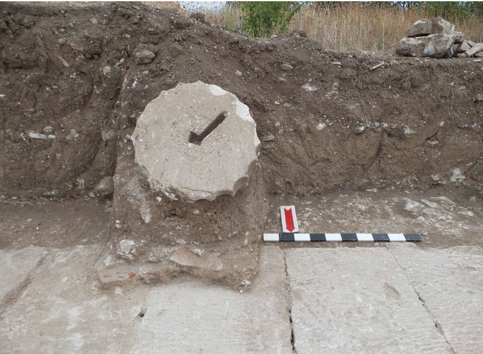
10. Ευρήματα από την ανασκαφική έρευνα στη νότια κιονοστοιχία του κτηρίου II κατά το 2016. Μέσα 4ου αι. π.Χ. (© Εφορεία Αρχαιοτήτων Πέλλας).

περιοχής της Πέλλας και με το νέο Αρχαιολογικό Μουσείο είναι συνεχής. Στον αρχαιολογικό χώρο διενεργούνται στοχευμένες επεμβάσεις ανάδειξης κτηρίων και υπάρχει συνεχής φροντίδα για τη βελτίωση της επισκεψιμότητας του χώρου (διαδρομές, φυλλάδια, καθιστικά, καθαριότητα κλπ.). Στο Μουσείο διοργανώνονται εκπαιδευτικά προγράμματα για μαθητές, περιοδικές εκθέσεις, εκδηλώσεις λόγου και μουσικής, επιστημονικές ημερίδες, διαλέξεις κ.ά. με στόχο να λειτουργήσει ως πόλος έλξης της τοπικής κοινωνίας και πολιτιστικό κέντρο της περιοχής χωρίς να χάσει τον βασικό ρόλο και τη βαρύτητά του.