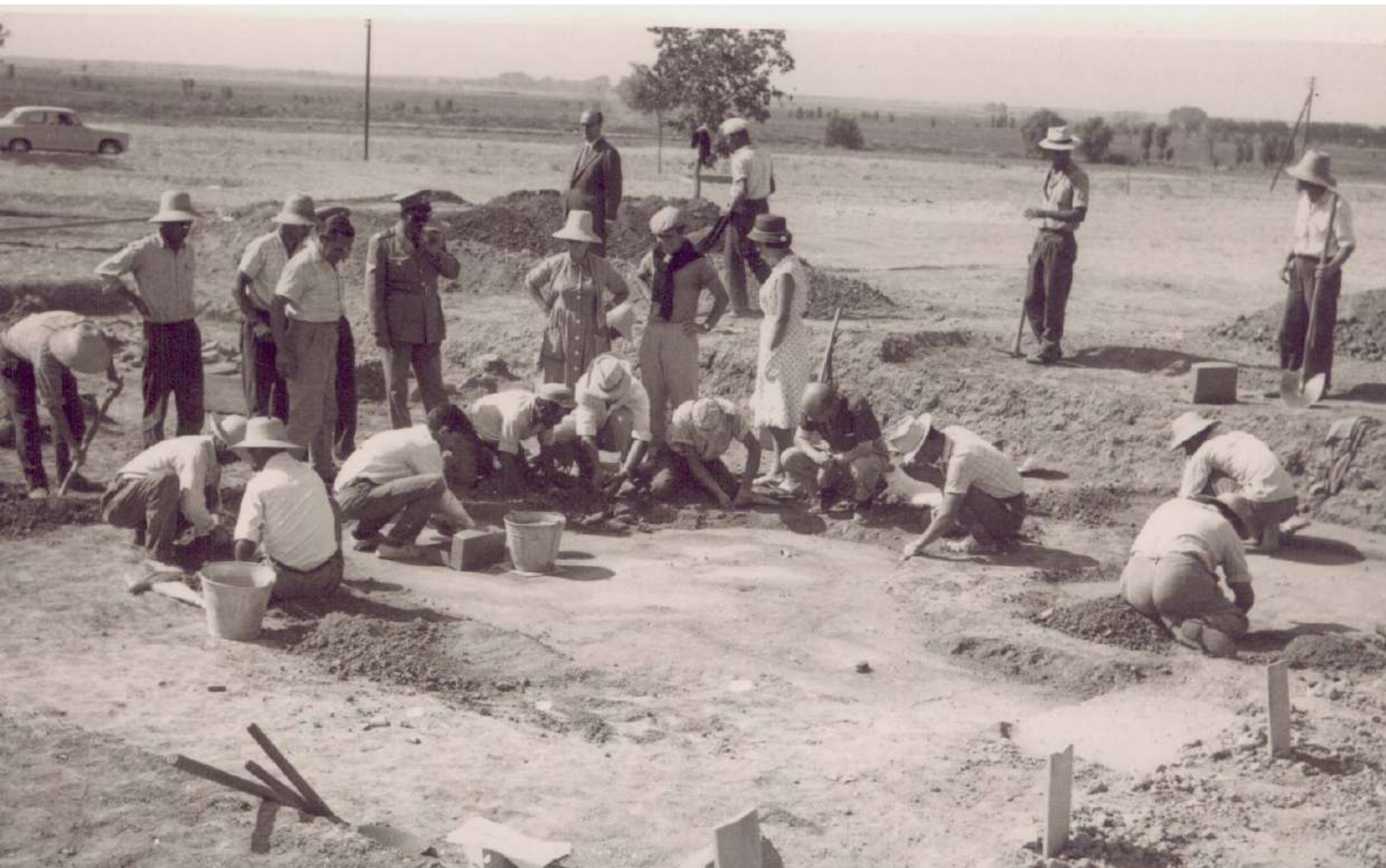
3. Ανασκαφή του ψηφιδωτού της «οικίας του Διονύσου», δεκαετία του '60.

Η μελέτη και κατανόηση του τοπίου της Πέλλας επιτυγχάνεται με διεπιστημονική προσέγγιση και περιλαμβάνει συστηματική επιφανειακή έρευνα, γεωφυσική διασκόπηση και εργαστηριακές