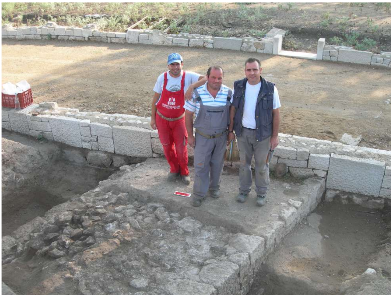
4. Το κλασικό τείχος της αρχαίας Πέλλας, 2009.