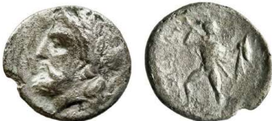
14. Αργυρό ημίδραχμο Αινιάνων (400-344 π.Χ.), Θεσσαλία. Κεφαλή Διός / ΑΙΝΙΑ-ΝΩΝ, Φήμιος ακοντιστής (Βυζαντινό Μουσείο Φθιώτιδας, Υπάτη - Συλλογή Κωνσταντίνου Κοτσιλή).

Στο τελευταίο βιβλίο των Μεταμορφώσεων ο Λούκιος αποκαμωμένος από όλα τα δεινά που τον κατατρέχουν προσεύχεται στην Θεά του Ουρανού –με οποιαδήποτε μορφή και αν αυτή υπάρχει. Πράγματι, η Θεά εισακούει την προσευχή του και εμφανίζεται στον ύπνο του. Είναι η Θεά Ίσις (εικ. 13), η οποία λατρεύεται από όλους του λαούς με διαφορετικά ονόματα, και η οποία έχει αποφασίσει να δώσει τέλος στα βάσανα του Λούκιου. Αφού του δίνει πληροφορίες για την τελετή η οποία θα γινόταν την επόμενη μέρα και στην οποία θα επανερχόταν στην αρχική του μορφή, του επισημαίνει ότι «οφείλει να της αφιερώσει το υπόλοιπο της ζωής του ως την τελευταία του πνοή». Φυσικά από μια τέτοια εφ' όρου ζωής αφοσίωση στην Θεά θα αποκόμιζε πολλά οφέλη