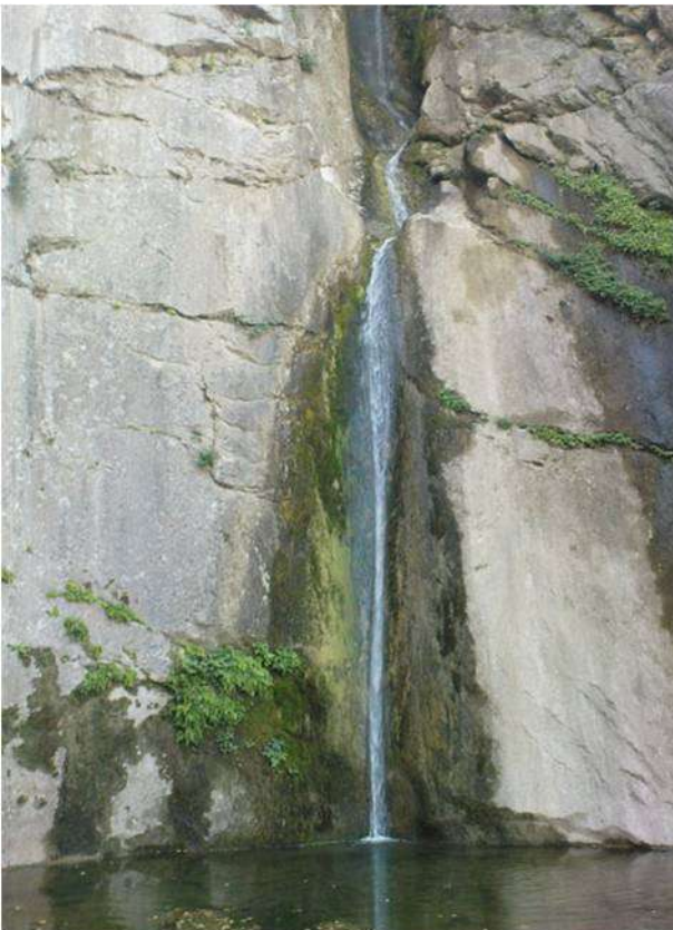
22. Ο καταρράκτης Κρεμαστός της Υπάτης.

Οι μύθοι και οι παραδόσεις για τις μάγισσες της Υπάτης έχουν περάσει και στα δημοτικά τραγούδια με χορό της περιοχής. Στις μέρες μας μάλιστα κάθε Αύγουστο μία από τις τρεις διαδρομές του μαραθώνιου της Οίτης ονομάζεται «Το Μονοπάτι των Φαρμακίδων», είναι απόστασης 6,4 χιλιομέτρων και διέρχεται από μαγικά και ονειρεμένα τοπία, όπως τη μικρή λιμνούλα που δημιουργεί πέφτοντας από 45 μέτρα ο εντυπωσιακός καταρράκτης Κρεμαστός, ο τελευταίος από 33 καταρράκτες του φαραγγιού που σχηματίζεται ανάμεσα στο κατώτερο τμήμα των βουνών Ψηλαιός και Πετρωτός, από το οροπέδιο του Ροδοκάλου και κάτω (εικ. 22).