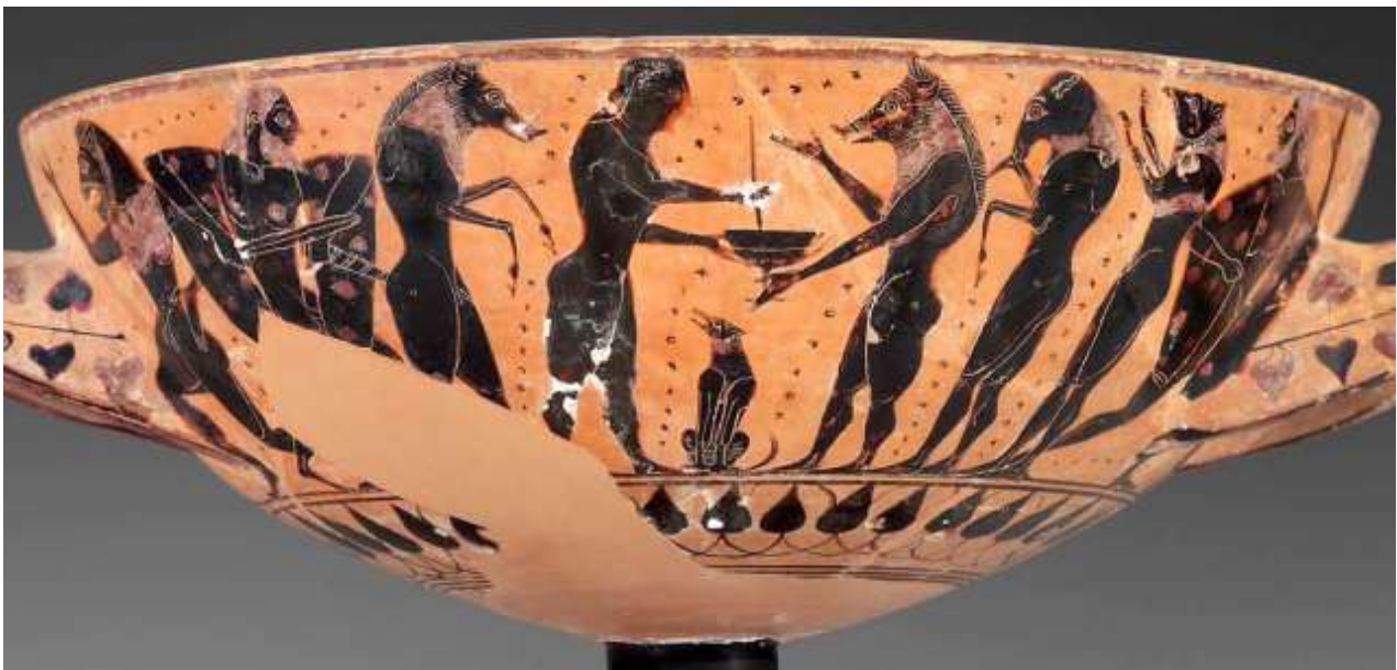
12. Η Κίρκη προσφέρει το Φάρμακον (μαγικό φίλτρο) στους άνδρες του Οδυσσέα, οι οποίοι έχουν ήδη αρχίσει να μεταμορφώνονται σε ζώα. Αττικό μελανόμορφο αγγείο, π. 550 π.Χ. (Βοστώνη, Μουσείο Καλών Τεχνών).