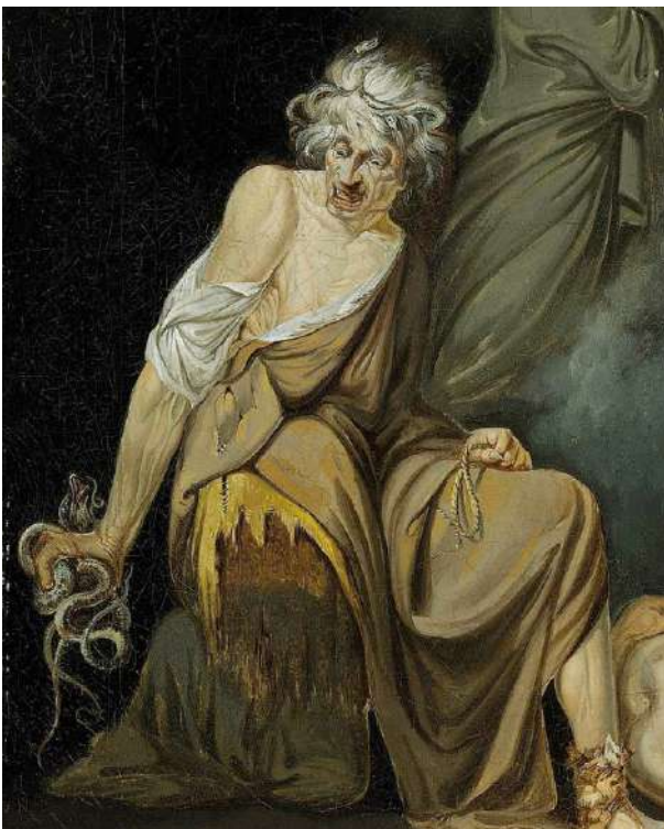
8. Η μάγισσα Εριχθώ.

Μια παραστατική εικόνα της θρησκευτικής-μαγικής σύγχυσης που επικρατούσε τον 1ο αι. μ.Χ. δίνει ο Μάρκος Ανναίος Λουκανός (39-65 μ.Χ.). Περιγράφει από την μια πλευρά την αρχαία θρησκεία, τα μεγάλα κέντρα της, την Δήλο, τους Δελφούς και την Δωδώνη, τις μεθόδους που αυτή χρησιμοποιούσε για την πρόβλεψη του μέλλοντος, όπως η σπλαγχνοσκοπία, η οιωνοσκοπία ή η αστρολογία, και κάθε άλλη που, αν και μυστική, ήταν επιτρεπτή. Από την άλλη πλευρά, αναφέρει τα μυστήρια της βάνουσης μαγείας, που οι θεοί αποστρέφονταν και αφορούσαν στον Πλούτωνα και στις σκιές του κάτω κόσμου, σε φοβερούς βωμούς και νεκρικές τελετές. Το γεγονός ότι ο Λουκανός βάζει έναν στρατηγό των Ρωμαίων, όπως ο Πομπήιος, να καταφεύγει στο δεύτερο είδος για να μάθει το μέλλον, και μάλιστα σε μια από τις ξακουστότερες κοπίδες της μαγείας, την Θεσσαλία βέβαια, δείχνει το μέγεθος της επιρροής που ασκούσαν οι άνθρωποι αυτοί. Οι γόητες επιδίωκαν να επηρεάσουν τους σπουδαιότερους για τα ανθρώπινα πάθη και επιθυμίες τομείς, όπως τον ερωτικό, ή να εκμεταλλευθούν τους δύο μεγάλους τύραννους του ανθρώπινου βίου, την ελπίδα και τον φόβο. Επωφελούμενοι από την αοριστία του μέλλοντος ή τις ελλείψεις του παρόντος, που