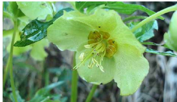
6. Το τοξικό φυτό Ελλέβορος ο κυκλόφυλλος ( Helleboros cyclophyllus ).

Στην αρχαιότητα για δύο πράγματα φημιζόταν η Θεσσαλία: για τις πανίσχυρες μάγισσες και για τ' άλογά της. Παροιμιώδης ήταν η φράση «πάρε άλογο από τη Θεσσαλία και γυναίκα από τη Σπάρτη». Ο Ηλιόδωρος στο Β' βιβλίο των Αιθιοπικών του, αναφέρει σχετικά «...Τα άλογα τους ήταν