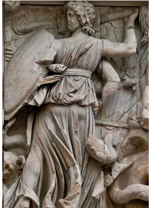
5. Η τρισυπόστατη θεά Εκάτη (λεπτομέρεια από τον βωμό του Διός στην Πέργαμο).

κουβέντιαζαν με τ' αστέρια και το φεγγάρι. Η ημέρα ήταν για μικρομάγια, όπως αντίστοιχα και οι σκοτεινές και ερεβώδεις νύχτες για σκοτεινά και αδιάλυτα μάγια.