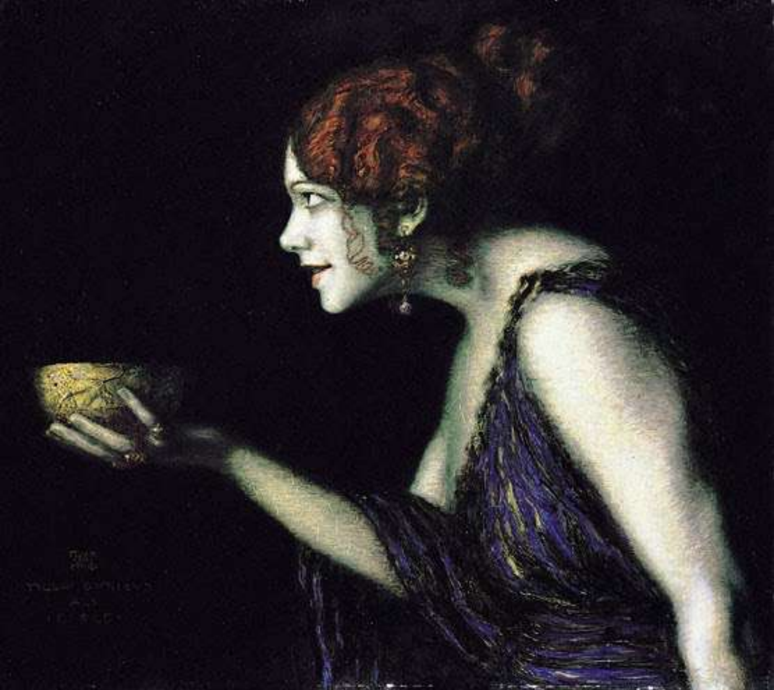
1. Η μάγισσα Κίρκη προσφέρει το μαγικό φίλτρο στον Οδυσσέα.

Υ πάτη, η ξακουστή καστροπολιτεία της γοητείας και της μαγείας (εικ. 2), εκεί όπου η πλανεύτρα φύση αντάμα με την μυθοτρόφο παράδοση σε καλούν να μνηθείς στα μυστήρια του σύμπαντος και σε ταξιδεύουν σε μαγευτικά μονοπάτια, εκεί όπου μέσα από την αχλή της ιστορίας και του μύθου προβάλλουν ημίθεοι και ήρωες, στοιχειά και μάγισσες.