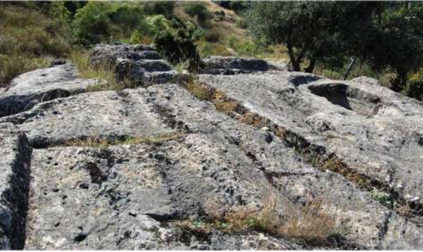
21. Τα «σκαβδάκια» (σκαφιδάκια) των μαγισσών στην Υπάτη.

μάγισσα, τρομερή και φοβερή, που και αυτή με την σειρά της διατεινόταν πως μπορούσε να κατεβάσει το φεγγάρι στη γη για να τ' αρμέξει! Και συνεχίζουν «Αν πας ως τον Ξηριά, θα ιδείς και την Ανεμότρυπα (εικ. 20), ένα σπηλαιο-βάραθρο, ένα βράχο με τρύπα βαθιά. Από κει, από το στόμιο του βαράθρου, κατεβαίνανε τις αστρόφεγγες νύχτες οι νεραΐδες και οι μάγισσες και πηγαίνανε στα ιαματικά θερμονέρια της Αφροδίτης, της προστάτιδας τους, να λουστούνε και να διατηρήσουνε αναλλοίωτη τη νεραϊδική ομορφιά τους. Κι εκεί καταγίνονταν με την μυστηριακή ιεροτελεστία της μαγείας, έξω από