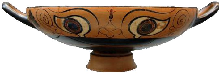
16. Ο «βάσκανος οφθαλμός» ζωγραφισμένος σε αγγεία, σκαλισμένος σε οστέινα περιάπτα ή ένθετος σε κατασκευές, χρησιμοποιείται ως αντίδοτο, ως φυλαχτό, ενάντια στο κακό μάτι. Χαλκιδική μελανόμορφη οφθαλμωτή κύλιξ, περ. 530 π.Χ. (Staatliche Antikensammlungen).

παθήματά του. Τέλος, μεταμορφώνεται πάλι σε άνθρωπο με το μαγικό αντίδοτο, που του είχε εμπιστευτεί, η Παλαίστρα. Όσοι έγιναν θεατές του απροσδόκητου αυτού θεάματος χωρίστηκαν σε δύο ομάδες. Μερικοί πίστευαν πως έπρεπε αμέσως να τον κάψουν, επειδή ήξερε φοβερά ξόρκια και μπορούσε να πάρει διάφορες μορφές, τακτική που εφαρμόστηκε ευρέως από τον μεσαίωνα μέχρι και τις αρχές του 20ου αιώνα. Άλλοι πάλι έλεγαν πως έπρεπε να περιμένουν και να μάθουν τι είχε να πει, προτού αποφασίσουν. Τότε ο Λούκιος έτρεξε στον κυβερνήτη της επαρχίας, που έτυχε να βρίσκεται ανάμεσα στους θεατές, και του είπε πως κάποια γυναίκα Θεσσαλή, υπηρέτρια κάποιας άλλης μάγισσας από την Υπάτη, τον άλειψε με μαγική αλοιφή και τον έκανε γάιδαρο. Τον παρακάλεσε δε να τον φρουρεί μέχρι να τον πείσει πως δεν έλεγε ψέματα.