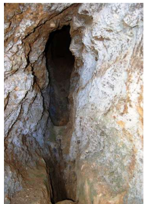
20. Η Ανεμότρυπα των μαγισσών στην Υπάτη.