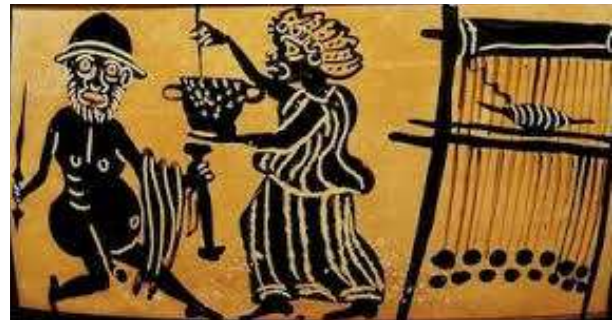
11. Ο Οδυσσέας και η Κίρκη, παράσταση σε μελανόμορφο σκύφο (π. 410-390 π.Χ.) (Οξφόρδη, Μουσείο Ashmolean G 259).

άλλους τους εξόντωναν τελείως με τα μαγικά τους. Η μάγισσα Μερρόη, μια γριά ταβερνιάρισσα από την περιοχή διέθετε υπερφυσικές δυνάμεις και μπορούσε «να κατεβάσει κάτω τα ουράνια και ν' ανεβάσει στα ψηλά τη γη, να στερέψει τις πηγές και να γκρεμίσει τα βουνά, να δοξάσει τα δαιμόνια και να ρίξει τους θεούς από το θρόνο τους, να σβήσει τ' άστρα και να φωτίσει τα Τάρταρα». Μπορούσε «να κάνει τους άντρες να την ερωτεύονται παράφορα, όχι μόνο τους συντοπίτες της αλλά και τους Ινδούς και τους Αιθίοπες». «Επειδή ένας από τους εραστές της την είχε απατήσει με κάποια άλλη, τον μεταμόρφωσε με μια της λέξη σε κάστορα, γιατί, όταν αυτό το ζώο φοβάται πως θα το πιάσουν οι κυνηγοί, ξεφεύγει κόβοντας με τα δόντια τα γεννητικά του