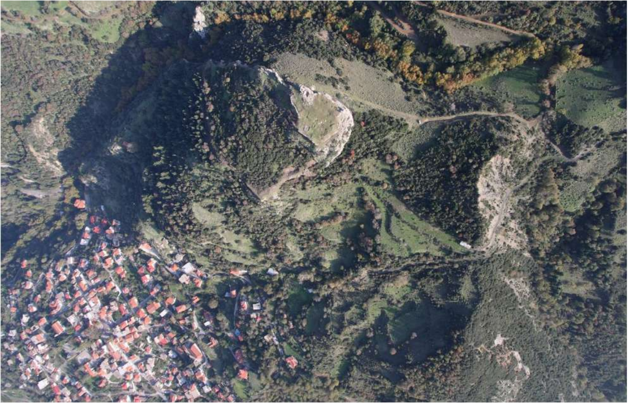
2. Η καστροπολιτεία της Υπάτης.

ως Αγανίκη, υπήρξε η πρώτη χρονολογικά γυναίκα αστρονόμος της αρχαίας Ελλάδας. Η ίδια, κατά την παράδοση, ισχυριζόταν ότι κατέβαζε από τον ουρανό ακόμη και τη Σελήνη, μία φράση που, σύμφωνα με σχόλιο του Απολλόδωρου του Ρόδιου (Δ' 59), σχετίζεται με την πρόβλεψη, επίσης με ακρίβεια ώρας, των εκλείψεων της Σελήνης. Ακολουθεί, ανάμεσα σε πολλές άλλες, η θρυλική Μυκάλη, θεά της αστρομαντείας, γνωστή επίσης για τη μαγική της δεινότητα, αφού λέγεται πως και αυτή αν ήθελε ακόμα και το φεγγάρι μπορούσε ν' ανεβάσει και να κατεβάσει από το ουράνιο στερέωμα. Και δίπλα της, οι άλλες, οι πολλές επώνυμες και ανώνυμες μάγισσες της Θεσσαλίας, όλες τους προικισμένες, κατά την παράδοση, με το χάρισμα να «κατεβάζουν όχι μόνο τα άστρα αλλά και το φεγγάρι από τον ουρανό» για να τις βοηθήσει στις μαγικές τελετουργίες τους. Αυτό, εξάλλου, ήταν το ουσιαστικό κριτήριο για την άξια μάγισσα. Όταν αυτή επρόκειτο να εκτελέσει κάποια σπουδαία τελετουργία στρεφόταν προς το φεγγάρι, το ρωτούσε και το