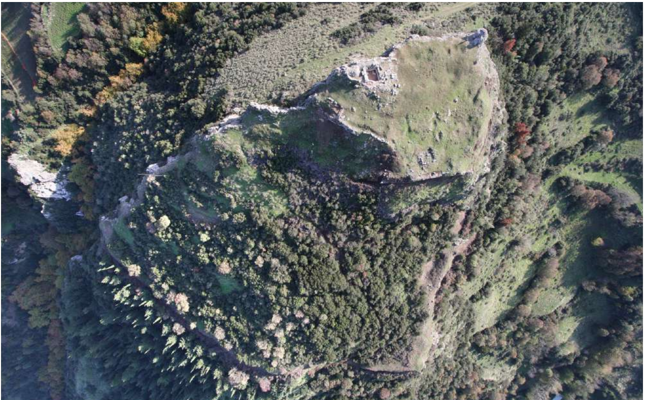
17. Το κάστρο της Υπάτης, κατοικία μαγισσών.

Ο Ηλιόδωρος στο Β' βιβλίο των Αιθιοπικών του, αναφέρεται με κολακευτικά λόγια για την πρωτεύουσα των Αιγυπτίων, την Υπάτη και τους κατοίκους της: «Οι Αιγύπτιοι είναι ένας λαός της Θεσσαλίας, ο πιο αριστοκρατικός από όλους και αδιαμφισβήτητος ελληνικός, αφού κατάγονται από τον Έλληνα, τον γιο του Δευκαλίωνα. Κατοικούν κατά μήκος του Μαλιακού κόλπου και καμαρώνουν για την πρωτεύουσα τους, την Υπάτη, που, όπως λένε οι ίδιοι, ονομάστηκε έτσι επειδή υπατεύει (δεσπόζει) και ξεχωρίζει από τις άλλες, ενώ κατ' άλλους η ονομασία της οφείλεται στο ότι είναι κτισμένη υπό την Οίτην, δηλαδή στους πρόποδες της». Περισσότερο διαφωτιστική είναι η πληροφορία που μας μεταφέρει ο Ηλιόδωρος στο Δ' βιβλίο των Αιθιοπικών του, όταν αναφέρεται στο κακό μάτι του Θεαγένη, του Θεσσαλού ευγενή που μάτιασε την πανέμορφη βασίλοπούλα των Αιθίοπων, τη Χαρίκλεια. Λέει ο πατέρας της: «Έχε θάρρος,