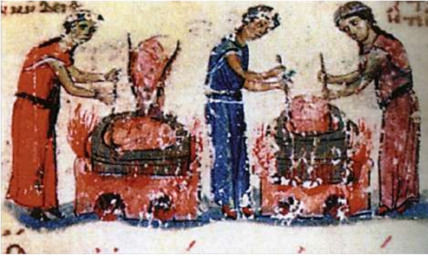
7. Η φαρμακίς Μήδεια. Μικρογραφία χφ Ψευδο-Οππιανού Κυνηγετικά, Marcianus gr. 479 (φ. 47r). Γύρω στο 1060, Βενετία.

επιτηδειότητάς τους να θεραπεύουν, απέκτησαν τόσο μεγάλη φήμη που τις θεωρούσαν υπερφυσικά πρόσωπα, ικανά να κάνουν ακόμη και θαύματα. Για τα μάγια τους χρησιμοποιούσαν, κυρίως άριστης ποιότητας βότανα, φάρμακα, που μάζευαν στην Οίτη. Όπως καταγράφουν, μάλιστα, με σαφήνεια ο Θεόφραστος, ο Πλίνιος και ο Στράβων οι μάγισσες - φαρμακίδες χρησιμοποιούσαν για την θεραπεία των ασθενών το τοξικό φυτό «ελλέβορος» (εικ. 6), γνωστό στον Ιπποκράτη, το οποίο φυτρώνει στους πρόποδες του Παρνασσού και της Οίτης και λειτουργεί ως φυσικό καταπραϋντικό, όπως η βαλεριάνα και η μπελαντόνα, ή σύμφωνα με τον μύθο ως φάρμακο για τη θεραπεία της τρέλας, της παραφροσύνης, της επιληψίας και γενικότερα όλων των ψυχικών ασθενειών. Εκτός από την θεραπευτική τους ικανότητα τα βότανα της Θεσσαλίας ήταν ξακουστά και για τις θαυματουργικές τους ιδιότητες, που επέτρεπαν στις μάγισσες να