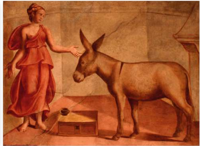
10. Ο Λουκιανός εξιστορεί επίσης την περιπέτεια του νεαρού Λούκιου, τον οποίο μια όμορφη Θεσσαλή μάγισσα μεταμόρφωσε σε γάιδaro.

ανάγκαζαν τους ανθρώπους να αναζητούν συμβουλή και βοήθεια μέσα από κάποια πίστη, εξαπατούσαν τους αφελείς και τους παρουσίαζαν την ψευδαίσθηση ως αλήθεια. Οι απαντήσεις των γοήτων στα προβλήματα των πελατών τους ήταν πάντοτε εσκεμμένα ασαφείς και αμφίσημες. Με τον τρόπο αυτό κερδοσκοπούσαν σε βάρος τους και πλούτιζαν.