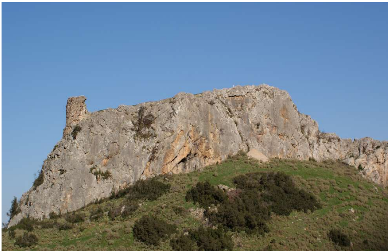
18. Το κάστρο της Υπάτης.

κόρη μου! Η αρρώστια σου δεν είναι βαριά και εύκολα μπορεί να θεραπευτεί. Σε έπιασε το κακό το μάτι, πιθανότατα την ώρα της πομπής, και πιο συγκεκριμένα την ώρα που απένεμες το έπαθλο. Και υποπτεύομαι ποιος ήταν αυτός που σε μάτιασε: ο Θεαγένης, ο οπλιτοδρόμος. Τον είδα εγώ πώς σε κοιτούσε διαρκώς και σου έριχνε επίμονες ματιές». «Κι αν με κοιτούσε έτσι κι αν δεν με κοιτούσε, λίγο με ενδιαφέρει. Όμως ποιοι είναι οι γονείς του και από πού κατάγεται; Παρατήρησα ότι σε πολλούς έκανε μεγάλη εντύπωση». «Θεσσαλός είναι, όπως θα το άκουσες και εσύ την ώρα που τον ανήγγειλε ο κήρυκας. Όσο για την καταγωγή του, ο ίδιος την ανάγει στον Αχιλλέα, και νομίζω πως λέει την αλήθεια, αν κρίνω από το παράστημα και την ομορφιά του, που μαρτυρούν πως είναι από του Αχιλλέα την γενιά, χωρίς ωστόσο να έχει την έπαρση και την αγριάδα του προγόνου του, αλλά η μεγαλοφροσύνη του μετριάζεται από την γλυκύτητά του. Όμως, παρόλα του τα χαρίσματα, μακάρι να πάθει κακό χειρότερο από αυτό το οποίο προκάλεσε με το βάσκανο βλέμμα του που σε μάτιασε» (εικ. 16).