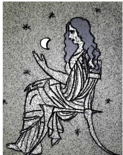
3. Η αστρονόμος Αγλαονίκη κατέβαζε, κατά την παράδοση, από τον ουρανό ακόμη και την Σελήνη.