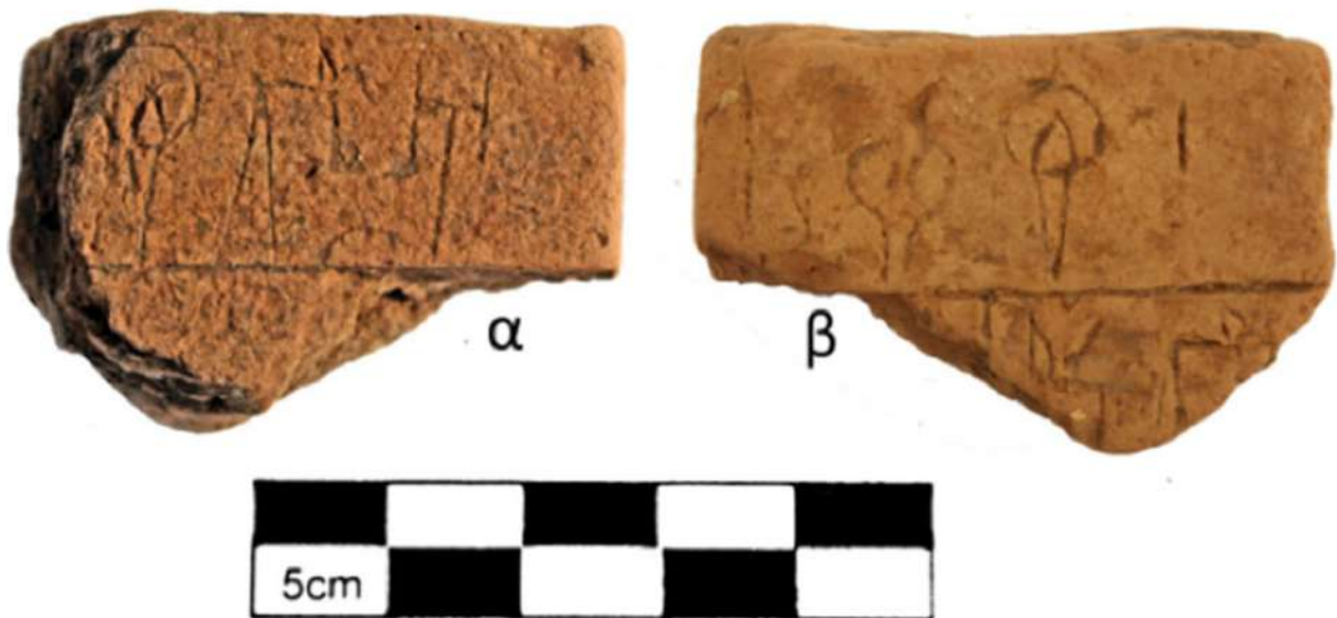
10. Η πινακίδα Γραμμικής Γραφής Β από την Ίκλαινα.