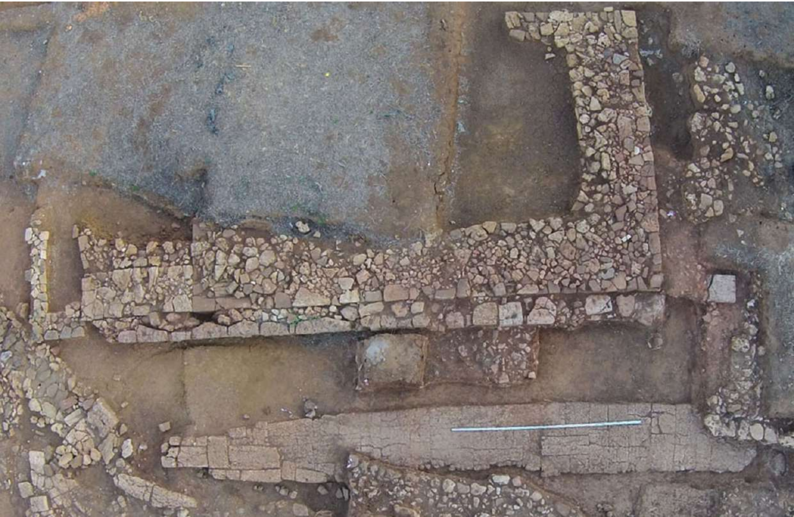
6. Ίκλαινα. Αεροφωτογραφία Κτηρίου X και πλακόστρωτου δρόμου.

πολεοδομικού ιστού και του αρχιτεκτονικού χαρακτήρα της πόλης: το ΣΚΑ γκρεμίσθηκε, τα ερείπιά του καταχώθηκαν, και η τοποθεσία του εγκαταλείφθηκε για πάντα. Τα κτίσματα της περιόδου αυτής (με ερυθρό χρώμα στην εικ. 7) κτίσθηκαν λίγο μακρύτερα και με διαφορετικό προσανατολισμό από εκείνα της προηγούμενης φάσης (με κυανό χρώμα στην εικ. 7), ίσως σε μία προσπάθεια του νέου ηγεμόνα να εξαλείψει τα μνημεία που συνδέονταν με τον προκάτοχό του.