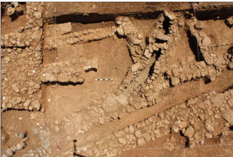
9. Ίκλαινα. Αεροφωτογραφία των υπονόμων.

Ένα άλλο σημαντικό στοιχείο που τα κεντρικά αρχεία αναφέρουν για την Ίκλαινα/a-ru 2 είναι ότι αποτελούσε σημαντικό μεταλλουργικό κέντρο. Την οικονομική ανάπτυξη της θέσης φανερώνει και μεγάλο κτηριακό συγκρότημα με πολυάριθμους αποθηκευτικούς χώρους, καθώς και εργαστηριακές εγκαταστάσεις (εικ. 8) που εξυπηρετούνταν από πολύπλοκο δίκτυο κτιστών υπονόμων (εικ. 9). Η