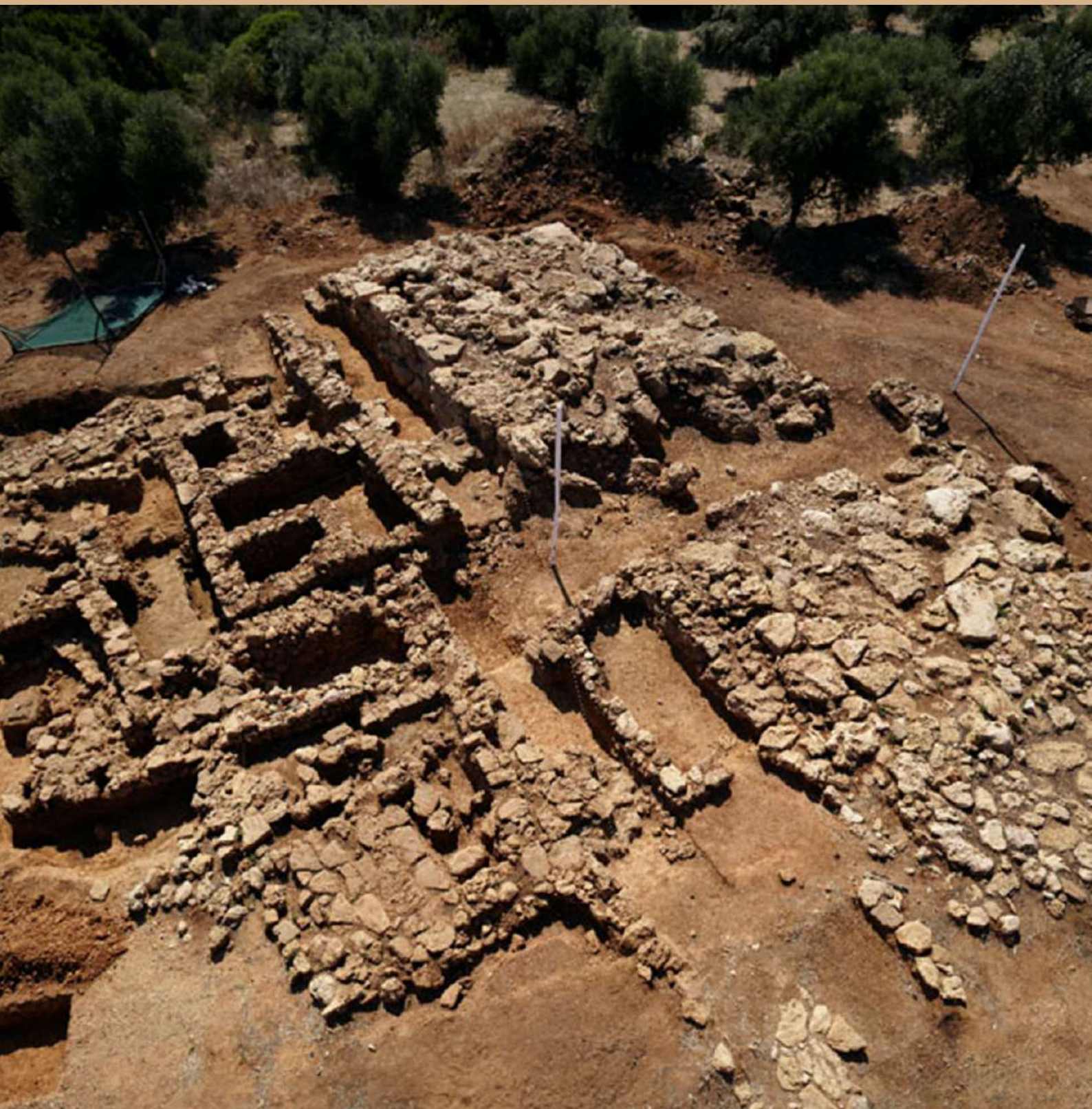
3. Ίκλαινα. Το Συγκρότημα του Κυκλώπειου Ανθήρου από τα ανατολικά.