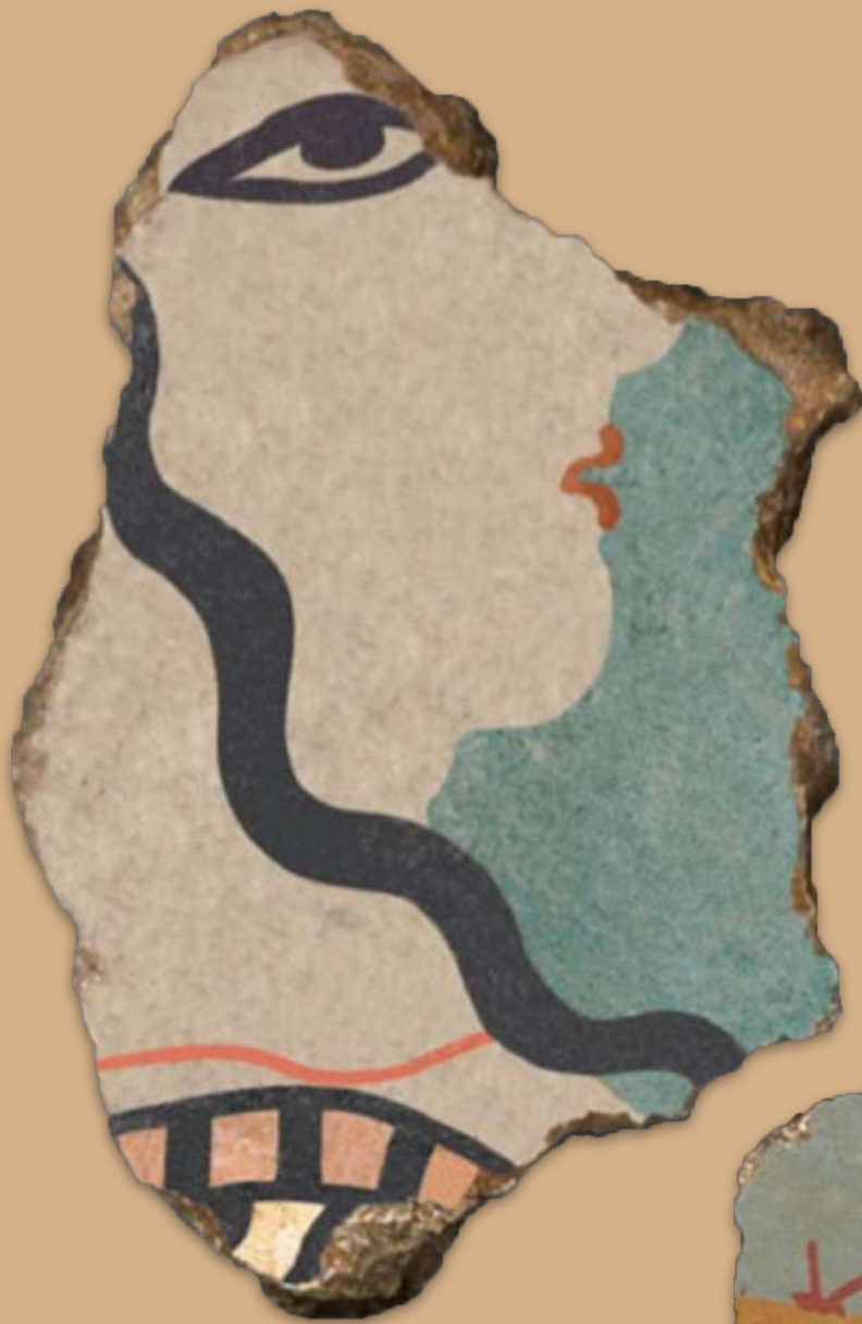
5α. Ίκλαινα. Σπάραγμα τοιχογραφίας από το Συγκρότημα του Κυκλώπειου Ανδρήρου: γυναικεία μορφή, η οποία ήταν μέρος πομπής. Αποκατάσταση Γ. Τσαίρης.