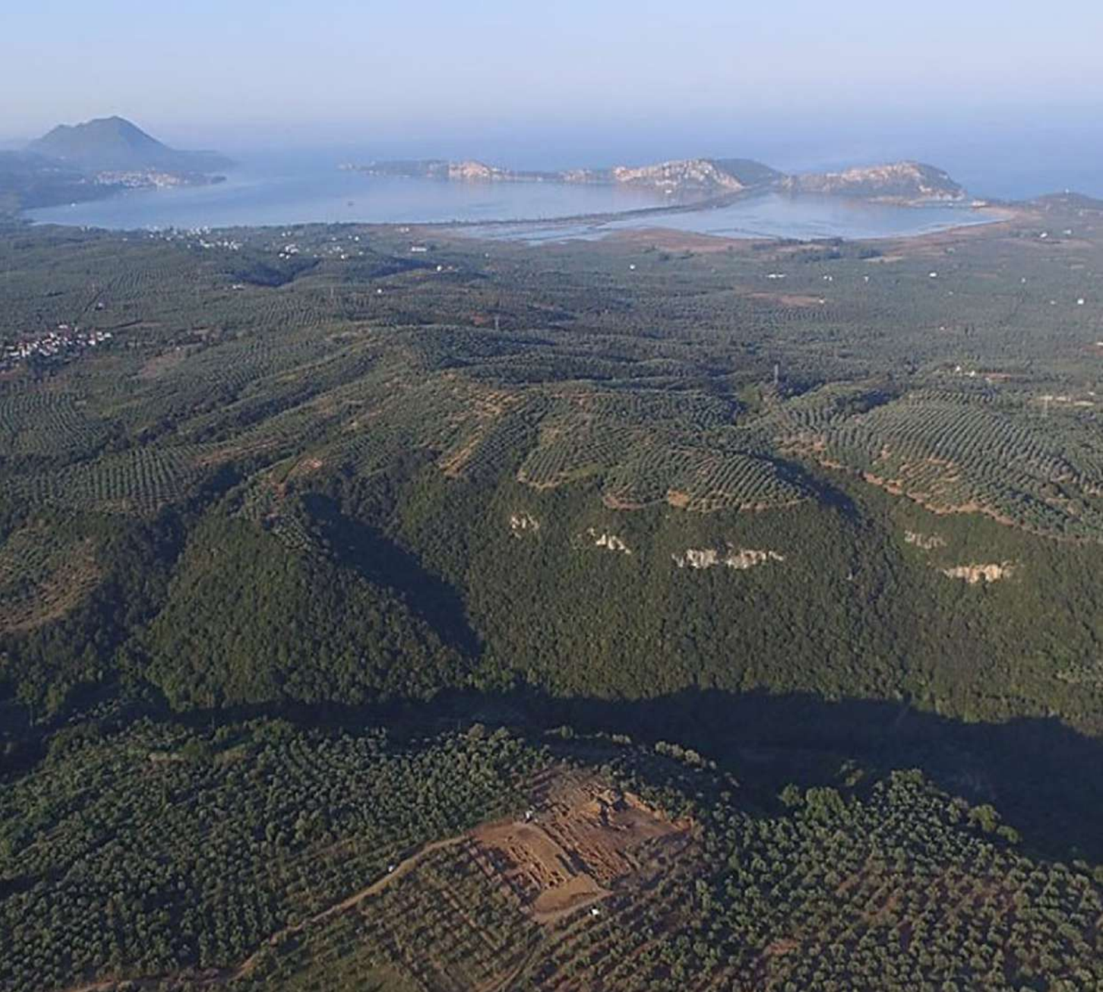
1. Ίκλαινα. Αεροφωτογραφία της ανασκαφής από τα βορειοανατολικά. Στο βάθος φαίνεται ο κόλπος του Ναβαρίνου.

Π αρόλο που η διοικητική οργάνωση των μυκηναϊκών κρατών είναι σε γενικές γραμμές γνωστή, οι διεργασίες που οδήγησαν στη γένεσή τους παραμένουν άγνωστες. Η επικρατούσα θεωρία είναι ότι τα μυκηναϊκά κράτη δημιουργήθηκαν στις αρχές της Ύστερης Εποχής του Χαλκού, όταν ισχυροί τοπικοί ηγεμόνες επέκτειναν τις επικράτειές τους απορροφώντας τα εδάφη γειτονικών ηγεμονιών. Η διαδικασία αυτή οδήγησε στη δημιουργία σύνθετων πολιτικών και κοινωνικών δομών, που με τη σειρά τους επέτρεψαν τη γένεση των πρώτων κρατών. 1