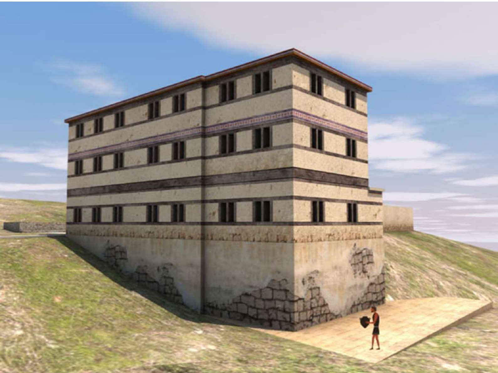
4. Ίκλαινα. Τρισδιάστατη αναπαράσταση του Συγκροτήματος του Κυκλώπειου Ανδήρου.

να γνωρίζουμε ότι, από το 1550 μέχρι το 1300/1250 π.Χ. περίπου, η Ίκλαινα σταδιακά εξελίχθηκε από πρωτεύουσα ηγεμονίας σε πρωτεύουσα κρατιδίου. Οι νέες ανασκαφές έχουν φέρει στο φως δύο μνημειώδη κτήρια που συνδέονται με πλακόστρωτους δρόμους. Το πρώτο είναι μεγαλοπρεπές διώροφο ή τριώροφο κτηριακό συγκρότημα με τρεις πτέρυγες κτισμένες γύρω από αυλή, η μία εκ των οποίων είναι κτισμένη επί ανδρήρου κυκλώπειας κατασκευής. Το συγκρότημα αυτό, το οποίο ονομάσαμε «Συγκρότημα του Κυκλώπειου Ανδήρου» (στο εξής ΣΚΑ, εικ. 3-4), χρονολογείται γύρω στα τέλη της Υστεροελλαδικής IIIA2 ή την αρχή της Υστεροελλαδικής IIIB και διαδέχθηκε προγενέστερο (της Υστεροελλαδικής IIB) κτήριο μεγάλων διαστάσεων. Οι εξωτερικοί τοίχοι του ΣΚΑ ήταν επιμελώς κατασκευασμένοι με