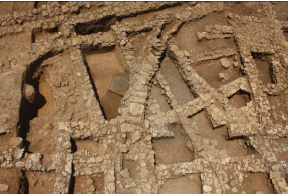
8. Ίκλαινα. Αεροφωτογραφία των εργαστηρίων.