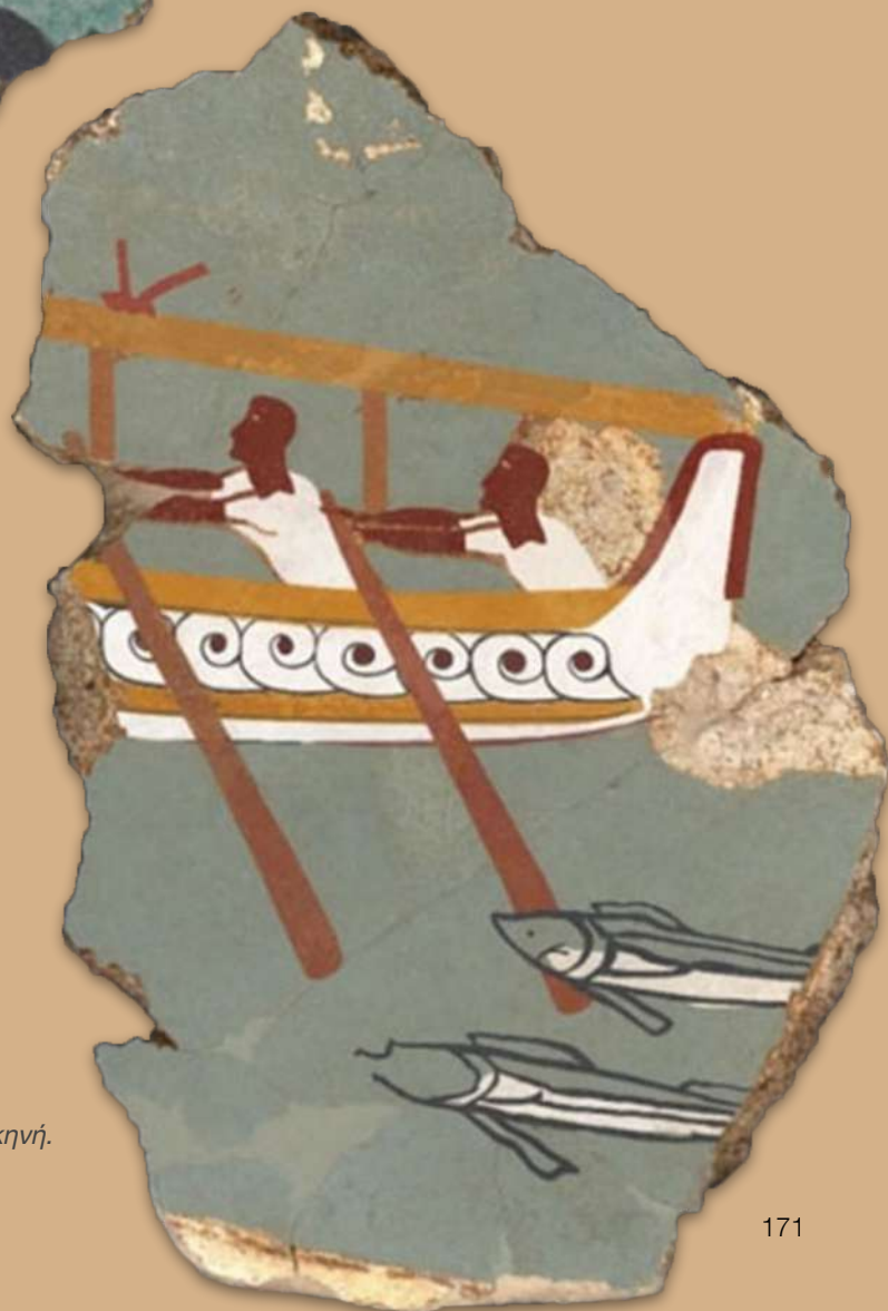
5β. Ίκλαινα. Σπάραγμα τοιχογραφίας από το Συγκρότημα του Κυκλώπειου Ανδρήρου: ναυτική σκηνή. Αποκατάσταση Γ. Τσαίρης.