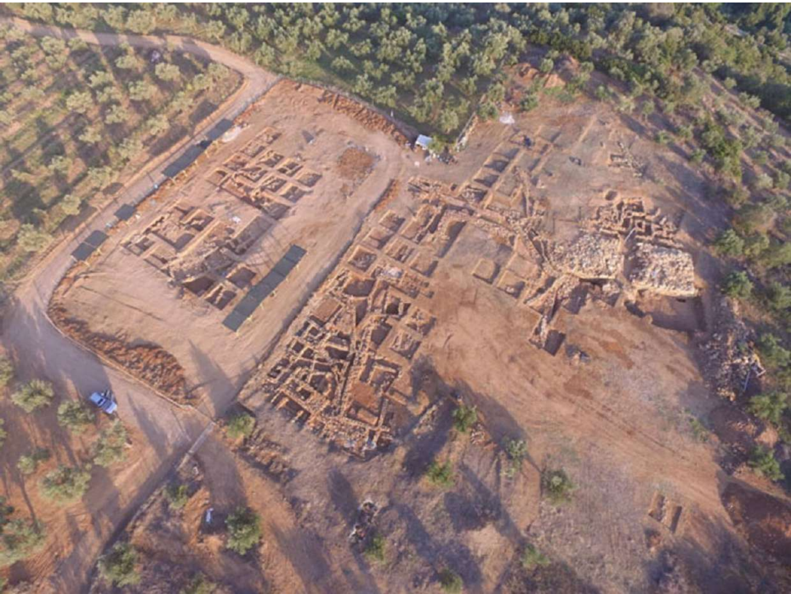
2. Ίκλαινα. Αεροφωτογραφία της ανασκαφής από τα βόρεια.

θα μπορούσαν να διαφωτίσουν τους μηχανισμούς γένεσης των κρατών αυτών. Το κενό αυτό στη γνώση μας έρχεται να καλύψει η ανασκαφή της εν Αθήναις Αρχαιολογικής Εταιρείας στην Ίκλαινα Μεσσηνίας (εικ. 1).