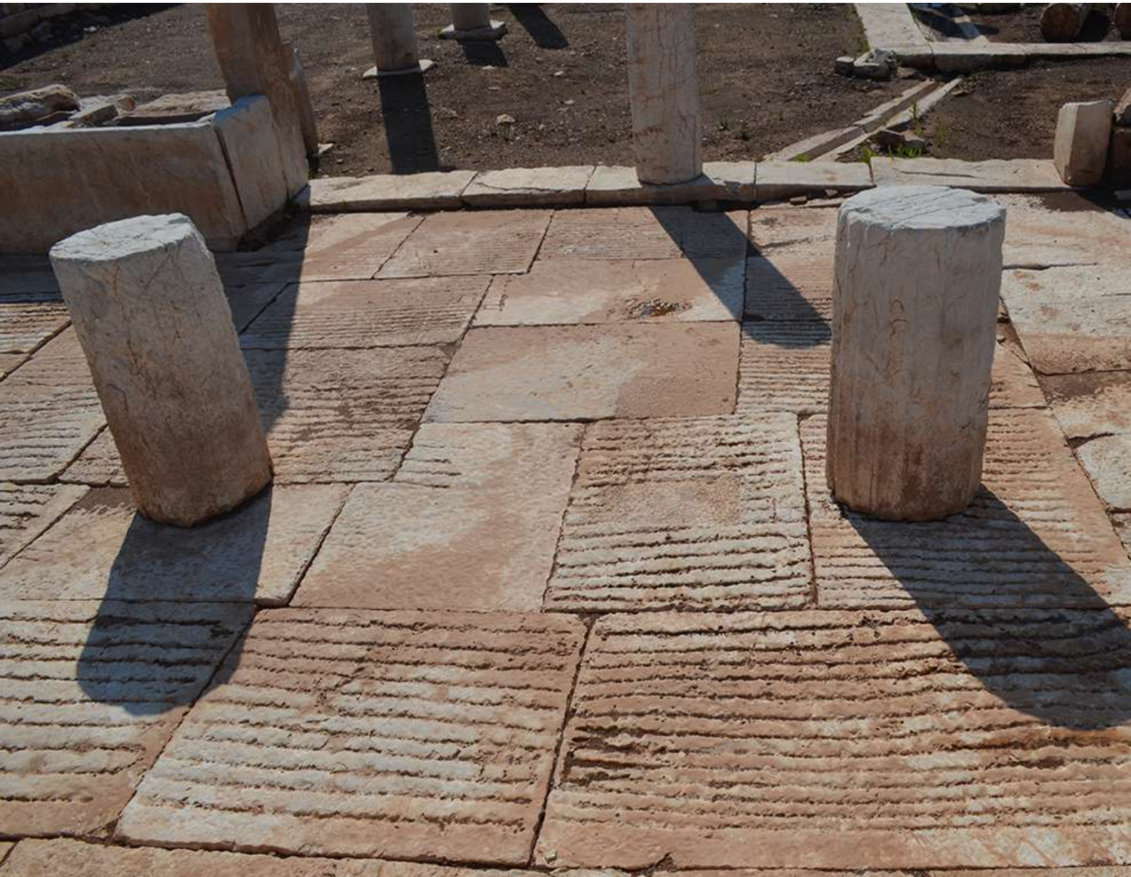
5. Αίθουσα λουτρού. Το πλακόστρωτο δάπεδο με τις πυκνές αντιολισθητικές αυλακώσεις.

προς τον αγωγό απορροής των υδάτων, ο οποίος περνά κάτω από το κατώφλι της ανατολικής εισόδου και καταλήγει στην αύλακα των όμβριων του περιστυλίου της Παλαίστρας (εικ. 5). Τόσο οι πλάκες του δαπέδου της αίθουσας όσο και οι ορθοστάτες των λουτήρων φέρουν τεκτονικά σημεία με γράμματα της αλφαβήτου, που δηλώνουν γενικευμένη ανακατασκευή της αίθουσας ύστερα από καταστροφή, πιθανότατα από τον σεισμό του έτους 3-4 μ.Χ. της εποχής του Αύγουστου. Τότε τοποθετήθηκαν και οι τέσσερις δωρικοί κίονες ως υποστηρίγματα της στέγης. Στην πρώτη οικοδομική φάση, τη στέγη του λουτρού στήριζαν τετράγωνοι πεσσοί, όπως δείχνουν ίχνη τους στο δάπεδο.