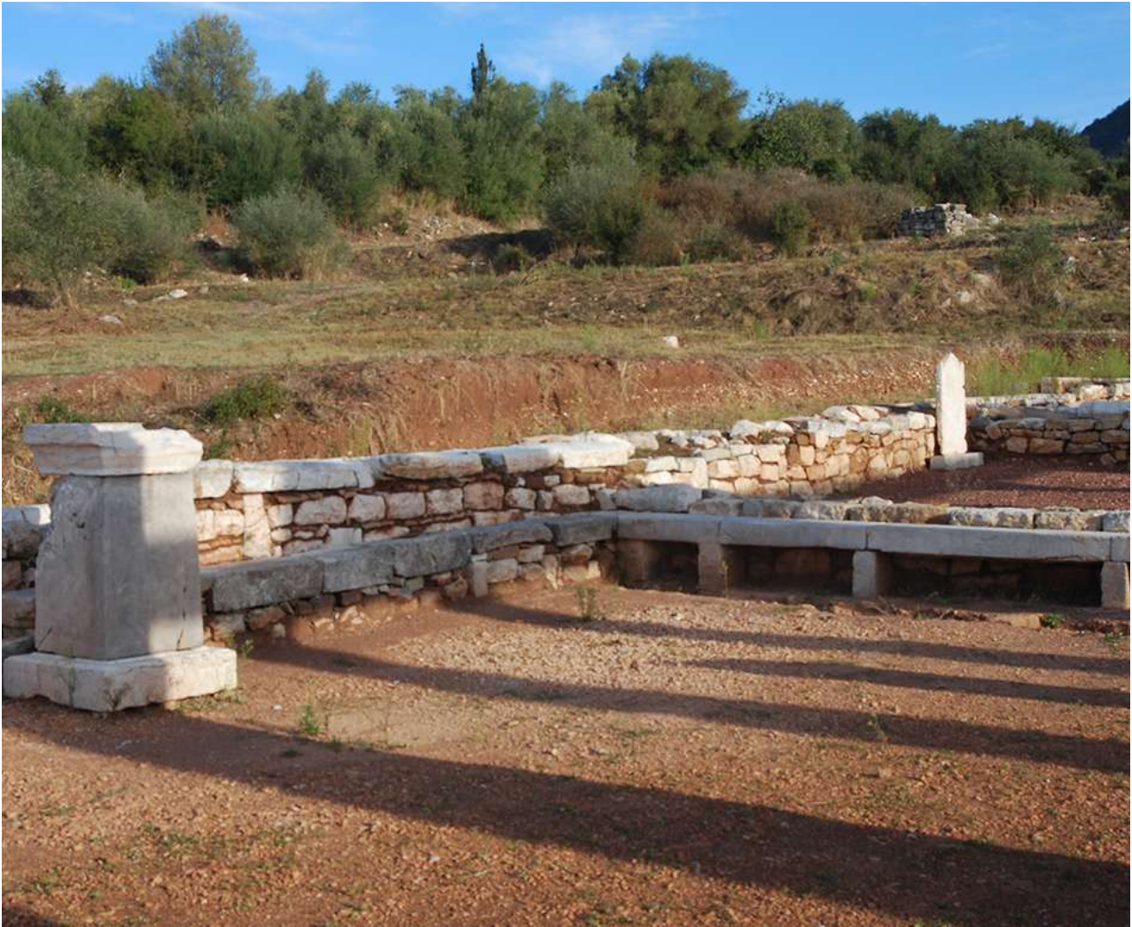
8. Η αίθουσα διδασκαλίας (ακροατήριον), με το λίθινο συνεχές έδρανο γύρω στους τοίχους (© φωτ.: Πέτρος Θέμελης).