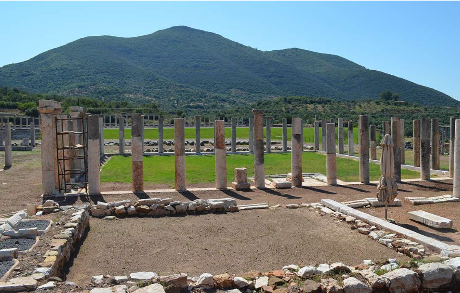
6. Αίθουσα που λειτουργούσε, πιθανότατα, ως αποδυτήριο και αλειπτήριο.