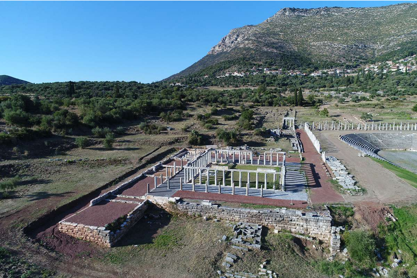
11. Στον χώρο, που εξέχει προς Ν. επάνω στο υπερυψωμένο πόδιο, βρισκόταν αίθουσα που λειτουργούσε, πιθανότατα, ως δειπνιστήριο ή χώρος διαμονής των εφήβων.

Δελφών, του Ισθμού, της Νεμέας και σε άλλους αγώνες ανά την Ελλάδα και τη Μικρά Ασία. Ο πλέον αξιοθαύμαστος Μεσσήνιος πολυνίκης παλαίστης και παγκρατιαστής, ο οποίος είχε ασκηθεί στην Παλαίστρα της γενέτειράς του, κατήγαγε τριάντα τέσσερις συνολικά νίκες σε δεκαπέντε αγώνες ανά την Ελλάδα ως παῖς, ἀγένειος (=έφηβος) και ἀνήρ. Ως ἀνήρ είχε τις μέγιστες επιδόσεις του με δώδεκα νίκες στην πάλη, δύο από τις οποίες στην Ολυμπία, και επτά νίκες στο παγκράτιο σε διάφορους πανελλήνιους αγώνες.