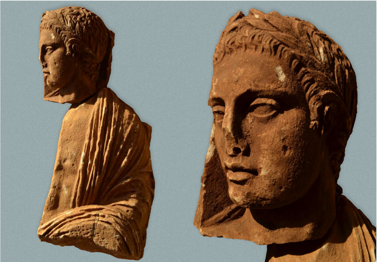
12. Επιτύμβιο ανάγλυφο, αποσπασματικά σωζόμενο, που χρονολογείται στον 4ο αι. π.Χ. και εικονίζει ιματιοφόρο νεαρό άνδρα (δεξιά λεπτομέρεια). Από τον χώρο νότια της Παλαίστρας.