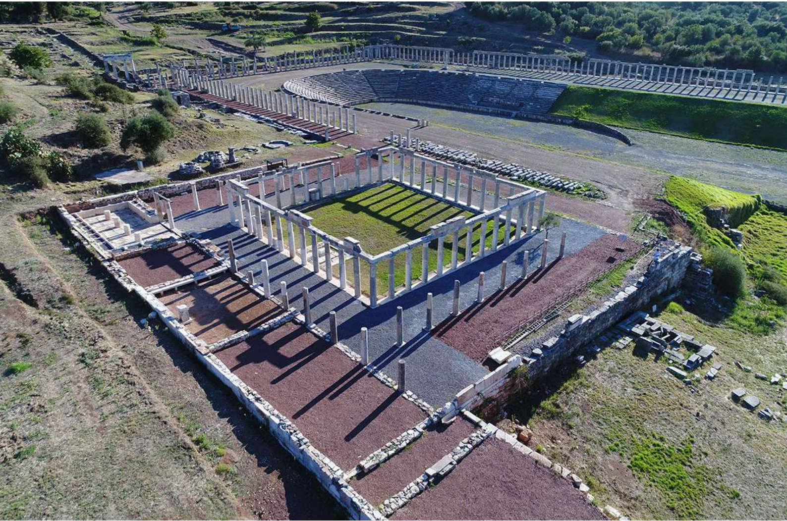
10. Η μεγάλη ορθογώνια αίθουσα, με τα μεγάλα ανοίγματα προς τη νότια στοά της Παλαίστρας, λειτουργούσε, πιθανώς, ως χώρος σφαιριστηρίου.

τοιχους (εικ. 11). Κατά μήκος της βόρειας πλευράς της υπάρχει αβαθές προστώο (2,10 X 8,70 μ.), προσιτό από δύο θύρες. Λειτουργούσε πιθανότατα ως δειπνιστήριο ή χώρος διαμονής των εφήβων.