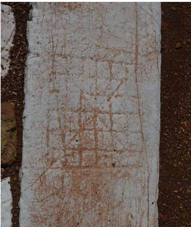
9. Παιχνίδι για πεσσούς, χαραγμένο στο λίθινο έδρανο της βόρειας πλευράς της αίθουσας διδασκαλίας.

διαλείμματα χάραζαν κατά κανόνα τα ονόματά τους πάνω στα βάθρα των αγαλμάτων (γκραφίτι) ή επιδίδονταν με ζήλο στο παιχνίδι της ντάμας ή της τρήλιζας.