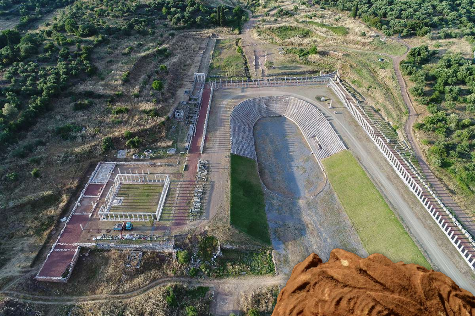
1. Η αρχιτεκτονική ενότητα Γυμνασίου, Σταδίου και Παλαίστρας της αρχαίας Μεσσήνης (© φωτ.: Πέτρος Θέμελης). Δεξιά: Λεπτομέρεια από το αποσπασματικά σωζόμενο επιτύμβιο ανάγλυφο της εικ. 12 (© φωτ.: Πέτρος Θέμελης).

Η λέξη Γυμνάσιον ήταν πιστεύω όρος δηλωτικός του συνόλου των χώρων φυσικής, στρατιωτικής και διανοητικής άσκησης και αγωγής παιδών, εφήβων αλλιώς αγένειων (από 17-20 ετών) και «νεωτέρων» (από 20-30 ετών), συμπεριελάμβανε δηλαδή ολόκληρη την αρχιτεκτονική ενότητα Γυμνασίου, Σταδίου και Παλαίστρας (εικ. 1).