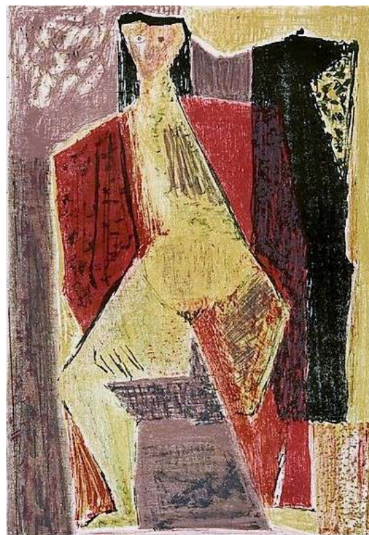
Στέλιου Λαπούρτα, «Γυμνό», έγχρωμη λιθογραφία (1958), Πινακοθήκη Ανωτάτης Σχολής Καλών Τεχνών.