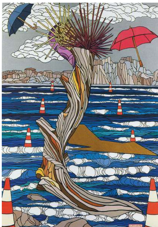
Γιώργου Ιωάννου, «Εκ των αποστάσεων», λάδι (1990).