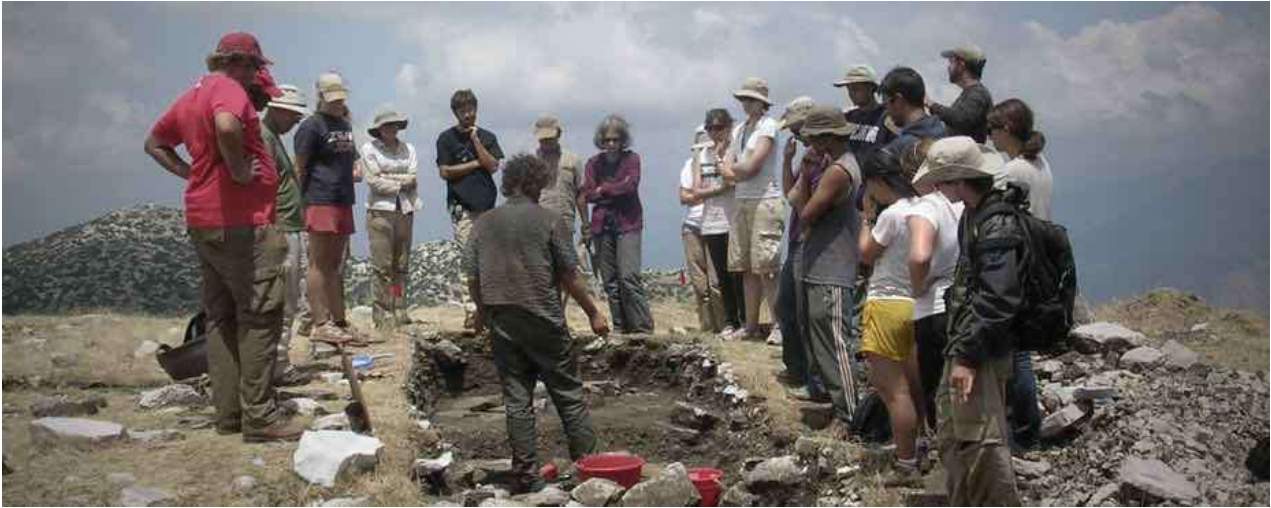
3. Η ομάδα ανασκαφής στο Λύκαιο Όρος (2016).