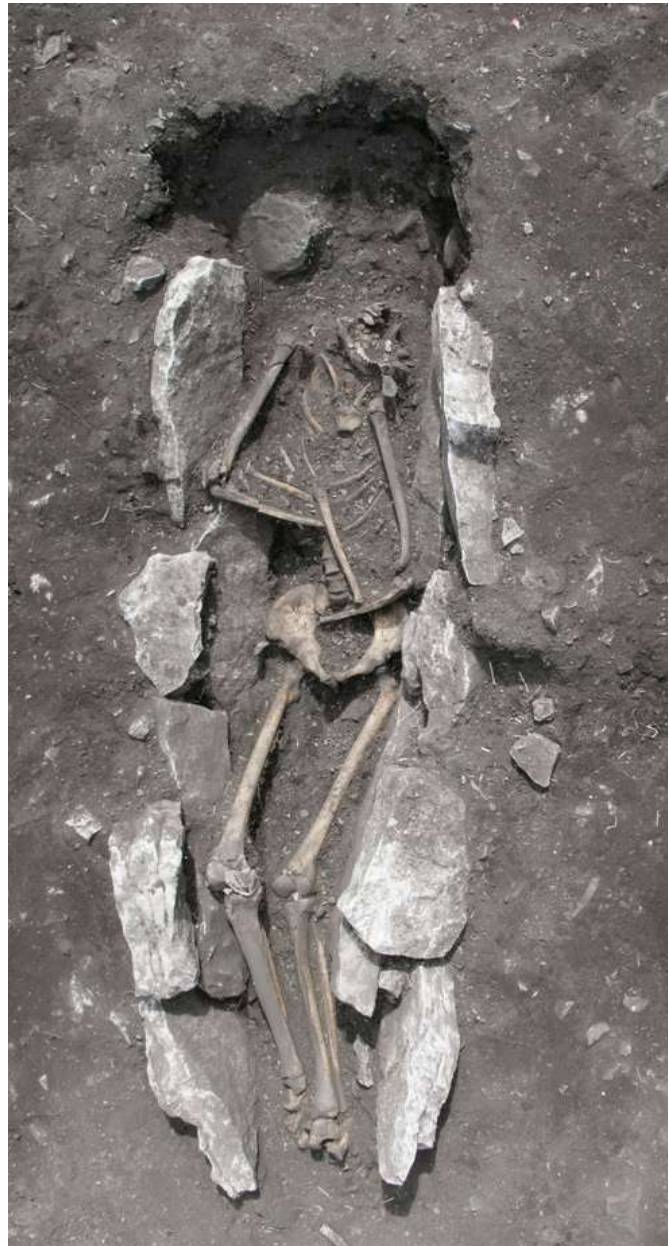
4. Ανθρώπινη ταφή στο μέσο του βωμού τέφρας: αριστερά, με τις καλυπτήριες πλάκες στην περιοχή της λεκάνης, και, δεξιά, μετά από την αφαίρεση των πλακών.