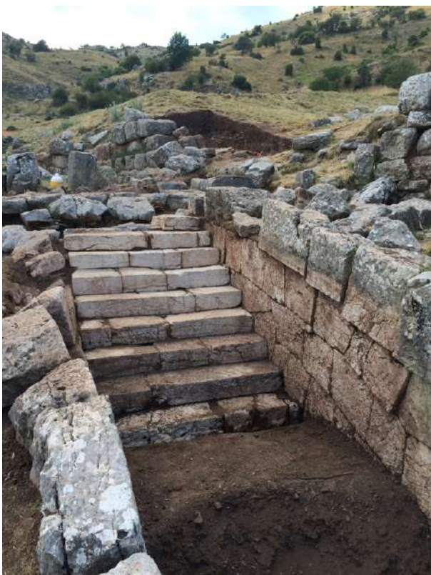
5. Άποψη του διαδρόμου με την κλίμακα.

χρονολογείται ως επί το πλείστον στο τέλος της Μυκηναϊκής εποχής, υποδεικνύοντας ότι η ταφή ανήκει πιθανότατα στον 11ο αι. π.Χ., δηλαδή την περίοδο που ακολούθησε την κατάρρευση των μυκηναϊκών ανακτορικών κέντρων, κατά τη μετάβαση από την Ύστερη Εποχή του Χαλκού στην Πρώιμη Εποχή του Σιδήρου, περίοδο κατά την οποία ο βωμός ήταν σε λειτουργία.