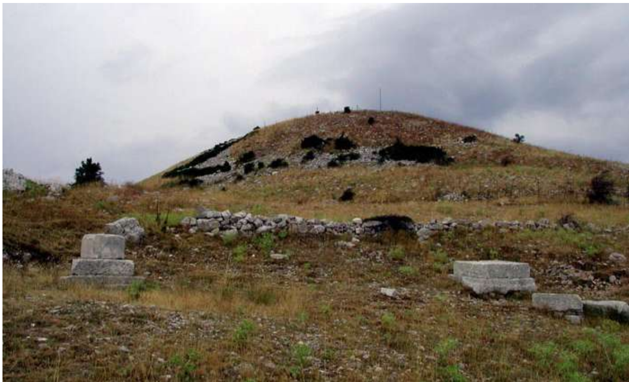
1. Το ύψωμα του Λυκαίου Όρους με τον βωμό τέφρας του Διός στην κορυφή του και τα λείψανα των δύο κίωνων.

Πλούταρχος, ο οποίος σχολιάζει ως ψέμα αυτή την δοξασία τής μη ύπαρξης σκιάς, αναφέρει ότι όσοι την πίστευαν εξηγούσαν το φαινόμενο επικαλούμενοι την άποψη των πυθαγορείων ότι, δηλαδή, η ψυχή δεν έχει σκιά: έτσι, μια και όποιος εισερχόταν στο άβατο αμέσως θανατωνόταν και καθώς το σώμα ήταν πλέον ξένο από τον άνθρωπο και παρούσα στο τέμενος μόνο η ψυχή του, δεν έριχνε σκιά.