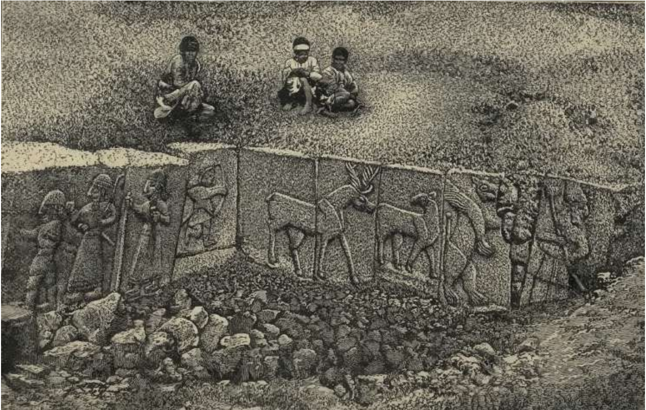
3. Χετταϊκά ανάγλυφα κοντά στο Αϊνταμπ/ Gaziantep (Sayce, 1890).

επαφή, κοντά στην Ηράκλεια-Eregli, με τον πολιτισμό των Χετταίων. Περιέγραψε τις παράξενες μορφές στο περιηγητικό βιβλίο που συνέγραψε, αλλά φυσικά δεν γνώριζε ότι είχε αντικρύσει απεικονίσεις του Χετταίου βασιλιά Varpalavas και του Taru, θεού της φύσης και της καταιγίδας.