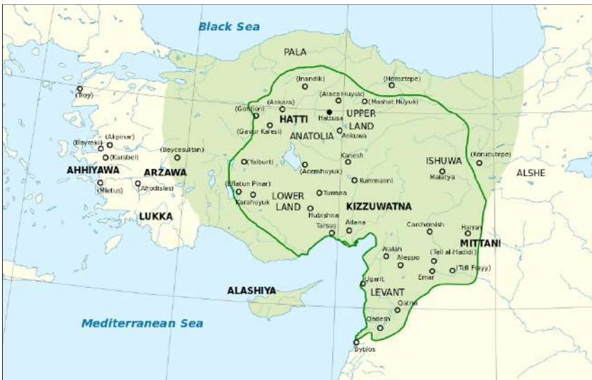
6. Χάρτης όπου σημειώνονται οι σημαντικότερες θέσεις του κράτους των Χετταίων.

Γράφει, λοιπόν, τα εξής χαρακτηριστικά για το Bogazkoy: