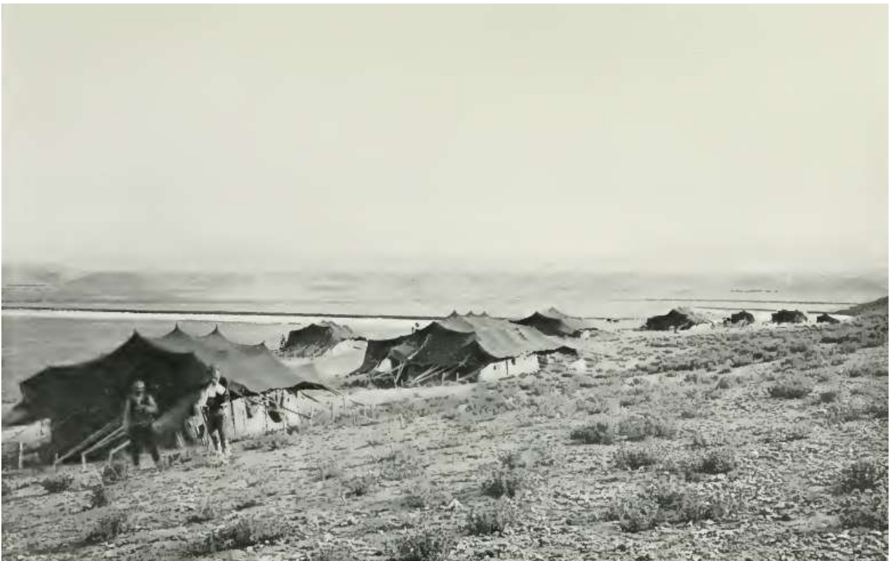
2. Τυπική εικόνα στο εσωτερικό της Μικράς Ασίας στις αρχές του 20ου αιώνα (J. Garstang, 1910, plate xii).

Εάν εξαιρέσουμε το αναφερόμενο στον Ηρόδοτο χετταϊκό ανάγλυφο στο Καραμπέλ (Karabel), ανατολικά της Σμύρνης, το οποίο όμως είχε ταυτιστεί με τον Αιγύπτιο Φαραώ Σέσωστρις, η ανακάλυψη του πολιτισμού των Χετταίων έγινε από τον Γάλλο Jean Otter στις 17 Ιανουαρίου 1737, κατά τις έρευνές του στις βόρειες πλαγιές του όρους Ταύρου. Όμως αυτός ο περιηγητής, όπως άλλωστε συνέβη και με τους επόμενους σε διάρκεια 140 ετών, δεν κατόρθωσε να ταυτίσει το ανάγλυφο, που ανακάλυψε χαραγμένο σε βράχο, με τους άγνωστους έως τότε Χετταίους. Ο Otter ξεκίνησε από το Παρίσι, στις 27 Ιανουαρίου 1734, με την απαραίτητη οικονομική βοήθεια που του πρόσφερε ο κόμης Maurepas, και έφθασε στη Μικρά Ασία την ταραγμένη περίοδο μετά τις εξεγέρσεις του 1730, όταν ειδικά η περιοχή της κεντρικής Μικράς Ασίας δεν φημιζόταν ότι παρείχε ασφάλεια, πόσο μάλλον σε έναν πλούσιο Ευρωπαίο περιηγητή. Εντούτοις ο Otter συνέχισε την περιήγησή του και έμεινε στην ιστορία ως ο πρώτος σύγχρονος περιηγητής που ήρθε σε