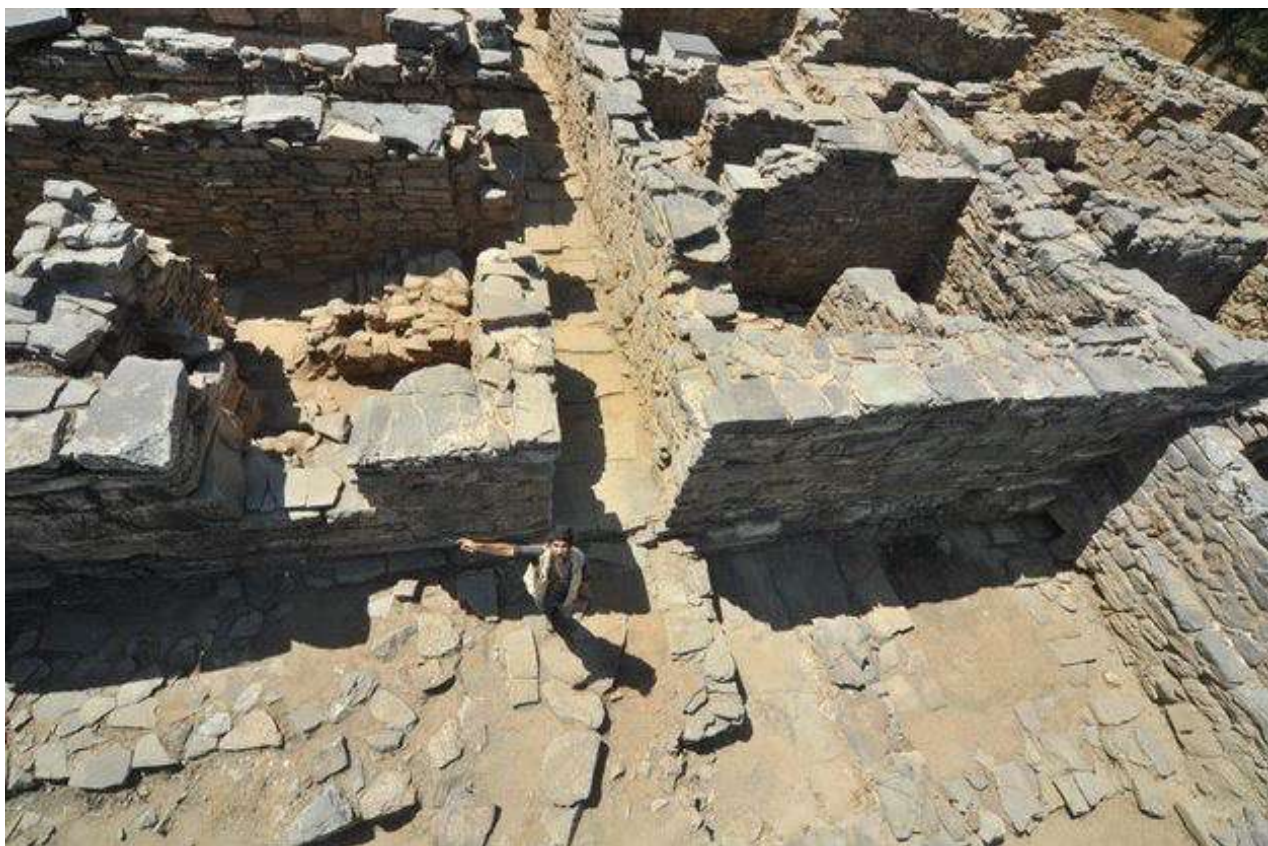
Αποψη του μινωικού ανακτόρου της Ζωμίνθου.

Σε πολυτελή χώρο, που βρίσκεται πάνω από το μεταλλουργικό εργαστήριο ήλθαν στο φως σφραγίδες –η μία από τις οποίες με παράσταση ιερού κόμβου είχε πέσει από τον άνω όροφο–, περίαπτα, όπως αυτό σε σχήμα αχιβάδας, ρυτό με διακόσ-