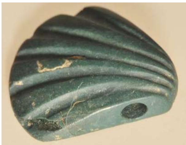
Μινωικό ανάκτορο Ζωμίνθου. Περίαπτο σε σχήμα αχιβάδας.

Σε πολυτελή χώρο, που βρίσκεται πάνω από το μεταλλουργικό εργαστήριο ήλθαν στο φως σφραγίδες –η μία από τις οποίες με παράσταση ιερού κόμβου είχε πέσει από τον άνω όροφο–, περίαπτα, όπως αυτό σε σχήμα αχιβάδας, ρυτό με διακόσ-