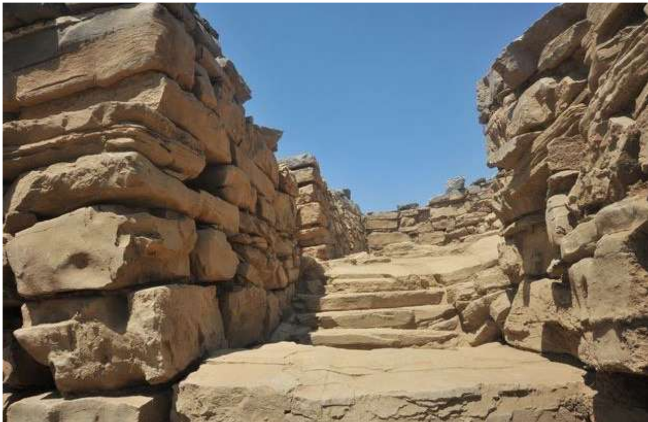
Μία από τις εισόδους στο μινωικό ανάκτορο της Ζωμίνθου (φωτ. ΥΠΠΟΑ).

δυστυχώς δεν σώζεται σε καλή κατάσταση, καθώς υπέστη πολλές μετασκευές στα μεταγενέστερα χρόνια (Μυκηναϊκά και Ρωμαϊκά) αλλά και μεγάλη καταστροφή λόγω των αρχαιοκαπηλικών δράσεων της δεκαετίας του '60. Φαίνεται ωστόσο, πως ήταν μεγαλοπρεπέστατη, οδηγώντας με κλίμακες, που ξεκινούσαν από το κατώτερο επίπεδο του λόφου, όπου είναι κτισμένο το ανάκτορο, στην Κεντρική αυλή του. Και οι δύο εισοδοί πάντως αποτελούν διαφορετικούς τύπους από αυτόν της κεντρικής βόρειας εισόδου, η οποία αρχιτεκτονικά είναι λιγότερο σύνθετη. Μία ακόμη εσωτερική σκάλα αποκαλύφθηκε κατά την ανασκαφή ενώ οι τοίχοι, μερικοί από τους οποίους σώζονται σε ύψος έως και τριών μέτρων αποδεικνύουν ότι το κτήριο ήταν πολυώροφο. Οι μεγάλες του αίθουσες στήριζαν τους επάνω ορόφους με κεντρικούς πεσσούς ή κίονες. Τα δάπεδα, που ήλθαν και φέτος στο φως, άλλα από λαμπερό ασβεστόλιθο και άλλα βοτσαλωτά υποδηλώνουν την πολυτέλεια που επικρατούσε στο εσωτερικό του, το ίδιο και τα τοιχογραφημένα κονιάματα που κοσμούσαν τα δωμάτια, δείγμα εκλέπτυνσης της εποχής και των κατοίκων του.