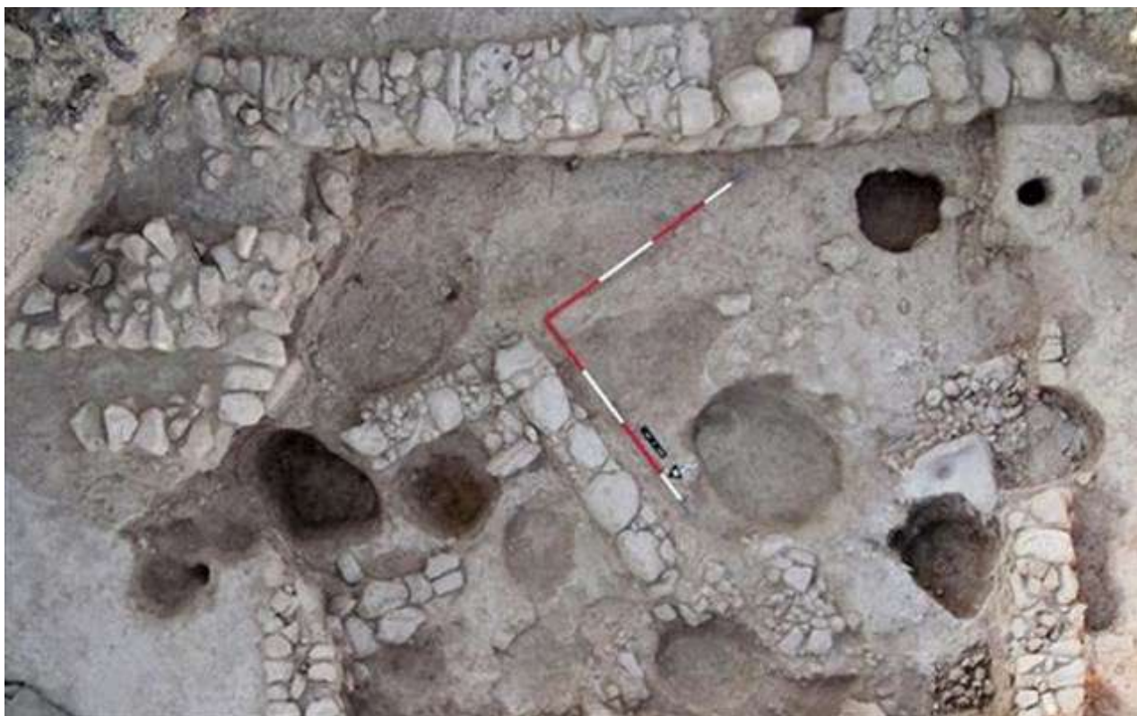
Αποψη της ανασκαφής στη θέση Κισσόνεργα-Σκαλιά Πάφου.