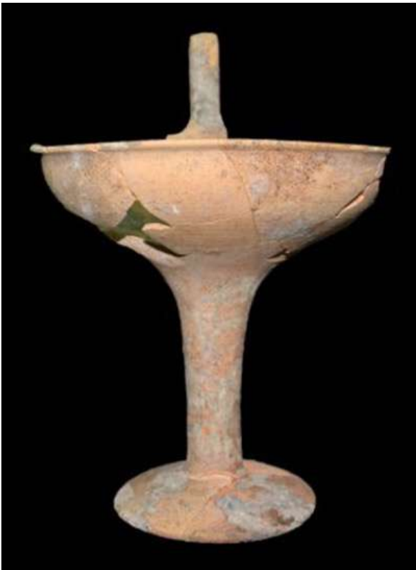
Θαλαμοειδής τάφος Προσηλίου. Μόνωπη επικασσιπερωμένη κύλικα.

χρόνους. Για παράδειγμα, η εναπόθεση πολλών κοσμημάτων σε ανδρική ταφή αμφισβητεί -όπως και στην περίπτωση του κατά έναν αιώνα παλαιότερου πολεμιστή από την Πύλο που βρέθηκε το 2015- τη μέχρι τώρα ευρέως διαδεδομένη πεποίθηση ότι τα κοσμήματα συνόδευαν κυρίως γυναίκες στην τελευταία τους κατοικία. Αξιοσημείωτο είναι, επίσης, το γεγονός πως –με εξαίρεση δύο μικρούς χλαρείς (ψευδόστομους αμφορείς– δεν βρέθηκε γραπτή μυκηναϊκή κεραμική στον τάφο, η οποία ήταν εξαιρετικά δημοφιλής κατά τη συγκεκριμένη περίοδο.