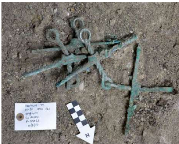
Θαλαμοειδής τάφος Προσηλίου. Ζεύγος στομίδων (εξαρτημάτων χαλινών αλόγων) in situ.

προσεκτικά επιλεγμένα αντικείμενα. Εντοπίστηκαν πάνω από δέκα επικασπιτερωμένα αγγεία, ζεύγος στομίδων (τμήματα από χαλινάρια αλόγων), εξαρτήματα τόξου, βέλη, περόνες, κοσμήματα από διάφορα υλικά, κτένια, ένας σφραγιδόλιθος και ένα σφραγιστικό δαχτυλίδι.