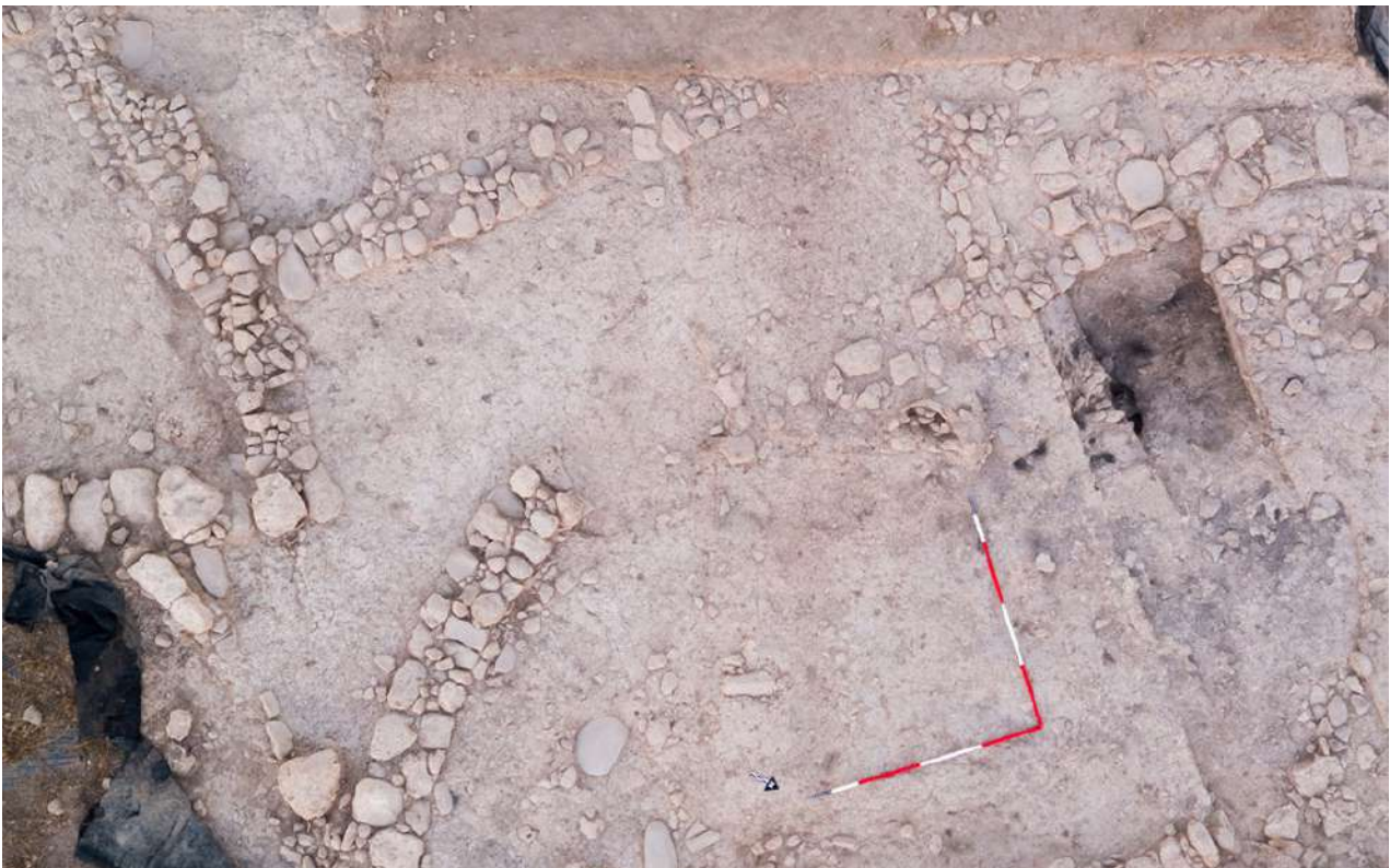
Άποψη της ανασκαφής στη θέση Κισσόνεργα-Σκαλιά Πάφου (φωτ. Τμήμα Αρχαιοτήτων Κύπρου).

Το σύμπλεγμα είχε κατασκευαστεί πιθανότατα από το σύνολο της κοινότητας, πάνω στα ερείπια κτισμάτων πρωιμότερης φάσης της Εποχής του Χαλκού. Στον ασυνήθιστα μεγάλο αυτό χώρο