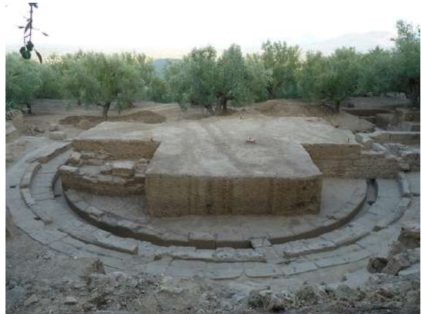
Το αρχαίο θέατρο της Θουρίας.

Σημαντικό μέρος του θεάτρου της αρχαίας Θουρίας, το οποίο είχε εντοπιστεί το περασμένο έτος, αποκαλύφθηκε κατά τη διάρκεια της ανασκαφικής έρευνας, η οποία διενεργήθηκε το 2017 στην Αρχαία Θουρία, υπό την αιγίδα της Εν Αθήναις Αρχαιολογικής Εταιρείας, με τη διεύθυνση της ε.τ. Εφόρου Αρχ/των Δρος Ξένης Αραπογιάννη. Η ανασκαφή στη θέση «Ελληνικά» της αρχαίας Θουρίας έφερε στο φως ολόκληρη την περίμετρο της ορχήστρας του αρχαίου θεάτρου, η διάμετρος της οποίας είναι 16,30μ. Επίσης αποκαλύφθηκε πλήρως ο αγωγός των ομβρίων που περιτρέχει την ορχήστρα καθώς και η πρώτη σειρά των εδωλίων τα οποία βρίσκονται αδιατάρακτα στη θέση τους.