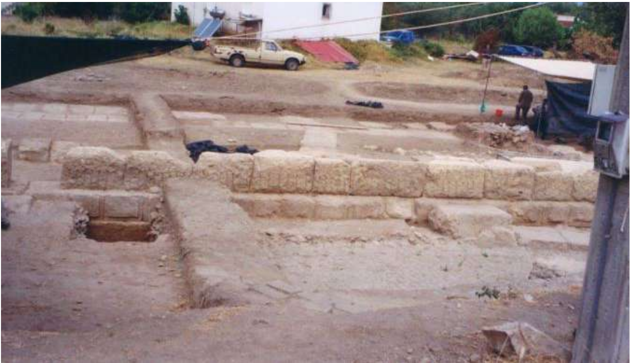
Λείψανα του ιερού της Αμαρυσίας Αρτέμιδος στην Αμάρυνθο.

Κατά τη φετινή ανασκαφική περίοδο ανακαλύφθηκαν κτήρια διαφόρων εποχών (από τον 6ο έως και τον 2ο αι. π.Χ.) και υπόγεια κρήνη που είχε κτιστεί με αρχιτεκτονικά μέλη και βάσεις από μνημεία σε δεύτερη χρήση. Από κάποιες ενεπίγραφες βάσεις και ενσφράγιστες κεραμίδες που φέρουν το όνομα «Αρτέμιδος», στάθηκε δυνατή η ταύτιση του ιερού της Αμαρυσίας Αρτέμιδος, καθώς οι επιγραφές αναφέρονται σε αναθέσεις στη θεά Αρτέμιδα, στον αδελφό της Απόλλωνα και στη μητέρα τους Λητώ. Σύμφωνα με τις αρχαίες γραπτές πηγές, το ιερό αυτό υπήρξε από τα σημαντικότερα της Εύβοιας. Η ύπαρξή του είναι γνωστή από το 10ο βιβλίο του Στράβωνα. Από τον 19ο αιώνα, οι αρχαιολόγοι προσπάθησαν να εντοπίσουν το συγκεκριμένο ιερό, αλλά αυτό δεν κατέστη δυνατό, παρά τις πολλές υποθέσεις, εξαιτίας της λανθασμένης ένδειξης της απόστασης στο κείμενο του Στράβωνα. Όπως ορθά απέδειξε ο καθ. Denis Knoerfler, ιστορικός και επιγραφικός στο Πανεπιστήμιο του Neuchâtel (Ελβετία) και στο Collège de France, το ιερό της Αμαρυσίας Αρτέμιδος δεν βρισκόταν σε απόσταση 7 σταδίων (δηλ. 1,5 χλμ.) από την πόλη της Ερέτριας, όπως αναφέρει ο Στράβων, αλλά 60 σταδίων (δηλ. 11 χλμ.).