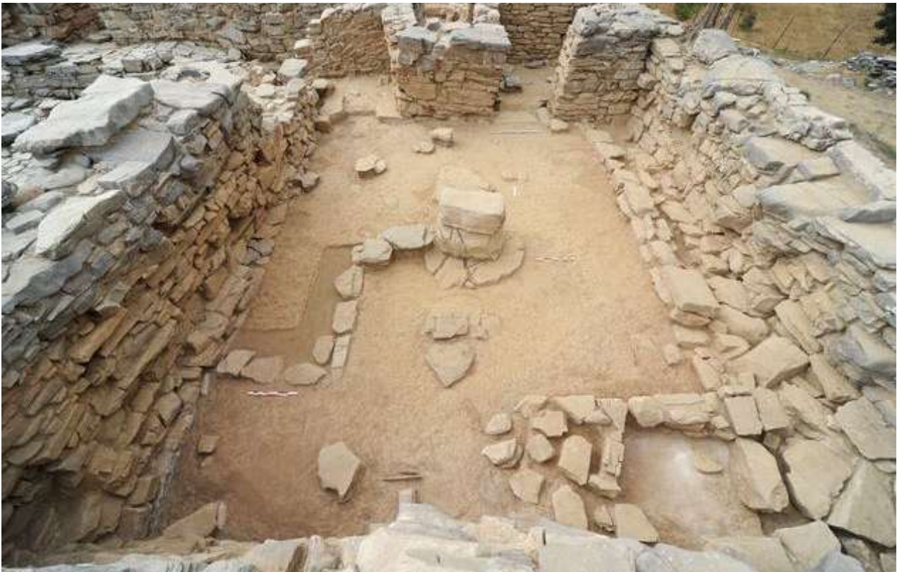
Άποψη δωματίου με πεσσό στο μινωικό ανάκτορο της Ζωμίνθου.

καθώς και λείψανα κυψελών. Τα τελευταία δείχνουν την ενασχόληση των κατοίκων και με τη μελισσοκομία, εκτός βέβαια από την εκμετάλλευση της πλούσιας πανίδας και χλωρίδας του Ψηλορείτη. Αποδεικνύεται έτσι το εύρος και ο χαρακτήρας των δραστηριοτήτων των ενοίκων του ανακτόρου πάνω στο βουνό, που ήταν βεβαίως οικονομικός, πολιτικός και θρησκευτικός. Η σύνδεσή του αφενός με την Κνωσό –η πρώτη εγκατάσταση στη Ζώμινθο