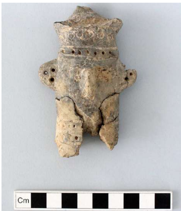
Κισσόνεργα-Σκαλιά: Τμήμα πήλινου ειδωλίου της Μέσης Εποχής του Χαλκού.

πιθανόν να γίνονταν συγκεντρώσεις ή κάποια άλλη άγνωστη δραστηριότητα.