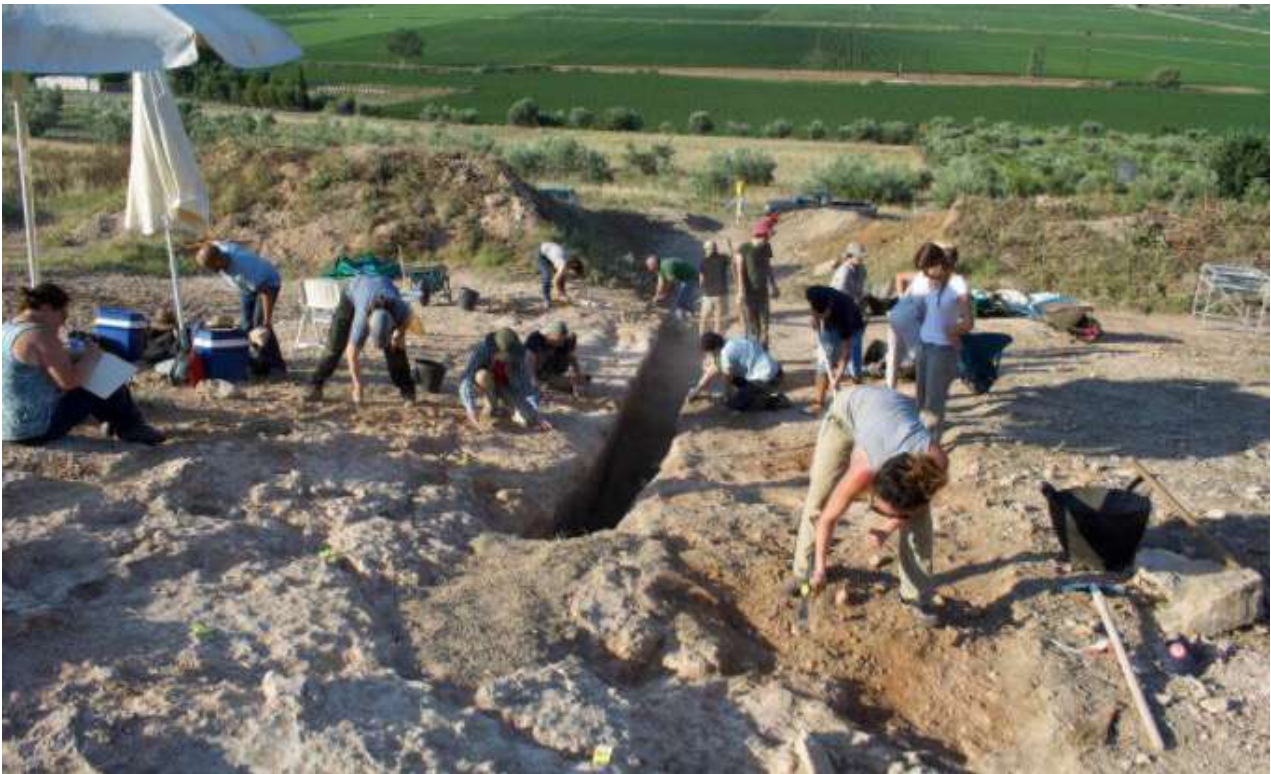
Θαλαμοειδής τάφος Προσηλίου. Η ανασκαφή του δρόμου που οδηγούσε στον τάφο σε εξέλιξη.

Η κατάρρευση της οροφής διατάραξε σε κάποιο βαθμό τη θέση του νεκρού και των αντικειμένων του, παράλληλα όμως κάλυψε και προστατέψε το ταφικό στρώμα από μεταγενέστερες επεμβάσεις. Στο δάπεδο του θαλάμου βρέθηκε ένας άνδρας, 40-50 χρονών, τον οποίο συνόδευαν