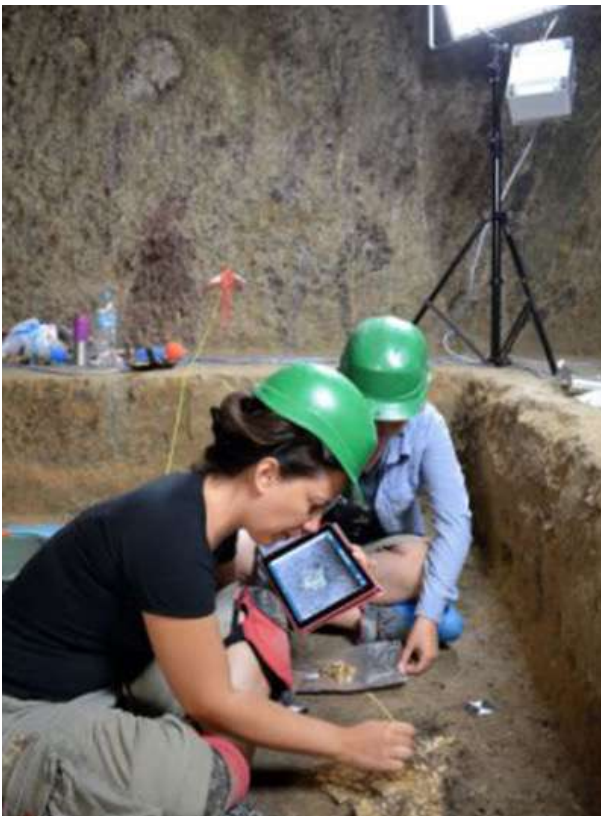
Θαλαμοειδής τάφος Προσηλίου (φωτ. Γιάννης Γαλανάκης).

τέσσερις πλευρές της αίθουσας περιτρέχει λαξευτό θρανίο (πεζούλι) καλυμμένο με πηλοκονίαμα. Το αρχικό ύψος της οροφής, η οποία είχε σχήμα διριχτής στέγης, υπολογίζεται στα 3,5 μ. Ωστόσο, η αρχική στέγη άρχισε να καταρρέει ήδη από την αρχαιότητα, ίσως μάλιστα ακόμη και στη μυκηναϊκή εποχή, δίνοντας στο εσωτερικό του θαλάμου σπηλαιώδη όψη, συνολικού ύψους 6,5 μ.