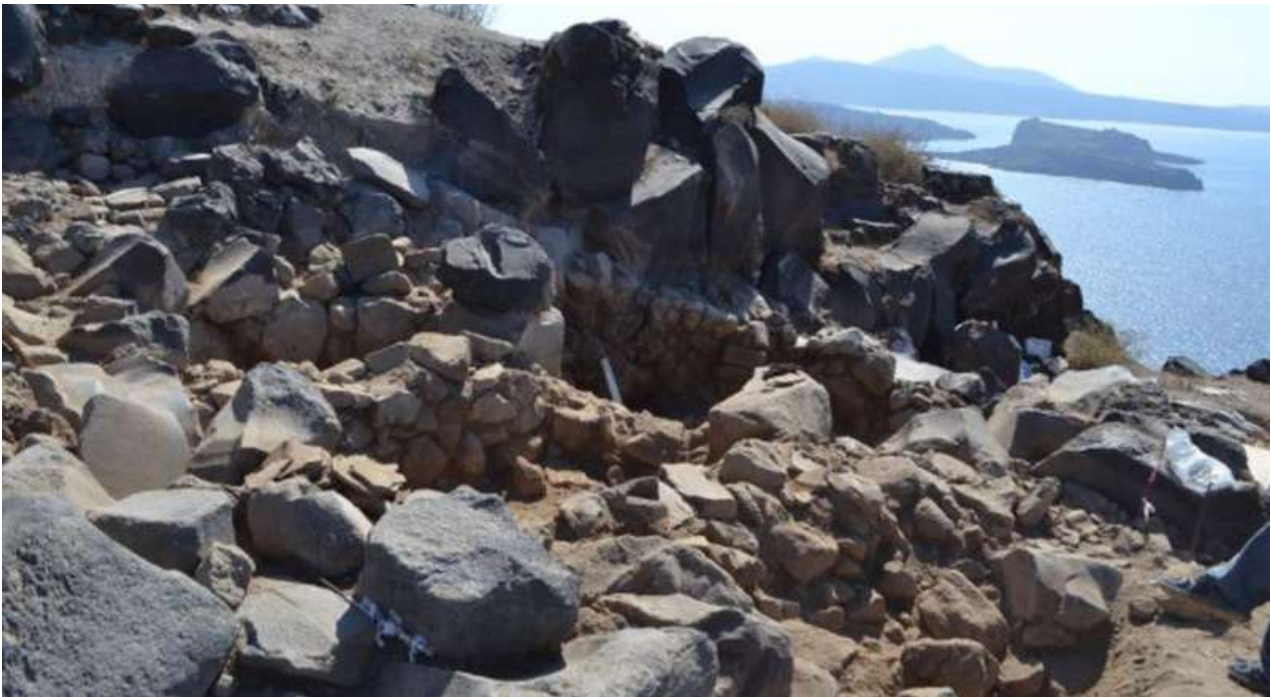
Ο προϊστορικός οικισμός στη θέση Κοίμηση στο νοτιοανατολικό άκρο της νήσου Θηρασίας (φωτ. ΥΠΠΟΑ).

Κατά τη φετινή ανασκαφική περίοδο ολοκληρώθηκε η αποκάλυψη ενός ελλειψοειδούς κτηρίου με