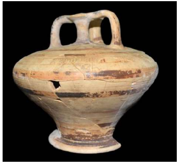
Θαλαμοειδής τάφος Προσηλίου. Χλαρείς (ψευδόστομος αμφορέας) με γραπτή διακόσμηση.

Η ανασκαφική ομάδα εικάζει πως ο τάφος σχετίζεται με το ανακτορικό κέντρο του μυκηναϊκού Ορχομενού, ο οποίος απέχει περίπου 3,5 χλμ και ήταν το σημαντικότερο κέντρο της βόρειας Βοιωτίας τον 14ο-13ο αι. π.Χ. Ορατά τεκμήρια της δύναμης του Ορχομενού αποτελούν ακόμη και σήμερα ο θολωτός τάφος «του Μινύου», ο οποίος είναι συγκρίσιμος σε μέγεθος με τον τάφο «του Ατρέως» στις Μυκήνες, αλλά και τα μνημειώδη αποστραγγιστικά έργα της Κωπαΐδας που κατα-