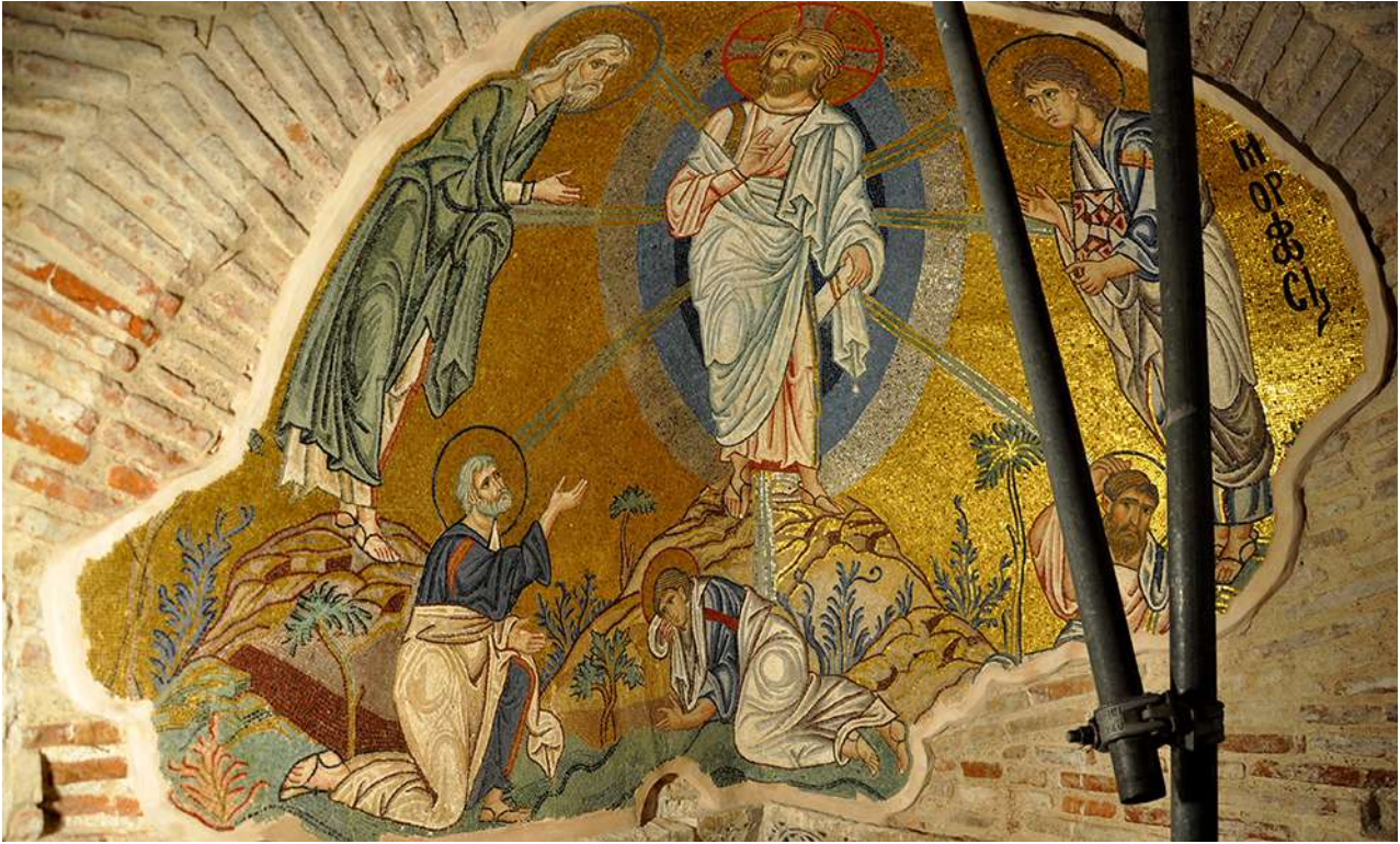
Μ. Δαφνίου. Ψηφιδωτό με παράσταση της Μεταμόρφωσης.

συνηγορούν οι μεγάλοι δόμοι που σχηματίζουν σταυρούς, η ζώνη των οποίων φτάνει μέχρι την ποδιά των παραθύρων. Από τη ζώνη των παραθύρων και πάνω αρχίζει η πλινθοπερικλειστή τοιχοδομία, η οποία χαρακτηρίζεται για την κανονικότητα και τη λιτότητά της. Με βάση το λιτό κεραμοπλαστικό διάκοσμο, το μνημείο χρονολογείται γύρω στο 1080μ.Χ. Το μοναστήρι παρέμεινε γνωστό στο πέρασμα των αιώνων για τον πλούσιο, άριστης ποιότητας και υψηλής έμπνευσης ψηφιδωτό του διάκοσμο. Λόγω των υπέροχων ψηφιδωτών του άλλωστε εντάχθηκε το 1990 στον κατάλογο των μνημείων παγκόσμιας πολιτιστικής κληρονομιάς της UNESCO.