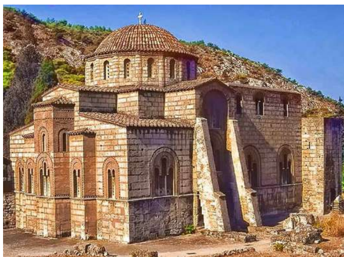
Καθολικό Μ. Δαφνίου. Άποψη του εξωτερικού από ΒΑ.