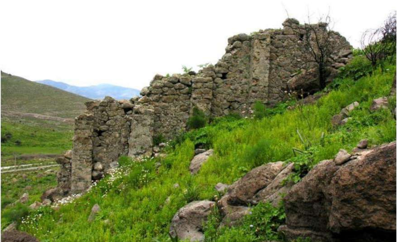
Τμήμα της βυζαντινής οχύρωσης του κάστρου του Στροβίλου (S. Cakmak, 2011, resim 7).

Το 1079 επίσης ο Άγιος Χριστόδουλος, «πρώτος» των μονών του όρους Λάτρους από το 1076, θα φιλοξενηθεί στη μονή από τον Αρσένιο Σκηνοῦρη μετά την