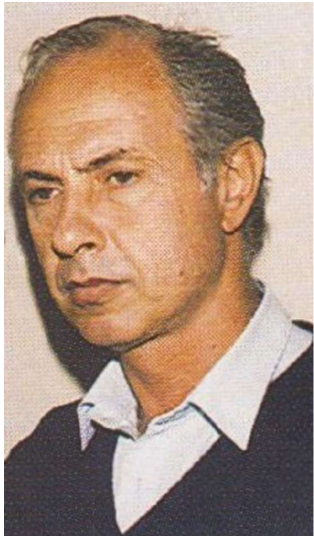
Ο Άγγελος Δεληβορριάς, φωτογραφία από αφιέρωμα της εκπομπής «Μονόγραμμα» του Γιώργου και της Ηρώς Σγουράκη (1985).

Είχε τη χαρισματική εκείνη όραση να ταυτίζει μέλη αγαλμάτων και να τα ανασυνθέτει, όπως έκανε με το γυναικείο σώμα του ναού της Αλέας στην Τεγέα που το συσχέτισε με το κοσμολογητο κεφάλι της Υγείας στο Εθνικό Αρχαιολογικό Μουσείο και το απέδωσε στον Σκόπα. Μολονότι δεν έπαψε να ενημερώνεται στην Αρχαιολογία,