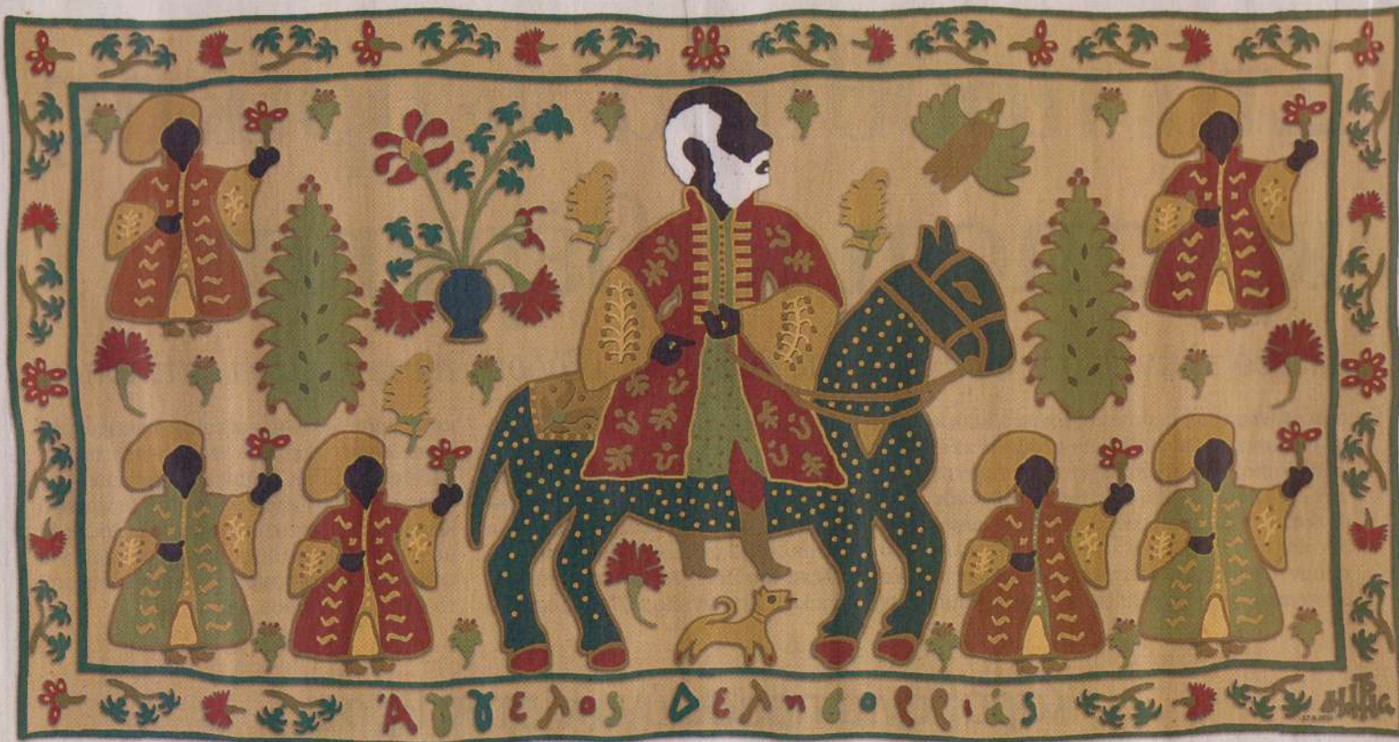
Σκίτσο του Άγγελου Δεληβορριά από τον Δημήτρη Χαντζόπουλο (Η Καθημερινή, 29 Απριλίου 2018).

αντιστάθμισμα μια πραγματικά παρήγορη σκέψη: ότι σε επιστήμες πολύ πιο “επιστημονικές” –πολύ πιο αβέβαιες δηλαδή για την “αντικειμενικότητα” των πορισμάτων τους– αυτά τα ίδια ποσοστά ενεργοποιούν συχνά τις κινητήριες δυνάμεις των νέων προβληματισμών, χαράζοντας παράλληλα και τους προσανατολισμούς των μελλοντικών στοχεύσεων».