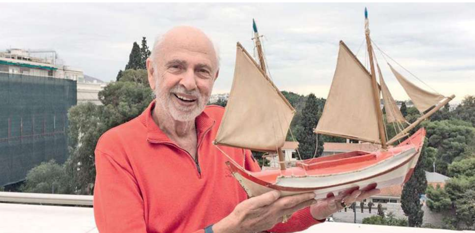
Ο Άγγελος Δεληβορριάς στην ταράτσα του κεντρικού κτηρίου του Μουσείου Μπενάκη τον Νοέμβριο του 2017 (Η Καθημερινή, 29 Απριλίου 2018).

Π ριν από επτά μήνες, στις 24 Απριλίου, έφυγε από τη ζωή ο ακαδημαϊκός και ομότιμος καθηγητής Ιστορίας της Τέχνης στο Τμήμα Θεατρικών Σπουδών του Εθνικού και Καποδιστριακού Πανεπιστημίου Αθηνών Άγγελος Δεληβορριάς. Μολονότι η ζωή και η δράση του συνδέθηκαν «τέταρτον του αιώνας» με το Μουσείο Μπενάκη, το οποίο αναμόρφωσε εκ βάθρων και επέκτεινε με αρκετά προσαρτήματα, δεν έπαψε να ασχολείται με την κλασική αρχαιολογία. Έτσι το 1977 βρέθηκε για μελέτη στο Λονδίνο, το 1979 στο Μόναχο, το 1980 στις συλλογές ελληνικών αρχαιοτήτων των μουσειακών κέντρων των ΗΠΑ, το 1983 και το 1988 στο Πρίνστον, το 1986 και το 1993 στο Βερολίνο, το 1989 στο Μουσείο Jean Paul Getty