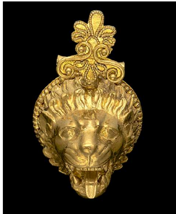
Χρυσό περίπλοκο κόσμημα με κεφαλή λιονταριού, π. 450-400 π.Χ. Προέρχεται ίσως από την Ακαρνανία (© The Trustees of the British Museum).

Τους επισκέπτες «καλωσορίζει» η Νίκη, η θεά της νίκης που συνέδεσε τον κόσμο των νεκρών με τον κόσμο των θεών. Η έκθεση αποτελείται συνολικά από 170 εκθέματα και χωρίζεται σε οκτώ τμήματα: «Νίκη, η θεά της νίκης», «Παιχνίδια στην παιδική ηλικία», «Αθλητικές διοργανώσεις», Μουσικές και θεατρικές διοργανώσεις», «Πόλεμος», «Ήρωες και μύθοι», «Κοινωνικός ανταγωνισμός στην καθημερινή ζωή και τον θάνατο». Επιπλέον, οι επισκέπτες