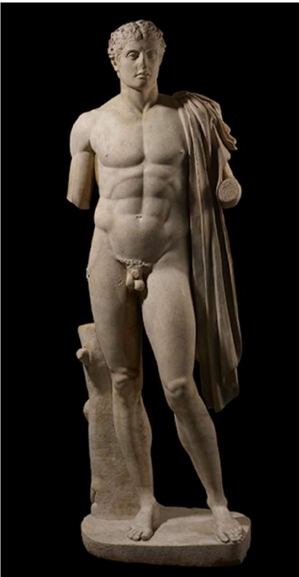
Ήρωας ή αθλητής. Μαρμάρινο άγαλμα. Ρωμαϊκό αντίγραφο (1ος αι. μ.Χ.) ελληνικού πρωτότυπου (π. 320-300 π.Χ.).

Η έκθεση φιλοδοξεί να προσφέρει μια κατανόηση του αγωνιστικού πνεύματος σε όλες τις