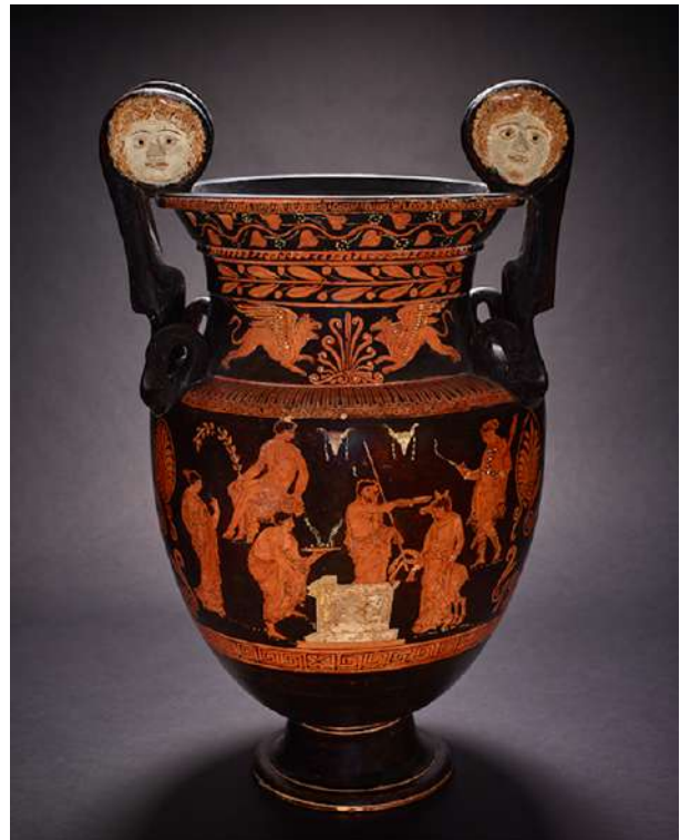
Αριστερά: Πολεμιστής που χορεύει. Μελανόμορφη κύλικα, π. 575-550 π.Χ. Κατασκευάστηκε στην Αθήνα και βρέθηκε στη Σιάνα της Ρόδου. Δεξιά: Ερυθρόμορφος κρατήρας με παράσταση της θυσίας της Ιφιγένειας, π. 360-350 π.Χ. Κατασκευάστηκε στην Απουλία, στη νότια Ιταλία, αλλά βρέθηκε στα Βασιλικάτα της Ιταλίας.

Όπως σημείωσε ο υπεύθυνος της έκθεσης «Το θέμα είναι ο ανταγωνισμός. Αυτό σημαίνει “Αγών” στα αρχαία ελληνικά. Η εμπειρία “μεταφέρει” τον επισκέπτη στην εποχή αυτού του πνεύματος. Ήταν μια κοινωνία που πίστευε ότι ο ανταγωνισμός είναι στην φύση του ανθρώπου και του δίνει τεράστια δύναμη».