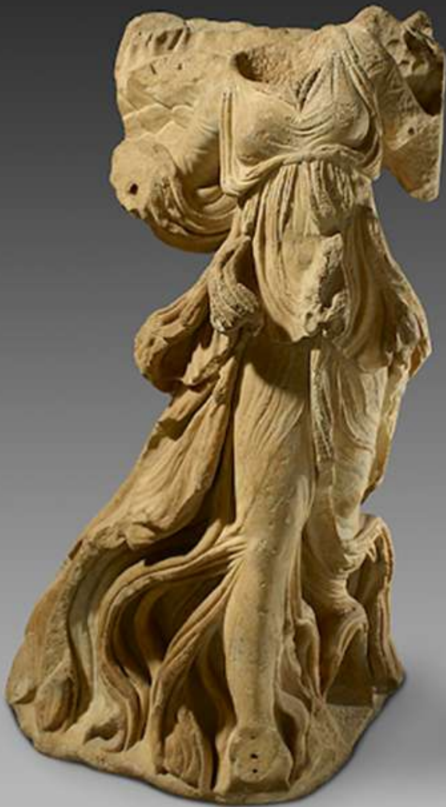
Πτερωτή Νίκη. Μαρμάρινο άγαλμα, π. 100 μ.Χ. από την Αλικαρνασσό.