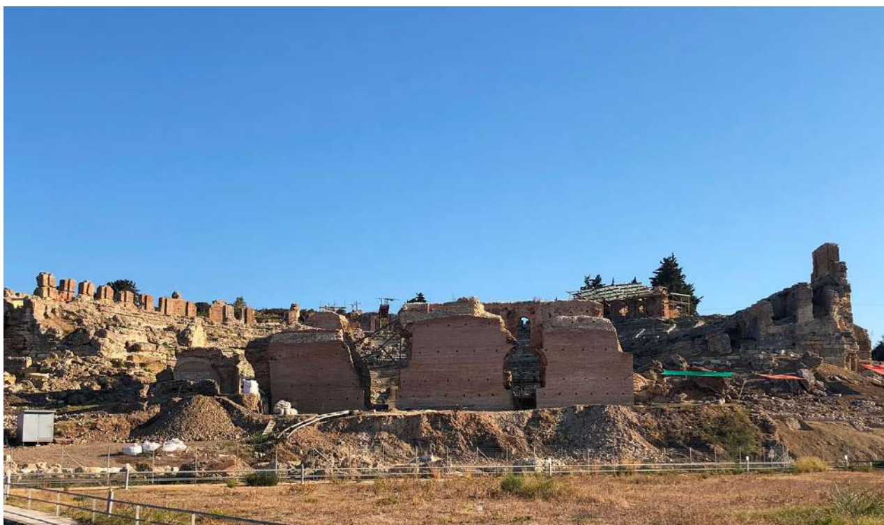
Θέατρο. Ο εξωτερικός τοίχος του σκηνικού οικοδομήματος μετά από τις εργασίες αποκατάστασης.

Ανασκαφικές εργασίες που έγιναν εξωτερικά του δυτικού αναλήμματος αποκάλυψαν ισχυρές αντηρίδες κατασκευασμένες από ορθογωνισμένες λιθόπλινθους σε τακτά διαστήματα μεταξύ τους. Εξωτερικά των αντηρίδων κατασκευάστηκε σε δεύτερη οικοδομική φάση τοίχος από οπτόπλινθους και το μεταξύ τους διάστημα μπαζώθηκε με συμπιεσμένο χώμα, προφανώς για την καλύτερη αντιστήριξη του αναλήμματος, καθώς το μνημείο πιθανόν παρουσίασε προβλήματα στήριξης, ίσως λόγω του ερπυσμού του λόφου, στα πρηνή του οποίου κτίστηκε. Μπροστά από το ανάλημμα