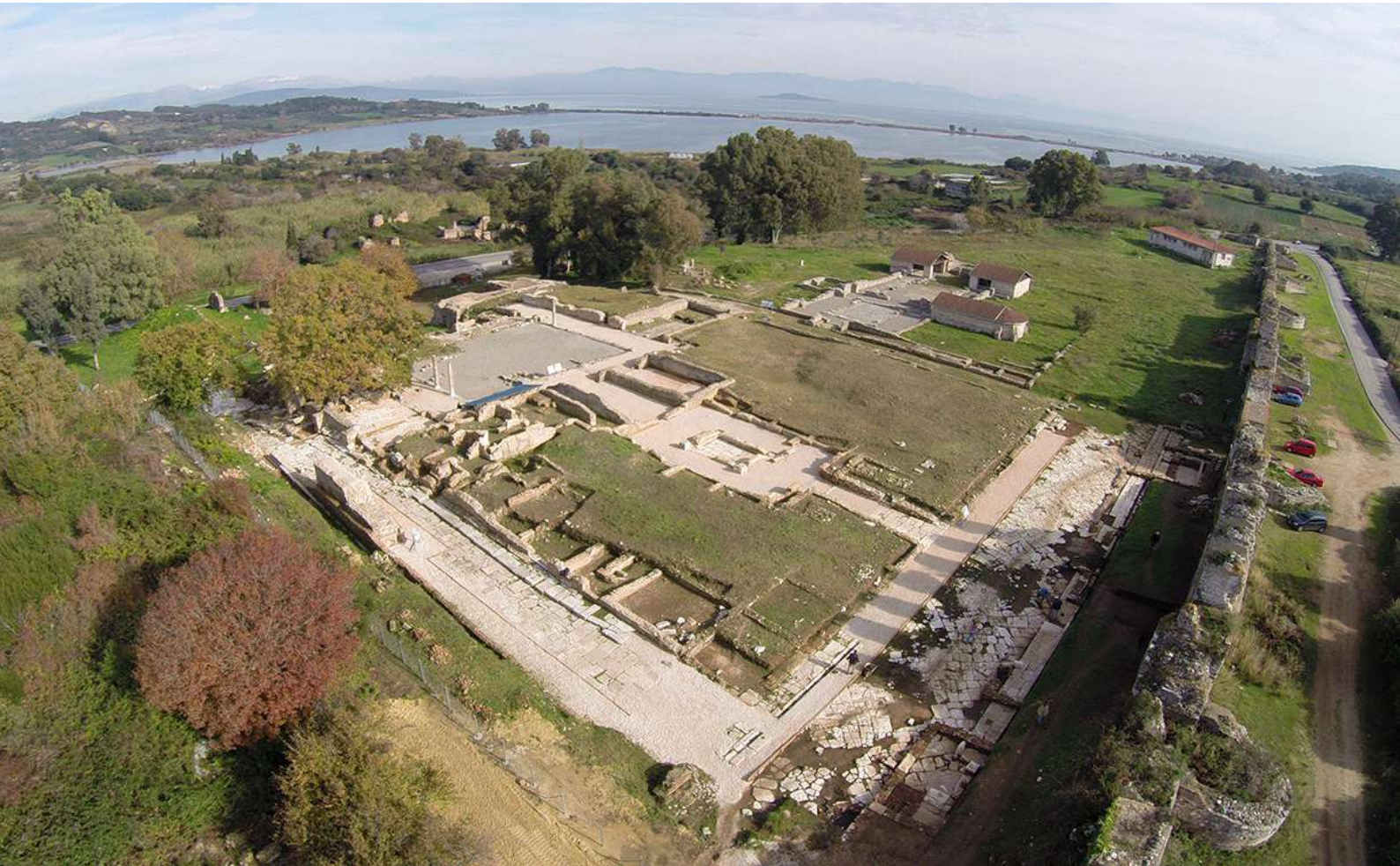
Ο οίκος του εκδίκου Γεωργίου. Στο βάθος η Βασιλική Α (©φωτ. ΕΦΑ Πρέβεζας).