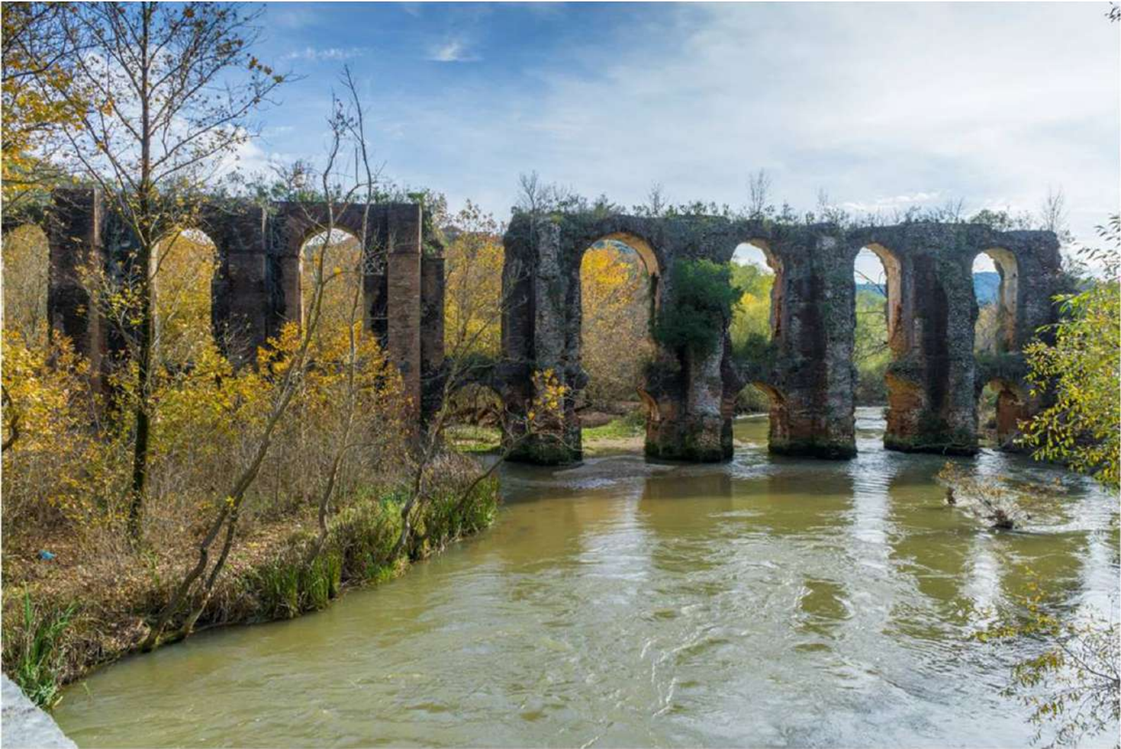
Το Υδραγωγείο της Νικόπολης στον Άγιο Γεώργιο.

Κωνσταντινούπολη. Την ίδια περίοδο η επισκοπή Νικοπόλεως ανυψώθηκε σε μητρόπολη, υπαγόμενη στην εκκλησία της Ρώμης με βικάριο (τοποτηρητή) τον αρχιεπίσκοπο Θεσσαλονίκης. Ως πρωτεύουσα επαρχίας και έδρα μητρόπολης η Νικόπολη αναδείχθηκε σε σημαντικό θρησκευτικό κέντρο έως και τον 6ο αι. μ.Χ., με μορφωμένους μητροπολίτες που έπαιρναν μέρος στις Οικουμενικές Συνόδους και χρηματοδοτούσαν την ανέγερση μεγαλοπρεπών βασιλικών. Ωστόσο, συνέχισε να καταπονείται από τις βαρβαρικές επιδρομές των Βησιγόθων, των Βανδάλων, των Γετών, των Οστρογόθων, αλλά και τους ισχυρούς σεισμούς που έπληξαν την περιοχή, με αποτέλεσμα η πόλη σταδιακά να συρρικνωθεί και να οχυρωθεί μετά τα μέσα του 5ου αι. μ.Χ. με νέο τείχος, που την περιόρισε στο 1/5 περίπου της αρχικής της έκτασης. Στα τέλη του 6ου αι. μ.Χ. εισέβαλαν στη Ελλάδα αβαροσλαβικά φύλα και φαίνεται πως σλαβικοί πληθυσμοί εγκαταστάθηκαν στη Νικόπολη, η οποία δεν εγκαταλείφθηκε, αλλά επιβίωσε και αντιστάθηκε στις επιθέσεις των Αράβων πειρατών που λυμαίνονταν τα παράλια της