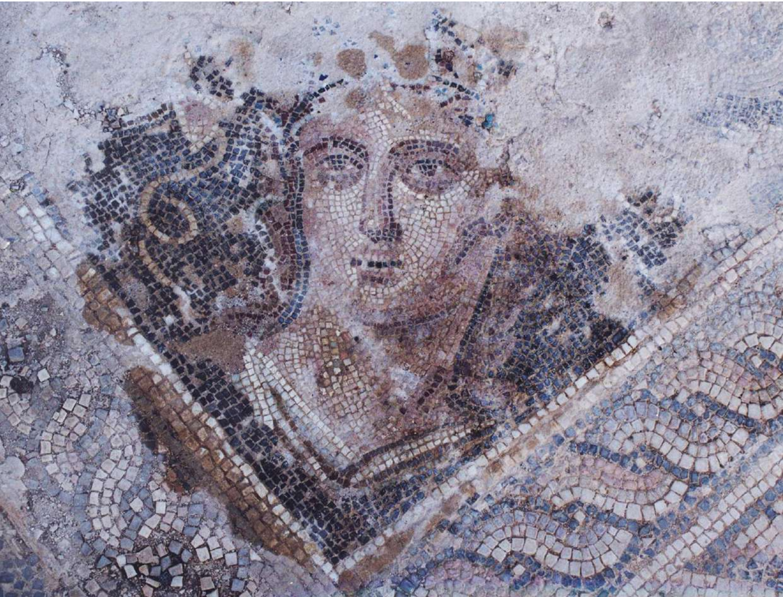
Λεπτομέρεια ψηφιδωτού από την οικία του Μάνιου Αντωνίνου.

Εκτός των τειχών της πόλης εκτείνονταν οι νεκροπόλεις της, οργανωμένες κατά μήκος δρόμων, που ξεκινούσαν από τις πύλες του τείχους. Εντυπωσιακά είναι τα υπέργεια ταφικά μνημεία, τα μαυσωλεία, που ανήκαν σε εύπορους και εξέχοντες πολίτες και αποτελούσαν οικογενειακούς τάφους. Άλλοι τύποι τάφων, γνωστοί από παλιότερες περιόδους, είναι οι κτιστοί κιβωπίο-σχημοί, οι κεραμοσκεπείς, οι εγχυτρισμοί νηπίων σε μεγάλα αγγεία και οι θήκες με τεφροδόχους.