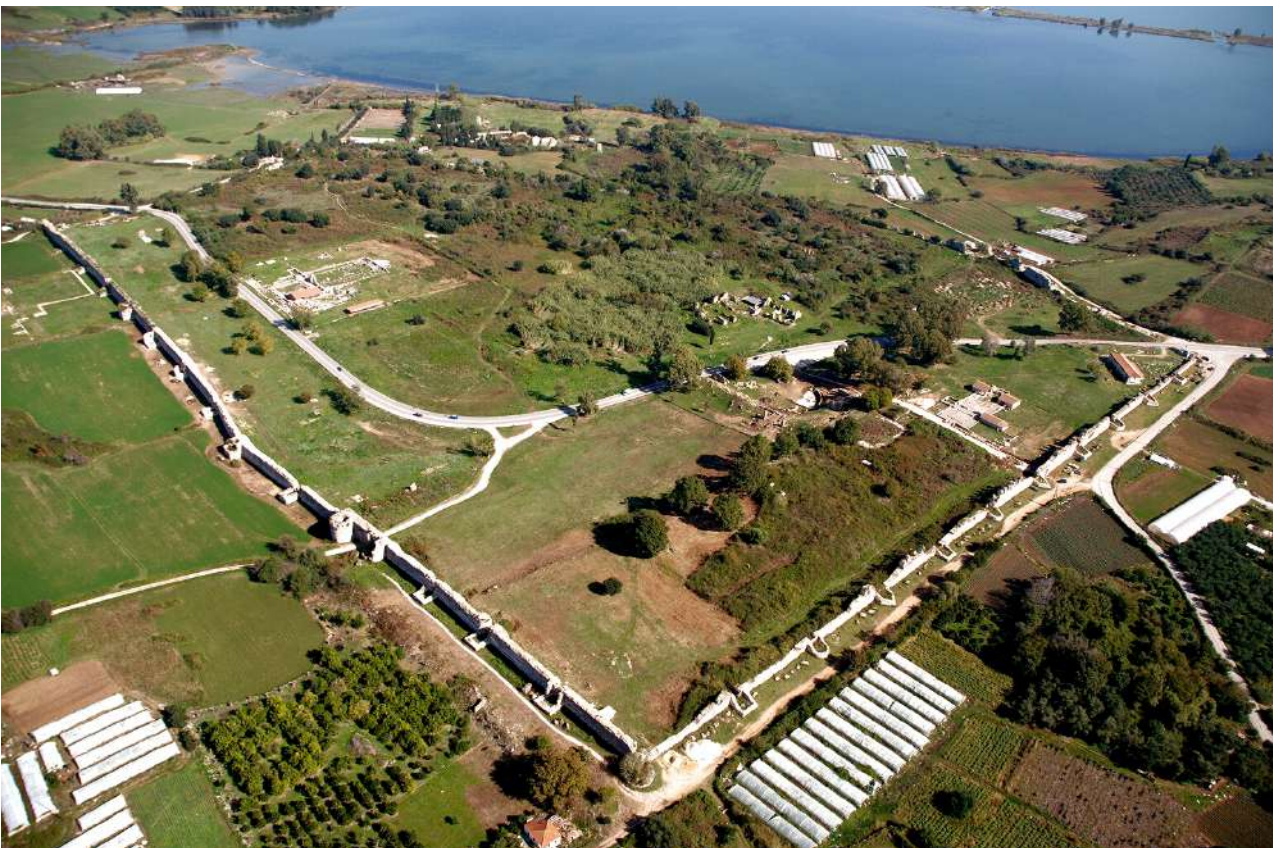
Αεροφωτογραφία της παλαιοχριστιανικής Νικόπολης. Διακρίνεται το νότιο και το δυτικό σκέλος των τειχών.

Άκτια, αγώνες που διεξάγονταν από το Κοινό των Ακαρνανών στο ιερό του Ακτίου Απόλλωνα, προπαγανδίζοντας τη νίκη του ως αποτέλεσμα θεϊκής παρέμβασης. Τα νέα Άκτια, που περιελάμβαναν αγώνες γυμνικούς, καλλιτεχνικών δεξιοτήτων και ιπποδρομίες, τελούνταν κάθε τέσσερα χρόνια και προστέθηκαν στην περίοδο των Πανελληνίων αγώνων. Ο κοσμοπολίτικος χαρακτήρας που απέκτησε η πόλη κατά τους πρώτους αυτοκρατορικούς αιώνες διαφαίνεται από τις επισκέψεις επιφανών προσώπων που δέχθηκε. Ο Γερμανικός, θετός γιος και ανιψιός του αυτοκράτορα Τιβερίου και δημοφιλής στον ρωμαϊκό λαό στρατηγός, σταμάτησε στη Νικόπολη κατά τη διάρκεια του ταξιδιού του στη Μικρά Ασία το 18 μ.Χ. και επισκέφθηκε τα στρατόπεδα του Οκταβιανού και του Αντωνίου. Στη Νικόπολη διέμεινε τον χειμώνα του 62/63 μ.Χ. ο Απόστολος Παύλος και ίδρυσε την Εκκλησία της, σύμφωνα με την προς Τίτον Επιστολή του, αν και ορισμένοι ερευνητές θεωρούν ότι η επιστολή δεν αναφέρεται στη Νικόπολη της Ηπείρου, αλλά της Θράκης. Την πόλη επισκέφθηκε και ο αυτοκράτορας