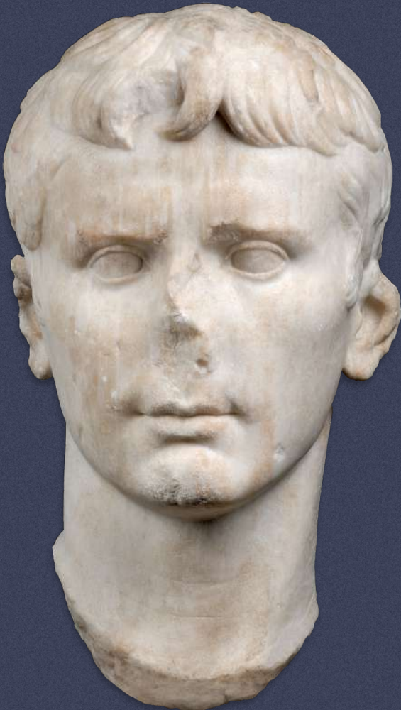
Μαρμάρινη εικονιστική κεφαλή του Οκταβιανού Αυγούστου. Αρχαιολογικό Μουσείο Νικόπολης.

παρουσιάσει στον λαό της Ρώμης ως προδότη του έθνους. Έτσι, το 32 π.Χ. η Σύγκλητος κήρυξε τον πόλεμο εναντίον της Κλεοπάτρας. Ο Αντώνιος επέλεξε ως πεδίο της σύγκρουσης τη Δυτική Ελλάδα και έστησε το στρατόπεδό του στο ακρωτήριο Άκτιο της Ακαρνανίας, στην είσοδο του Αμβρακικού κόλπου, όπου αγκυροβόλησε ο στόλος του. Ο Οκταβιανός, με στρατηγό τον φίλο του Μάρκο Βιψάνιο Αγρίππα, αγκυροβόλησε στον όρμο Κόμαρος του Ιονίου πελάγους και έστησε το στρατηγείο του σε λόφο με απρόσκοπτη θέα προς το Ιόνιο και τον Αμβρακικό. Η τελική σύγκρουση