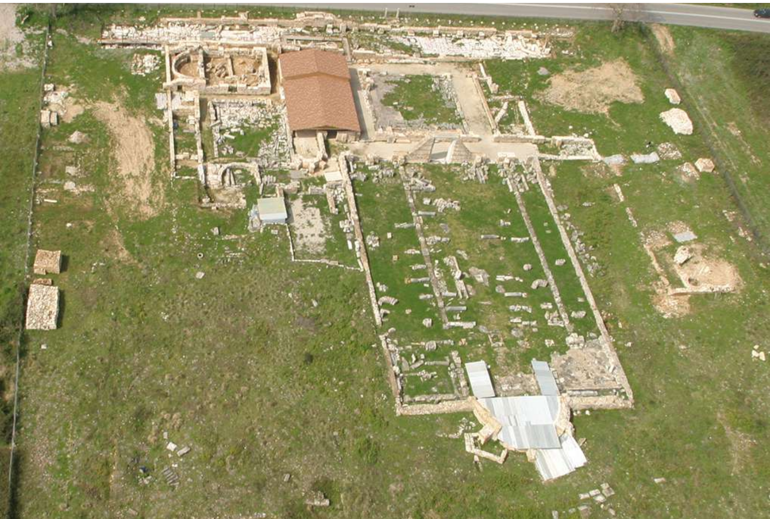
Η Βασιλική Β (©φωτ. ΕΦΑ Πρέβεζας).

Παρά τη μεγάλη φθορά που υπέστη το μνημείο εξαιτίας της εκτεταμένης λεηλασίας του και λιθολόγησης του μεγαλύτερου μέρους των εδωλίων (μεγάλο μέρος του λίθινου οικοδομικού του υλικού μετατράπηκε σε ασβέστη, όπως μαρτυρούν τρεις ασβεστοκάμινοι που εντοπίζονται στο κοίλο), αλλά και της εγκατάστασης ιταλικού αντιαεροπορικού πυροβολείου στο κοίλο κατά τον Β΄ Παγκόσμιο Πόλεμο, μεγάλα τμήματά του παρέμεναν ορατά,