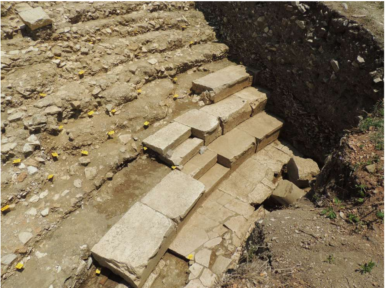
Θέατρο. Οι κατώτερες σειρές των εδωλίων και κλίμακα ανόδου.

Μία διερευνητική τομή στο κατώτερο τμήμα του κοίλου, στον κεντρικό άξονα του μνημείου, έφερε στο φως και σε πολύ καλή κατάσταση διατήρησης τμήμα από τις δύο κατώτερες σειρές των εδωλίων