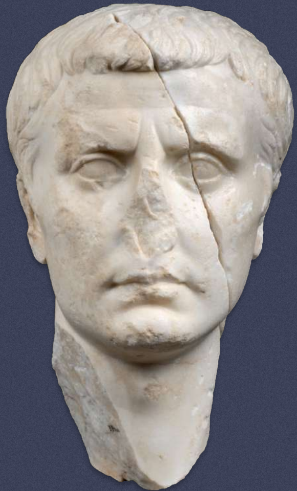
Μαρμάρινη εικονιστική κεφαλή του στρατηγού Μάρκου Βιψάνιου Αγρίππα. Αρχαιολογικό Μουσείο Νικόπολης.