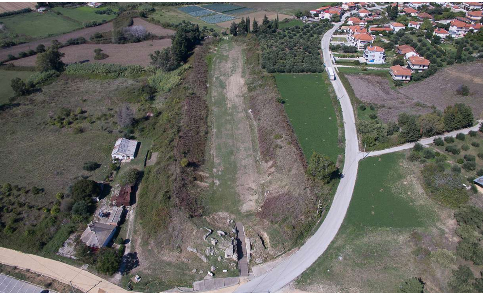
Το Στάδιο της Νικόπολης.

επιηρέαστηκε από τη γενικότερη ύφεση που έπληξε την αυτοκρατορία, αφετέρου δέχθηκε την πρώτη βαρβαρική επιδρομή, αυτή των Ερούλων το 267 μ.Χ. Ωστόσο, ήδη από τις αρχές του 4ου αι. μ.Χ. η Νικόπολη ανακάμπτει, καθώς με τη διοικητική μεταρρύθμιση του Διοκλητιανού (283-305 μ.Χ.) και του Μεγάλου Κωνσταντίνου (307-337 μ.Χ.) ανακηρύχθηκε πρωτεύουσα της Επαρχίας της Παλαιάς Ηπείρου και έδρα του επαρχιακού διοικητή με το αξίωμα του ηγεμόνα. Σύμφωνα με πανηγυρικό λόγο που εκφώνησε το 362 μ.Χ. ο έπαρχος του Ιλλυρικού Κλαύδιος Μαμερτίνος εκθειάζοντας τον αυτοκράτορα Ιουλιανό, ο τελευταίος έδειξε ιδιαίτερο ενδιαφέρον για τη Νικόπολη, αναβιώνοντας τα Άκτια και επισκευάζοντας το υδραγωγείο της. Μετά τον θάνατο του Θεοδοσίου το 395 μ.Χ. η παλαιά Ήπειρος υπήχθη στην υπαρχία του ανατολικού Ιλλυρικού και κατά συνέπεια στο ανατολικό τμήμα της αυτοκρατορίας με πρωτεύουσα την