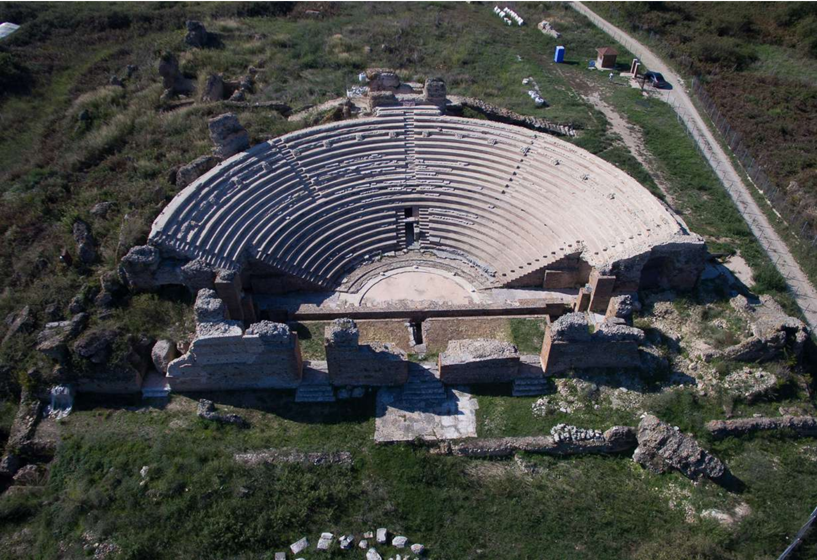
Το Ωδείο της Νικόπολης.

λύματα και κατέληγαν σε μεγάλους τοξωτούς υπονόμους, που τα διοχέτευαν τελικά έξω από τα τείχη.