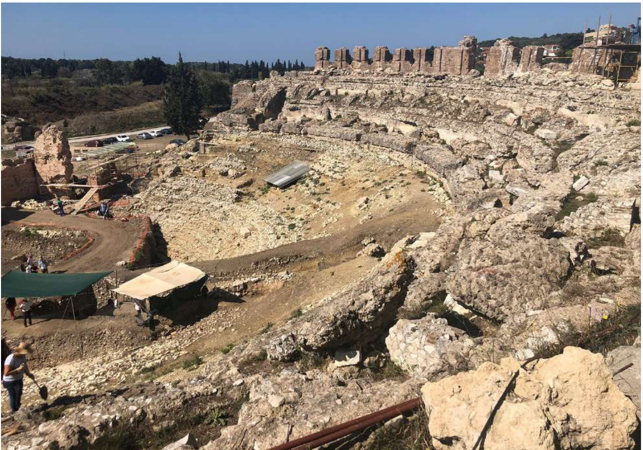
Θέατρο. Εργασίες αποκάλυψης του κοίλου.