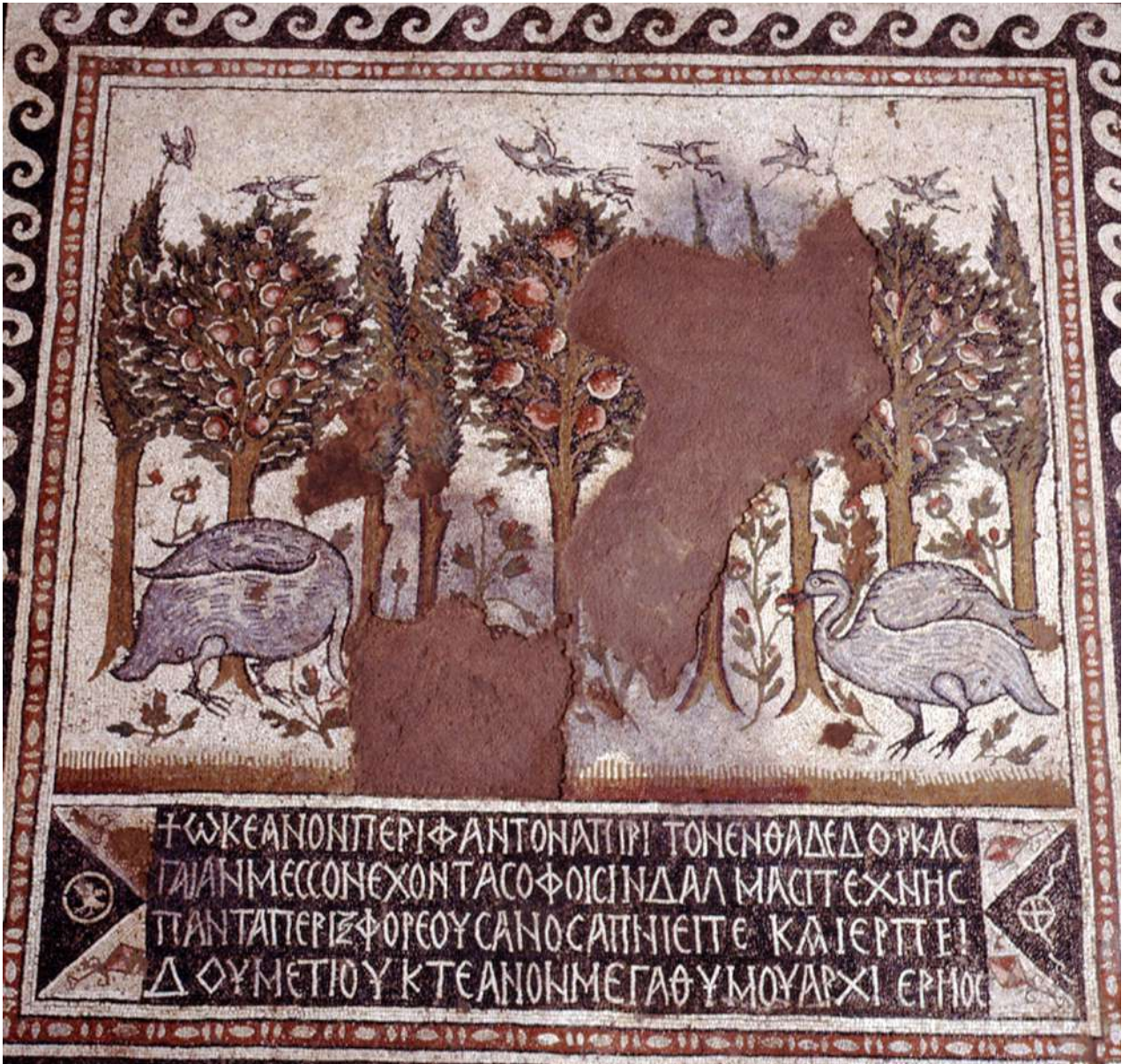
Ψηφιδωτό δάπεδο από τη Βασιλική Α.

Οι εργασίες της Επιστημονικής Επιτροπής Νικόπολης ξεκίνησαν με προκαταρκτικές έρευνες, όπως γεωφυσικές διασκοπήσεις, χαρτογραφήσεις και αποτυπώσεις των ήδη ορατών μνημείων. Έτσι, προσδιορίστηκαν τα κύρια χωροταξικά χαρακτηριστικά της αρχαίας πόλης, ανιχνεύτηκε ο πολεοδομικός ιστός της και έγινε δυνατή η σύνθεση του τοπογραφικού χάρτη της. Στη συνέχεια η Επιτροπή προχώρησε σε ανασκαφικές έρευνες σε επιλεγμένα μνημεία, που αποτελούν τους πυρήνες επίσκεψης στο αρχαιολογικό πάρκο, αλλά και σε εργασίες αναστηλώσεων και αποκαταστάσεων, συντηρήσεις ψηφιδωτών, κατασκευή στεγάστρων προστασίας και διαμόρφωση του περιβάλλοντος χώρου των μνημείων, μετά την εκπόνηση εξειδικευμένων μελετών. Εξαιρετικά σημαντικό είναι το σχέδιο συνολικής διαχείρισης του αρχαιολογικού χώρου της Νικόπολης ( master plan ), με βάση το οποίο προχω-