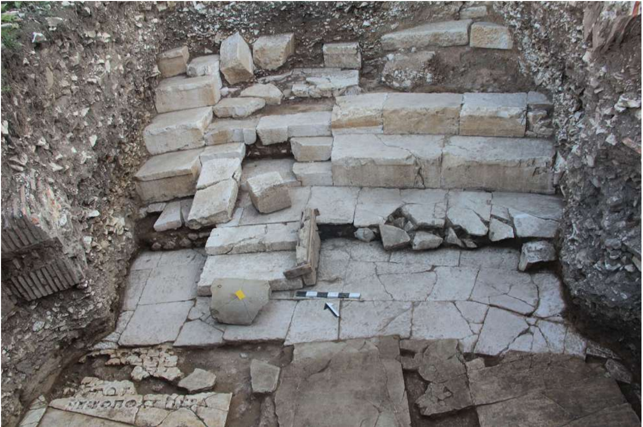
Θέατρο. Το κεντρικό τμήμα των εδωλίων και τμήμα της ορχήστρας με επιγραφή.