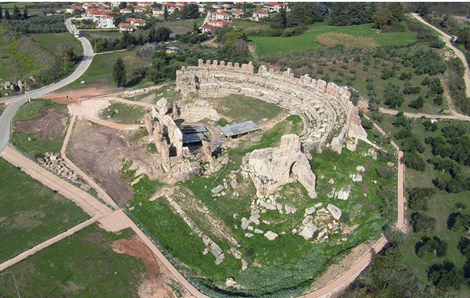
Το Θέατρο της Νικόπολης μετά την πρώτη φάση των εργασιών (©φωτ. ΕΦΑ Πρέβεζας).

επιτρέποντας σε μεγάλο βαθμό την ανάγνωση της κάτοψής του. Έτσι, το κοίλο, διαμέτρου 92μ., αναπτύσσεται στο κατώτερο τμήμα του στο φυσικό πρανές του λόφου, ενώ το ανώτερο τμήμα του στηρίζεται σε λιθόκτιστες υποδομές, κατά το ρωμαϊκό σύστημα. Στο άνω κοίλο κατασκευάστηκαν για την έδραση των εδωλίων τρεις επάλληλες θολωτές στοές με κλιμακούμενο ύψος, από τις οποίες η εξωτερική ήταν απροσπέλαστη, καθώς έφερε εσωτερικά ακτινικά διατεταγμένους εγκάρσιους τοίχους, που διαμορφώνουν κλειστούς χώρους. Το κοίλο ορίζεται περιμετρικά από ψηλό αναλημματικό τοίχο, που ενισχύεται κατά διαστήματα από αντηρίδες. Στη δεύτερη οικοδομική φάση του μνημείου ο αναλημματικός τοίχος αυξήθηκε καθ' ύψος, αυξάνοντας τη χωρητικότητα του κοίλου και επιτρέποντας την ανέγερση περιμετρικής στοάς στο ανώτερο τμήμα του. Οι δύο οικοδομικές φάσεις του τοίχου διακρίνονται με σαφήνεια και από τον τρόπο δόμησης: το αρχαιότερο τμήμα είναι κατασκευασμένο από ορθογωνισμένους λίθους τοποθετημένους σε οριζόντιες στρώσεις, ενώ το ανώτερο τμήμα είναι κτισμένο από επάλληλες