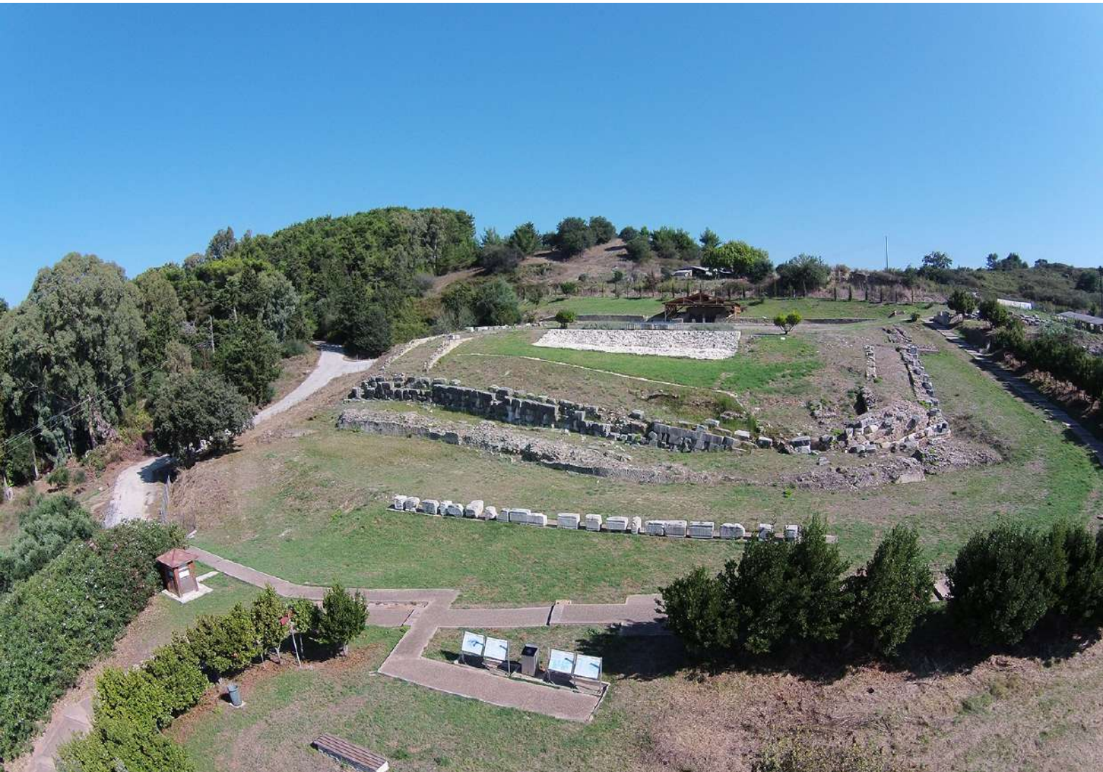
Το Μνημείο του Αυγούστου.

προνόμια, απονέμοντάς του το 27 π.Χ. τον τίτλο του Αυγούστου (Σεβαστός), με τον οποίο έμεινε γνωστός στην ιστορία. Ο Αύγουστος, ακολουθώντας το παράδειγμα του Μεγάλου Αλεξάνδρου και των ηγεμόνων των ελληνοιστικών βασιλείων, και στο πλαίσιο της πολιτικής του προπαγάνδας, προχώρησε στην ίδρυση της Νικόπολης στην περιοχή όπου διαδραματίστηκαν τα γεγονότα της ναυμαχίας. Η πόλη ιδρύθηκε με την μέθοδο του συνοικισμού, της μετεγκατάστασης δηλαδή κατοίκων από πόλεις και κώμες της Ηπείρου, της Ακαρνανίας και της Λευκάδας, που αναγκάστηκαν να εγκαταλείψουν τις