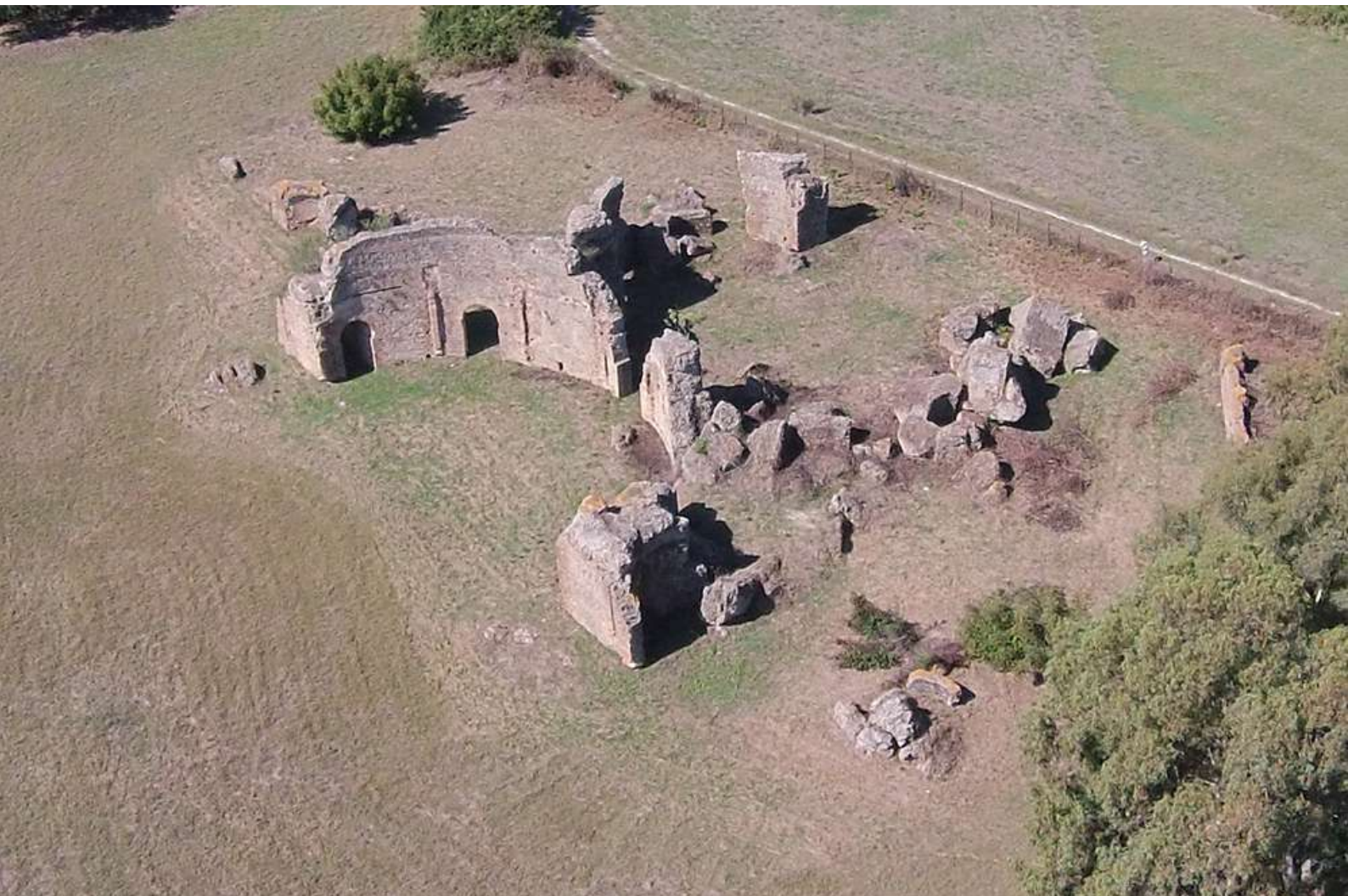
Οι βόρειες θέρμες.

του εχθρού και ψηλότερα τοποθετήθηκε η αναθηματική επιγραφή του μνημείου.