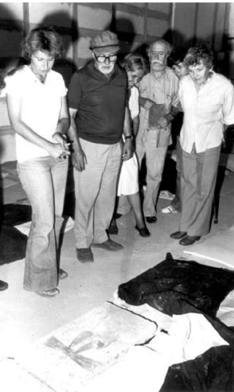
Ο Μανόλης Ανδρόνικος με τον Γιάννη Τσαρούχη, μπροστά στις σπασμένες επιτύμβιες στήλες από τη Μεγάλη Τούμπα.

δυνάμεις, υλικές και πνευματικές, για την παιδεία των νέων. Στο μυαλό των παιδιών μας μπορούμε να στηρίξουμε το μέλλον και την προκοπή της Ελλάδας. Και τα παιδιά αυτά είναι έτοιμα να κάνουν κάθε θυσία, όταν βεβαιωθούν πως αυτή γίνεται για το καλό, όχι μονάχα το δικό τους, αλλά για καλό του συνόλου. Αλλά για να βεβαιωθούν, απαιτούν από