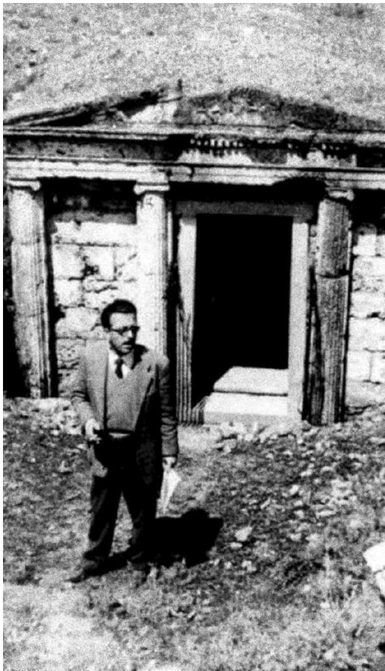
Ο Μανόλης Ανδρόνικος έξω από τάφο της Βεργίνας, 22 Απριλίου 1957 (φωτ. Μανόλης Ανδρόνικος, Το Χρονικό της Βεργίνας, Αθήνας, 1997, σ. 32).

Η «άλλη ακρογιαλιά» του Ανδρόνικου στάθηκε ο Θερμαϊκός κόλπος, που σπούδασε και ανδρώθηκε. Δάσκαλός του ήταν ο Ρωμαίος, που τον σημάδεψε βαθειά. «Οι Έλληνες αρχαιολόγοι, γράφει, δεν είμαστε ποτέ άτυχοι. Κάθε γενειά είχε έναν άξιο οδηγό. Ο Χρήστος Τσουντας θα μείνει για πάντα ο μεγάλος δάσκαλος της ελληνικής αρχαιολογίας. Ο Κωνσταντίνος Ρωμαίος, ο άξιος συνεχιστής της παράδοσης εκείνου, προχώρησε ακόμη παραπέρα, με την ίδια σεμνή αφοσίωση στο έργο του, την στοχαστική αναζήτηση του πνευματικού κόσμου των σιωπηλών λειψάνων, την ευαίσθητη ανάλυση των καλλιτεχνικών τους μυστικών». Δεν θυμάται όμως μόνο τον Ρωμαίο, αλλά συχνά μνημονεύει και άλλους δασκάλους, του Sir John Beazley, τον Χρήστο Καρούζο, που του άνοιξαν τα μάτια στην Ελλάδα, την Ευρώπη και τον κόσμο. Και νωρίς διάλεξε ο Ανδρόνικος τον δρόμο ανάμεσα στις σειρήνες του κόσμου, τον δρόμο της διδασκαλίας και της έρευνας.