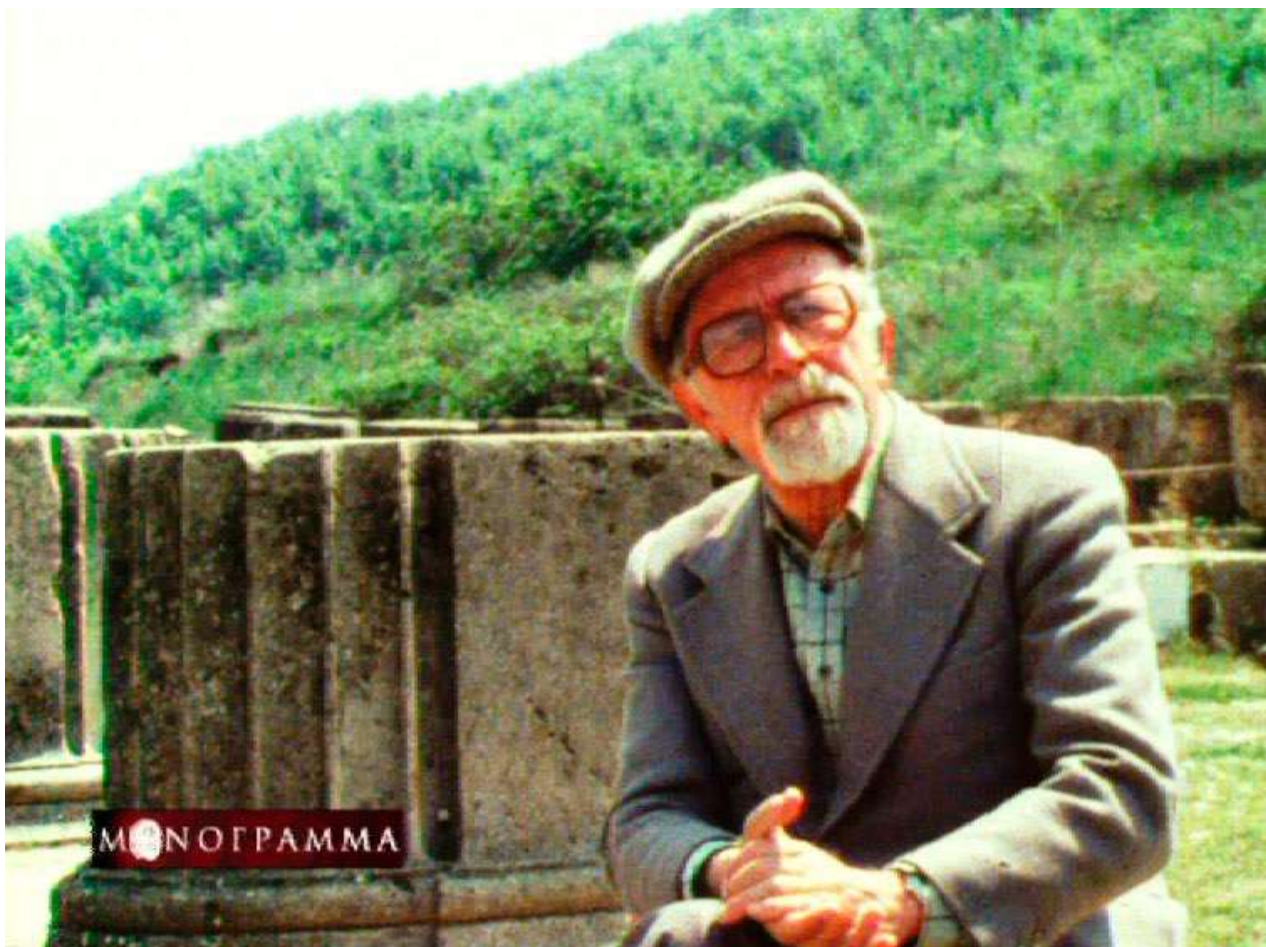
Ο Μανόλης Ανδρόνικος στον χώρο του ανακτόρου των Αιγών, από την εκπομπή Μονόγραμμα του Γιώργου και Ηρώς Σγουράκη 1982.

έρευνα της Βεργίνας όμως το 1939 δεν είναι τυχαία. Τότε σίγουρα ο φοιτητής Ανδρόνικος, σκέφθηκε την ανεξήγητη ύπαρξη μακεδονικού ανακτόρου στην Βεργίνα, πριν προχωρήσει από το 1951 σαν ερευνητής στην ανασκαφή και δημοσίευση του μοναδικού νεκροταφείου των τύμβων της πρώιμης εποχής του σιδήρου. Η λέξη «τύμβος» τον σημάδευε.