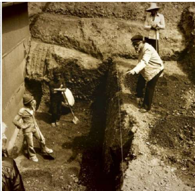
Ο Μανόλης Ανδρόνικος στη Βεργίνα.

ο κόσμος αναζητά απ' αυτούς κάποτε και σε απόγνωση τους μύθους του, που ξέχασε. Οι ιστορικοί αρχαιολόγοι, όπως ο Ανδρόνικος, έχοντας βιώσει την ιστορία, φροντίζουν άλλωστε να κρατούν ισορροπία, γι' αυτό και σε εποχές εθνικιστικών εξάρσεων και μυθοπλασιών, παραμένουν σιωπηλοί.