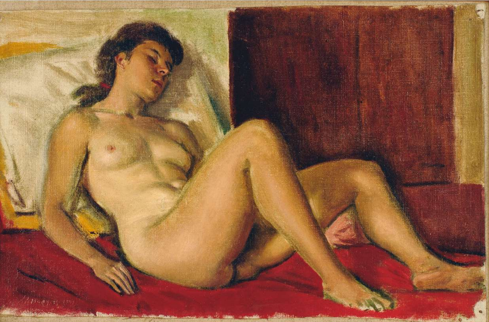
Γυμνό, 1947, λάδι σε μουσαμά, Μουσείο Μπενάκη.

Στις 20 Δεκεμβρίου 2009, στα ενενήντα τρία χρόνια του, έφυγε από τη ζωή ο ζωγράφος Γιάννης Μόραλης. Ένα από τα κύρια χαρακτηριστικά του υπήρξε η έμφυτη ευγένειά του.