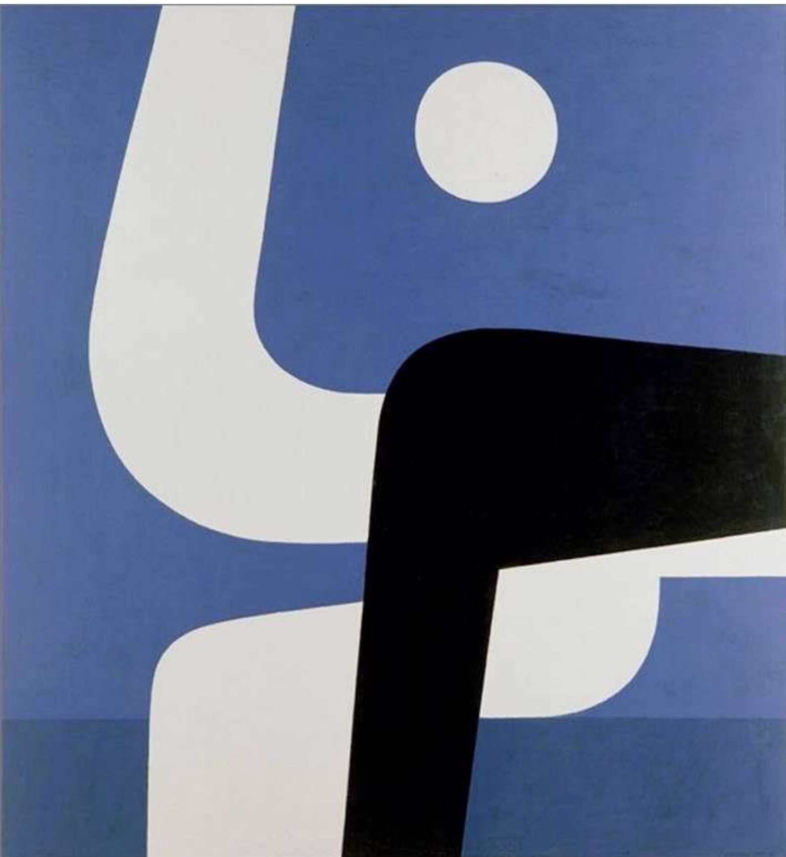
Πανσέληνος Μ' , 1977-78, ακρυλικά σε μουσαμά, ιδιωτική συλλογή.