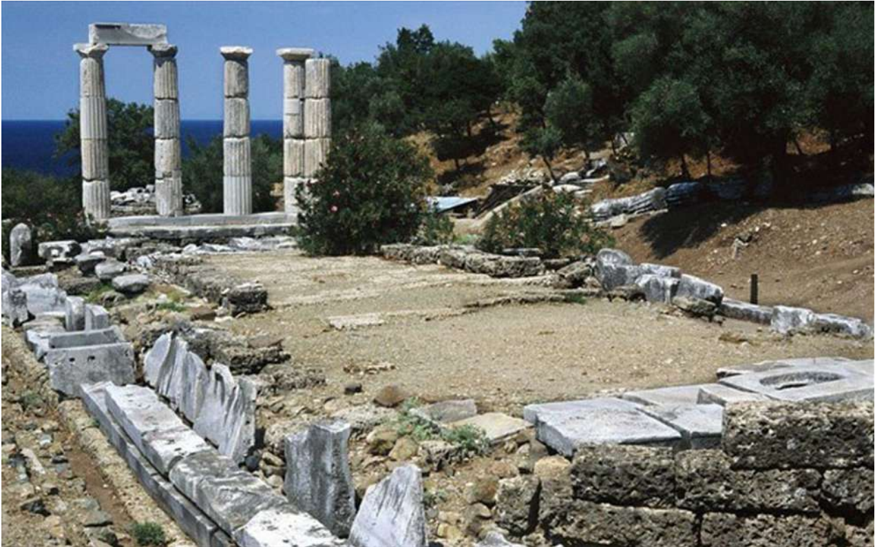
Σαμοθράκη. Ιερό των Μεγάλων Θεών. Αποψη του Ιερού από τα ΝΑ.

του και της φήμης της μυστηριακής λατρείας των Μεγάλων Θεών. Για αυτόν τον λόγο στην επόμενη περίοδο, το νησί συνδέθηκε με τον βασιλικό οίκο των Μακεδόνων και βρέθηκε υπό την προστασία του Φιλίππου Β΄ καθώς και του Μ. Αλεξάνδρου. Αυτή είναι άλλωστε και η περίοδος της μεγάλης οικοδομικής ανάπτυξης του ιερού, η οποία συνεχίστηκε και επί των Διαδόχων του Μ. Αλεξάνδρου.