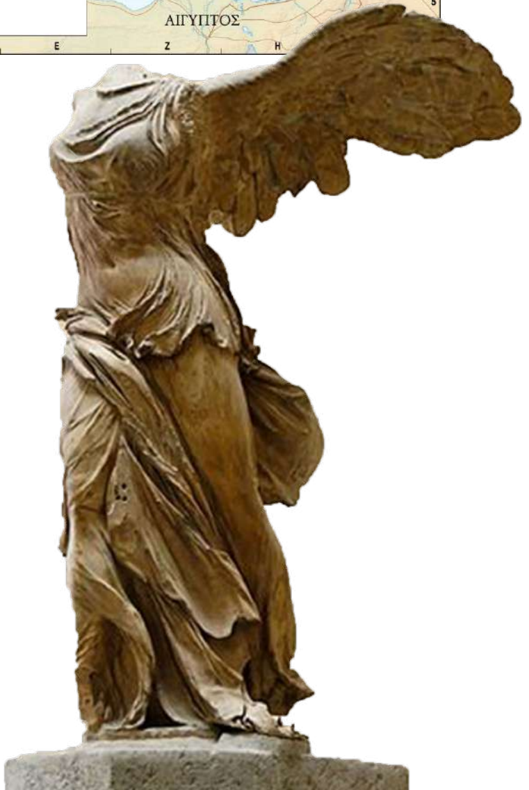
Νίκη Σαμοθράκης. Μουσείο του Λούβρου, Παρίσι.

Το νησί εποικίστηκε από Έλληνες αιολικής προέλευσης κατά τα τέλη του 8ου-αρχές 7ου αι.