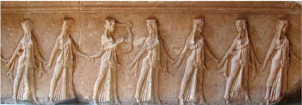
Η ζωφόρος του προπύλου του Τεμένους, με την απεικόνιση των χορευτριών.

όγκος των πιστών έφθαβε μέχρι τη βαθμίδα της μύησης και μόνο λίγοι προχωρούσαν στο επόμενο στάδιο της εποπτείας. Αυτό ίσως σχετίζεται με διλήμματα κυρίως ηθικού χαρακτήρα, που έπρεπε να αντιμετωπίσουν οι μυημένοι, όπως οι εξομολόγηση όλων των αμαρτιών τους, προκειμένου να καθαρθούν και να λάβουν άφεση, εάν κάτι τέτοιο ήταν δυνατό. Τέλος η σημαντικότερη διαφορά των Καβειρίων από τα Ελευσίνια Μυστήρια, ήταν η ελεύθερη πρόσβαση σε όλους, χωρίς περιορισμό φύλου, κοινωνικής τάξης ή εθνικότητας. Τα πλήθη των πιστών που συνέρεαν για να μυηθούν, πίστευαν ότι με αυτόν τον τρόπο γίνονταν καλοί άνθρωποι, ότι κέρδιζαν την εύνοια των Μεγάλων Θεών, καθώς και ότι θα ήταν προστατευμένοι κατά τη διάρκεια μεγάλων ταξιδιών στη θάλασσα.