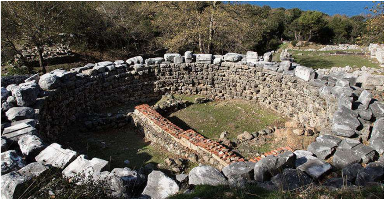
Σαμοθράκη. Ιερό των Μεγάλων Θεών. Θόλος Αρσινόης (Wikimedia Commons).

πλευρά του κτηρίου. Σε αυτό το κτήριο βρέθηκε ανάγλυφη ζωφόρος που απεικονίζει χορό χορευτριών. Κτίστηκε γύρω στα 340 π.Χ. και πιθανολογείται ότι υπήρξε δωρεά του βασιλιά Φιλίππου Β'. Λόγω της ύπαρξης της ζωφόρου εικάζεται ότι σε αυτόν τον χώρο οι μνημένοι παρακολουθούσαν το τελετουργικό του «Ιερού Γάμου» του Κάδμου και της Αρμονίας.