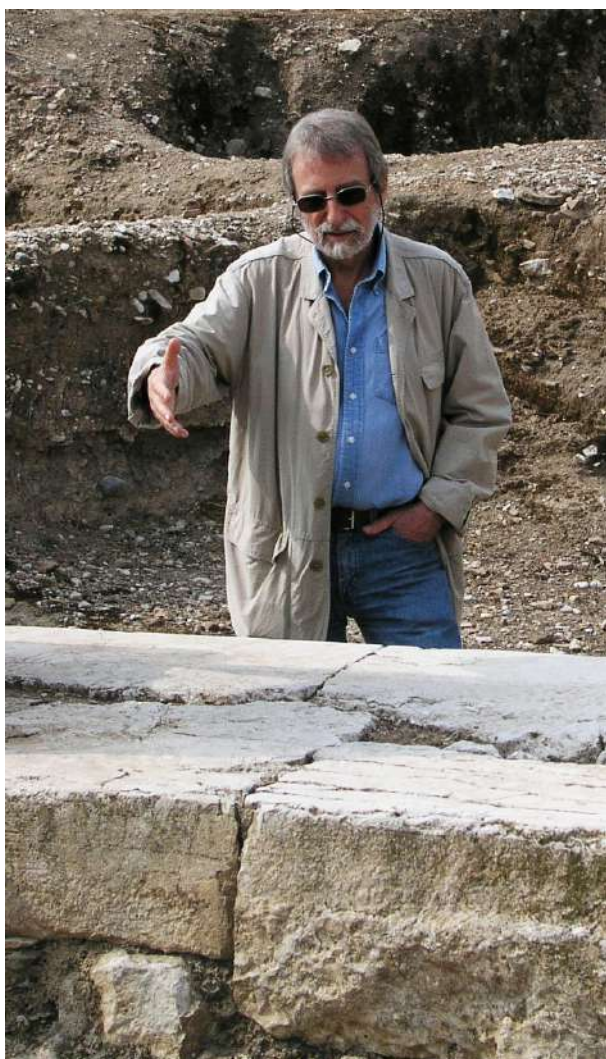
Ο Francis Croissant στην αρχαία Αγορά του Άργους. Εκδρομή στο Άργος, τον Σεπτέμβριο 2003, μετά από το Διεθνές Συνέδριο «Στα βήματα του Wilhelm Vollgraff. Εκατό χρόνια αρχαιολογικής δραστηριότητας στο Άργος», που διοργανώθηκε στην Αθήνα από την Εφορεία Αρχαιοτήτων Αργολίδας και τη Γαλλική Σχολή Αθηνών (25-28 Σεπτεμβρίου 2003).

Ο συνάδελφος και φίλος μας Francis Croissant απεβίωσε στις 16 Απριλίου 2019. Η σταδιοδρομία του ξεκίνησε στην Ελλάδα, την οποία αγάπησε με πάθος έως το τέλος. Ως μέλος της Γαλλικής Σχολής Αθηνών (1964-1968) και στη συνέχεια γενικός γραμματέας (1968-1974), ασχολήθηκε κυρίως με την αρχαία ελληνική γλυπτική ενώ ανέπτυξε μια πολύχρονη ανασκαφική δραστηριότητα στην πόλη του Άργους. Στη Γαλλία δίδαξε ελληνική αρχαιολογία πρώτα στο Πανεπιστήμιο του Nancy και, από το 1989 έως τη συνταξιοδότησή του το 2002, στο Πανεπιστήμιο Paris 1 Panthéon-Sorbonne, όπου διαδέχθηκε τον Jean Marcadé.