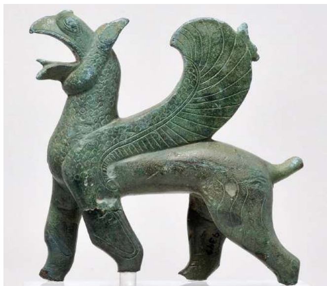
Αρχαιολογικό Μουσείο Ιωαννίνων