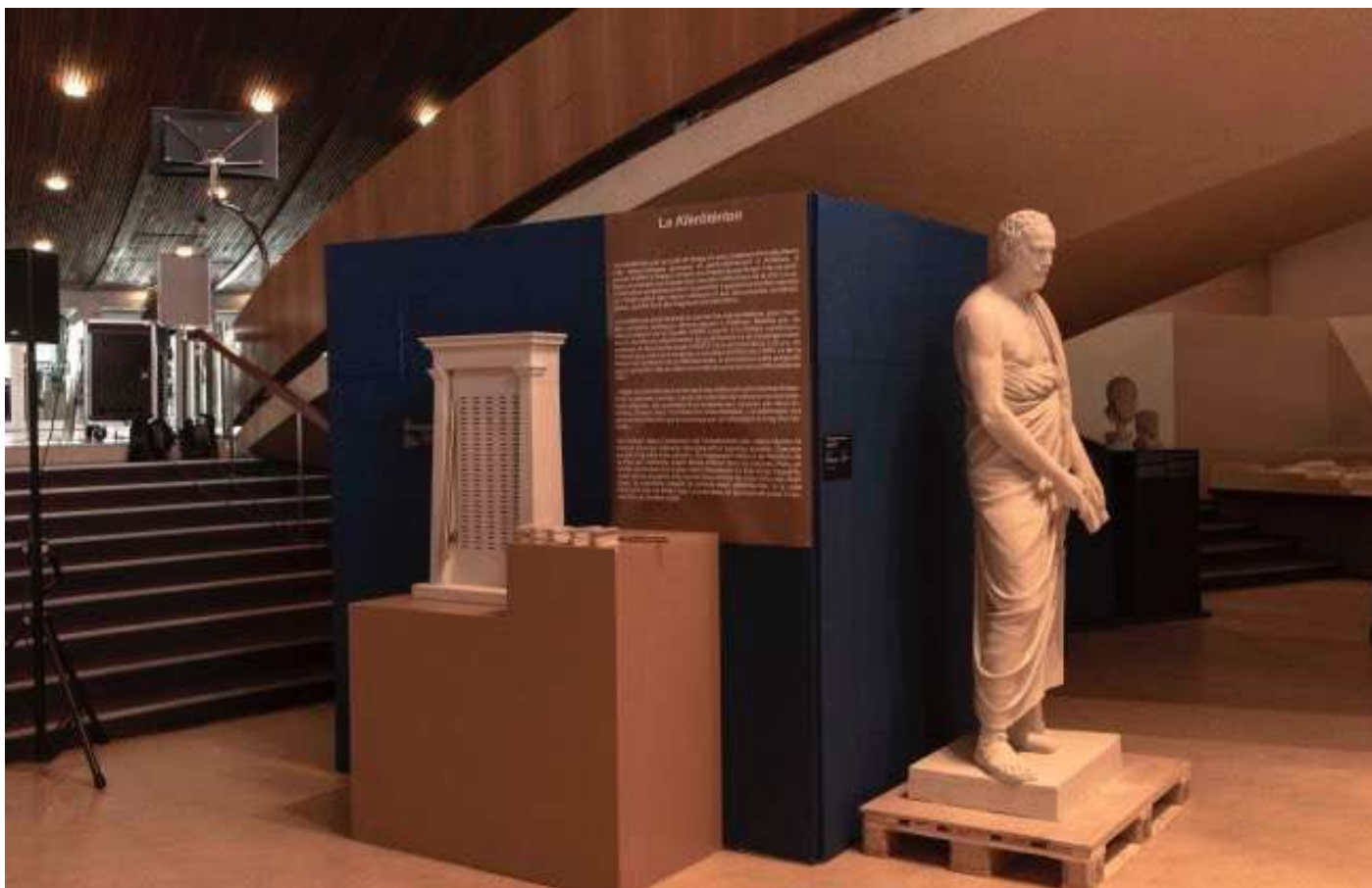
Άποψη της έκθεσης «Αθηναϊκή Δημοκρατία: κληρωτήριο και κλήρωση στην αρχαία Ελλάδα» στο Μουσείο Adolf Michaelis στο Στρασβούργο.