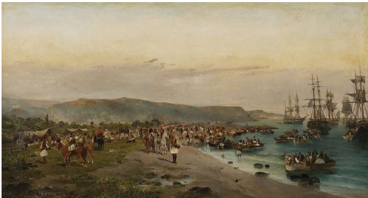
Αρ. Συλλογής: 627 / Τράπεζα της Ελλάδος