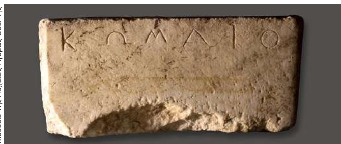
Μουσείο της Αρχαίας Αγοράς Θεσσαλονίκης

Συνεχίζεται στο Μουσείο της Αρχαίας Αγοράς η περιοδική έκθεση «Κώμες και πολιίσματα στον μυχό του Θερμαϊκού κόλπου», η οποία διοργανώνεται από την Εφορεία Αρχαιοτήτων Πόλης Θεσσαλονίκης. Η οργανωμένη ανθρώπινη παρουσία στον μυχό του Θερμαϊκού ήταν αδιάλειπτη από τα νεολιθικά χρόνια μέχρι το 316/315 π.Χ., όταν ο Κάσσανδρος έλαβε την πολιτική απόφαση για την ίδρυση της Θεσσαλονίκης με τη μέθοδο του «συνοικισμού». Σύμφωνα με τον Στράβωνα, κάτοικοι από 26 κώμες και πολιίσματα της περιοχής μετακινήθηκαν για να δημιουργηθεί η νέα πόλη. Στην έκθεση παρουσιάζονται για πρώτη φορά ευρήματα από τις ανασκαφές τεσσάρων από τα πολιίσματα αυτά, τα οποία σήμερα εντάσσονται οργανικά στη σύγχρονη Θεσσαλονίκη. Πρόκειται για τους αρχαίους οικισμούς της Πολίχνης, της Τούμπας Θεσσαλονίκης, της Καλαμαριάς (Καραμπουρνάκι) και της Πυλαίας (Αμαροστάσιο του Μετρό). Από την ίδρυσή της μέχρι σήμερα, η Θεσσαλονίκη έχει εξελιχθεί σε ένα μητροπολιτικό συγκρότημα, στον ιστό του οποίου ενσωματώθηκαν όλες οι φάσεις της