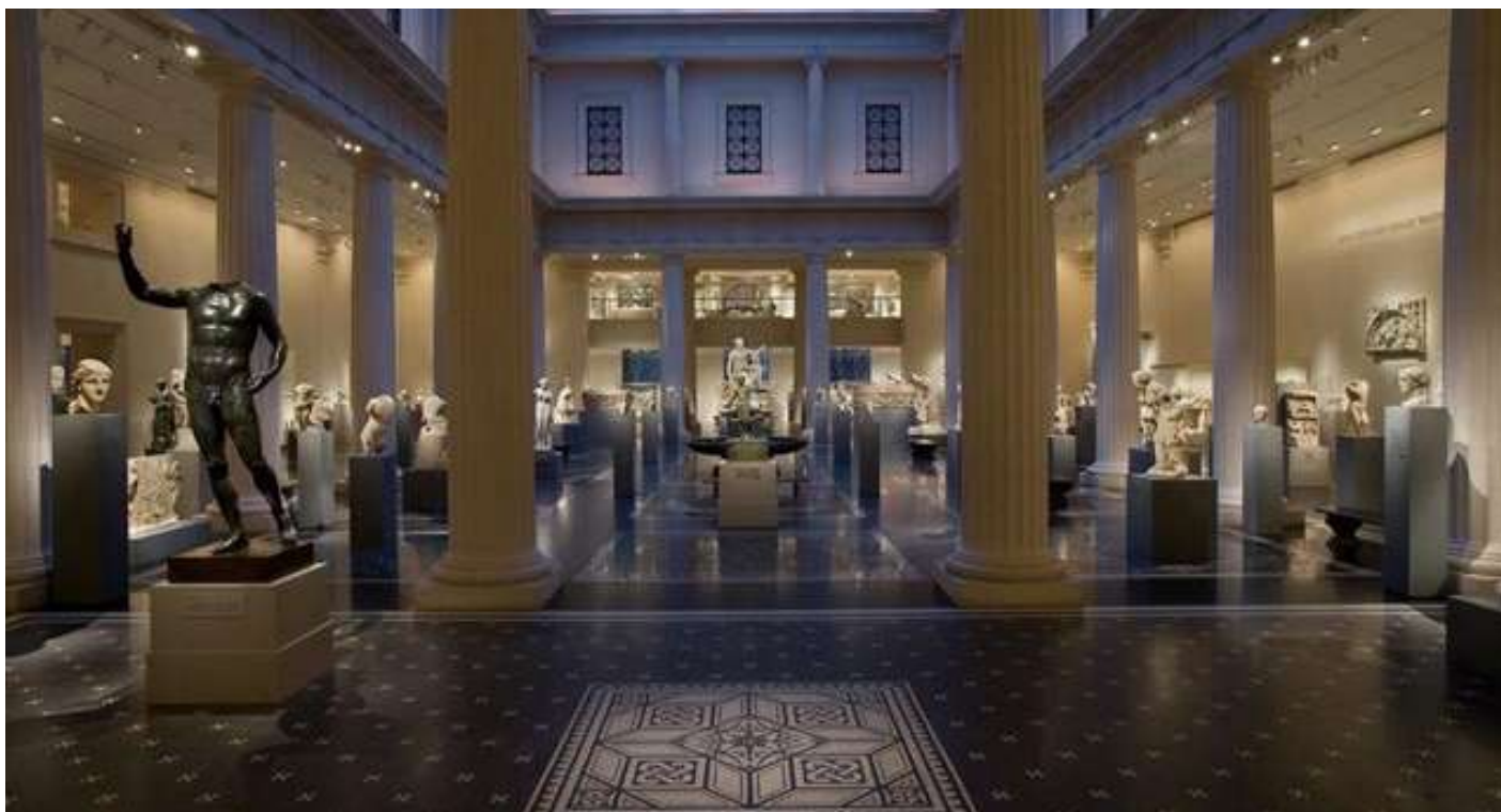
ΕΛΛΗΝΟΡΩΜΑΪΚΟ ΜΟΥΣΕΙΟ ΑΛΕΞΑΝΔΡΕΙΑΣ