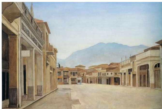
Συλλογή Alpha Bank

Το Μουσείο Μπενάκη, με τη σύμπραξη της Τράπεζας της Ελλάδος, της Εθνικής Τράπεζας και της Alpha Bank, διοργανώνει μεγάλη επετειακή έκθεση για τη συμπλήρωση των 200 χρόνων από την Επανάσταση του 1821. Η έκθεση με τίτλο «1821 πριν και μετά» θα εγκαινιαστεί το Μάρτιο του 2021, θα διαρκέσει έως τον Οκτώβριο του ίδιου χρόνου και θα παρουσιαστεί στο κτήριο του Μουσείου Μπενάκη / Πειραιώς 138, καταλαμβάνοντας το σύνολο των εκθεσιακών του χώρων. Το κτήριο θα καταστεί ένα ζωντανό κύτταρο που θα αφηγείται την ιστορία των νεότερων Ελλήνων από το 1770 έως το 1870. Για 6 μήνες, 100 χρόνια ιστορίας θα αναπτυχθούν σε 3.500 τετραγωνικά μέτρα. Η έκθεση θα αρθρωθεί σε τρεις ενότητες: Η πρώτη θα ξεκινά από το 1770 και τα Ορλωφικά και θα φθάνει έως την έναρξη της Επανάστασης το 1821. Η δεύτερη ενότητα θα αφορά στην εξέλιξη του Αγώνα και θα ολοκληρώνεται με τη διακυβέρνηση του νεοσύστατου κράτους από τον Ιωάννη Καποδίστρια. Τέλος, η τρίτη ενότητα, που θα ξεκινά με την άφιξη του νεαρού βασιλιά Όθωνα το 1833, θα ολοκληρώνεται το 1870. Η εκθεσιακή αφήγηση θα πραγματοποιηθεί μέσα από έργα τέχνης και αρχαιακά τεκμήρια που διαθέτουν στις συλλογές τους οι τρεις τράπεζες, καθώς και μέσα από το πλούσιο υλικό που διαθέτει το Μουσείο Μπενάκη σε τεκμήρια εκείνης της εποχής, τα οποία συγκεντρώθηκαν χάρη στους δεσμούς εμπιστοσύνης που διατήρησε –ήδη από την ίδρυσή του– με τις οικογένειες των αγωνιστών και των πρωταγωνιστών της Επανάστασης του 1821. Μέσα από σημαντικά ζωγραφικά έργα, προσωπικά