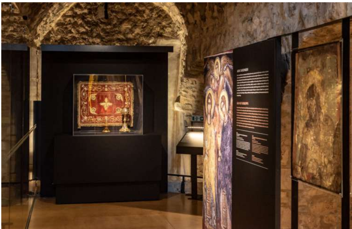
Απόψεις της περιοδικής έκθεσης «Κεντητοί επιτάφιοι στα Ιωάννινα, 18ος και 19ος αι.» στο Μουσείο Αργυροτεχνίας.