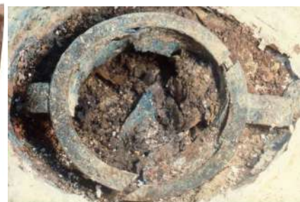
Ο χάλκινος κυπριακός κρατήρας που περιείχε το ύφασμα και τα καμένα οστά του «άρχοντα», όπως βρέθηκε στην ανασκαφή.