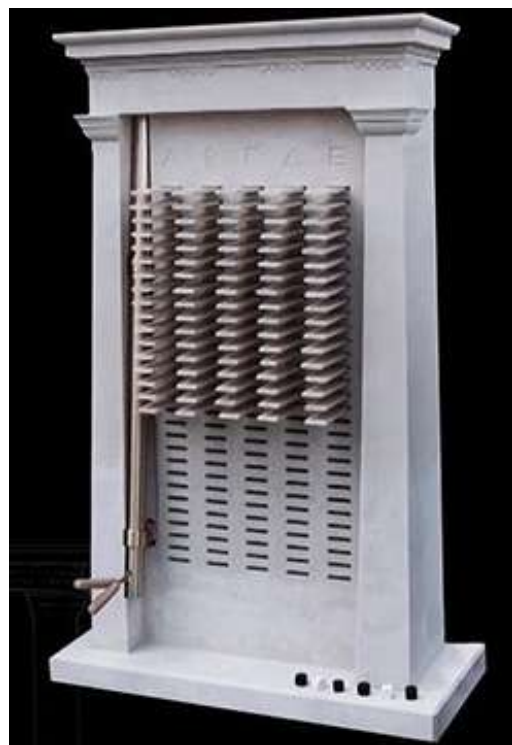
Αρχαίο αθηναϊκό κληρωτήριο, όπως ανασυστάθηκε από το Ινστιτούτο Έρευνας Αρχαίας Αρχιτεκτονικής του CNRS.