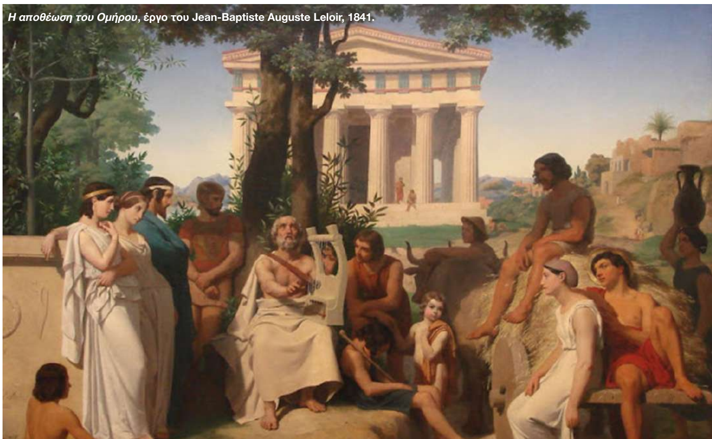
Η αποθέωση του Ομήρου, έργο του Jean-Baptiste Auguste Leloir, 1841.