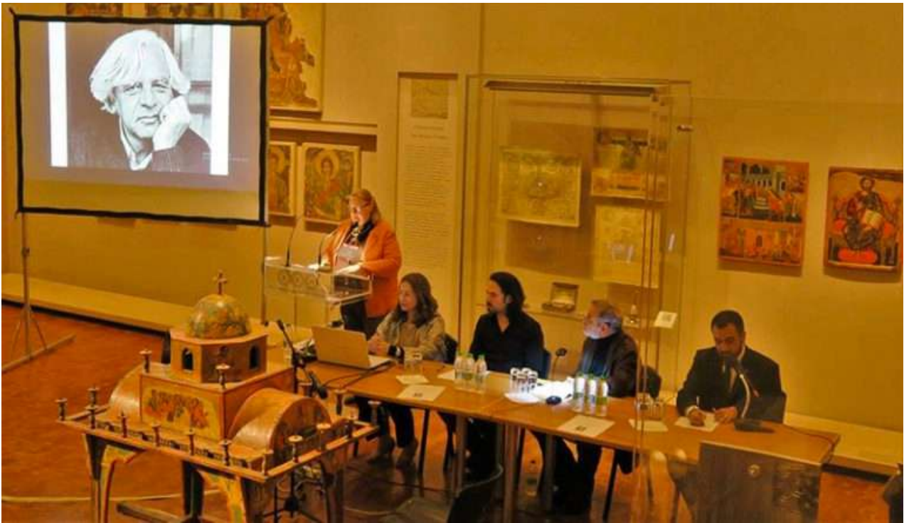
Άποψη από τη Φιλολογική Εσπερίδα αφιερωμένη στη μνήμη του Ηλία Κόλλια, στο Βυζαντινό και Χριστιανικό Μουσείο, 2-3-2019.

λα και μικρά συμφέροντα, πολιτικές παρεμβάσεις και τις διαχρονικές αναπηρίες του κρατικού μηχανισμού, η Δημόσια Αρχαιολογία οφείλει να προστατεύει τα μνημεία και να παράγει πρωτότυπο επιστημονικό έργο, το οποίο να ελέγχεται από την επιστημονική κοινότητα και, ταυτόχρονα, να διαχέεται στην κοινωνία. Αυτό το πολυπαραγοντικό περιβάλλον εντός του οποίου παράγεται το αρχαιολογικό έργο, και ιδίως η άμεση απόκριση με την κοινωνία, επιτρέπει στη Δημόσια Αρχαιολογία να εξελίσσεται και να αναστοχάζεται αέναα το παρελθόν, επιχειρώντας να απαντήσει στα ερωτήματα που μας θέτει απευθείας το ίδιο το συλλογικό υποκείμενο. Με άλλα λόγια, ο λειτουργός της Δημόσιας Αρχαιολογίας δεν εκθέτει το έργο του μόνο στα κλειστά συνέδρια των επαϊόντων. Υποχρεούται να τα υποβάλει και στη βάση της δημόσιας κριτικής, να βγει στην αγορά και, αφού αφουγκραστεί τους προβληματισμούς των πολλών, να επιχειρήσει να απαντήσει σε αυτούς με το έργο του.