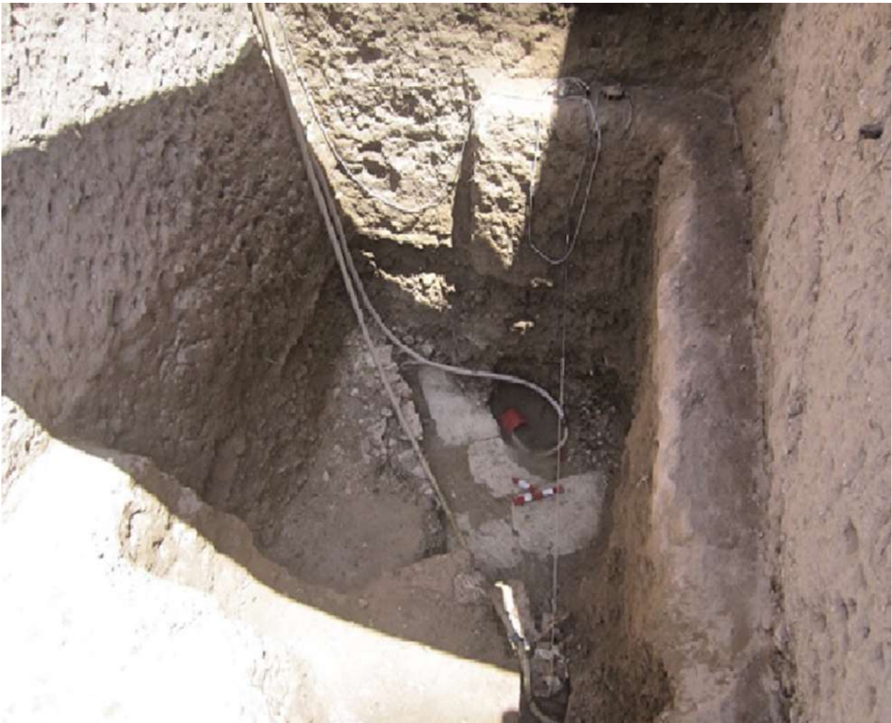
10. Θεμελίωση κτηρίου από δόμους ασβεστόλιθου στο σημείο N2 του πάρκου.

πρώτη παράλληλη προς Β της Κανωπικής οδού. Κάτω από την οδό, εντοπίσαμε τον αγωγό ακαθάρτων υδάτων, κατασκευασμένο στον γνωστό τοξωτό τύπο, που συναντούμε σε πολλές ανασκαφές στην Αλεξάνδρεια.