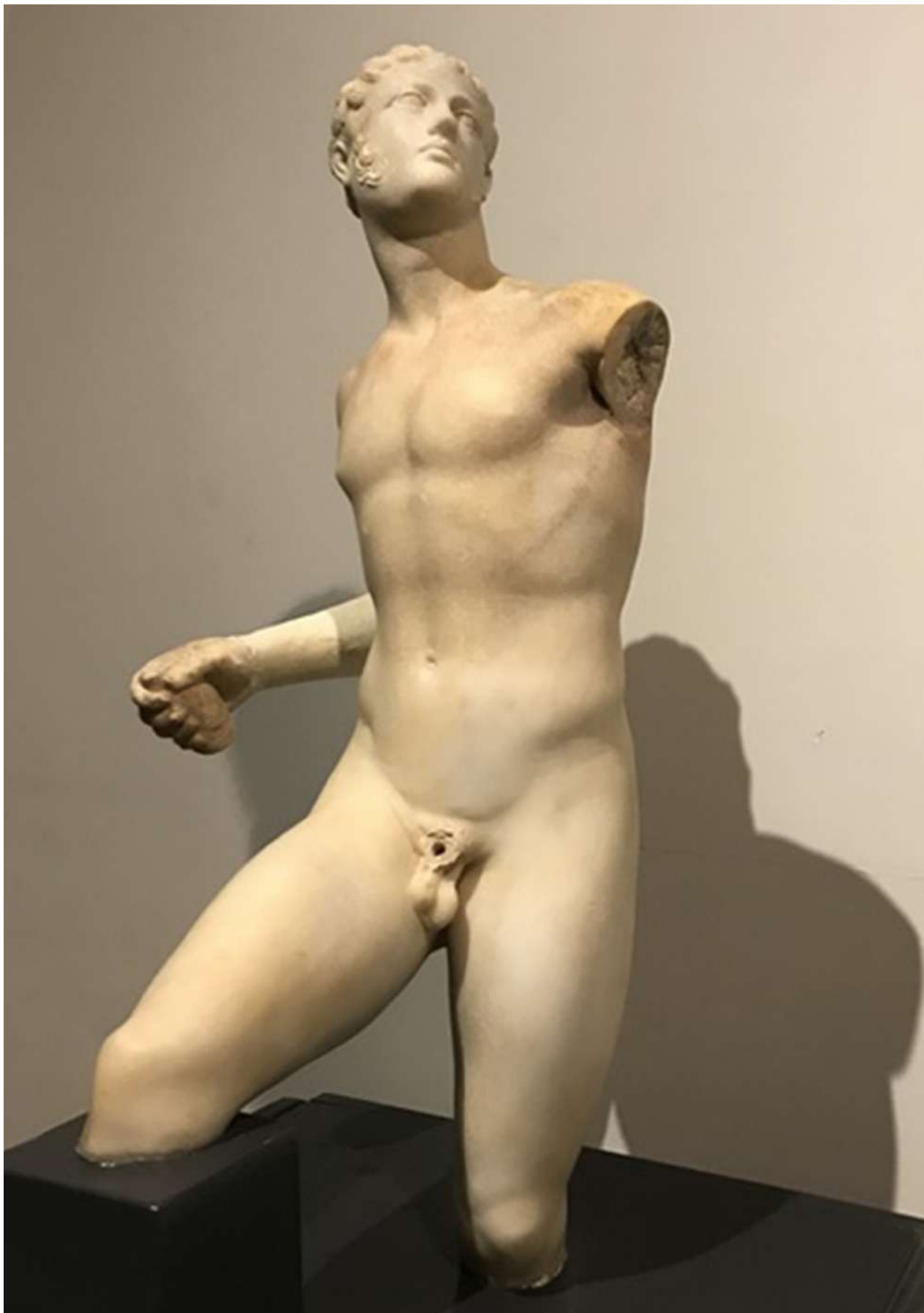
4. Αλέξανδρος Δορυφόρος, έργο της Σχολής του Λυσίππου. Μουσείο Αλεξάνδρειας.