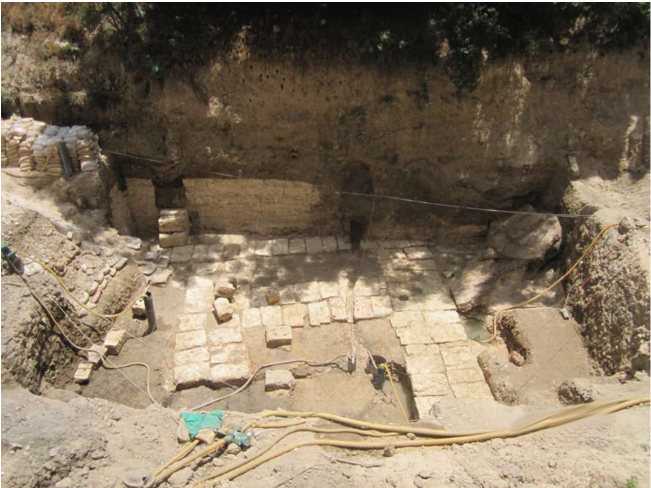
5. Κήποι Σαλλαλάτ Αλεξάνδρειας. Η αποκάλυψη μέρους της θεμελίωσης μνημειακού κτηρίου (φωτ.: Ε.Ι.Ε.Α.Π.).

ΝΔ, βρέθηκαν δόμοι διατηρημένοι σε μεγαλύτερο ύψος, κτισμένοι χωρίς συνδετικό υλικό, σχηματίζοντας τοίχους ή κρηπίδωμα.