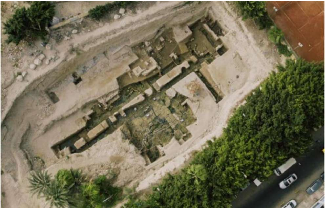
11. Ο χώρος ανασκαφής στους Κήπους Σαλαλλάτ της Αλεξάνδρειας.

σε τομή διαστάσεων 7,50 X 4,50 μ και σε βάθος 3,50 μ, εντοπίστηκε στρώμα που περιείχε ισλαμική κεραμική. Αξιοσημείωτο είναι ότι στο ίδιο στρώμα υπήρχαν τμήματα των χαρακτηριστικών μαύρων λίθων των ρωμαϊκών οδών. Πιστεύουμε ότι από αυτό το σημείο διερχόταν η κύρια κάθετη οδική αρτηρία R1 της αρχαίας Αλεξάνδρειας.