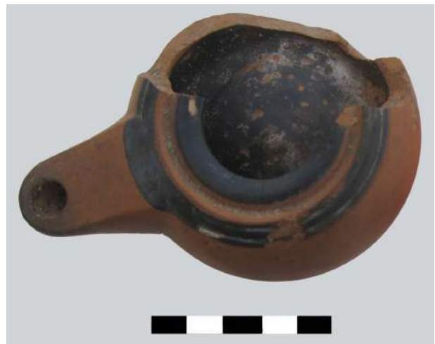
6. Λύχνος της πρώιμης Ελληνιστικής περιόδου.

Κατά την περίοδο Απριλίου-Ιουλίου 2017, η ανασκαφή συνεχίστηκε προς ΝΔ, ακολουθώντας την έκταση της θεμελίωσης. Στο ίδιο σημείο και σε