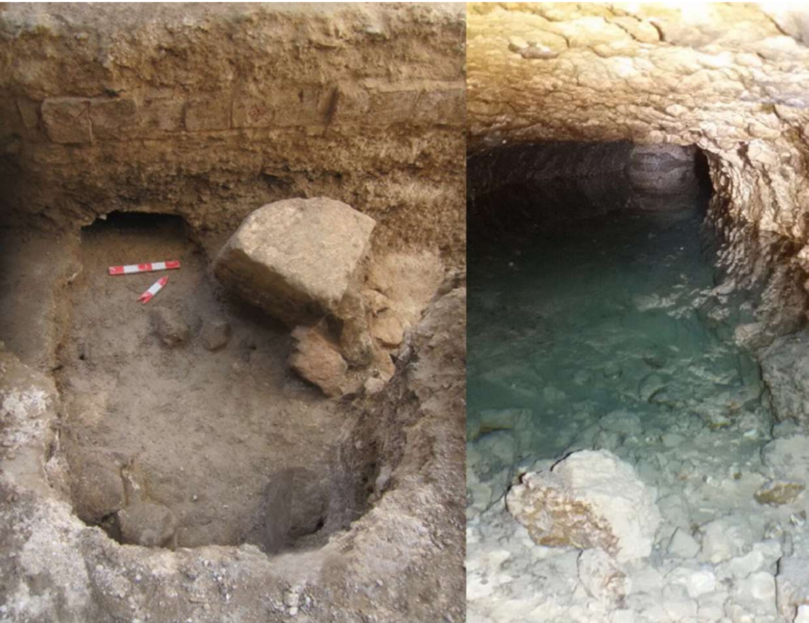
7. Σήραγγα λαξευμένη στη λατύπη, κάτω από το δάπεδο ρωμαϊκής δεξαμενής.

βάθος 7,5μ., αποκαλύφθηκε τμήμα ρωμαϊκής υδραυλικής κατασκευής, πιθανώς δεξαμενής. Το δάπεδό της αποτελείται από στρώμα πλίνθων καλής ποιότητας με κονίαμα ροδόχρουν. Στη δυτική πλευρά αυτής της εξαιρετικής κατασκευής, κάτω από το δάπεδο, εντοπίστηκε σήραγγα λαξευμένη στη λατύπη (εικ. 7). Νότια αυτής της κατασκευής, ανασκάφηκε τμήμα του στρώματος καταστροφής του ρωμαϊκού κτηρίου, αποτελούμενο από πλίνθους και μεγάλους δόμους από ασβεστόλιθο, προερχόμενους από το ελληνιστικό κτήριο, προ-