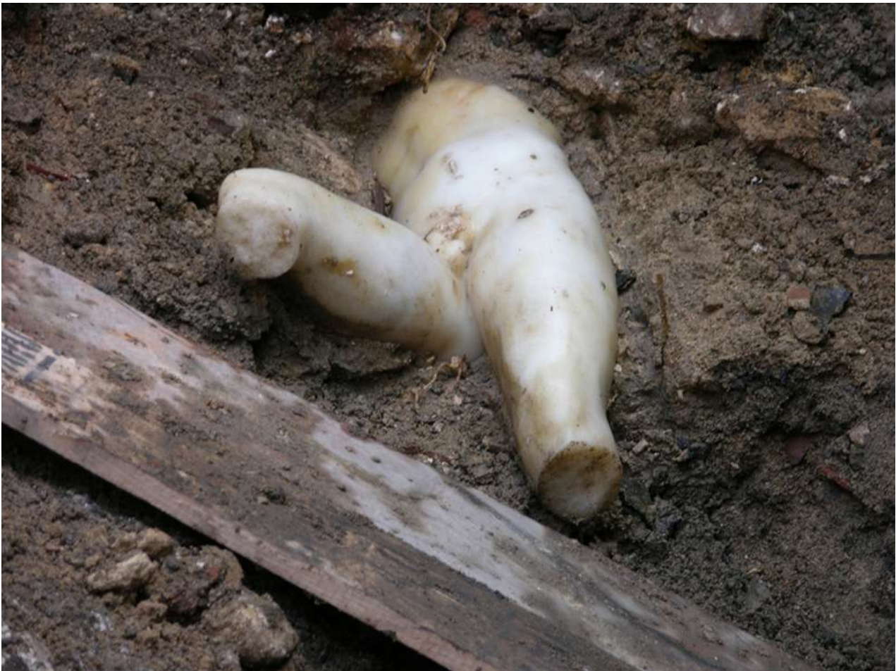
3. Η ανακάλυψη του μαρμάρινου αγάλματος σε επίχωση ελληνορωμαϊκών χρόνων (φωτ.: Ε.Ι.Ε.Α.Π.).

(τελευταίο τέταρτο 4ου αι. π.Χ.). Επτά χρόνια αργότερα, τον Νοέμβριο του 2016, «τύχη αγαθή», ήλθε στο φως η χαμένη δεξιά παλάμη του αγάλματος, στην οποία διατηρείτο τμήμα πιθανώς δόρατος. Αυτό το στοιχείο ενισχύει την άποψή μας ότι το Μουσείο Αλεξάνδρειας φιλοξενεί ένα από τα πιο σημαντικά αγάλματα της Σχολής του Λυσίππου, τον Αλέξανδρο Δορυφόρο (εικ. 4).