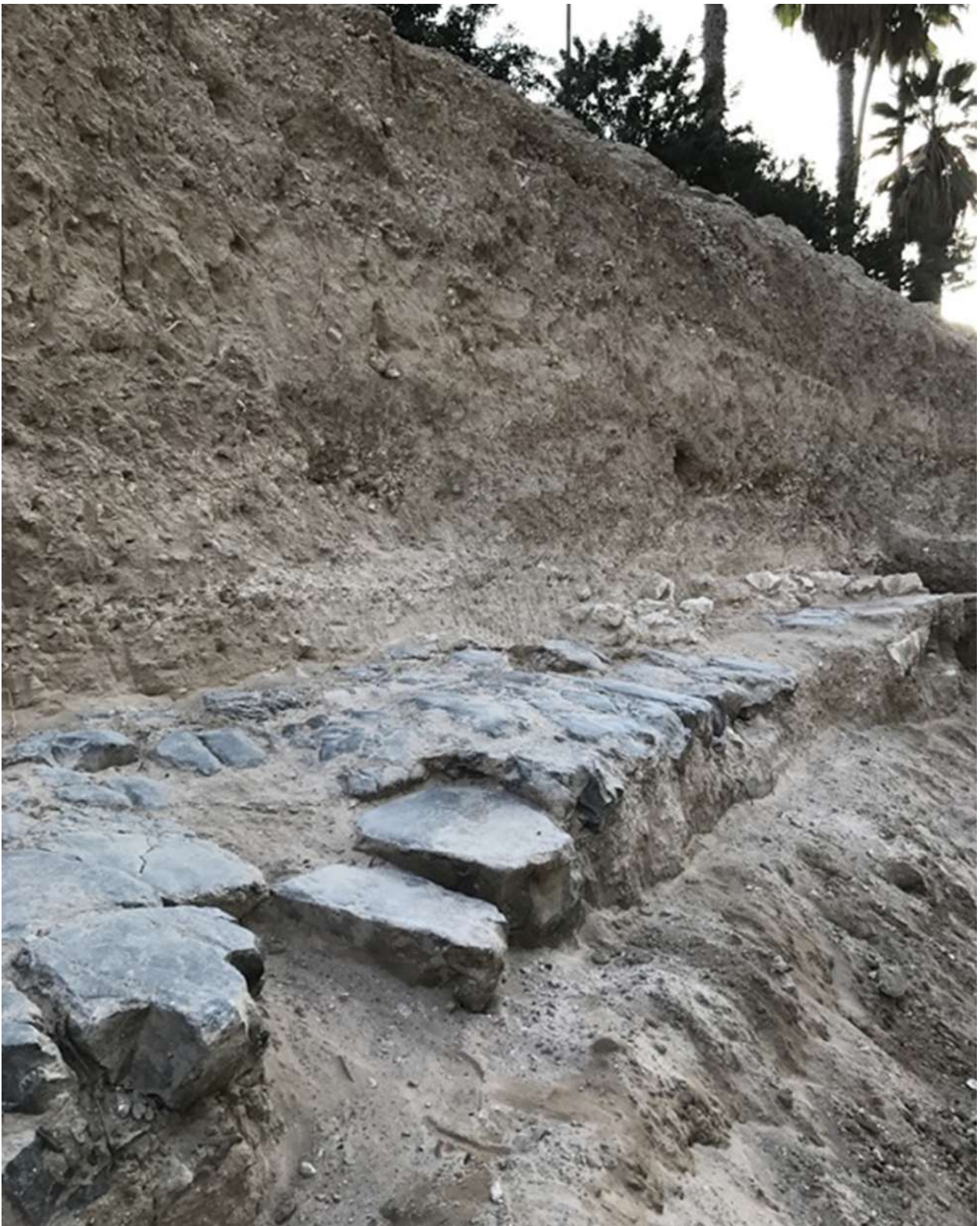
8. Τμήμα ρωμαϊκής οδού, κατασκευασμένης από μαύρους λίθους του Ασσουάν, που ανακαλύφθηκε πάνω από ελληνιστική θεμελίωση.