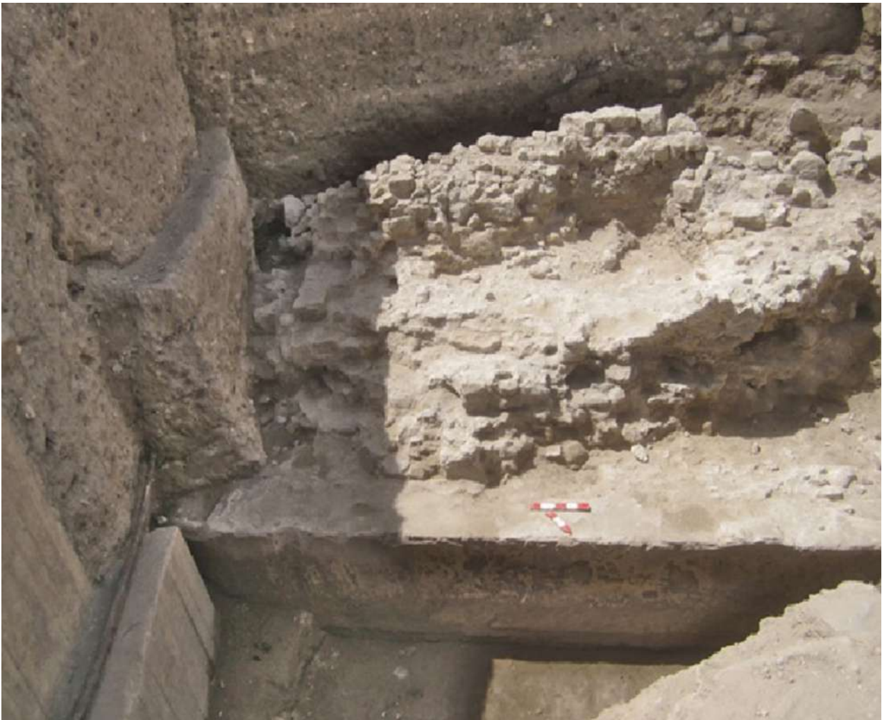
9. Τμήμα οχυρωματικού τείχους που ανακαλύφθηκε στην τομή S3 (φωτ.: Ε.Ι.Ε.Α.Π.).

Προς το τέλος του 2017, απομακρύναμε μεγάλες ποσότητες σύγχρονων επιχώσεων προς νότο και κατορθώσαμε να επεκτείνουμε την τομή διευκολύνοντας την ανασκαφή, εκτός από το μόνιμο πρόβλημα της παρουσίας του νερού. Εκεί, ανασκάψαμε τμήματα ύστερων κατασκευών με δόμους επίσης σε δεύτερη χρήση.