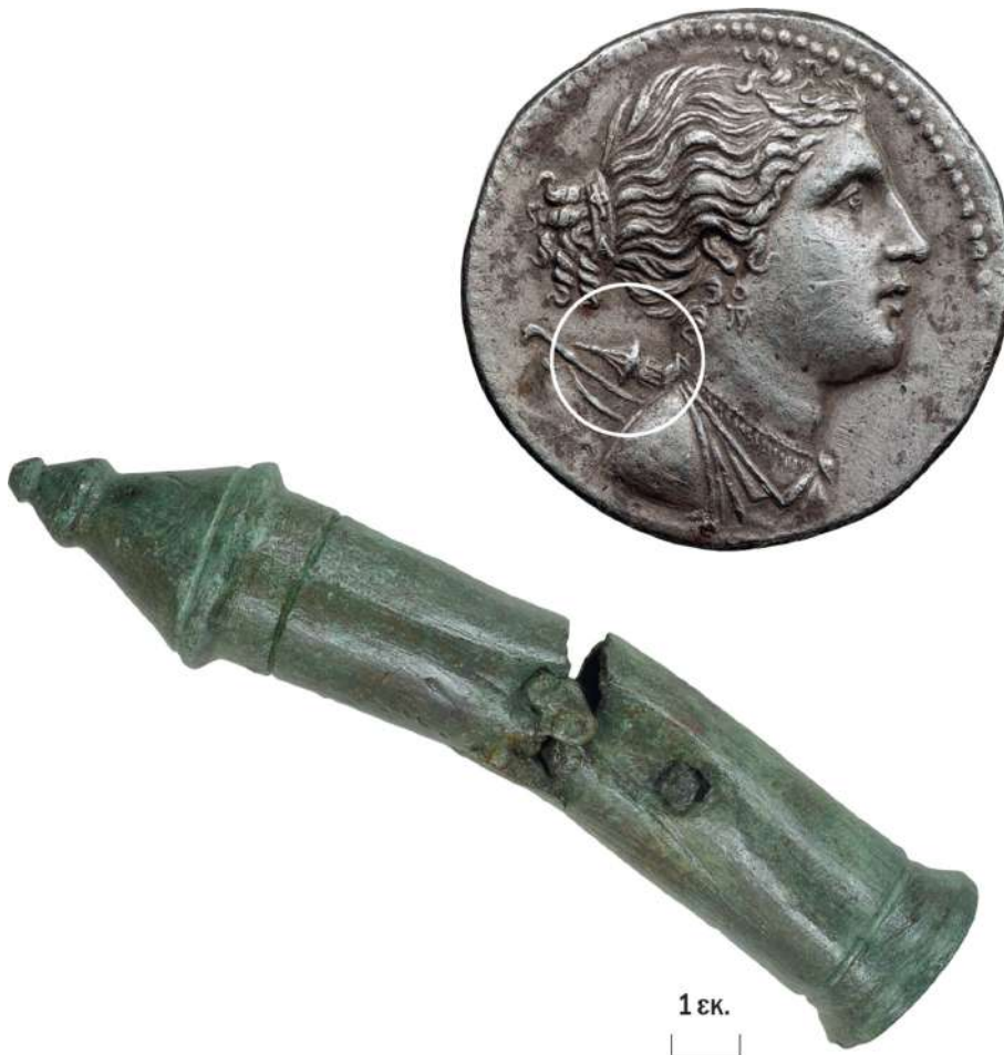
5. Κάτω: χάλκινη φαρέτρα από το ιερό της Αμαρυσίας Αρτέμιδος. Άνω: τετράδραχμο της Ερέτριας, στο οποίο η θεά Άρτεμις φέρει όμοια φαρέτρα.

Εάν το κτήριο 6 μπορεί να ταυτιστεί με ναό, πράγμα πολύ πιθανό, αντιθέτως η χρήση μιας ομάδας μικρών κτηρίων στα νότια του (εικ. 2 αρ. 8) παραμένει ακόμα σκοτεινή. Πρόκειται άραγε για μικρούς θησαυρούς, όπως αυτοί που έχουν βρεθεί στα μεγάλα ιερά των Δελφών και της Ολυμπίας; Μόνο η συνέχιση της ανασκαφής θα μπορούσε να δώσει απαντήσεις σε αυτό το ερώτημα.