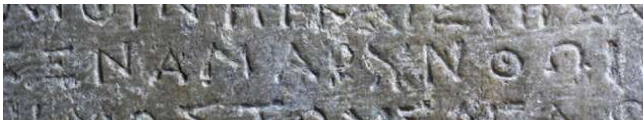
8. Ψήφισμα που αναφέρει το τοπωνύμιο της Αμαρύνθου.

Άμαρυσίαν Άρτεμιν) ή στον δήμο των Κυδαθηναίων, όπου βρισκόταν ιερόν της Αρτέμιδος (τῆς Ἄθμονόθεν Ἀμαρυσίας, IG Ι 3 426).