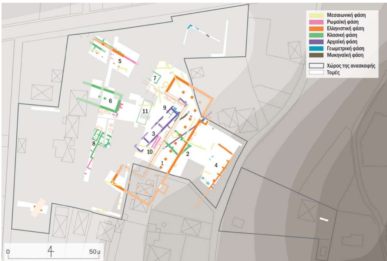
2. Κάτοψη του Ιερού της Αμαρυσίας Αρτέμιδος στην Αμάρυνθο.

Εντός μικρής αρχαιολογικής τομής, που πραγματοποιήθηκε το 2007 στους πρόποδες αυτού του λόφου από την Ελβετική Αρχαιολογική Σχολή στην Ελλάδα (ESAG) σε συνεργασία με την Εφορεία Αρχαιοτήτων Ευβοίας, οι ανασκαφείς εντόπισαν τοιχοποιία Πρωτογεωμετρικών χρόνων (10ος αι. π.Χ.), η οποία καλυπτόταν μερικώς από μεγάλη