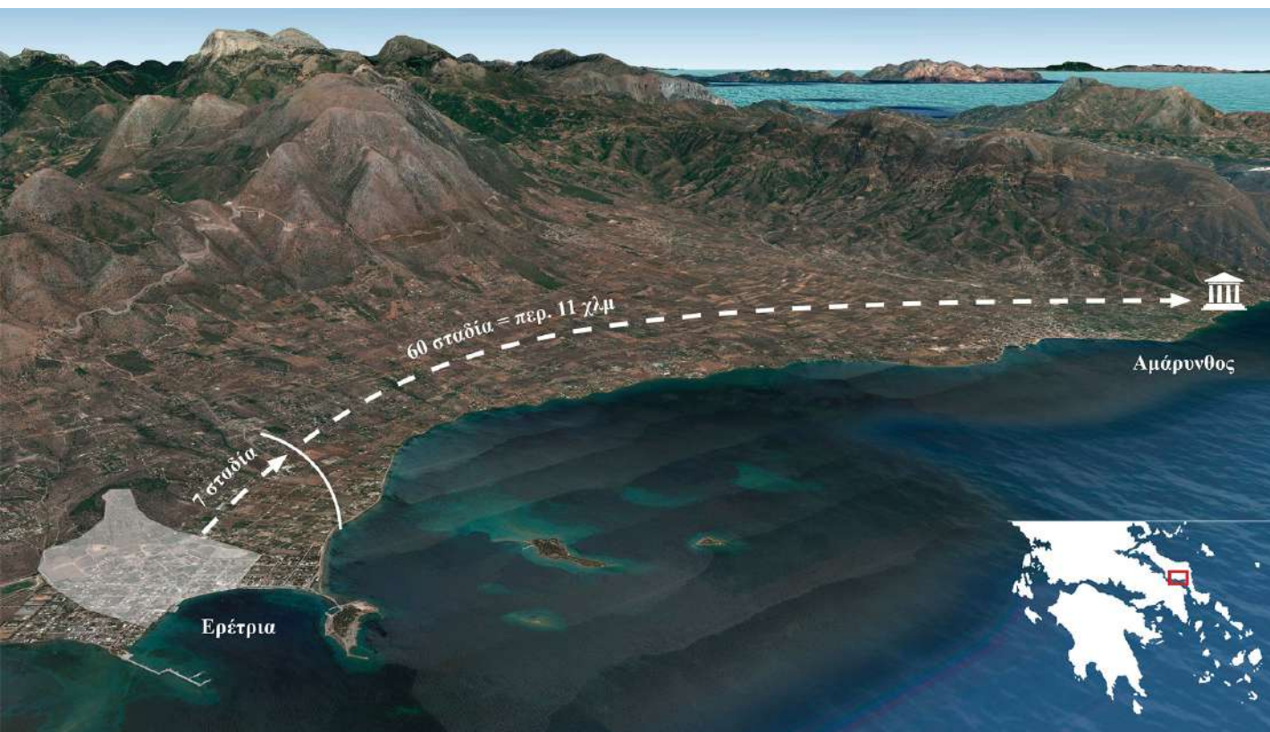
1. Χάρτης (από Google earth) με την απόσταση του Ιερού της Αρτέμιδος από την Ερέτρια. Ο χάρτης σχεδιάστηκε από την ESAG/ΕΑΣΑ.

Η ύπαρξη του ιερού της Αμαρυσίας Αρτέμιδος στην Αμάρυνθο Ευβοίας ήταν γνωστή μόνο από τις γραπτές πηγές. Κατ' αρχήν, πρέπει να αναφέρουμε τον γεωγράφο Στράβωνα, ο οποίος συνέγραψε τον 1ο αι. π.Χ. το μεγάλο έργο του για τη γεωγραφία του αρχαίου κόσμου. Στο πρώτο κεφαλαίο του 10ου βιβλίου, αφιερωμένου στη γεωγραφία της Ευβοίας, μνημονεύει πολλές φορές το εν λόγω ιερό. Σε μία παράγραφο (Χ, 1, 12), αναφέρει μία συμφωνία, η οποία καθορίζει τις συνθήκες μάχης μεταξύ των πόλεων της Ερέτριας και της Χαλκίδας. Αυτή η συμφωνία, με την οποία οι δυο πόλεις αποδέχονται να μην χρησιμοποιούν τηλεβόλα όπλα, ήταν γραμμένη σε μια στήλη που είχε ανεγερθεί στο ιερό της Αμαρύνθου ( έν τῷ Ἀμαρυνθίῳ στήλῃ ).