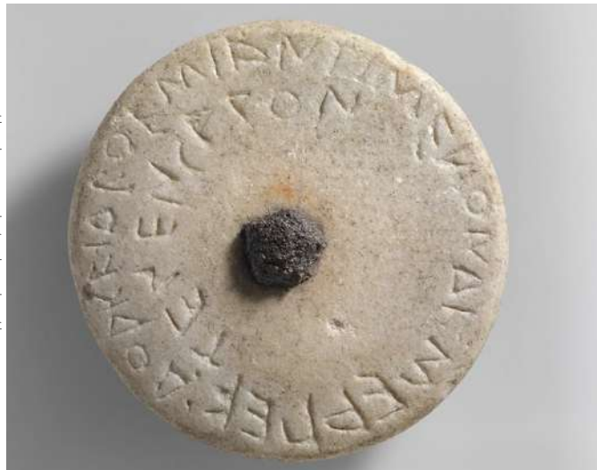
Ενεπίγραφος μαρμάρινος δίσκος, Άκανθος, τέλη 6ου - αρχές 5ου αι. π.Χ.

ΥΠΠΟΑ / ΕΒΑ Χαλκιδικής & Αγίου Όρους / φωτ. Ο. Κουράκης