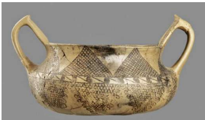
Κανθαρόσχημο αγγείο με αμαυρόχρωμη διακόσμηση της Ύστερης Εποχής Χαλκού (12ος/11ος αι. π.Χ.) από τις μεταπολεμικές ανασκαφές των Άγγλων στην Καλίνδρια Κιλίκ.