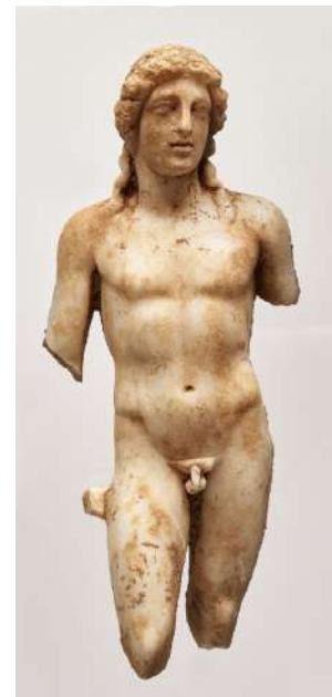
ΥΠΠΟΑ / ΕΦΑ Χανίων