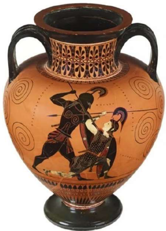
The Devonshire Collections, Chatsworth

Ο ήρωας Αχιλλέας σκοτώνει την Αμαζόνα βασίλισσα Πενθεσίλεια, αγωνιζόμενη στην πλευρά της Τροίας. Μελανόμορφος αμφορέας, π. 530 π.Χ.