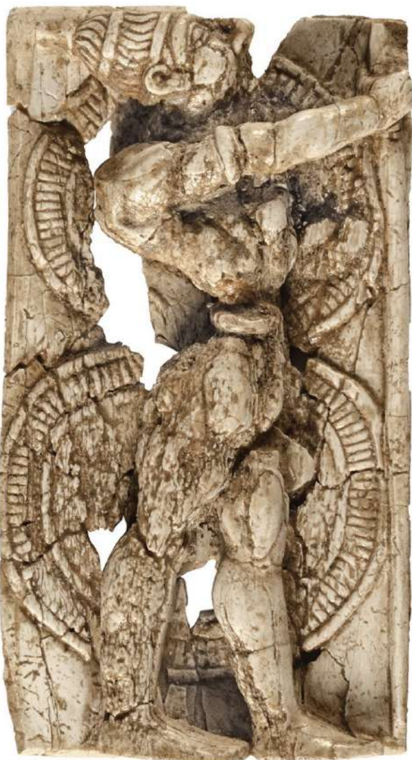
Ελεφαντοστέινο πλακίδιο πολεμιστή από το Αρτεμίσιο της Δήλου (14ος-13ος αι. π.Χ.)

Σκοπός της έκθεσης ήταν να αναδειχθεί η συμβολή των Κυκλάδων στον Μυκηναϊκό πολιτισμό στο Αιγαίο παρουσιάζοντας, μεταξύ άλλων, άγνωστες στο ευρύ κοινό αρχαιότητες και συνθέτοντας ένα πανόραμα του Μυκηναϊκού πολιτισμού στις Κυκλάδες. Περισσότερα από 150 επιλεγμένα αντικείμενα, αντιπροσωπευτικά έργα κεραμικής, μεταλλοτεχνίας, μικροτεχνίας, ειδωλοπλαστικής, κοσμηματοποιίας, αποκάλυψαν όψεις της θαυμαστής πολιτισμικής κληρονομιάς του μυκηναϊκού κό-