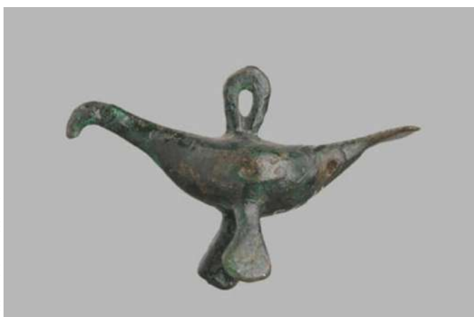
Χάλκινη πυξίδα (8ος/7ος αι. π.Χ.) γυναικείας ταφής από νεκροταφείο στην Ποντοηράκλεια (Τσαουσίτσα).