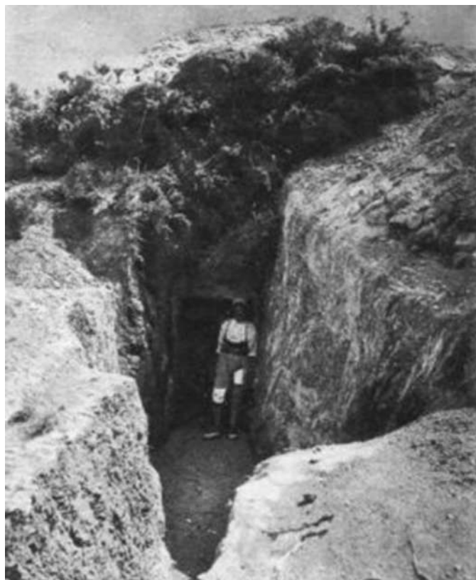
Χαράκωμα στο Μακεδονικό Μέτωπο.

Η δομή της έκθεσης αναπτύσσεται σε τρεις θεματικές ενότητες: «Ο Μεγάλος Πόλεμος και το Μακεδονικό Μέτωπο», «Το Κιλίκις στη σκιά του πολέμου» και «Οι ανασκαφικές τομές στα χαρακώματα».