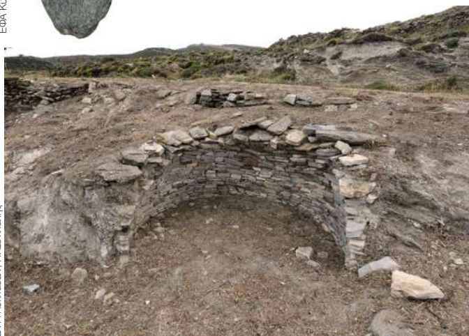
Ο θολωτός τάφος της Αγίας Θέκλας, στην Τήνο.