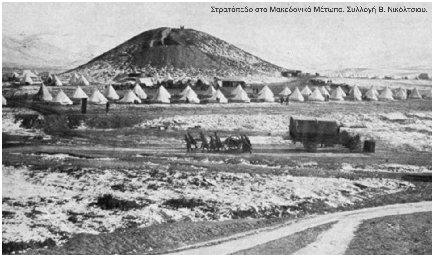
Στρατόπεδο στο Μακεδονικό Μέτωπο.