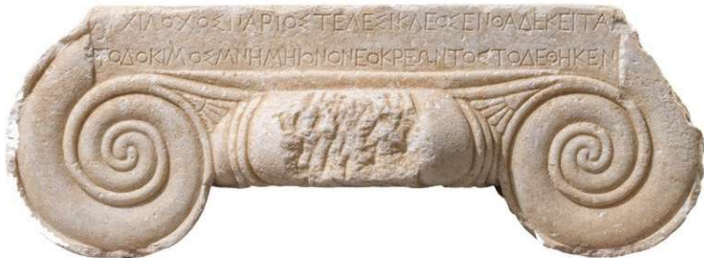
Αρχαιολογικό Μουσείο Θεσσαλονίκης