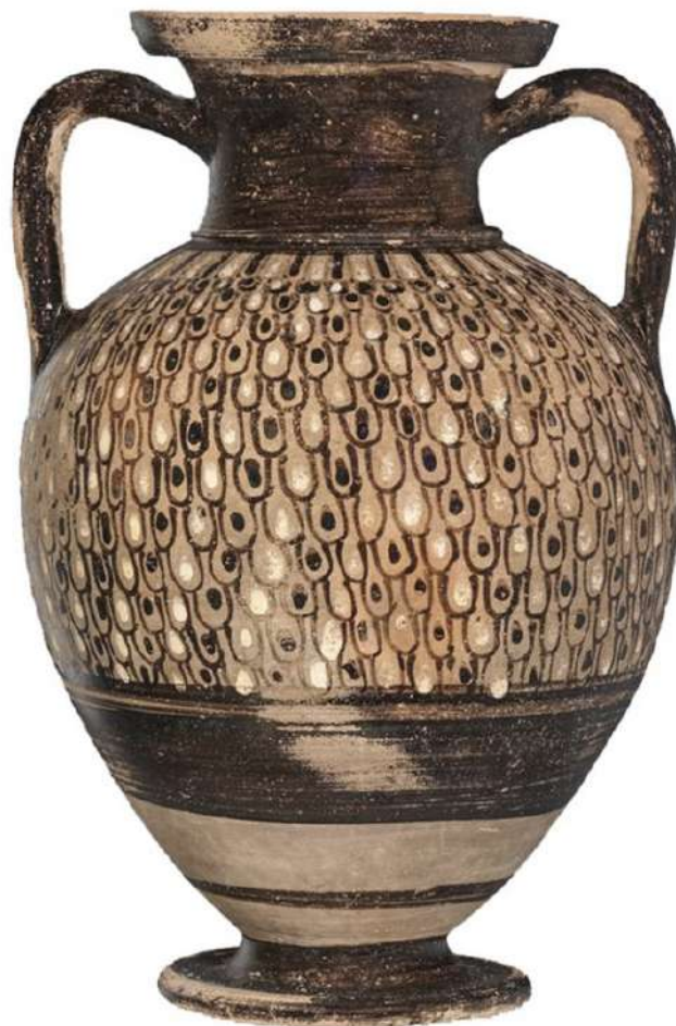
ΥΠΠΟΑ / ΕΦΑ Χαλκιδικής & Αγίου Όρους