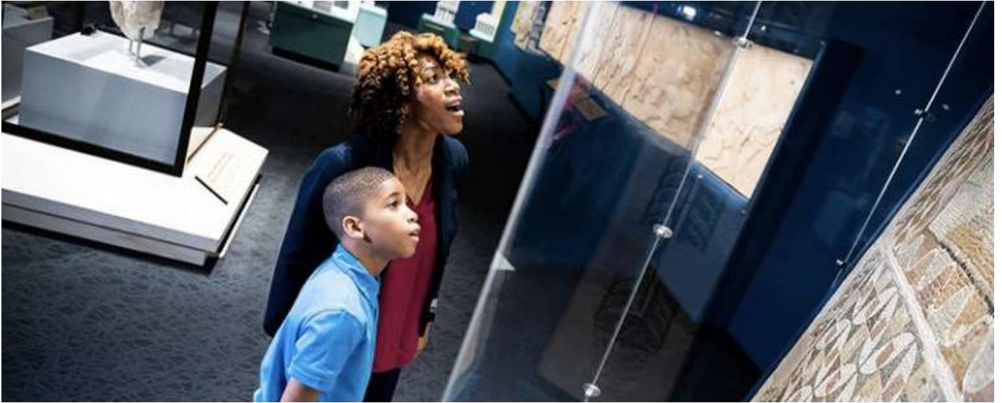
«Θησαυροί της Αρχαίας Ελλάδας: Ζωή, Μύθος και Ήρωες», The Children's Museum of Indianapolis.