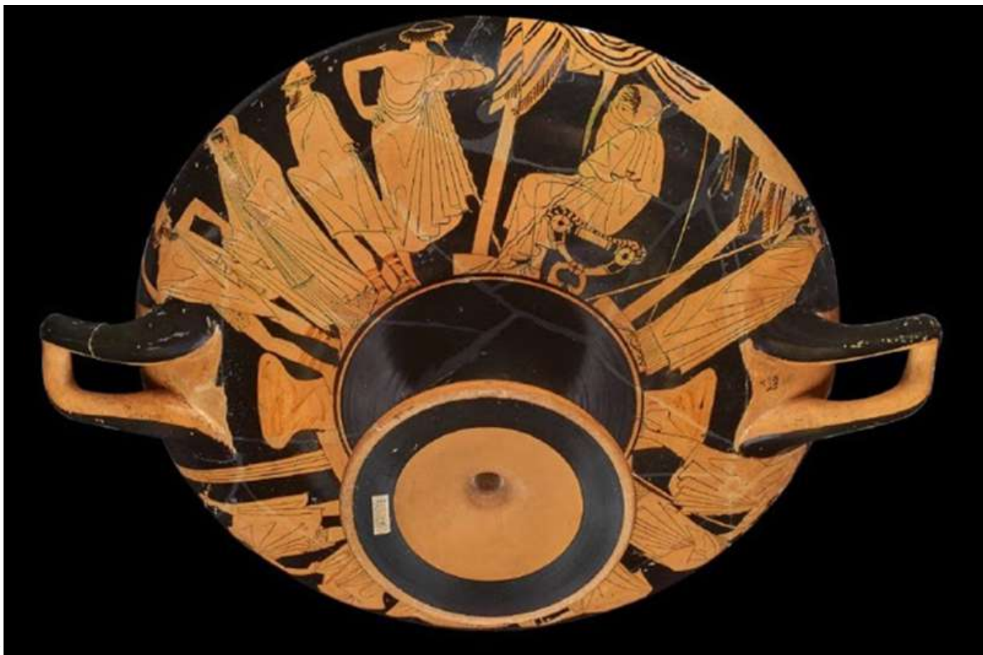
Αθηναϊκή κύλικα, στην οποία εικονίζεται ο Αχιλλέας να στέκεται απομακρυσμένος και θυμωμένος μέσα στη σκηνή του, τυλιγμένος στον μανδύα του, καθώς δύο έφηβοι οδηγούν το βραβείο του, την υποδουλωμένη Βρισηίδα.

ευκαιρία στους επισκέπτες να ακολουθήσουν τη γραμμή μεταξὺ μύθου και πραγματικότητας -από την απαγωγή της Ωραίας Ελένης και το καθοριστικό τέχνασμα του Δούρειου Ίππου, μέχρι την πτώση της πόλης. Η συναρπαστική τέχνη που αναπαριστά τους ήρωες της Τροίας, από τα θαυμαστά αρχαία γλυπτά και τις εξαιρετικές ζωγραφιές αγγείων έως τα σύγχρονα έργα που θα αποτελούν τα εκθέματα, θα ξαναζωτανέψει αυτούς τους μαγευτικούς χαρακτήρες, τον Αχιλλέα, τον Οδυσσέα, τον Αγαμέμνονα, τον Έκτορα, την Ανδρομάχη, τον Πάρι που έχουν εμπνεύσει τόσες πολλές φορές -από τον Όμηρο μέχρι τον Σαίξπηρ, αλλά και το Χόλιγουντ!