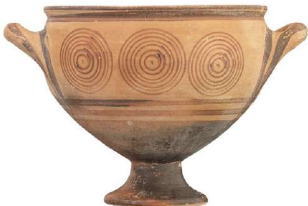
ΥΠΠΟΑ / ΕΦΑ Κυκλάδων

Η έκθεση επικεντρώθηκε στο φαινόμενο του αποικισμού του βόρειου Αιγαίου από τους Κυκλαδίτες, λίγο πριν από τα μέσα του 7ου αι. π.Χ., όταν οι Άνδριοι σε συνεργασία με τους Χαλκιδίεις, ίδρυσαν αποικίες στην ανατολική Χαλκιδική και τον Στρυμονικό κόλπο, και οι Πάριοι εγκαταστάθηκαν στη Θάσο και