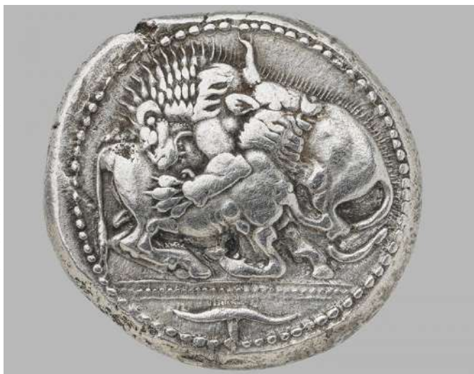
Αργυρό τετράδραχμο Ακάνθου, 525-500 π.Χ.