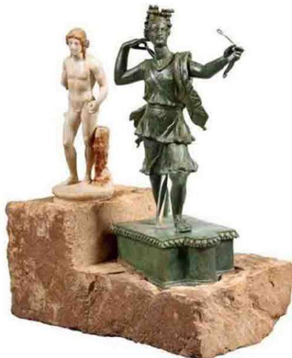
ΥΠΠΟΑ / ΕΦΑ Χανίων

Είχαν πιθανότατα εισαχθεί από καλλιτεχνικά κέντρα εκτός της Κρήτης, προκειμένου να αποτελέσουν το οικιακό ιερό της ρωμαϊκής πολυτελούς οικίας που κοσμούσαν. Η καταρχήν χρονολόγησή τους μπορεί να προσδιοριστεί στο β' ήμισυ του 1ου με αρχές 2ου αι. μ.Χ. Τα αγαλματίδια θα παρουσιασθούν τον Δεκέμβριο στην Αθήνα, στο πλαίσιο διεθνούς συνεδρίου Ρωμαϊκής γλυπτικής.