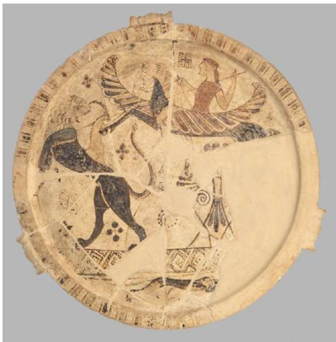
Πινάκιο με παράσταση Βελλερεφόντη και Χίμαιρας, Θάσος, μέσα 7ου αι. π.Χ.