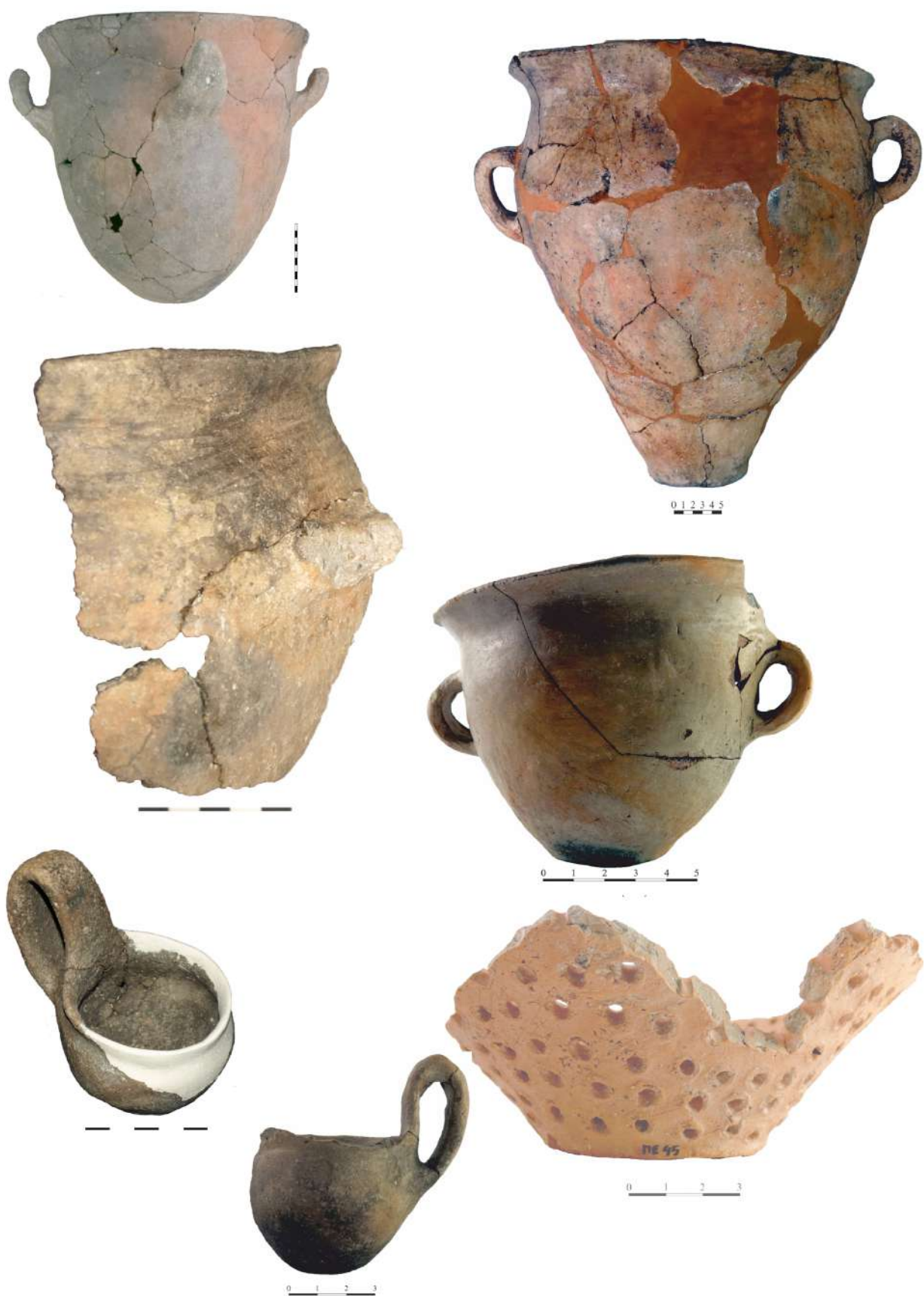
11. «Ασβεσταριά» Πετρωτού Τρικάλων. Κεραμική.