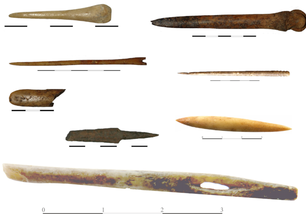
14. «Ασβεσταριά» Πετρωτού Τρικάλων. Οστέινα.