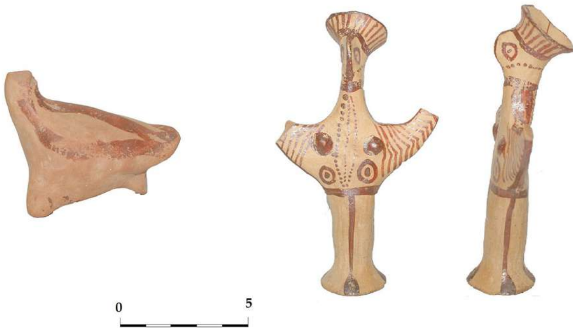
9. «Ασβεσταριά» Πετρωτού Τρικάλων. Ταφικά κτερίσματα. Ειδώλια.

ενάλλα γραμμίδια, οι σπείρες, η «ρακέτα», η πορφύρα κ.ά. Δεν λείπουν τα αγγεία με πλαστικό διάκοσμο, καθώς και δύο πτηνόσχημα αγγεία. Αξιοσημείωτος είναι ο μεγάλος αριθμός «εισηγμένων» αγγείων από τη νότιο Ελλάδα, κυρίως από την Αργολίδα.