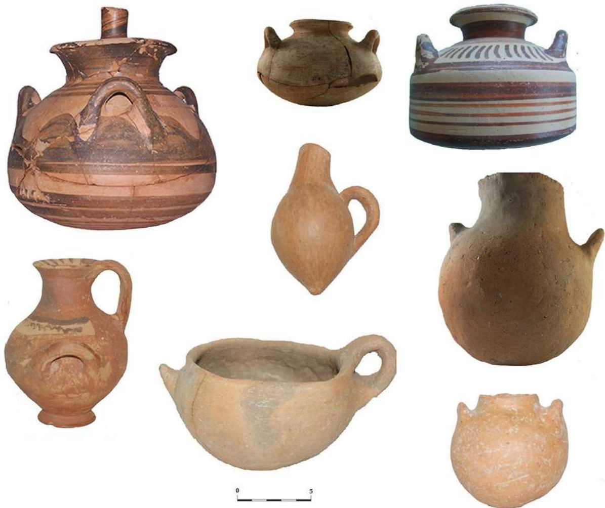
8. «Ασβεσταριά» Πετρωτού Τρικάλων. Ταφικά κτερίσματα. Κεραμική.

έδειξε ότι οι παθήσεις που σχετίζονται με το μυοσκελετικό σύστημα καταλαμβάνουν μεγαλύτερο ποσοστό σε αντίθεση με τις ασθένειες που αφορούν στη φυσιολογία του οργανισμού. Από τις παθήσεις που έχουν καταγραφεί, το μεγαλύτερο ποσοστό καταλαμβάνει η οστεοαρθρίτιδα (23%) και ακολουθεί η υποπλασία της αδαμαντίνης (15%). Εκτός αυτών, εντοπίστηκε cribra orbitalia (7%), ενώ ίσα ποσοστά καταλαμβάνουν η σπονδυλοαρθρίτιδα αλλά και οι δείκτες μυϊκής καταπόνησης (2%)· σε πολύ μικρά ποσοστά κυμαίνονται τα τραύματα και η πορωτική υπερόστωση (1%). Η τερηδόνα βρίσκεται σε εξαιρετικά μικρά ποσοστά, μόλις 2% στα μόνιμα δόντια, και αφορά μόνο στις γυναίκες του οικισμού. Αναγνωρίστηκαν επίσης δύο περιπτώσεις επουλωμένων