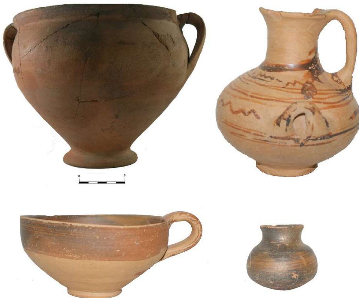
9. «Ασβεσταριά» Πετρωτού Τρικάλων. Ταφικά κτερίσματα. Κεραμική.

Όσον αφορά στην λεπτή κεραμική, τα περισσότερα σχήματα αγγείων της Εποχής του Χαλκού είναι παρόντα, με επικρατέστερα σχήματα τις φιάλες, τις κύλικες, τις υδρίες, τα αλάβαστρα, τους ψευδόστομους αμφορείς, τους πιθαμφορείς, τα θήλαστρα και τα κύπελλα. Στα διακοσμητικά στοιχεία κυριαρχούν οι οριζόντιες ευθύγραμμες ή κυματοειδείς ζώνες στο σώμα του αγγείου. Ακολουθούν τα επάλληλα επικαλυπτόμενα τρίγωνα, οι ζώνες με