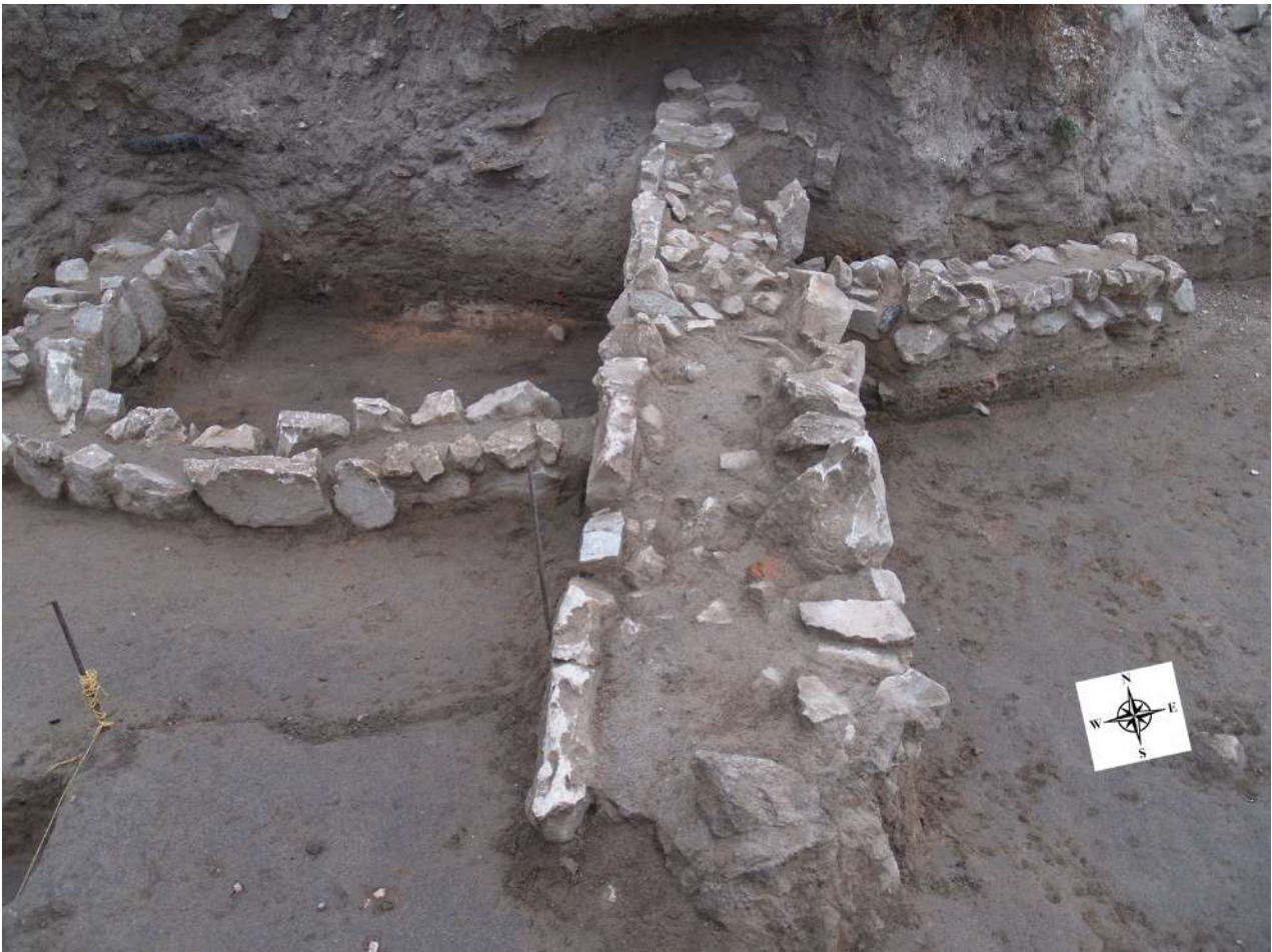
2. Αφιδωτά κτήρια της Μέσης Εποχής του Χαλκού.

Το κτήριο αυτό χρονολογείται στην ΠΕ ΙΙ. Πρόκειται για αφιδωτό κτήριο, το οποίο αποκαλύφθηκε εν μέρει, διότι συνεχίζεται στον όμορο, μη απαλλοτριωμένο, με την ανασκαφή αγρό. Το αποκαλυφθέν τμήμα του είναι διαστάσεων 8,75x7,00μ. Η είσοδος, πλάτους 0,90μ., βρίσκεται στην δυτική πλευρά του κτηρίου, ενώ η πλευρά στην οποία σχηματίζεται η αψίδα βρίσκεται στη νότια. Στο εσωτερικό του κτηρίου εντοπίστηκε τμήμα από την πηλόκτιστη ανωδομή του. Μεταξύ των άλλων ευρημάτων ήλθαν στο φως: α) ένας πίθος κατά χώραν και β) ένα αγκυρόσχημο ειδώλιο. Τα δύο δείγματα γεωλογικών ιζημάτων, τα οποία ελήφθησαν από τον μάρτυρα και κάτω από τις επιχώσεις του κτηρίου, χρονολογήθηκαν με τη μέθοδο της Οπτικά Διεγερμένης Φωταύγειας (OSL) στην ΠΕ Ι περίοδο (δηλ. 3200/3000-2600 π.Χ.), ενώ από στρώματα κάτω από αυτό περισυλλέγησαν όστρακα της Νεώτερης Νεολιθικής.