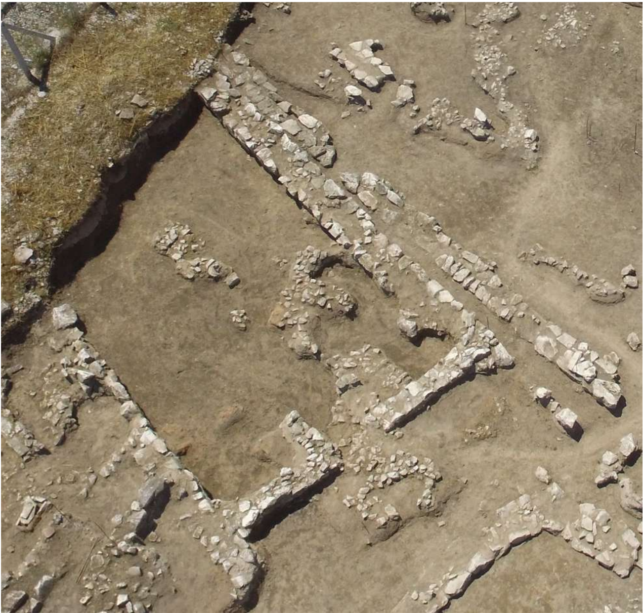
4. Κτήριο Ε.

μέσα σε λάσπη. Πάνω στην κατασκευή αποκαλύφθηκε ένα σφονδύλι και τμήμα από κάρβουνο.