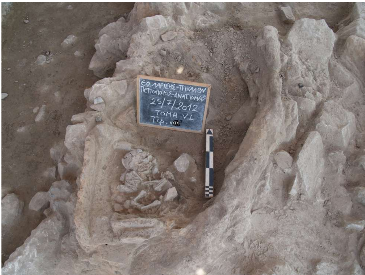
7. Λακκοειδής τάφος XXIX της Μέσης Εποχής του Χαλκού.

παραλληλεπίπεδης κάτοψης, με τα ίδια τεχνικά χαρακτηριστικά εκτός από τις ωμούς πλίνθους. Το εσωτερικό του έχει πληρωθεί με χώμα, το οποίο φέρει έντονες προσμίξεις χαλκιού. Ο νεκρός είναι σε εμβρυακή στάση, ενώ και αυτή η ταφή είναι ακτέριστη.