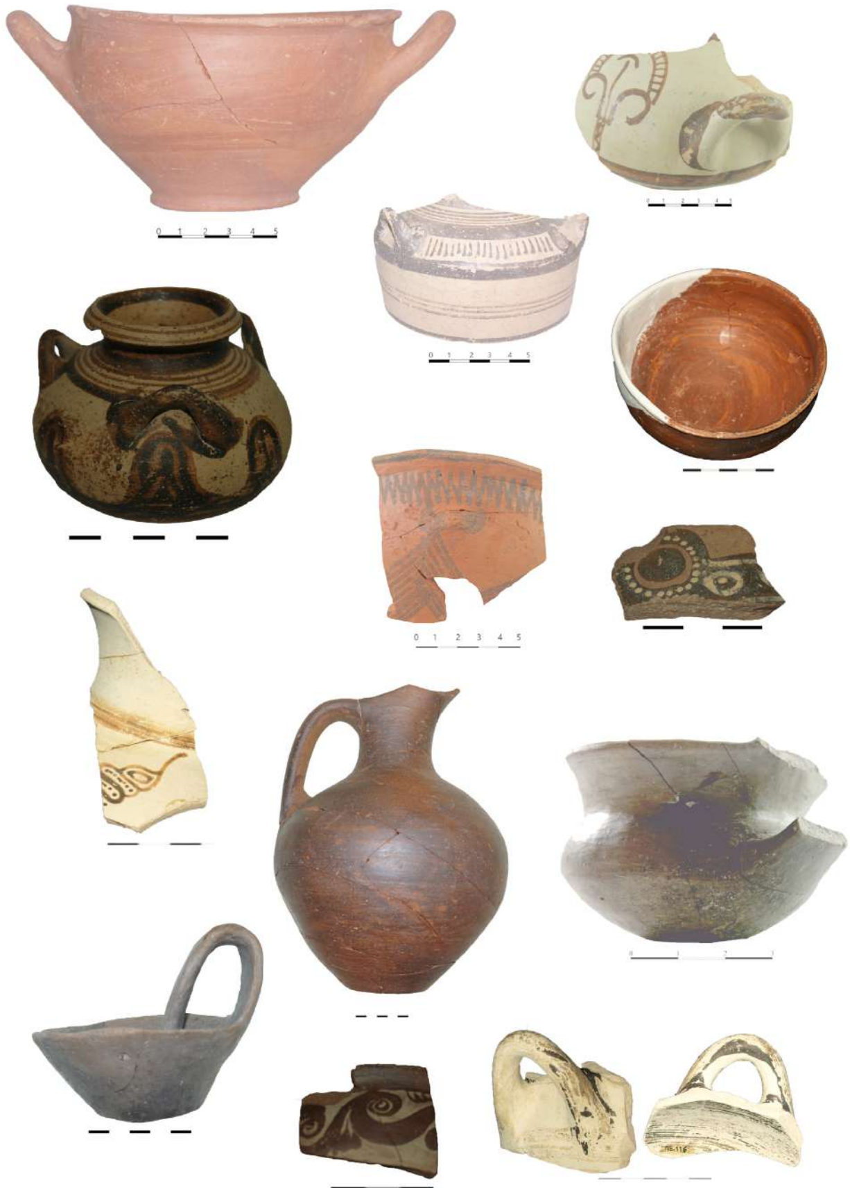
10. «Ασβεσταριά» Πετρωτού Τρικάλων. Κεραμική.