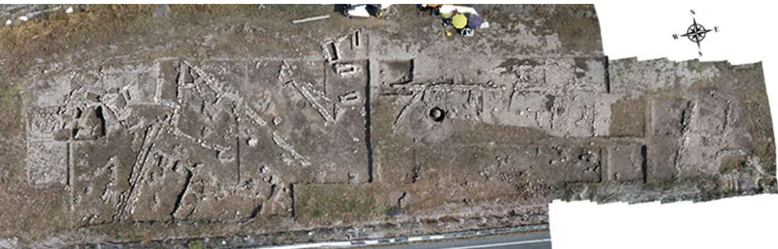
1. «Ασβεσταριά» Πετρωτού Τρικάλων. Αεροφωτογραφία της ανασκαφής.

Αποκαλύφθηκαν τμήματα δεκαπέντε κτηρίων, τα οποία χρονολογούνται από την ΠΕ ΙΙ έως και την ΥΕ ΙΙΙΓ, καθώς και αρκετά τμήματα τοίχων, οι οποίοι προς το παρόν δεν έχουν συνδεθεί με κάποιο κτήριο. Τα κτήρια που χρονολογούνται στην Πρώιμη Εποχή του Χαλκού (ΠΕΧ) καθώς και εκείνα της Μέσης Εποχής του Χαλκού (ΜΕΧ) είναι αφιδωτά, με την είσοδό τους σε μία από τις μακρές πλευρές του κτηρίου. Σε αντίθεση με τα κτήρια των προηγούμενων χρονολογικών περιόδων, εκείνα της ΥΕΧ έχουν παραλληλόγραμμη κάτοψη. Σε κάποια από τα κτήρια παρατηρήθηκαν διάφορες φάσεις κατασκευής, όπως δύο φάσεις κατασκευής σε ένα από