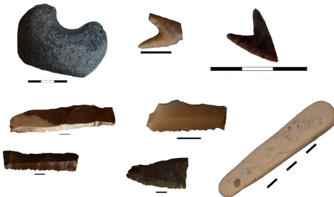
13. «Ασβεσταριά» Πετρωτού Τρικάλων. Λίθινα.