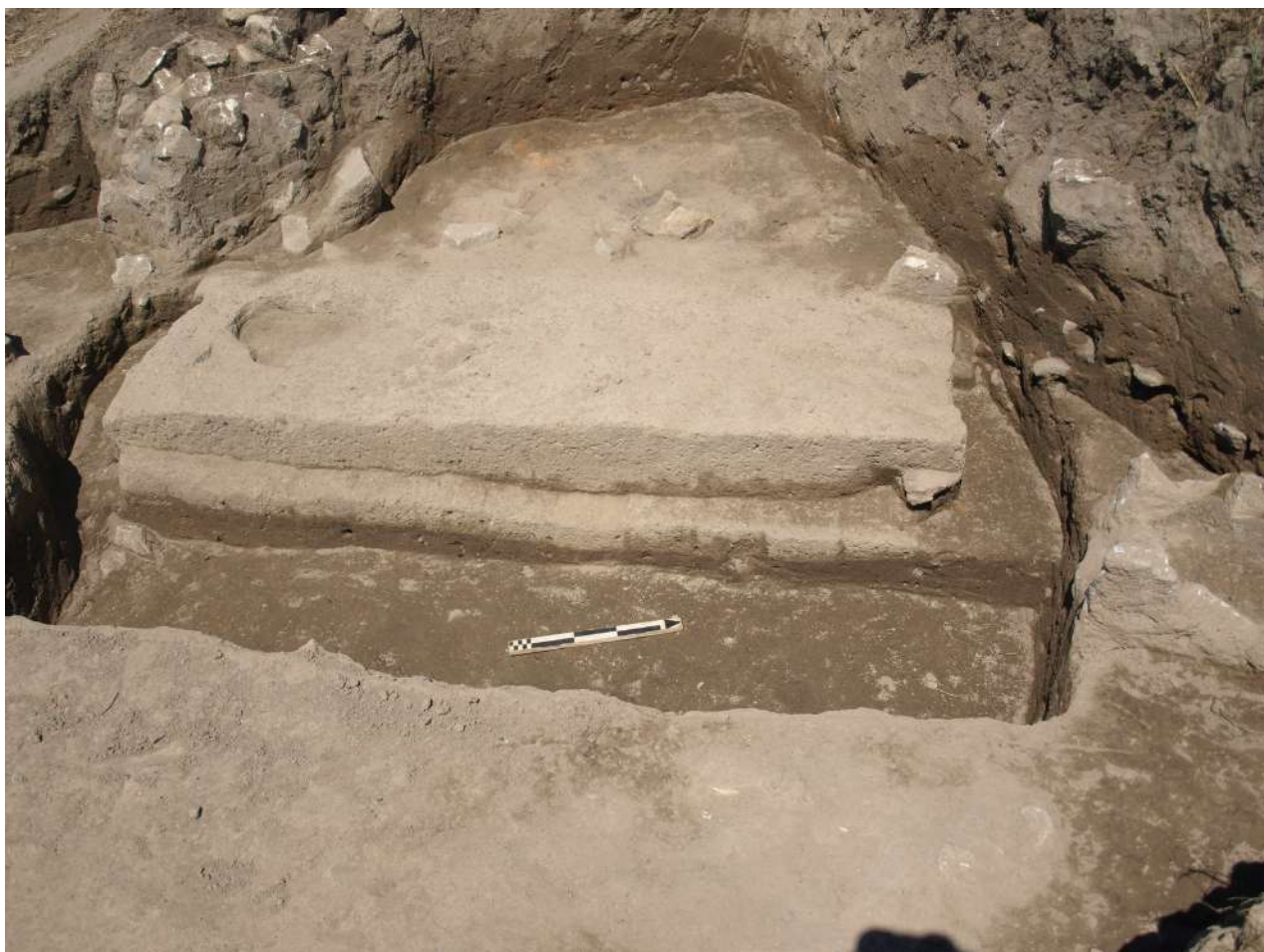
6. Τραπεζοειδής τάφος XLI της Νεώτερης Νεολιθικής.

οποίων, πάνω από τις λίθινες πλευρικές πλάκες, έχουν τοποθετηθεί τμήματα πήλινων εγχάρακτων πλακιδίων πάνω στα οποία εδράζονται οι καλυπτήριες πλάκες. Σε ένα πολύ μικρό ποσοστό τάφων, το δάπεδο έχει στρωθεί με χαλίκια ή με αργούς λίθους.