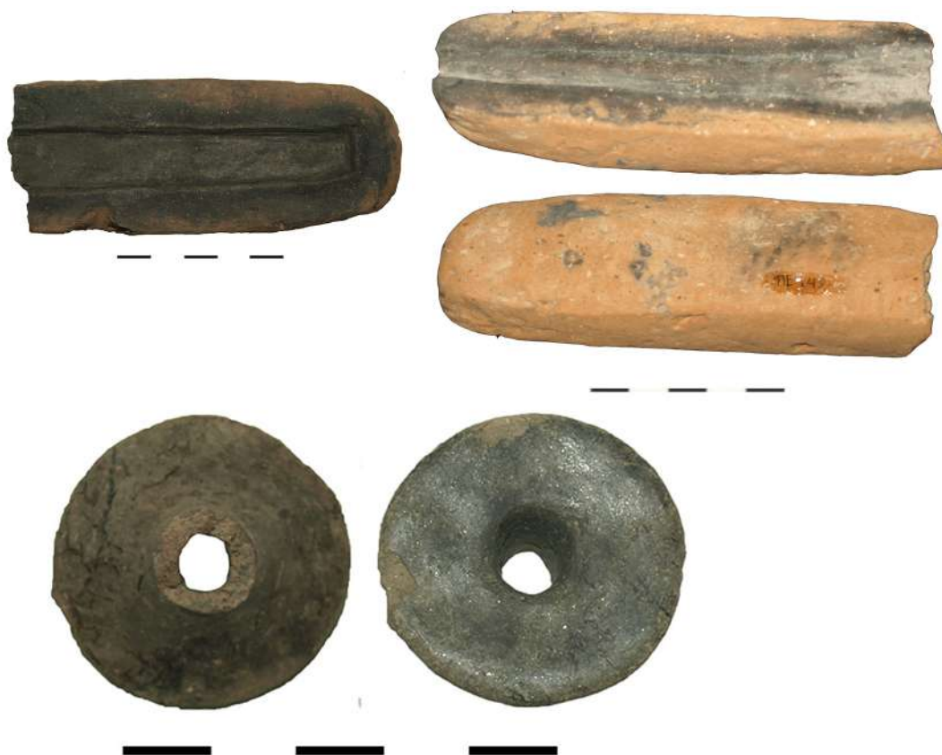
15. «Ασβεσταριά» Πετρωτού Τρικάλων. Μίτρες χύτευσης και ακροφύσιο.