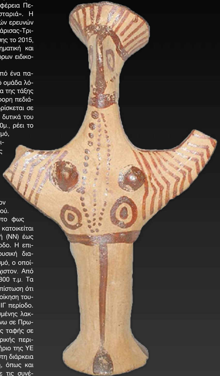
Πήλινο ειδώλιο τύπου Ψ. Υστεροελλαδική Εποχή. «Ασβεσταριά» Πετρωτού Τρικάλων.

Η αρχαιολογική σκαπάνη έφερε στο φως οικιστικά κατάλοιπα οικισμού, ο οποίος κατοικείται αδιάλειπτα από τη Νεώτερη Νεολιθική (NN) έως και την Υστεροελλαδική (ΥΕ) IIIΓ περίοδο. Η επιφανειακή έρευνα καθώς και η γεωφυσική διασκόπηση έδειξαν ότι πρόκειται για οικισμό, ο οποίος εκτείνεται σε 50 στρέμματα τουλάχιστον. Από αυτά έχουν εν μέρει ανασκαφεί τα 2.800 τ.μ. Τα μέχρι τώρα δεδομένα συνάδουν στη διαπίστωση ότι πρόκειται για οικισμό με διαχρονική κατοίκηση τουλάχιστον από τη NN έως και στην ΥΕ IIIΓ περίοδο. Η παρουσία στον χώρο πλούσια κτερισμένης λακκοειδούς ταφής Ρωμαίου πολεμιστή πάνω σε Πρωτοελλαδικό στρώμα, καθώς και παιδικής ταφής σε κιβωτιόσχημο τάφο της Πρωτογεωμετρικής περιόδου, σε στρώμα που υπερκαλύπτει κτήριο της ΥΕ IIIA, θέτει νέα ερωτήματα όσον αφορά στη διάρκεια της παρουσίας του οικισμού στη θέση, όπως και νέους προβληματισμούς αναφορικά με τις συνέχειες και ασυνέχειες στην κατοίκηση του οικισμού.