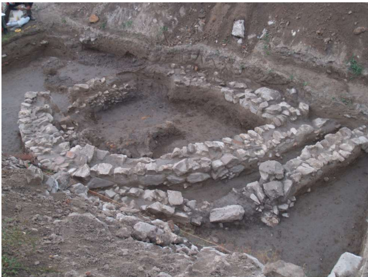
3. Αψιδωτά κτήρια της Μέσης Εποχής του Χαλκού.