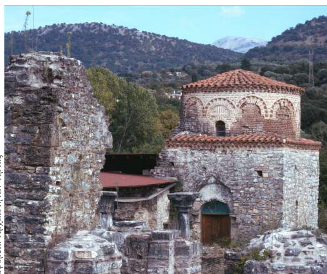
Εφορεία Αρχαιοτήτων Άρτας