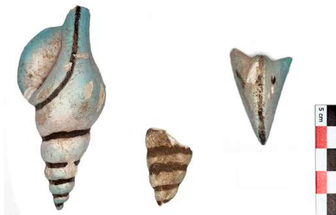
5. Ομοιώματα τρίτωνος και ναυτίλου από φαγεντιανή.