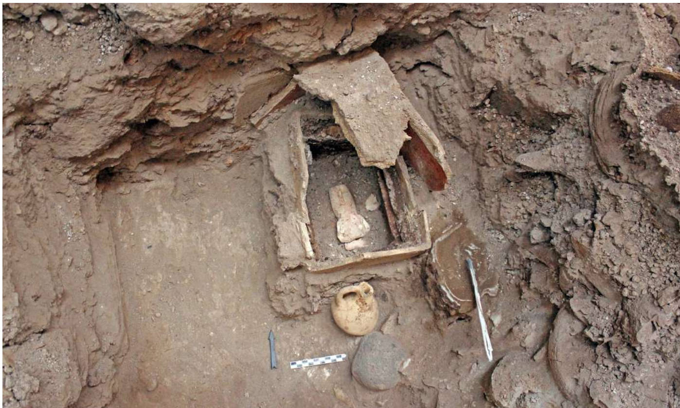
10. Πήλινο κιβωτίδιο, με πρωτοκυκλαδικό ειδώλιο στο εσωτερικό του.

εργαλείων και θαλάσσια βότσαλα, ήλθαν στο φως δύο συστάδες μικκύλων πρωτοκυκλαδικών αγγείων. Την μία αποτελούσαν 16 αγγεία τοποθετημένα γύρω από ξύλινο αντικείμενο (εικ. 11), του οποίου η μορφή ελπίζεται να διαπιστωθεί μετά από την ανάσυρση του γύψινου εκμαγείου του αποτυπώματός του. Τη δεύτερη συστάδα αποτελούσαν 131 μικκύλα αγγεία