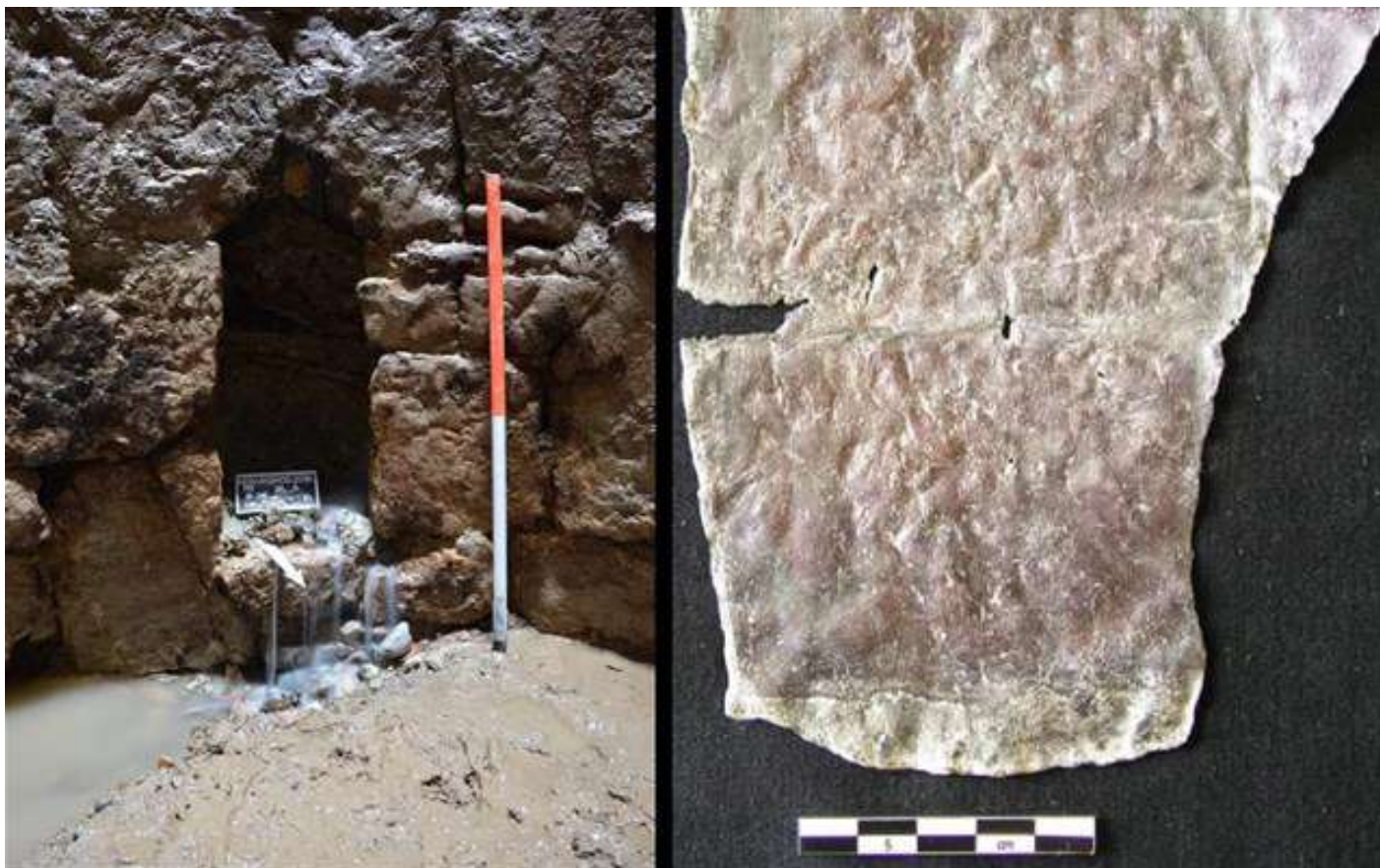
Γερμανικό Αρχαιολογικό Ινστιτούτο

Οι αρχαιολόγοι υποστηρίζουν πως υπήρχαν τέσσερις βασικοί λόγοι για να καταραστείς κάποιον. Για νίκη σε μια μήνυση, για επιτυχία στις επιχειρήσεις, για νίκη σε αθλητικούς αγώνες και για γενικά ζητήματα αγάπης και μίσους. Οι Αρχαίοι Έλληνες προσλάμβαναν, συνήθως, «επαγγελματίες» που έγραφαν τις κατάρες, πιστεύοντας πως έχουν υπερφυσικές δυνάμεις. Με την τοποθέτηση της πινακίδας πάνω σε έναν τάφο, ευελπιστούσαν πως η κατάρα θα μεταφερόταν στον Κάτω Κόσμο από τις ψυχές του νεκρού.