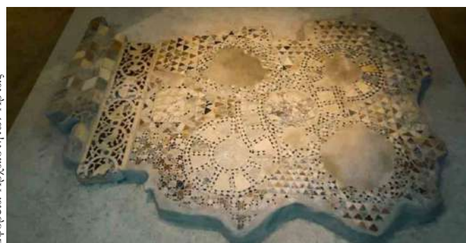
Εφορεία Αρχαιοτήτων Άρτας