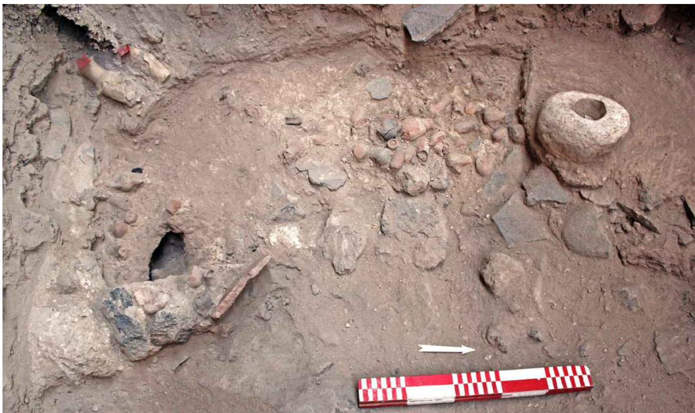
12. Συστάδα 131 μικκύλων πρωτοκυκλαδικών αγγείων.