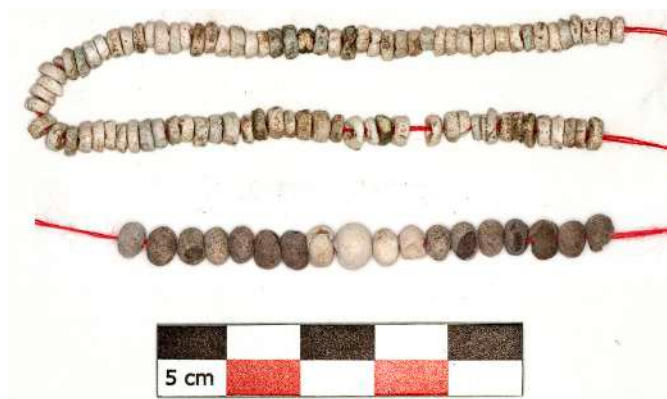
4. Μικροσκοπικές ψήφοι περιδεραίων.