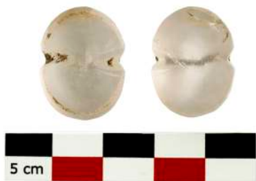
6. Ψήφος από ορεία κρύσταλλο σε σχήμα οκτώσχημης ασπίδας.