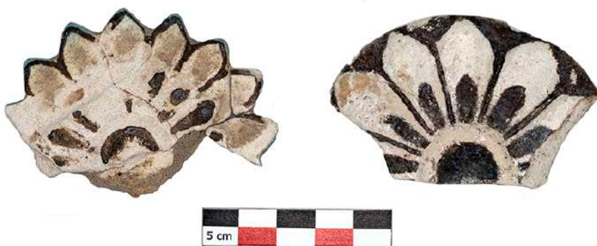
7. Ρόδακες, πιθανώς επιθήματα σε ξύλινα στοιχεία.

πελέκεις από πολύ λεπτό μπρούντζινο έλασμα αλλά και άλλοι μικρογραφικοί (εικ. 3) —πυρήνες κεράτων, μικροσκοπικές ψήφοι ενός ή περισσοτέρων περιδεραίων (εικ. 4). Επίσης, ομοιώματα τρίτωνος και ναυτίλου από φαγεντιανή (εικ. 5), μία ψήφος από ορεία κρύσταλλο σε σχήμα οκτώσχημης ασπίδας (εικ.6), με κατάλοιπα ερυθρού νήματος στην οπή ανάρτησης. Τα ανωτέρω αντικείμενα βρέθηκαν κάτω από το αποτύπωμα ξύλινης κατασκευής, και ενδέχεται να ήσαν αναρτημένα σε αυτήν. Στις επιχώσεις, τέλος των θυραίων ανοιγμάτων του Χώρου 1 βρέθηκαν ρόδακες (εικ.7), πιθανώς επιθήματα σε ξύλινα στοιχεία. Ιδιαίτερα εμβληματικό είναι το ενεπίγραφο θραύσμα ομοιώματος τρίτωνου. Η επιγραφή, αποτελούμενη από συλλαβογράμματα της Γραμμικής Α γραφής και ένα ιδεόγραμμα, είναι γραμμένη με μελάνι και πιθανολογείται ότι σχετίζεται με τη χρήση του κτηρίου. Χαλαρό στρώματα θαλάσσιας άμμου με μικρά βοτσαλάκια, χαλίκια και χώμα επάνω στο δάπεδο του χώρου 1, αποδόθηκαν από τον γεωλόγο Γ. Βουγιουκαλάκη σε αποθέσεις παλιροϊκού κύματος (τσουνάμι) που προηγήθηκε της ηφαιστειακής έκρηξης.