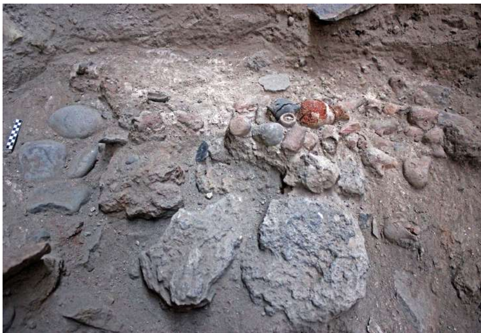
11. Συστάδα 16 μικκύλων πρωτοκυκλαδικών αγγείων.

μέσα σε αβαθή κοιλότητα επάνω στο δάπεδο (εικ. 12).