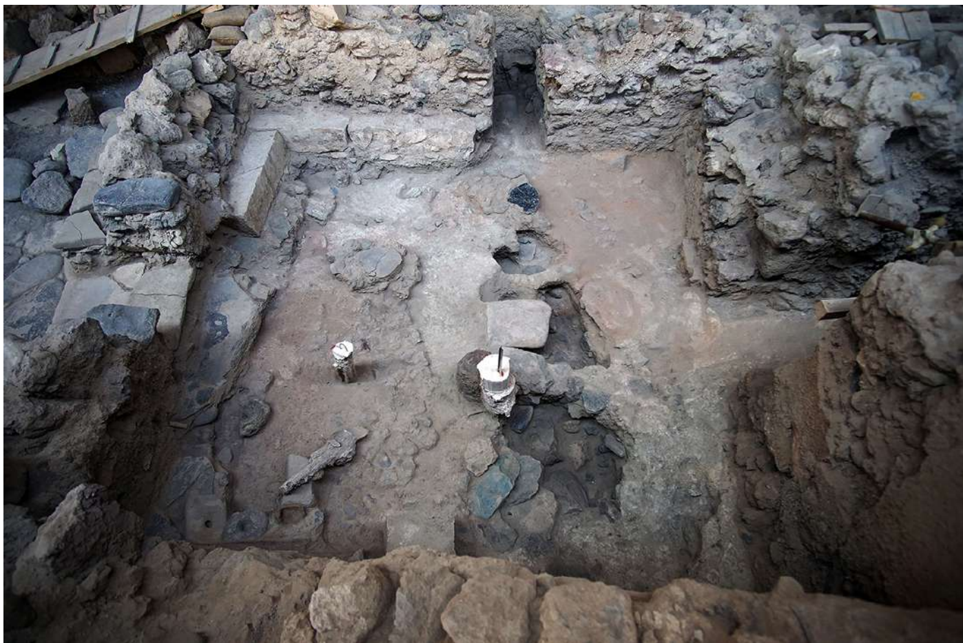
ΕΦΑ Κυκλάδων / ΥΠΠΟΑ