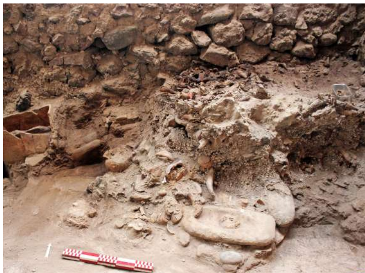
8. Χώρος 2. Είδος εσχάρας επάνω στην οποία γινόταν η απόθεση των κεράτων