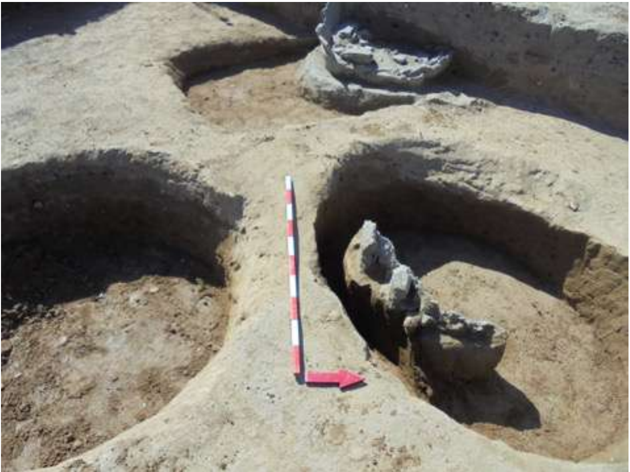
5. Λάκκοι στο χώρο του εργαστηρίου.