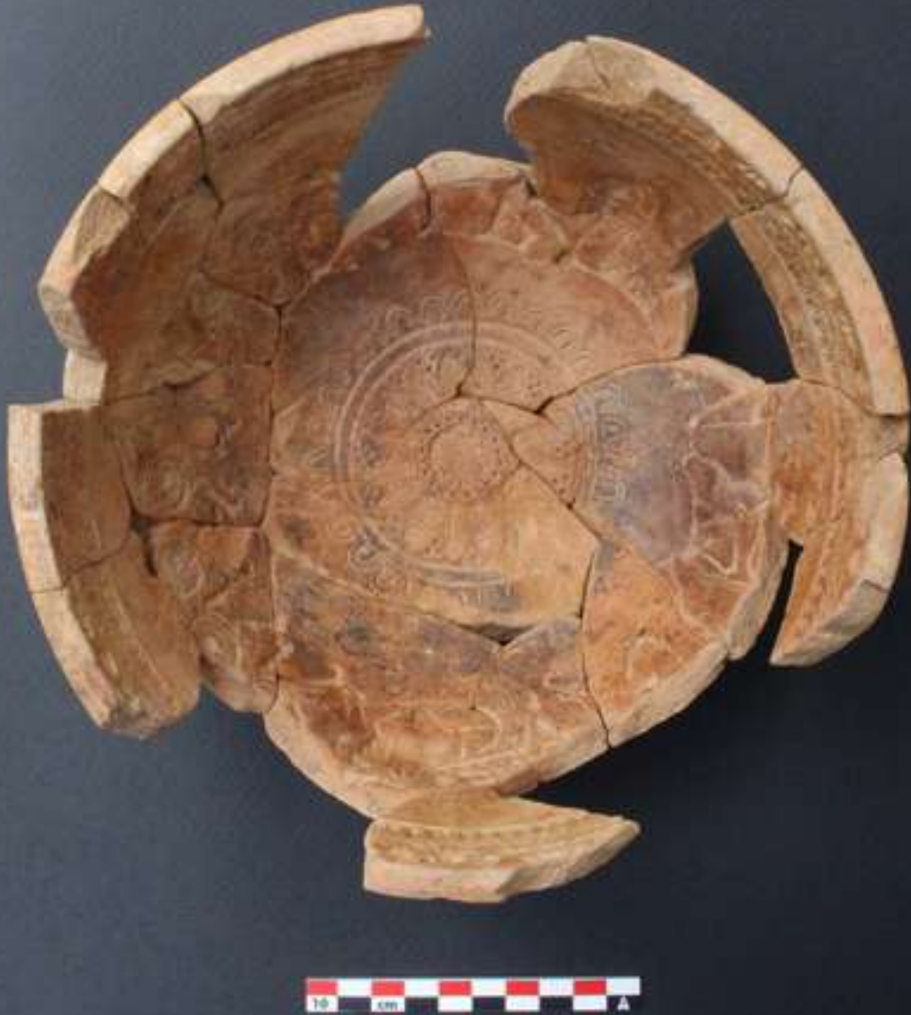
11. Κάτοψη μήτρας με διηγηματικές σκηνές εμπνευσμένες από την «Ίφιγένεια ἐν Αὐλίδι».

κής (εικ. 12). Το όνομα χαραχθηκε μετά την όπτηση της μήτρας, όπως αποδεικνύουν ίχνη έντονης πίεσης και απολεπισμάτων από το εργαλείο χάραξης της υπογραφής. Κατά συνέπεια, η μήτρα πρέπει να περιήλθε στην κατοχή του ιδιοκτήτη του εργαστηρίου του Καλαμώννα από κάποιο άλλο κέντρο παραγωγής κεραμικής.