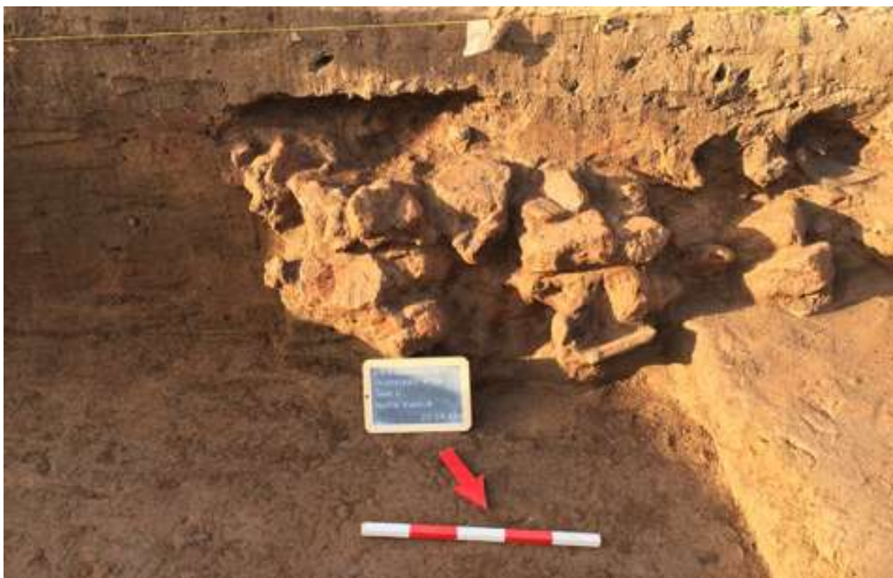
3. Τμήμα κλιβάνου στο ΝΔ άκρο του ανασκαφικού πεδίου.