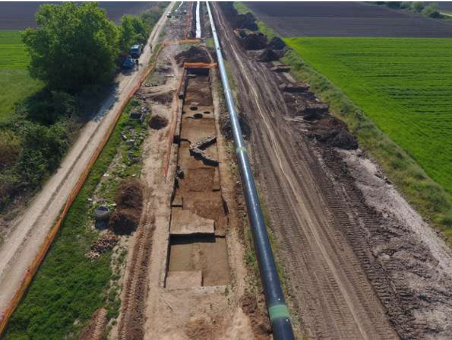
2. Γενική άποψη της ανασκαφής από δυτικά.

γοστές κεραμίδες συνδεδεμένες με λάσπη (εικ. 3). Σε όμορη, Τομή ανατολικά του κλιβάνου, εντοπίστηκε απόθεση μεγάλης ποσότητας πηλομαζών από καθαρή πορτοκαλόχρωμη άργιλο που μάλλον συνιστούσε την πρώτη ύλη κατασκευής των κεραμικών. 2 Με λειτουργίες εργαστηριακού χαρακτήρα πρέπει να σχετίζεται η λίθινη κατασκευή που βρέθηκε σε κεντρική Τομή, παραπλεύρως των πηλομαζών. Έχει κάτοψη ορθής γωνίας από δύο σωζόμενα τοιχεία με αργούς λίθους, ορίζοντας έτσι ένα είδος ορθογώνιου εδρά-