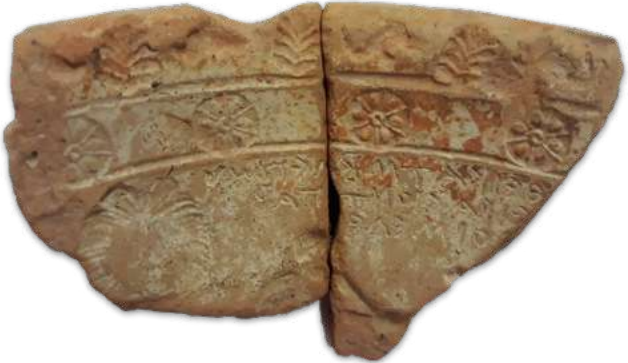
15. Συνανήκοντα θραύσματα μήτρας με παράθεμα επωδής.

ληλα της Πέλλας και της Βεργίνας ερμηνεύτηκε «είς βάθος διείσδυση», παραπέμπει σε σκηνή ερωτικού περιεχομένου. Εικάζουμε, λοιπόν, ότι πρόκειται για ερωτική σκηνή με τη γυναίκα να είναι καθιστή επάνω σε άνδρα, κρίνοντας και από την τοποθέτηση της μορφής της ψηλότερα στην επιφάνεια του αγγείου. Οι υπόλοιπες αποσπασματικές λέξεις κάτω από το «Άκρως» ερμηνεύονται με μεγάλη επιφύλαξη ως πιθανές παραπομπές σε γυναικεία ερωτογενή σημεία. Για παράδειγμα θα μπορούσαν να αποδοθούν ως ΚΑΤΑ ΜΥΡΤΟΝ ή ΜΥΚΛΟΝ, ενώ για τα ΔΕΙΤΑΙ [-]ΑCΕΥ' δεν είναι σαφές αν αποτελούν τμήματα επιγραφής που ξεκινάει δεξιότερα και διακόπτεται από το στεφάνι. Πιθανότερο είναι να γίνεται αναφορά σε κάποιο όνομα ή πρόσωπο, όπως για παράδειγμα [Ι]ΑC ΕΥ, ωστόσο η απόδοση νοήματος παραμένει αινιγματική λόγω της αποσπασματικότητας των επιγραφών. Γενικά, υποθέτουμε πως το εν θέματι θραύσμα προέρχεται από μήτρα που θα έφερε σκηνές περιπτύξεως ζευγαριών γύρω από το σώμα της, συνοδευόμενες από ανάλογες ερωτικές επιγραφές. 14