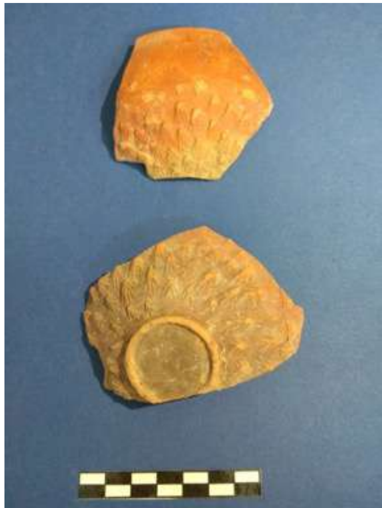
9. Ανάγλυφα σκυφίδια.

καλί γάνωμα, και ανήκουν στα «πολυτελή» επιτραπέζια σκεύη που παρήγαγε το εργαστήριο για τις απαιτήσεις της εγχώριας κοινωνικής ελίτ. Τα διακοσμητικά τους θέματα περιλαμβάνουν δελφίνια, λεοντογρύπες και μίμηση κώνου πεύκης, με εναλλασσόμενες σειρές μικρών λογχοειδών οξυκόρυφων φύλλων που εξέχουν η μία μέσα από την άλλη, καλύπτοντας ολόκληρο το σώμα του αγγείου 9 (εικ. 9). Παρόμοια ανάγλυφα σκυφίδια έχουν βρεθεί στη Φλώρινα και την Πέλλα καθώς και στη γειτονική Αμφίπολη. 10