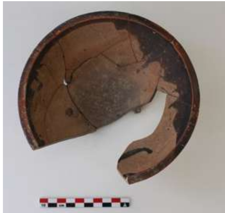
8. Κάτοψη άωτου σκύφου με εμβάπτιση.

δαια και σε άλλα μακεδονικά περιφερειακά εργαστήρια κεραμικής Ελληνιστικής εποχής. 4