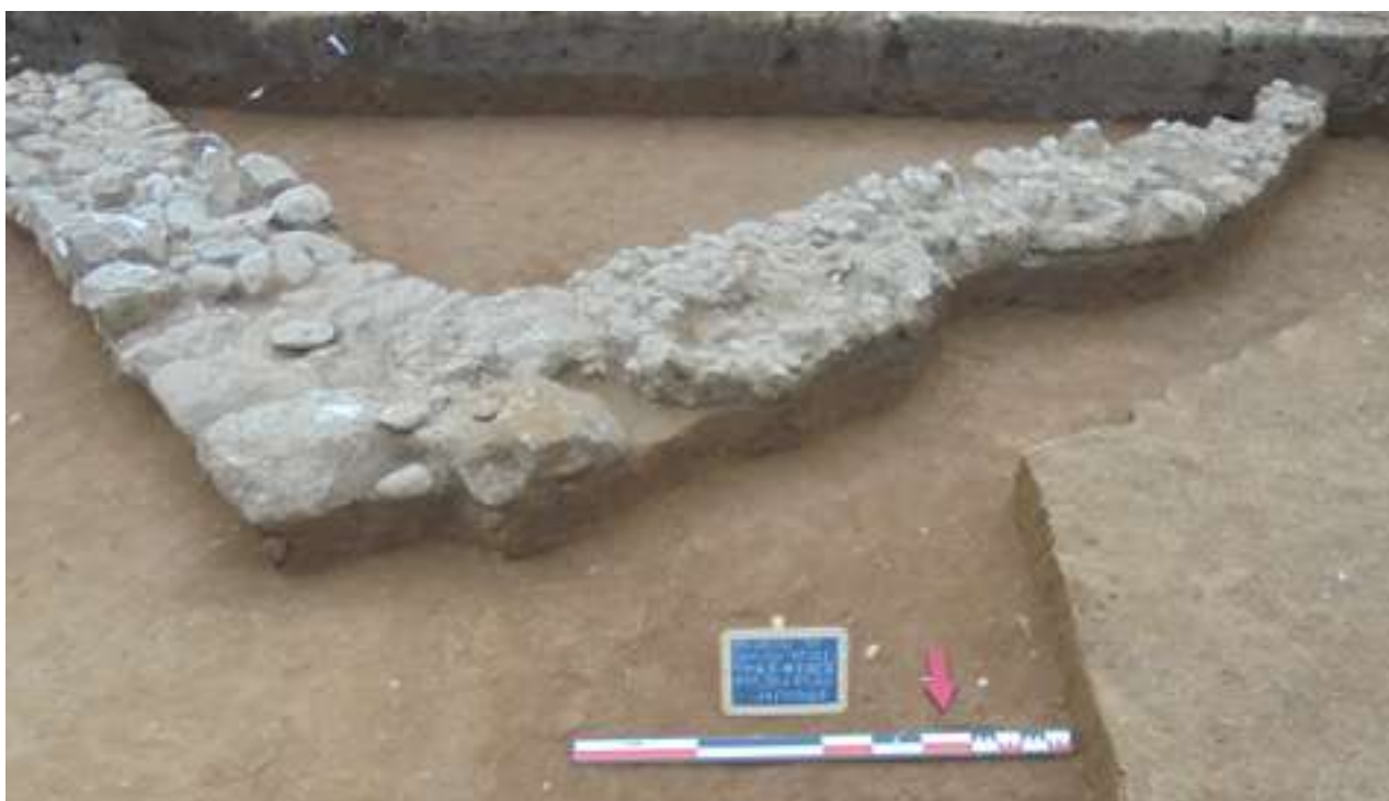
4. Άποψη του λίθινου εδράνου από τα βόρεια.