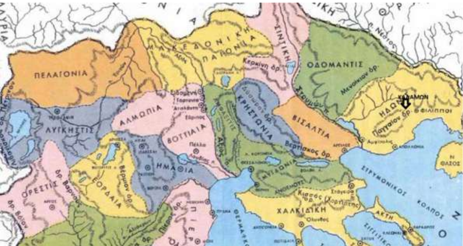
1. Χάρτης της αρχαίας Μακεδονίας με σήμανση της θέσης του εργαστηρίου κεραμικής.

Τ ον Φεβρουάριο του 2017, στο πλαίσιο παρακολούθησης των κατασκευαστικών εργασιών του Αγωγού Φυσικού Αερίου ΤΑΡ, διενεργήθηκε υπό την επίβλεψη της Εφορείας Αρχαιοτήτων Δράμας σωστική ανασταυτική έρευνα στην περιοχή του Καλαμώνα Δράμας, σε απόσταση περίπου 10 χλμ. δυτικά της αρχαίας πόλης των Φιλίππων. Σύμφωνα με την αρχαία τοπογραφία, η περιοχή του Καλαμώνα προσδιορίζεται στα ΒΑ όρια της Ηδωνίδος, όπου αρκετές κώμες και αγροικίες της Ελληνιστικής και, ιδίως, της Ρωμαϊκής εποχής απλώνονταν πλησίον της παρακείμενης Εγνατίας οδού, η οποία συνέδεε τη Δυτική Μακεδονία με την Αμφίπολη, το άστυ των Φιλίππων και τη Νεάπολη 1 (εικ. 1). Η ανασταυτική έφερε στο φως σημαντικά κατάλοιπα τοπικού εργαστηρίου κεραμικής Υστεροελληνιστικής περιόδου, η παρουσία του οποίου φαίνεται πως εξυπηρετούσε τις ανάγκες πυκνοκατοι-