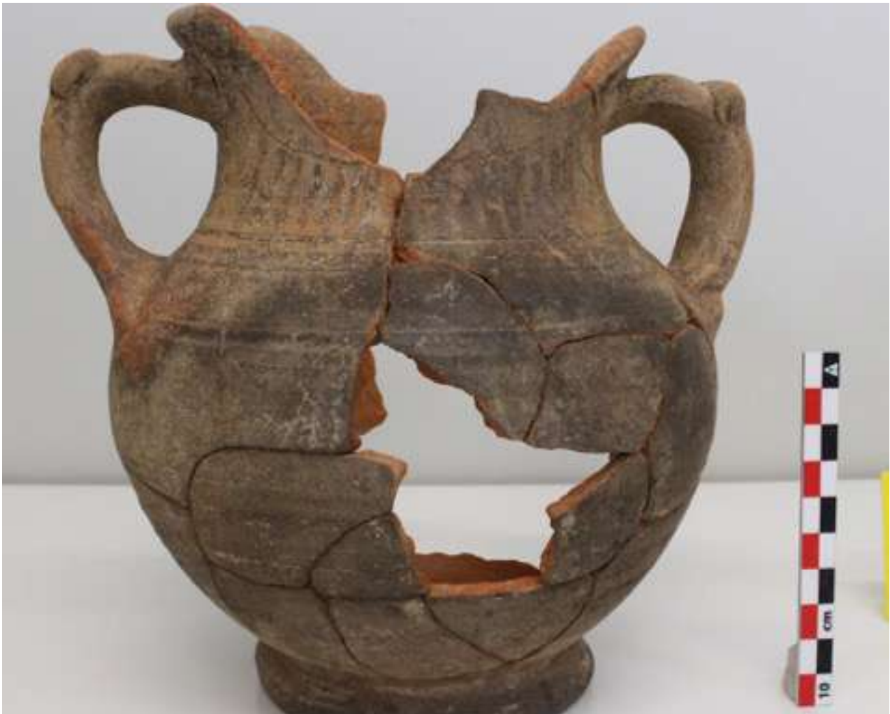
10. Αμφορίσκος τύπου «Δυτικής Κλιτύος».