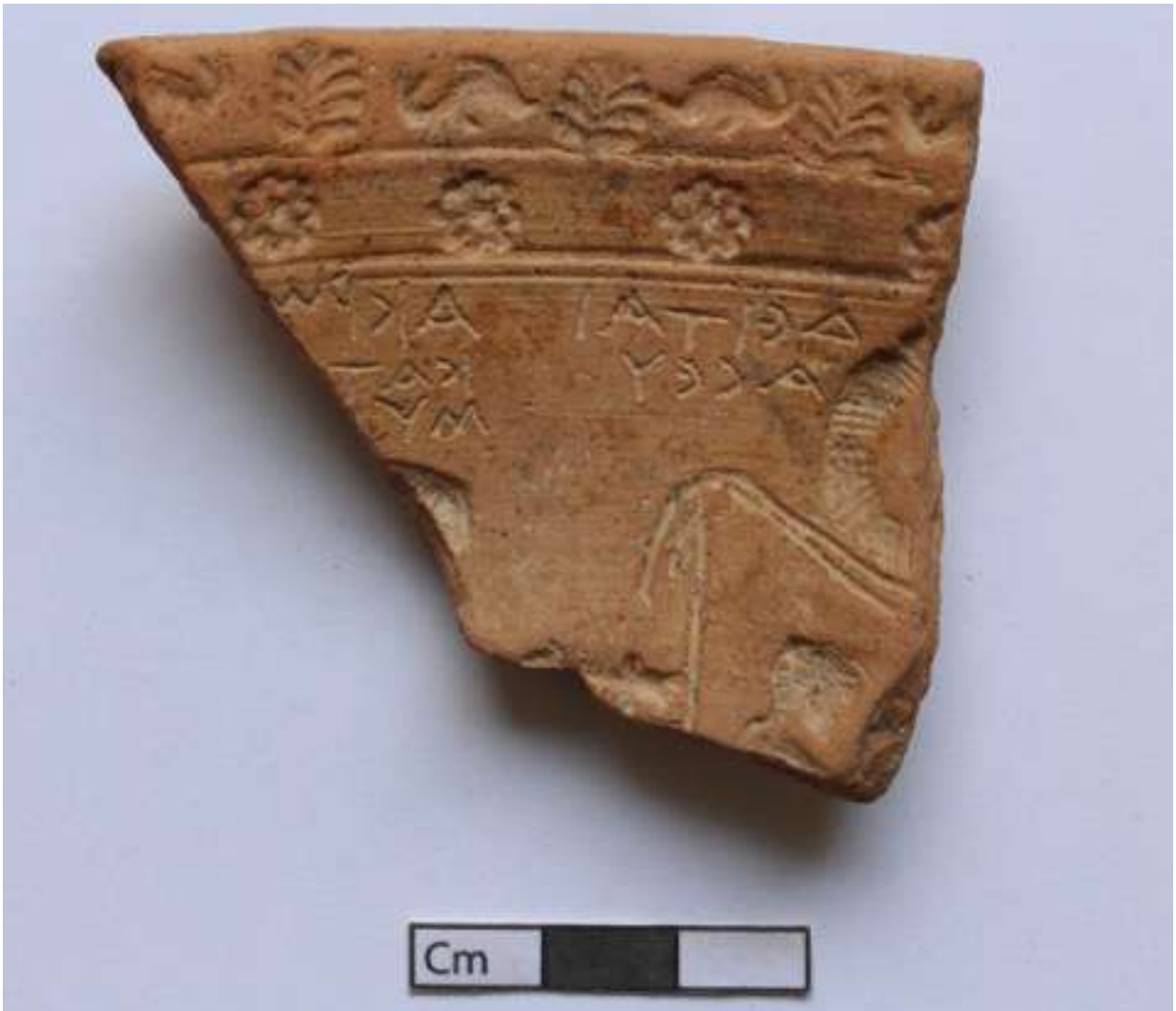
14. Θραύσμα μήτρας με επιγραφές και σκηνές ερωτικού περιεχομένου.