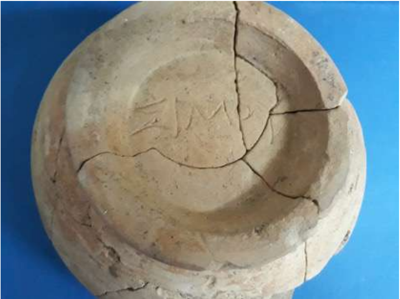
12. Η υπογραφή «ΣΙΜΟΥ» στη βάση μήτρας.

συναντούμε διακοσμητικά θέματα όμοια με της προηγούμενης μήτρας (εικ. 13). Η διαπίστωση ότι με το ίδιο εργαλείο που χαραχθήκε η υπογραφή έχουν φιλοτεχνηθεί τα στελέχη και τα περιγράμματα των ανθέων στο εσωτερικό της, 13 αποδίδει την πατρότητα και κατασκευή της σε ένα κέντρο παραγωγής, πιθανώς του Καλαμώνα.