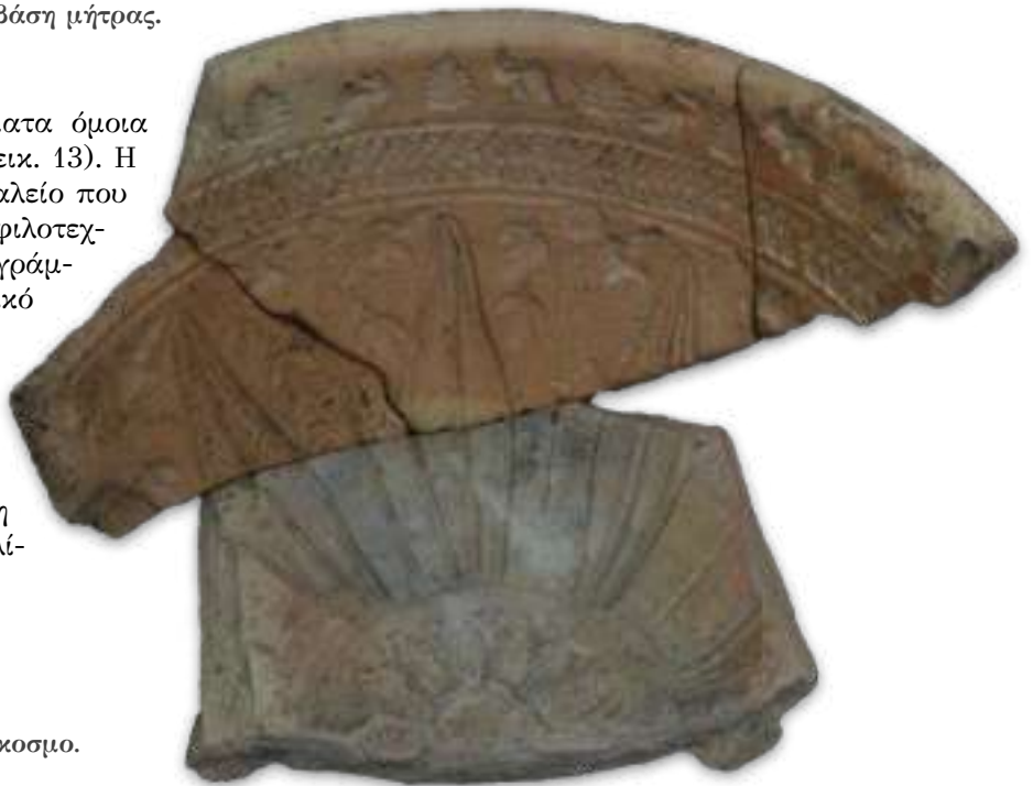
13. Μήτρα με φυσιοκρατικό διάκοσμο.

Μια τρίτη μήτρα που εντοπίστηκε, φέρει λιτή διακόσμηση από εμπίστες «κυψέλες»-φολίδες: ήταν όμως ανυπόγραφη.