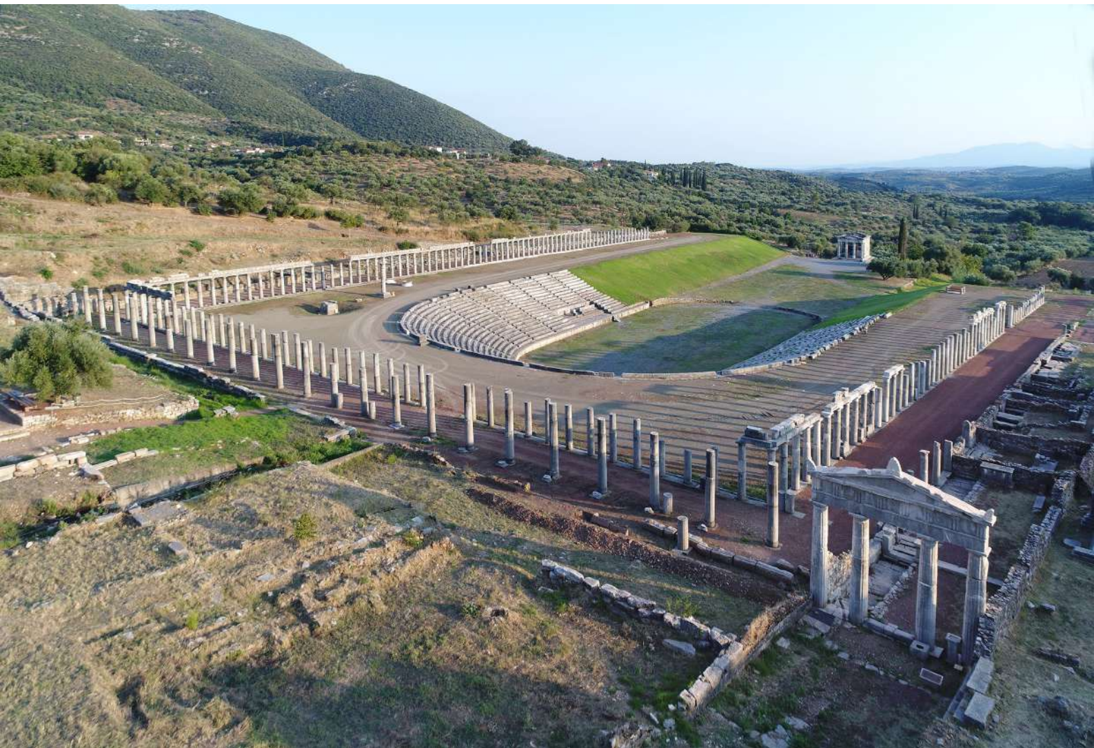
1. Αποψη του Μαυσωλείου και του πύδιου από ΝΑ.

Ο στίβος του Σταδίου της αρχαίας Μεσσήνης, με μήκος ενός δωρικού σταδίου (182/4 μ. περίπου), καταλήγει στο νότιο τείχος της πόλης με το οποίο και εφάπτεται. 1 Η ανωδομή του τείχους στο σημείο αυτό έχει αποκοπεί, προκειμένου να κατασκευασθεί ορθογώνιο υψηλό πύδιο, διαστάσεων 10,445 x 15,8 μ., το οποίο εξέχει προς Ν., παρέχοντας την εντύπωση προμαχώνα (εικ. 1). Το πύδιο εμφανίζεται ελαφρώς επικλινές, με λοξότμητη εσοχή στο μέσον, φέρει επένδυση από εναλασσόμενους δόμους παχύτερων πλίνθων πωρόλιθου και λεπτότερων ασβεστόλιθου, ενώ ο πυρήνας του αποτε-