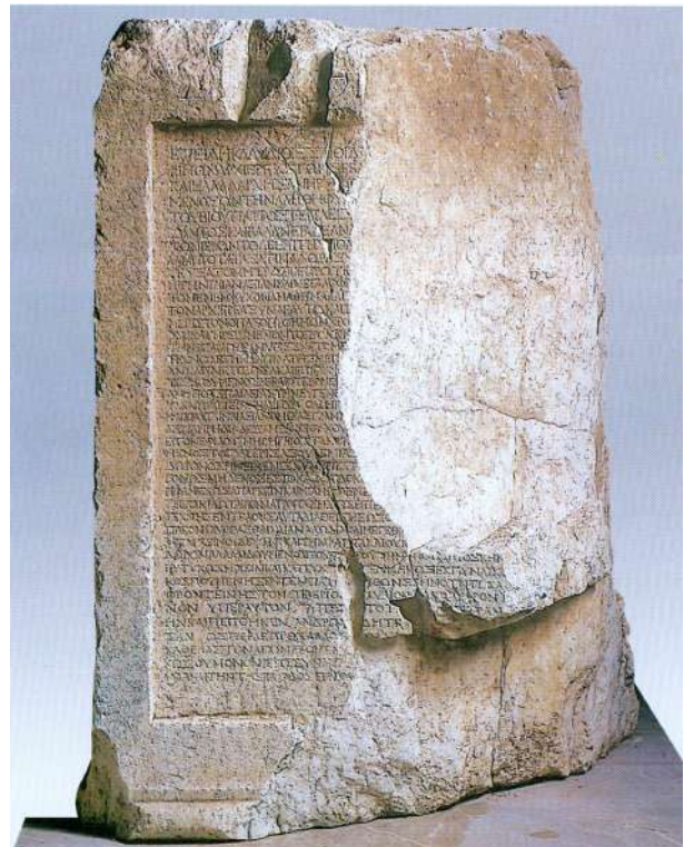
11. Ενεπίγραφο μαρμάρινο βάθρο αγάλματος της οικογένειας των Σαιθιδών.