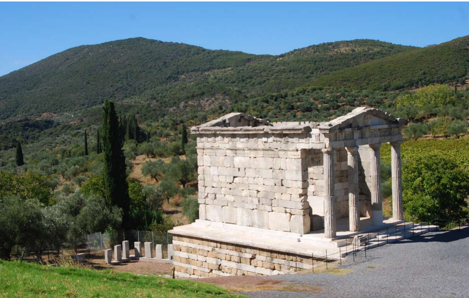
10. Αποψη του Μαυσωλείου των Σαιθιδών, στο πέρας του Σταδίου.

μεγέθους επιτύμβιες στήλες ελληνιστικών χρόνων και φέρουν επιγραφές με τα ονόματα των νεκρών.