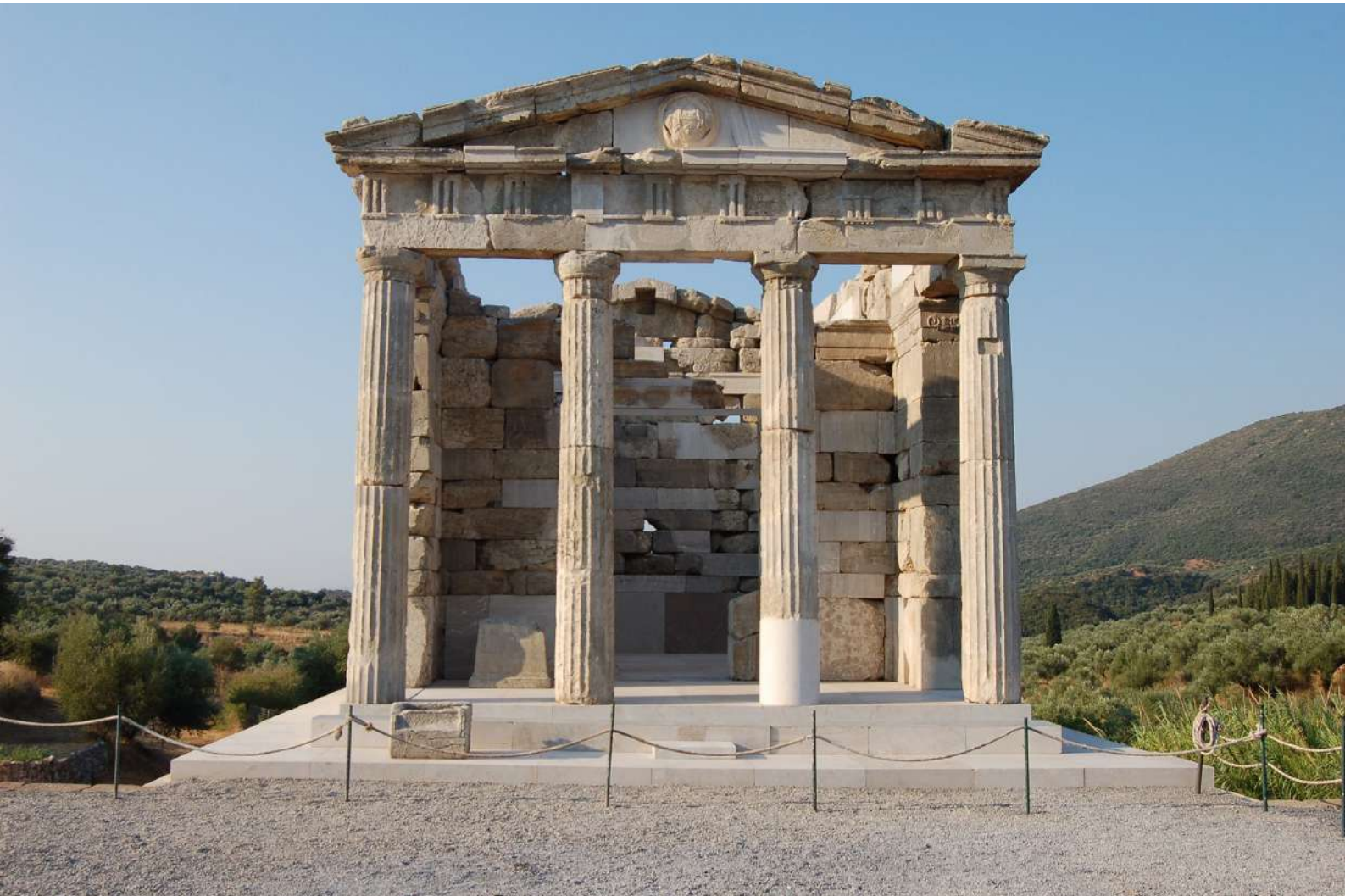
13. Άποψη του Μαυσωλείου.

νομένης της απόδοσης ετήσιων ηρωϊκών τιμών στα νεκρά μέλη της (εικ. 13). Αγώνες «Σαιθίδια», ανάλογα των «Ευρυκλείων», δεν μαρτυρούνται στη Μεσσήνη, ωστόσο η σχέση του Μαυσωλείου-ηρώου με το Στάδιο και τους εκεί τελούμενους αγώνες είναι δεδομένη. 29 Άνεξαρτήτως της επιικής παράδοσης για τα «ἄθλα ἐπὶ Πατρόκλω» και την ακόμη πρωϊμότερη σχέση του τάφου-ηρώου του Πέλοπος με τους Ολυμπιακούς αγώνες, η σχέση ηρώων και αφηρωϊσμένων επιφανών νεκρών με αγώνες γυμνικούς, ιππικούς και μουσικούς μαρτυρείται και για την Ελληνιστική περίοδο, τόσο φιλολογικά όσο και επιγραφικά [Πλούταρχος, Τιμολέων 39.5]. 30 Χαρακτηριστικό παράδειγμα αποτελούν οι αγώνες γυμνικοί, ιπ-