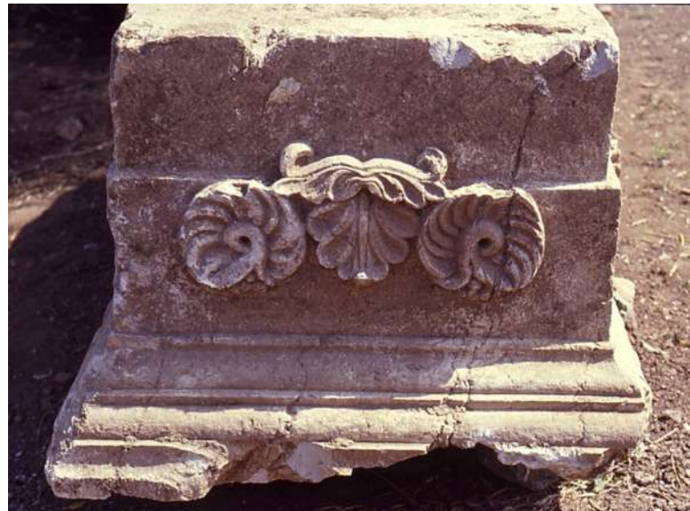
5α-β. Τα αρχιτεκτονικά στοιχεία του μνημείου ως μάρτυρες χρονολόγησης.