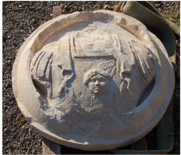
7. Προτομή θωρακοφόρου σε ασπίδα από το αέτωμα του μνημείου.

4. Αρ. ευρ. 948. ύψ. 0,20μ. Ανδρική κεφαλή από ασβεστόλιθο, ελλειπής και διαβρωμένη, φυσικού περίπου μεγέθους (εικ. 9). Τα χαρακτηριστικά είναι ιδεαλιστικά, τα μαλλιά δηλώνονται ως ενιαία μάζα με επιπεδόγλυφους κυματοειδείς βοστρύχους. Πρόκειται για κλασικιστικό έργο των μέσων του 2ου αι. μ.Χ., έχοντας ως πρότυπο έργα του πρώιμου 4ου αι. π.Χ. 11