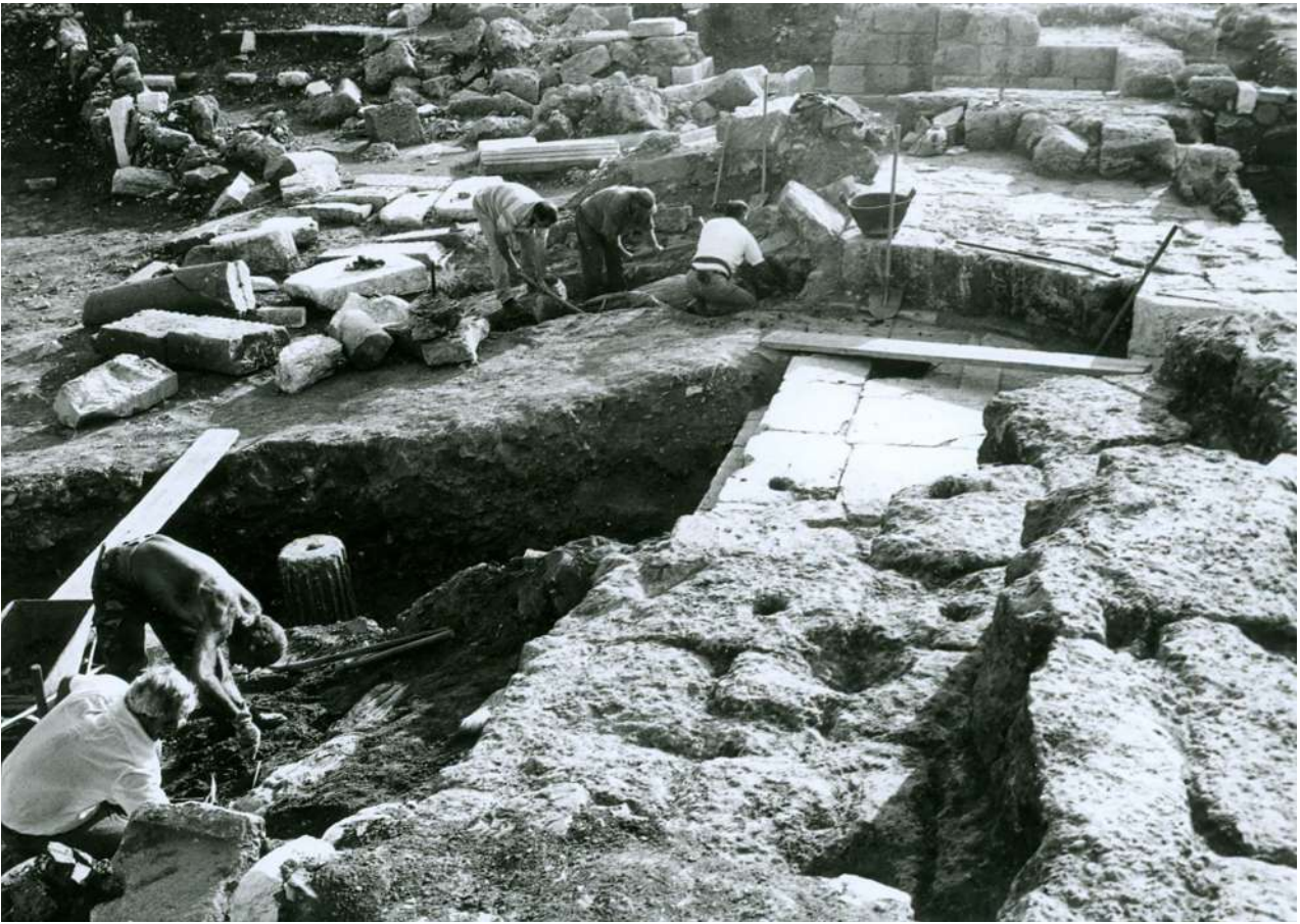
3. Άποψη του ερειπιώνα της αρχαίας Μεσσήνης πριν από τις αναστηλωτικές εργασίες.

πολιτισμών –όπως μαθαίνουμε συνήθως στο σχολείο– αλλά αποτελούν επακόλουθα μιας προηγμένης οικονομικής κατάρρευσης. 2 Οι «βάρβαροι» εισβολείς αποτρέπονται και οι φυσικές καταστροφές οδηγούν στην οικοδόμηση ισχυρότερων και λαμπρότερων κατά κανόνα κτισμάτων, όταν το κράτος είναι ακόμη οικονομικά ανθηρό, όπως συνέβη, για παράδειγμα, με τα νέα ανάκτορα της Κνωσού, που αντικατέστησαν τα παλαιά, ή ακόμα και με τη μετασεισμική Καλαμάτα που αναγεννήθηκε λαμπρότερη. Η Ιαπωνία δεν κατέρρευσε από τους σεισμούς, ούτε από το καταστροφικό τσουνάμι. Ο απέραντος ερειπιώνας που αντικρίσαμε στη Μεσσήνη κατά τη διάρκεια των ανασκαφών, πριν από τις εργασίες αναστήλωσης και ανάδειξης (εικ. 3), ήταν αποτέλεσμα της δράσης των απελπισμένων ενδεών κατοίκων της Μεσσήνης των λεγόμενων «σκοτεινών αιώνων», οι οποίοι κυνηγούσαν τα μέταλλα, τους σιδερένιους συνδέσμους και το χυτό μολύβι,