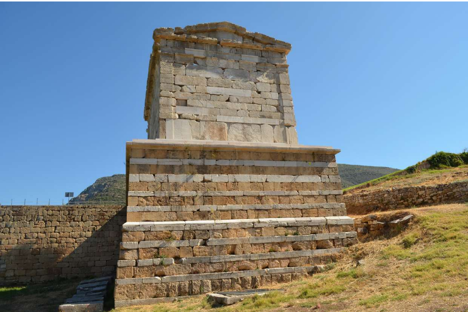
14. Το πόδιο του Μαυσωλείου.

στάδες παρουσιάζουν επίσης μείωση του πάχους τους από κάτω προς τα επάνω και αλλαγή στο ύψος των δόμων από μικρότερο σε μεγαλύτερο, προχωρώντας σταδιακά από τον πρώτο δόμο του τοίχου πάνω από τους ορθοστάτες ως τον τελευταίο. Επιστύλιο και δωρική φρίζα είναι συμφυείς σε μία λιθόπλινθο πάνω από την πρόστυλη πρόσοψη, ενώ είναι διαχωρισμένες σε δύο σειρές (δόμους) πάνω από τους τοίχους στις πίσω και τις πλάγιες πλευρές του Ηρώου.