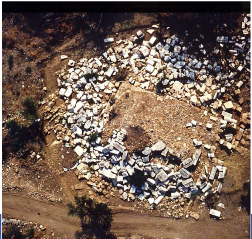
2α-β. Διάσπαρτα αρχιτεκτονικά μέλη του Μαυσωλείου.

κατεστραμμένο πόδιο, χωρίς τους μεταλλικούς συνδέσμους και τις μολυβδοχοήσεις τους (εικ. 2α-β). Το τελευταίο δείχνει ότι η πτώση του μνημείου δεν οφείλεται σε σεισμό ή φυσικά γενικώς αίτια, αλλά σε ανθρώπινη επέμβαση, με στόχο την αφαίρεση των μετάλλων. Τα ίχνη άλλωστε των χτυπημάτων με καλέμι γύρω από τις εντορμίες και τις οπές γόμφωσης, για την αφαίρεση των μεταλλικών συνδέσμων, των γόμφων και της μολυβδοχοήσης, είναι εμφανή. Οι σεισμοί, τα φυσικά φαινόμενα, οι εισβολείς αλλόγλωσσοι λαοί δεν προκαλούν από μόνοι τους την κατάρρευση των