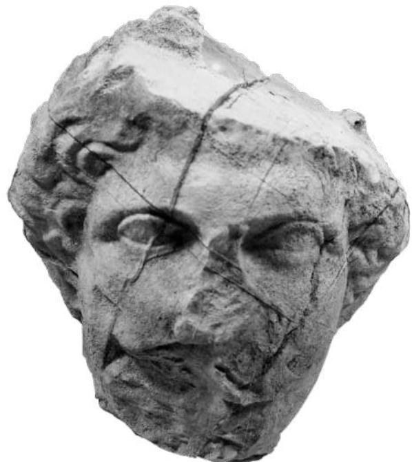
9. Ανδρική κεφαλή φυσικού μεγέθους από ασβεστόλιθο.