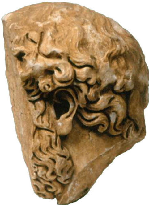
8. Μαρμάρινη εικονιστική κεφαλή γενειοφόρου άνδρα.

Όλα τα ευρήματα αποκαλύπτουν τον χθόνιο, ταφικό χαρακτήρα του οικοδομήματος. Στην ανωδομή του ποδίου έχουν χρησιμοποιηθεί εξωτερικά αβεστολιθικές λιθόπλινθοι, προερχόμενες στην πλειονότητά τους από προγενέστερα οικοδομήματα, ενώ ορισμένες αποτελούν μεγάλου