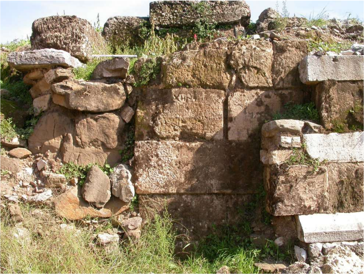
6. Επιγραφές σε πωρόλιθους εντοιχισμένους στο μνημείο.

ποδίου και του Μαυσωλείου της Μεσσήνης, σύμφωνα και με τη μαρτυρία ενεπίγραφων επιτύμβιων στηλών, εντοιχισμένων ως οικοδομικό υλικό, σε δεύτερη χρήση, στον εξωτερικό κυρίως τοίχο του ποδίου, ανάγεται στα τέλη της Ιουλιοκλαυδιανής περιόδου, στα χρόνια του αυτοκράτορα Νέρωνα. 5