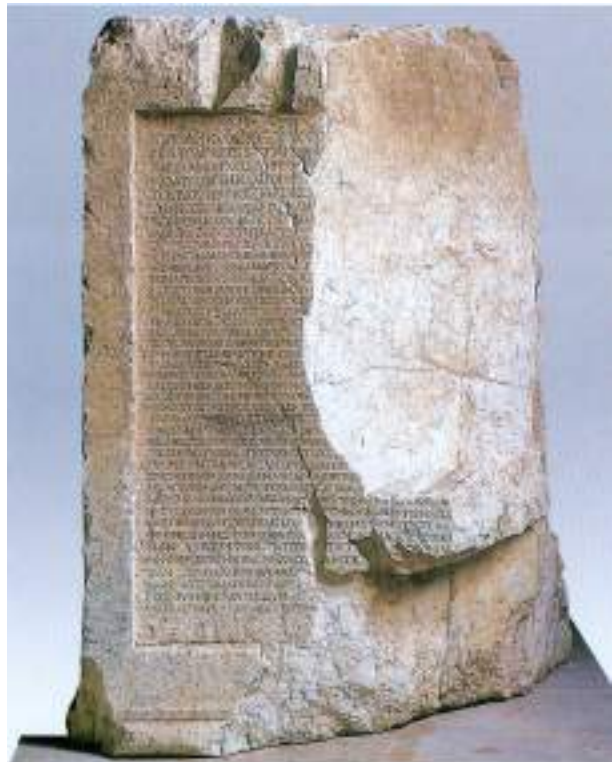
11. Ενεπίγραφο μαρμάρινο βάθρο αγάλματος της οικογένειας των Σαιθιδών.