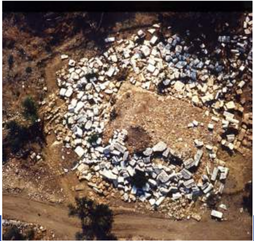
2α-β. Διάσπαρτα αρχιτεκτονικά μέλη του Μαυσωλείου.

κατεστραμμένο πόδιο, χωρίς τους μεταλλικούς συνδέσμους και τις μολυβδοχοήσεις τους (εικ. 2α-β). Το τελευταίο δείχνει ότι η πτώση του μνημείου δεν οφείλεται σε σεισμό ή φυσικά γενικώς αίτια, αλλά σε ανθρώπινη επέμβαση, με στόχο την αφαίρεση των μετάλλων. Τα ίχνη άλλωστε των χτυπημάτων με καλέμι γύρω από τις εντορμίες και τις οπές γόμφωσης, για την αφαίρεση των μεταλλικών συνδέσμων, των γόμφων και της μολυβδοχοήσης, είναι εμφανή. Οι σεισμοί, τα φυσικά φαινόμενα, οι εισβολείς αλλόγλωσσοι λαοί δεν προκαλούν από μόνοι τους την κατάρρευση των