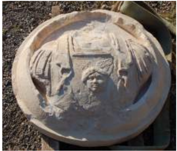
7. Προτομή θωρακοφόρου σε ασπίδα από το αέτωμα του μνημείου.

4. Αρ. ευρ. 948. ύψ. 0,20μ. Ανδρική κεφαλή από ασβεστόλιθο, ελλειπής και διαβρωμένη, φυσικού περίπου μεγέθους (εικ. 9). Τα χαρακτηριστικά είναι ιδεαλιστικά, τα μαλλιά δηλώνονται ως ενιαία μάζα με επιπεδόγλυφους κυματοειδείς βοστρύχους. Πρόκειται για κλασικιστικό έργο των μέσων του 2ου αι. μ.Χ., έχοντας ως πρότυπο έργα του πρώιμου 4ου αι. π.Χ. 11