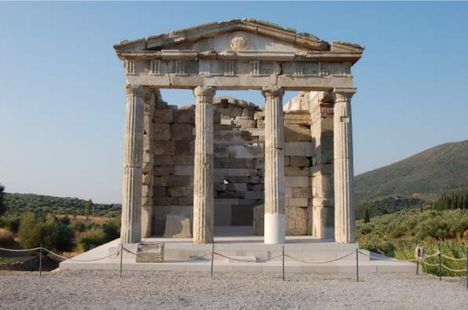
13. Άποψη του Μαυσωλείου.

νομένης της απόδοσης ετήσιων ηρωϊκών τιμών στα νεκρά μέλη της (εικ. 13). Αγώνες «Σαιθίδια», ανάλογα των «Ευρυκλείων», δεν μαρτυρούνται στη Μεσσήνη, ωστόσο η σχέση του Μαυσωλείου-ηρώου με το Στάδιο και τους εκεί τελούμενους αγώνες είναι δεδομένη. 29 Άνεξαρτήτως της επιικής παράδοσης για τα «ἄθλα ἐπὶ Πατρόκλῳ» και την ακόμη πρωϊμότερη σχέση του τάφου-ηρώου του Πέλοπος με τους Ολυμπιακούς αγώνες, η σχέση ηρώων και αφηρωϊσμένων επιφανών νεκρών με αγώνες γυμνικούς, ιππικούς και μουσικούς μαρτυρείται και για την Ελληνιστική περίοδο, τόσο φιλολογικά όσο και επιγραφικά [Πλούταρχος, Τιμολέων 39.5]. 30 Χαρακτηριστικό παράδειγμα αποτελούν οι αγώνες γυμνικοί, ιπ-