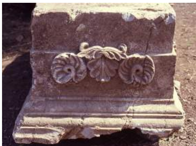
5α-β. Τα αρχιτεκτονικά στοιχεία του μνημείου ως μάρτυρες χρονολόγησης.