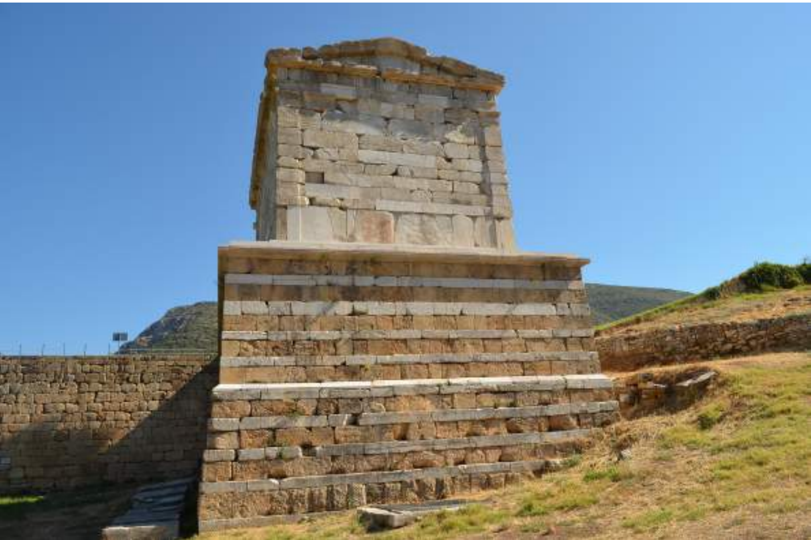
14. Το πόδιο του Μαυσωλείου.

στάδες παρουσιάζουν επίσης μείωση του πάχους τους από κάτω προς τα επάνω και αλλαγή στο ύψος των δόμων από μικρότερο σε μεγαλύτερο, προχωρώντας σταδιακά από τον πρώτο δόμο του τοίχου πάνω από τους ορθοστάτες ως τον τελευταίο. Επιστύλιο και δωρική φρίζα είναι συμφυείς σε μία λιθόπλινθο πάνω από την πρόστυλη πρόσοψη, ενώ είναι διαχωρισμένες σε δύο σειρές (δόμους) πάνω από τους τοίχους στις πίσω και τις πλάγιες πλευρές του Ηρώου.