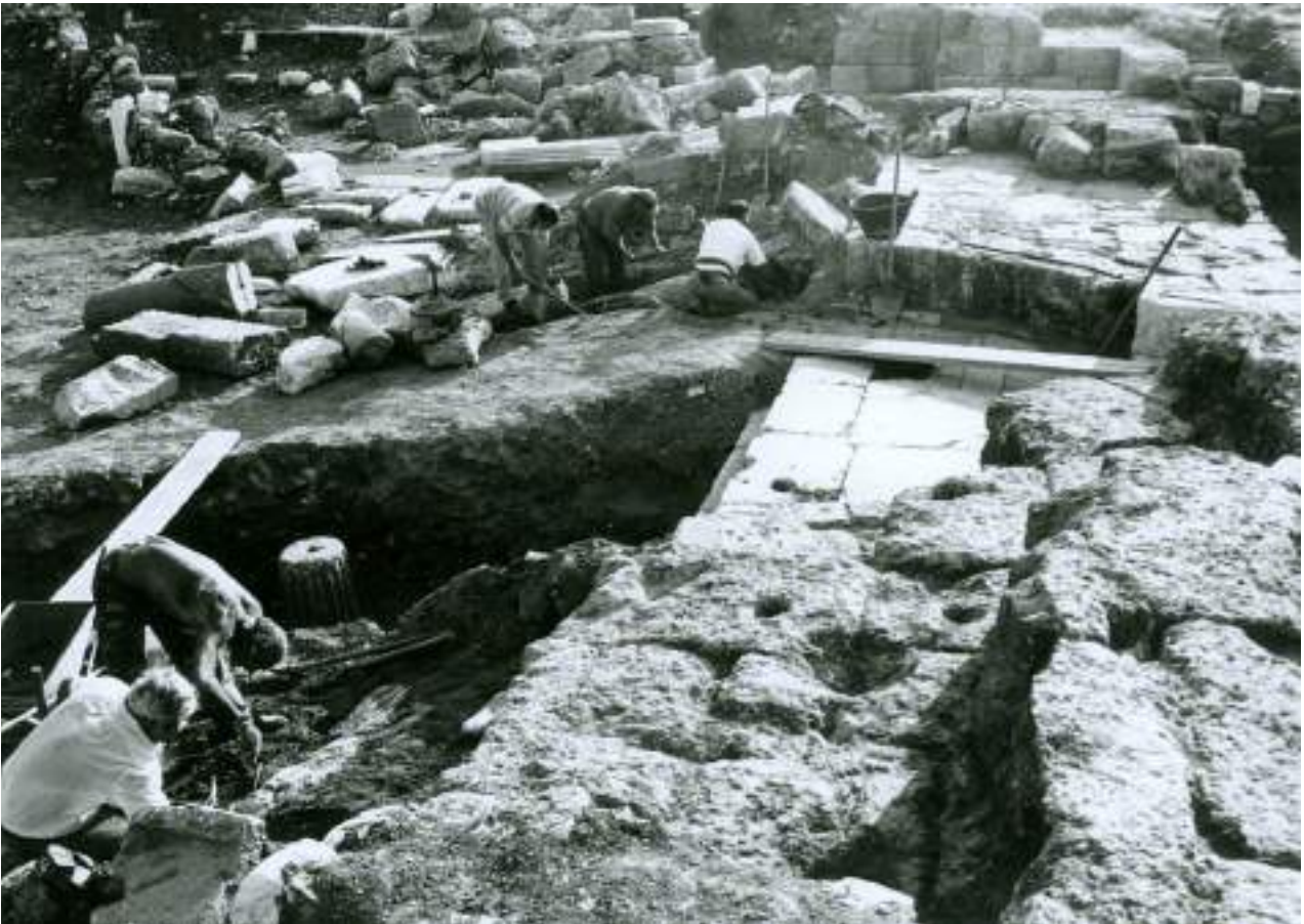
3. Άποψη του ερειπιώνα της αρχαίας Μεσσήνης πριν από τις αναστηλωτικές εργασίες.

πολιτισμών –όπως μαθαίνουμε συνήθως στο σχολείο– αλλά αποτελούν επακόλουθα μιας προηγηθείσης οικονομικής κατάρρευσης. 2 Οι «βάρβαροι» εισβολείς αποτρέπονται και οι φυσικές καταστροφές οδηγούν στην οικοδόμηση ισχυρότερων και λαμπρότερων κατά κανόνα κτισμάτων, όταν το κράτος είναι ακόμη οικονομικά ανθηρό, όπως συνέβη, για παράδειγμα, με τα νέα ανάκτορα της Κνωσού, που αντικατέστησαν τα παλαιά, ή ακόμα και με τη μετασεισμική Καλαμάτα που αναγεννήθηκε λαμπρότερη. Η Ιαπωνία δεν κατέρρευσε από τους σεισμούς, ούτε από το καταστροφικό τσουνάμι. Ο απέραντος ερειπιώνας που αντικρίσαμε στη Μεσσήνη κατά τη διάρκεια των ανασκαφών, πριν από τις εργασίες αναστήλωσης και ανάδειξης (εικ. 3), ήταν αποτέλεσμα της δράσης των απελπισμένων ενδεών κατοίκων της Μεσσήνης των λεγόμενων «σκοτεινών αιώνων», οι οποίοι κυνηγούσαν τα μέταλλα, τους σιδερένιους συνδέσμους και το χυτό μολύβι,