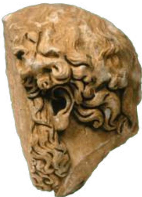
8. Μαρμάρινη εικονιστική κεφαλή γενειοφόρου άνδρα.

Όλα τα ευρήματα αποκαλύπτουν τον χθόνιο, ταφικό χαρακτήρα του οικοδομήματος. Στην ανωδομή του ποδίου έχουν χρησιμοποιηθεί εξωτερικά αβεστολιθικές λιθόπλινθοι, προερχόμενες στην πλειονότητά τους από προγενέστερα οικοδομήματα, ενώ ορισμένες αποτελούν μεγάλου