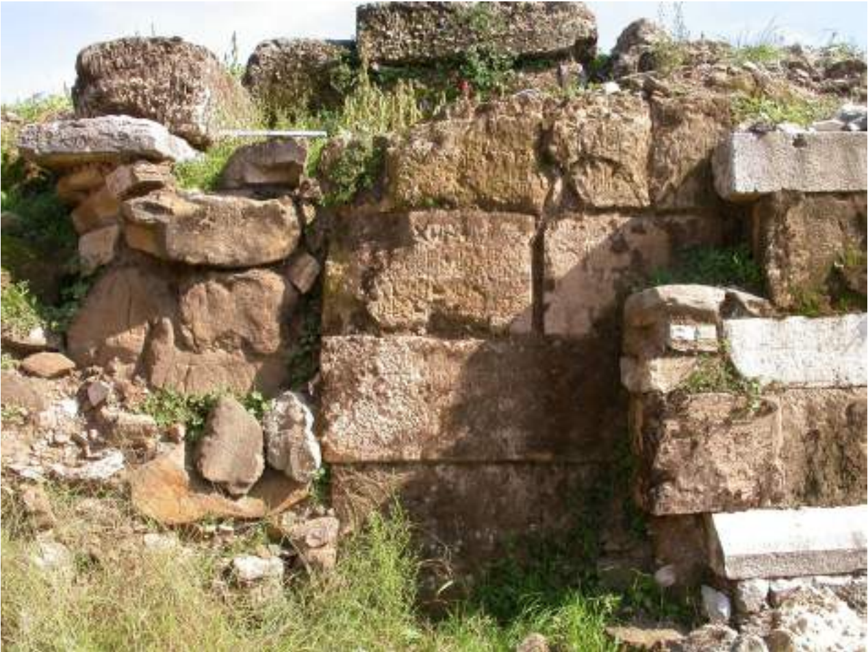
6. Επιγραφές σε πωρόλιθους εντοιχισμένους στο μνημείο.

ποδίου και του Μαυσωλείου της Μεσσήνης, σύμφωνα και με τη μαρτυρία ενεπίγραφων επιτύμβιων στηλών, εντοιχισμένων ως οικοδομικό υλικό, σε δεύτερη χρήση, στον εξωτερικό κυρίως τοίχο του ποδίου, ανάγεται στα τέλη της Ιουλιοκλαυδιανής περιόδου, στα χρόνια του αυτοκράτορα Νέρωνα. 5