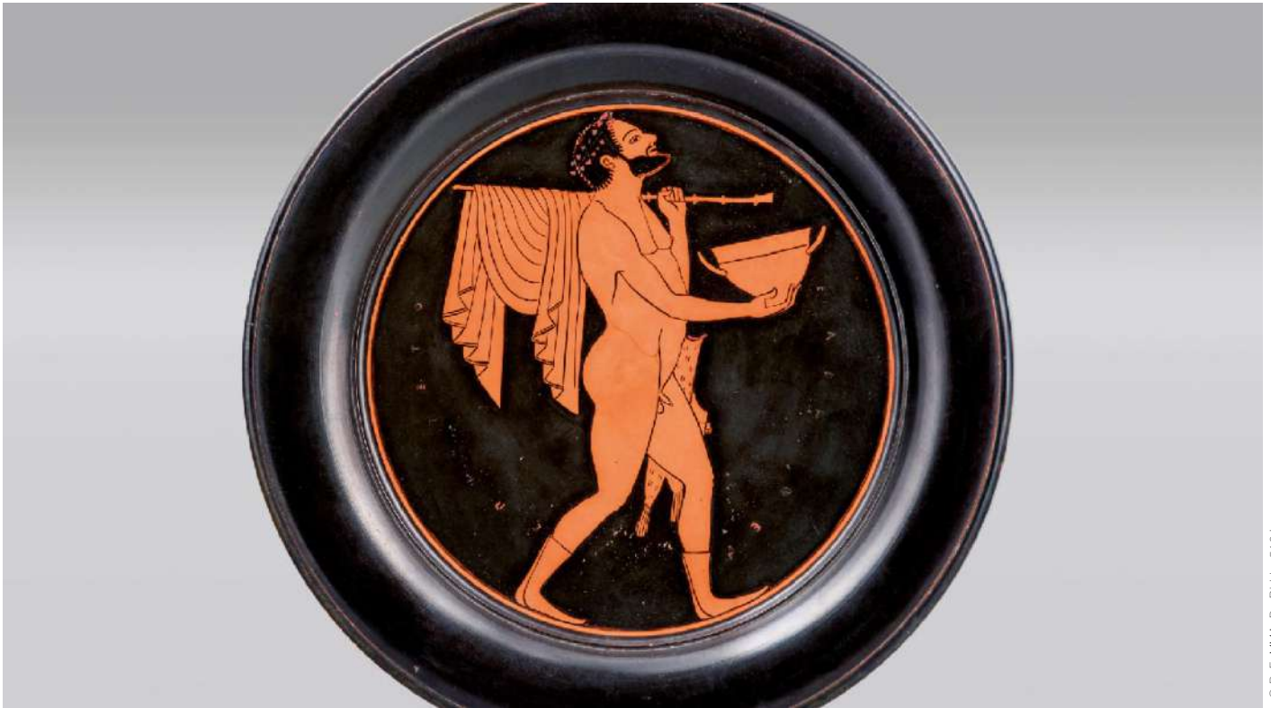
Εσωτερικό αττικού ερυθρόμορφου πινακίου. Κωμαστής, π. 520-510 π.Χ.