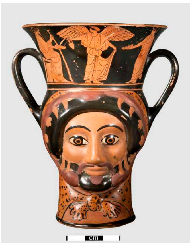
Ερυθρόμορφος κάνθαρος με σχήμα κεφαλής Ηρακλέους, π. 490 π.Χ.