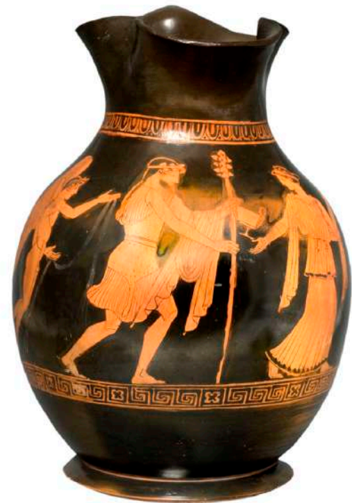
Ερυθρόμορφη οينوχόη. Διόνυσος και Αριάδνη, 5ος αι. π.Χ.

Ο τίτλος της έκθεσης, ενώ παραπέμπει στο θέμα της θαλάσσιας εξερεύνησης, τόσο παρόν σήμερα στη Μασσαλία, λέει επίσης κάτι σχετικά με την αποκλειστικότητα του κεραμικού υλικού στην έκθεση: όπως οι συμποσιαστές πριν από αυτόν, ο επισκέπτης έρχεται αντιμέτωπος με τις ποιητικές εικόνες που παρουσιάζουν τα αγγεία. Στην αρχαιότητα, τα αγγεία προσέφεραν μια πλούσια εικόνα της θάλασσας στα μάτια των προσκεκλημένων, που τα χρησιμοποίησαν κατά τη διάρκεια του συμποσίου, και κάτω από το πινέλο των εφευρετικών κεραμέων, έγιναν επίσης το μέσον για προνομακή και μεταφορική απόδραση των συμποσιαστών στο έλεος μιας «θυελλώδους» περιπέτειας στη θάλασσα.