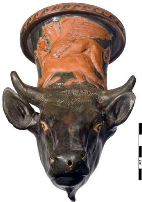
Ερυθρόμορφο ρυτό, με μορφή κεφαλής βοός, με χυτή ανάγλυφη διακόσμηση Γρύπα που επιτίθεται σε άλογο. Ελληνικό εργαστήριο Απουλίας, π. 350-330 π.Χ.