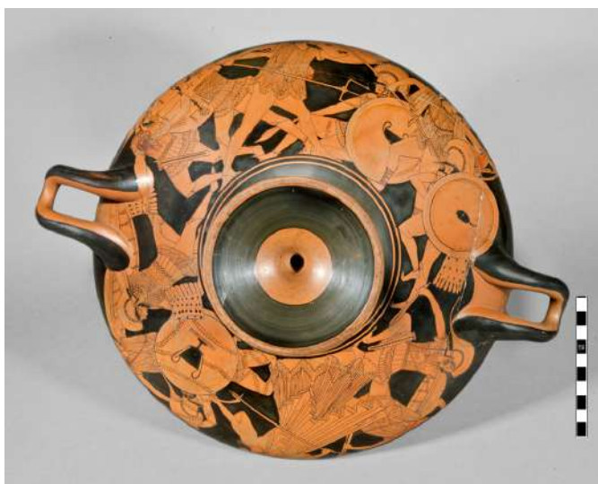
Ερυθρόμορφη κύλικα. Γιγαντομαχία, π. 480-470 π.Χ.