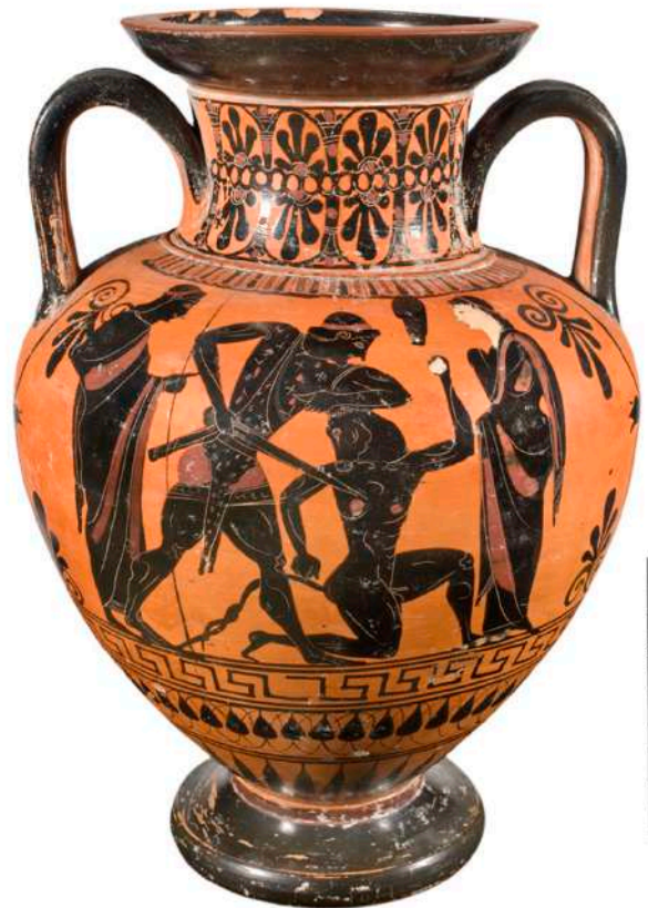
Μελανόμορφος αμφορέας. Ο Θησέας σκοτώνει τον Μινώταυρο, π. 530-510 π.Χ.