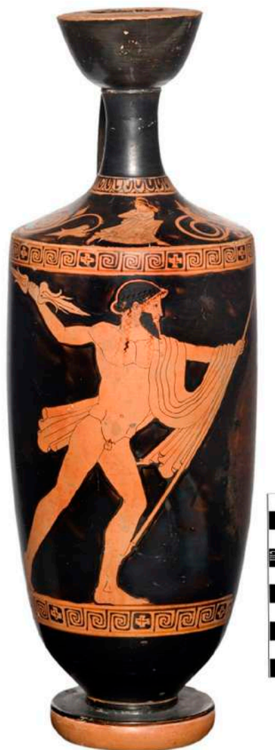
Ερυθρόμορφη Λήκυθος. Ο Δίας ρίχνει κεραυνό, π. 470-460 π.Χ.