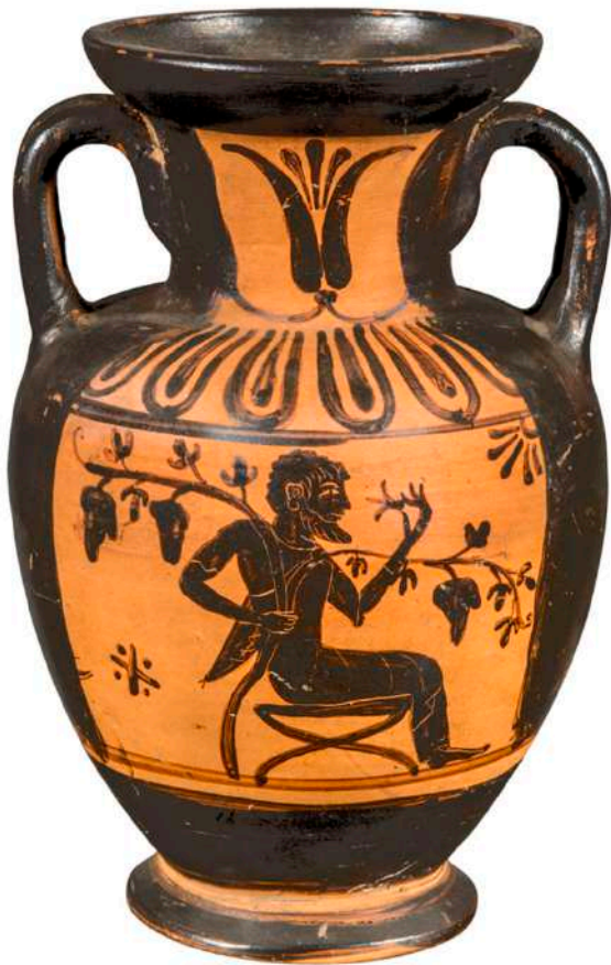
Αμφορέας. Ο Διόνυσος με αμπέλι. Εργαστήριο Ετρουρίας, 6ος αι. π.Χ.