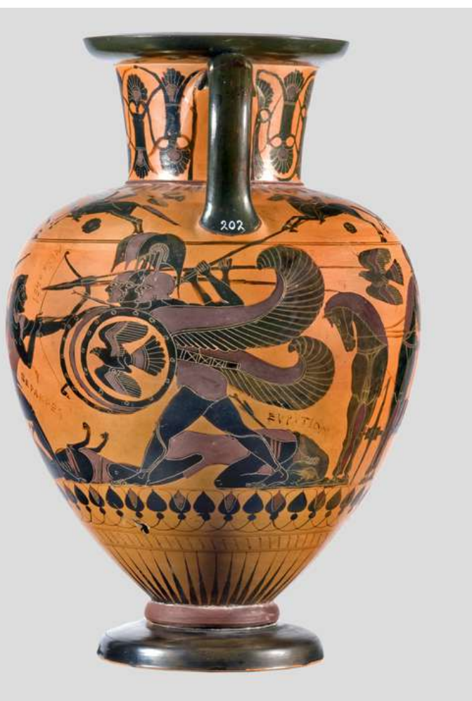
Μελανόμορφος αμφορέας. Ο Ηρακλής παλεύει με τον Γηρυόνη, 540-530 π.Χ.