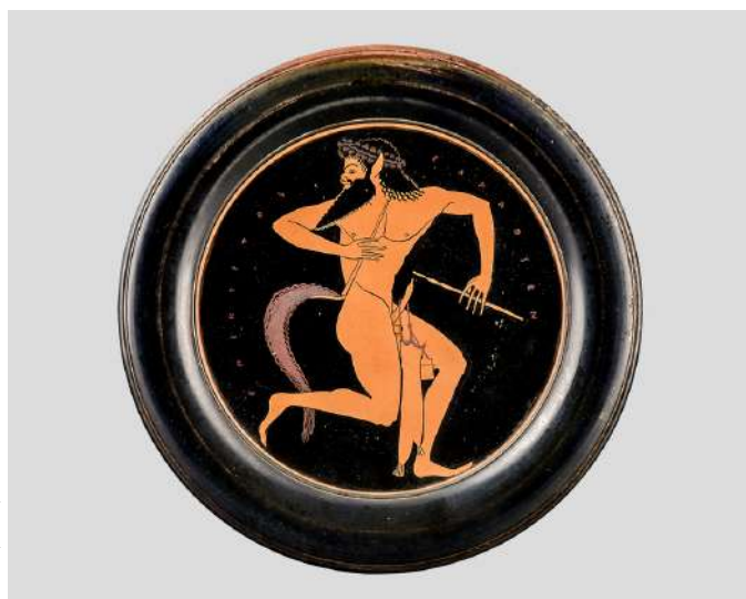
Ερυθρόμορφο πινάκιο. Σάτυρος, με την επιγραφή ΕΠΙΚΤΕΤΟΣ ΕΓΡΑΦΣΕΝ, περ. 520 π.Χ.