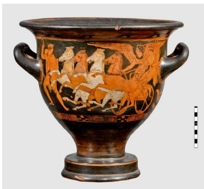
Ερυθρόμορφος κρατήρας. Αποθέωση του Ηρακλή, 5ος αι. π.Χ.

μελανόμορφα και ερυθρόμορφα αγγεία) και αφετέρου δίνεται η δυνατότητα να ακολουθήσει κανείς ποικίλες πολιτιστικές διαδρομές με συναντήσεις σημαντικών μυθολογικών μορφών, όπως ο Ηρακλής, ο Θησέας, ο Ιάσοντας, ο Οδυσσέας. Δεν ξεχνάμε φυσικά τους ιδρυτές της πόλης της Γκύπιδος και του Πρωτέα, των οποίων η ένωση και το εξαιρετικό πεπρωμένο της Μασσαλίας συνοψίζονται σε ένα απλό κύπελλο.