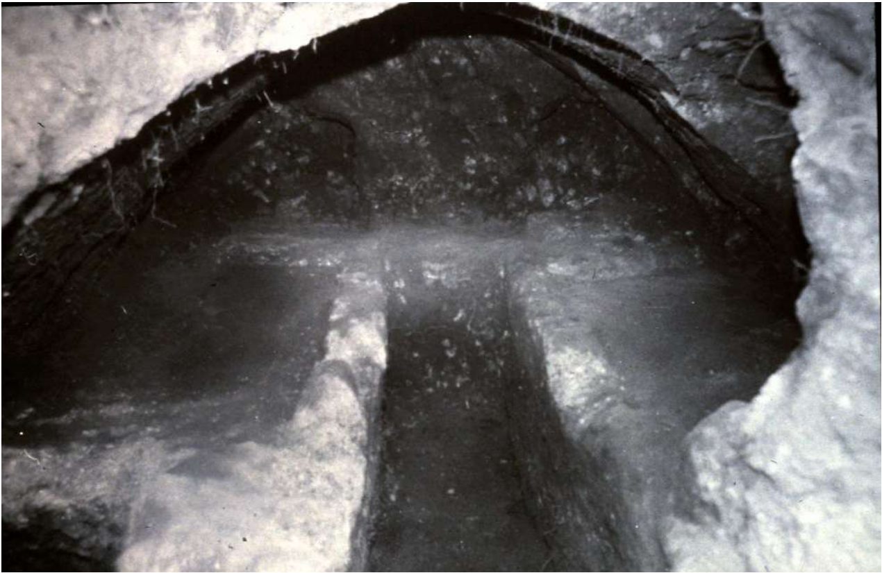
7. Λαξευτός θαλαμωτός ελληνιστικός τάφος στο Β νεκροταφείο (οδός Μαλιέων).