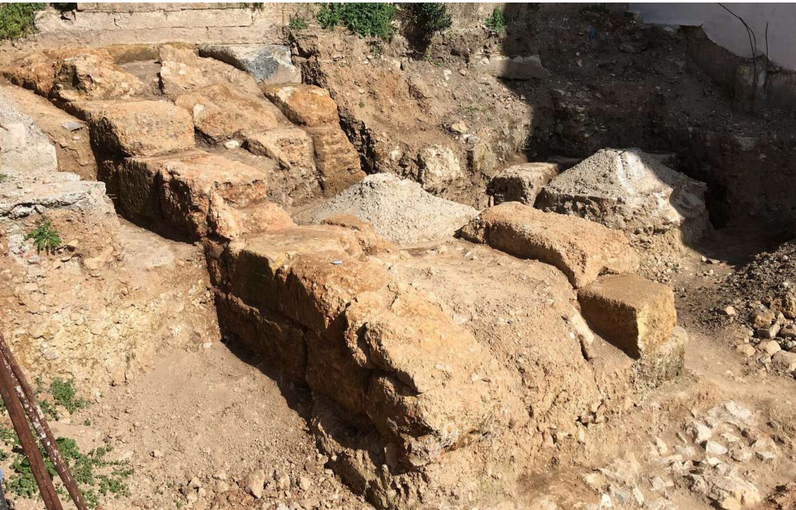
10. Το βόρειο τμήμα του τείχους στην οδό Όθωνος αρ. 47 από ΝΔ.

σε βάθος 0,28 μ. στη δυτική πλευρά, ενώ η έδραση της ανατολικής πλευράς του αποκαλύφθηκε σε ύψος 0,11 μ. (0.00: το πεζοδρόμιο της οδού Όθωνος).