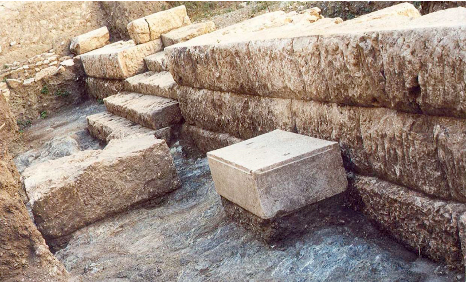
4. Τμήμα αναλημματικού τοίχου του ανδρήρου και κλίμακα του ηρώου στον χώρο της αρχαίας αγοράς (οδός Αινιάνων).

τον πρώιμο 3ο αι. π.Χ. και καταστράφηκε τον 2ο αι. π.Χ.