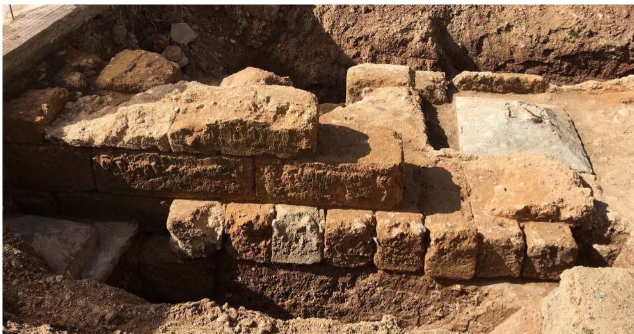
11. Η ανατολική όψη του Ν τμήματος του τείχους στην οδό Όθωνος αρ. 47.

μησης. Ορισμένες λιθόπλινθοι βρέθηκαν θραυσμένες και μετακινημένες.