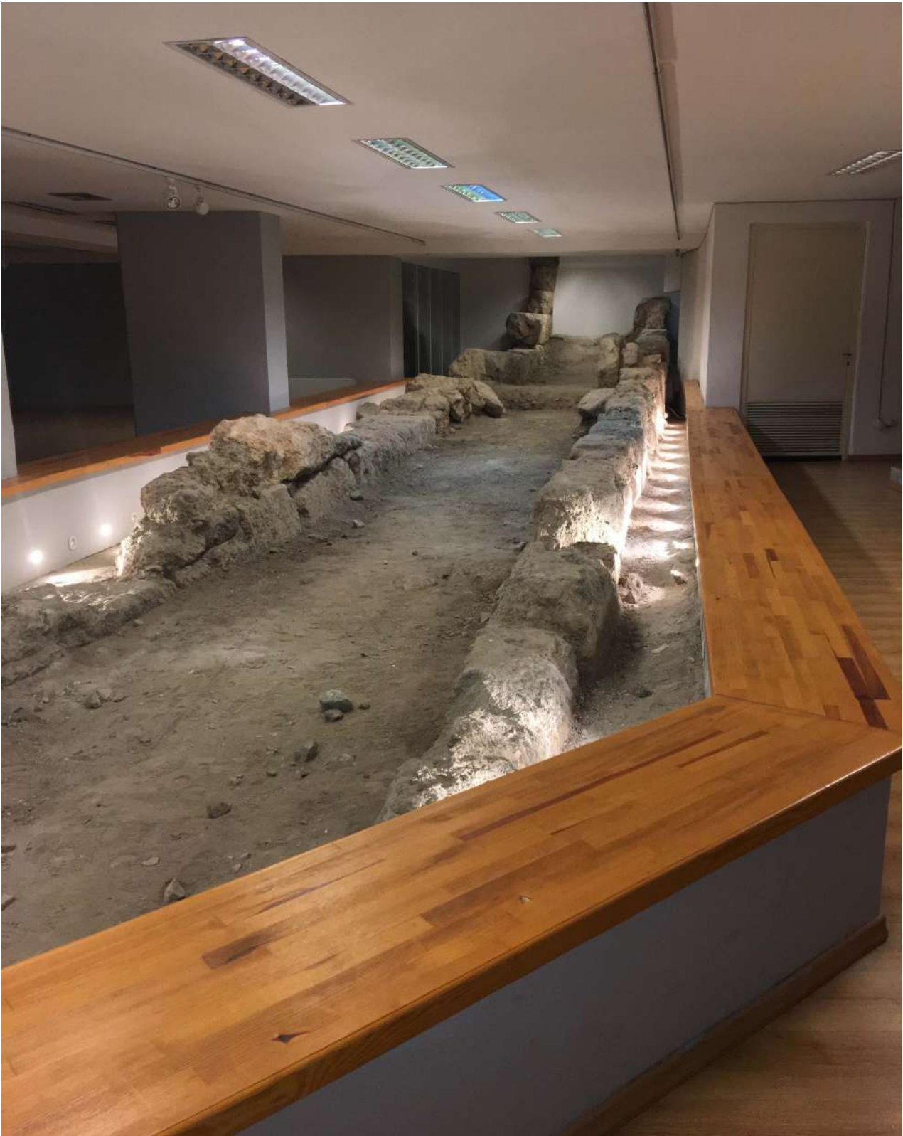
5. Τα διατηρηθέντα οικοδομικά λείψανα στην «Αίθουσα της αρχαίας αγοράς» στο υπόγειο της Δημοτικής Πινακοθήκης (οδός Αινιάνων).