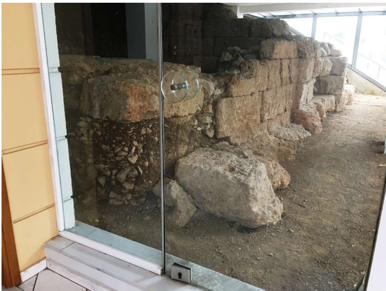
3. Κατάλοιπα πύργου του ελληνιστικού τείχους (στη συμβολή των οδών Καραϊσκάκη και Καζούλη).

του Αγίου Λουκά και ακολούθως, με κατεύθυνση Α-ΒΑ, κατέληγε στη δυτική πλευρά της ακρόπολης.