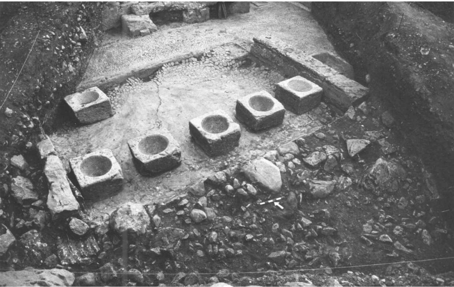
6. Λεπτομέρεια του λουτρού (μαρμάρινοι ποδονιπτήρες) της παλαίστρας του Γυμνασίου (οδός Θερμοπυλών).

σίου στην οδό Θερμοπυλών (εικ. 6), που οικοδομήθηκε μετά τα μέσα του 4ου αι. π.Χ. Η παλαίστρα, αμέσως μετά την καταστροφή της από σεισμό τον 3ο αι. π.Χ., ανοικοδομήθηκε με κάποιες μετασκευές στο λουτρό, ενώ περί τα τέλη του 2ου αι. π.Χ. καταστράφηκε και πάλι από σεισμό. 18