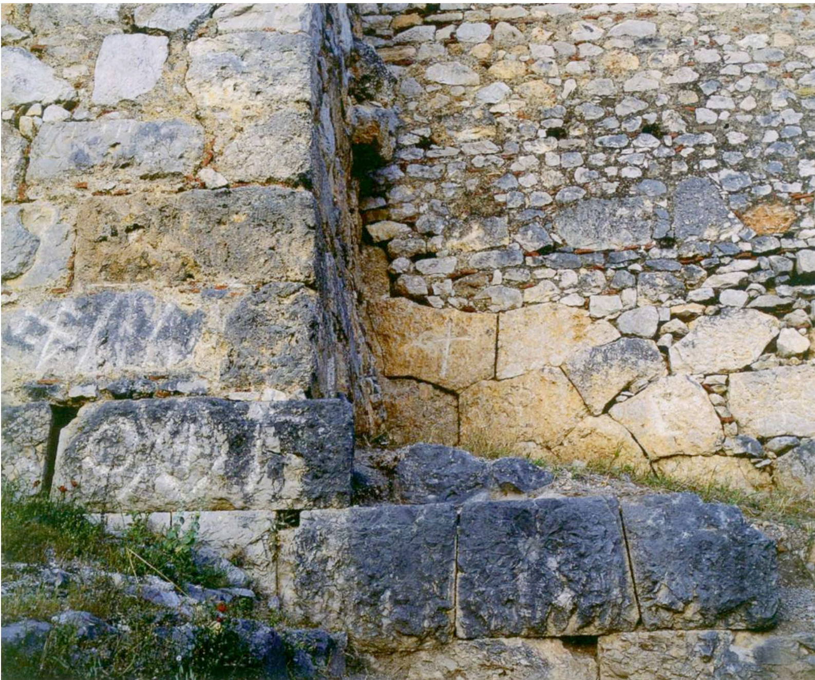
2. Διαδοχικά συστήματα δόμησης στο ΒΔ άκρο της οχύρωσης της αρχαίας ακρόπολης.

4ου αι. π.Χ. 7 (εικ. 2). Η οχύρωση της ακρόπολης και της κάτω πόλης, η οποία πιθανώς οχυρώθηκε για πρώτη φορά μετά τα μέσα του 4ου αι. π.Χ., επεκτάθηκε και συμπληρώθηκε από τον Μακεδόνα στρατηγό Αντίπατρο κατά την περίοδο του Λαμακού πολέμου 8 και ολοκληρώθηκε την εποχή της ένταξης της πόλης στην Αιτωλική Συμπολιτεία.