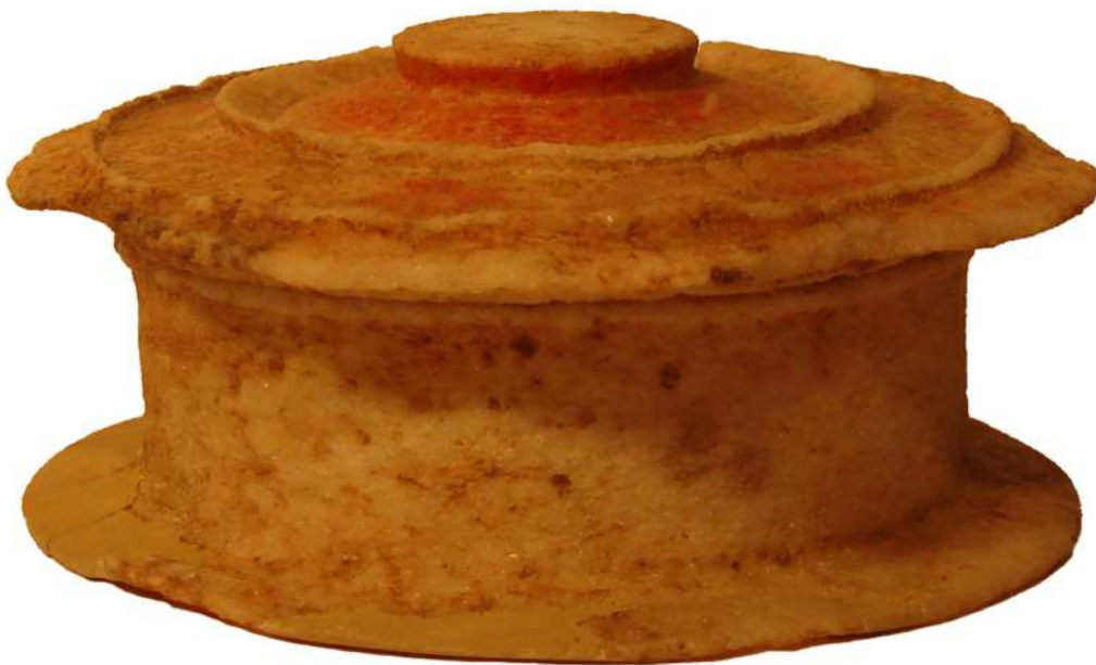
8. Αλαβάστρινη πυξίδα (β' ήμισυ 4ου - αρχές 3ου αι. π.Χ.) από κιβωτιόσημο τάφο στο Ν νεκροταφείο (οδός Σκουφά).