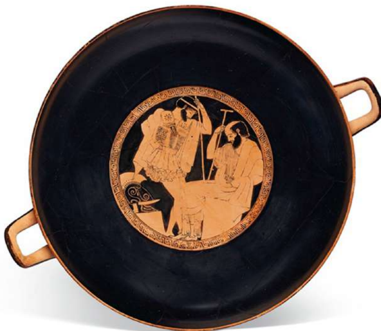
Κύλικά του Μάκρωνα. Σκηνή στο εσωτερικό της κύλικας, όπου εικονίζονται ο βασιλιάς της Πύλου Νέστορας (καθιστός) και ο γιος του Αντίλοχος (όρθιος).

Με τεχνοτροπία αβρή στην εκτέλεση, ο Μάκρων ζωγράφησε στις πρώτες δεκαετίες του 5ου αιώνα π.Χ. πλήθος κύλικες και μάλιστα αποκλειστικά του κεραμέα Ιέρωνα. Ο Μάκρων ζωγράφιζε κωμαστές, σατύρους, μαινάδες, και αγαπά και διαλέγει μυθικές παραλλαγές λιγότερο