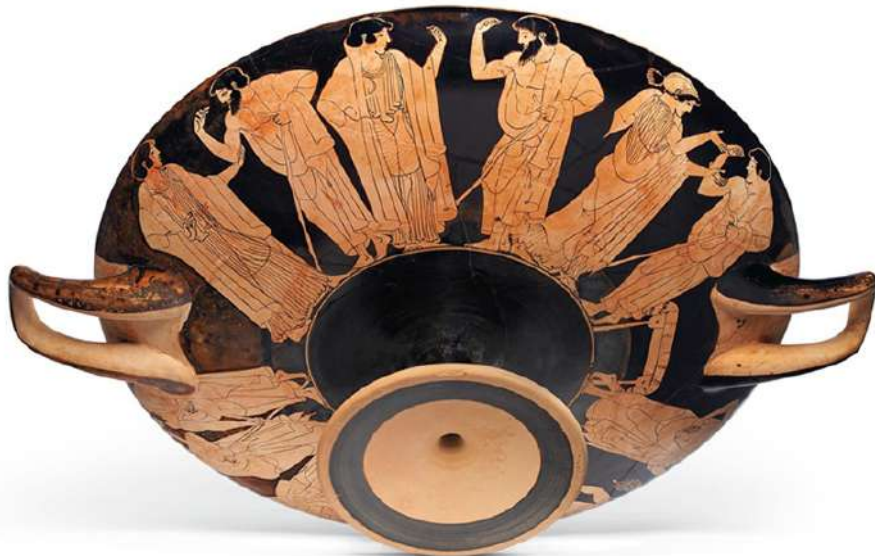
Κύλικα του Μάκρωνα, περί το 490-480 π.Χ. (34 εκ. διάμετρος από τις λαβές).

γνωστές, ιδίως από τα Κύπρια, ένα έπος της προϊστορίας του Τρωικού πολέμου, σκηνές που αναφέρονται στον Πάρι και την Ελένη.