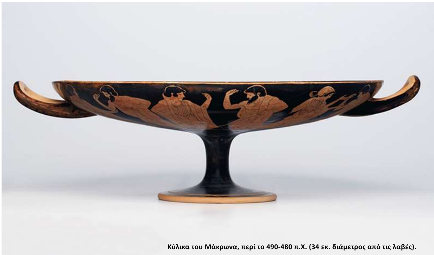
Κύλικά του Μάκρωνα, περί το 490-480 π.Χ. (34 εκ. διάμετρος από τις λαβές).

Σ ημαντικές ελληνικές αρχαιότητες δημοπρατήθηκαν (13/10/2020) από τον Οίκο Christie's. Οι ελληνικές αρχαιότητες δεσπόζουν στον κατάλογο που δημοσιοποίησε ο γνωστός οίκος. Ανάμεσά τους, κυκλαδικά ειδώλια και υστερομινωικές λάρνακες, χάλκινα κορινθιακά κράνη και αττικοί μελανόμορφοι αμφορείς, λευκές λήκυθοι και ερυθρόμορφες κύλικες, κεφαλές και κορμοί ειδωλίων και αγαλμάτων κλπ.