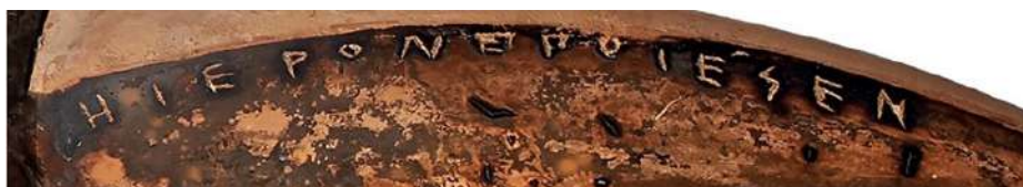
Λεπτομέρεια της λαβής με την υπογραφή του αγγειοπλάστη Ιέρωνα.

τανικό Μουσείο και το Getty. Ο Οίκος Christie's υποστηρίζει ότι η δημοπρασία της κύλικας είναι «νόμιμη», με το επιχείρημα ότι η εν λόγω κύλικα «δημοσιεύθηκε για πρώτη φορά το 1963 στο έργο του Beazley Attic Red Figure Vase-Painters», και ότι «αυτό σημαίνει ότι δεν αντίκειται στη σύμβαση της UNESCO που απαγορεύει τη μεταφορά πολιτιστικής ιδιοκτησίας που ανακαλύφθηκε μετά το 1970». Θα ήταν ενδιαφέρον να γνωρίζαμε την άποψη των ελληνικών αρχών για το ζήτημα.