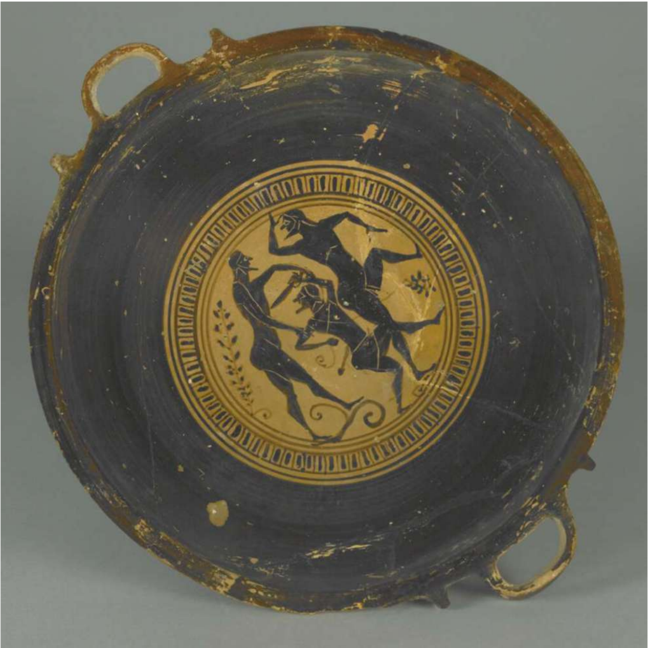
7. Εσωτερική παράσταση της λεκανίδας του Βρετανικού Μουσείου B80.

άσβεστης φωτιάς της πνευματικής γνώσης που πρέπει συνεχώς να αναζωπυρώνεται. 83