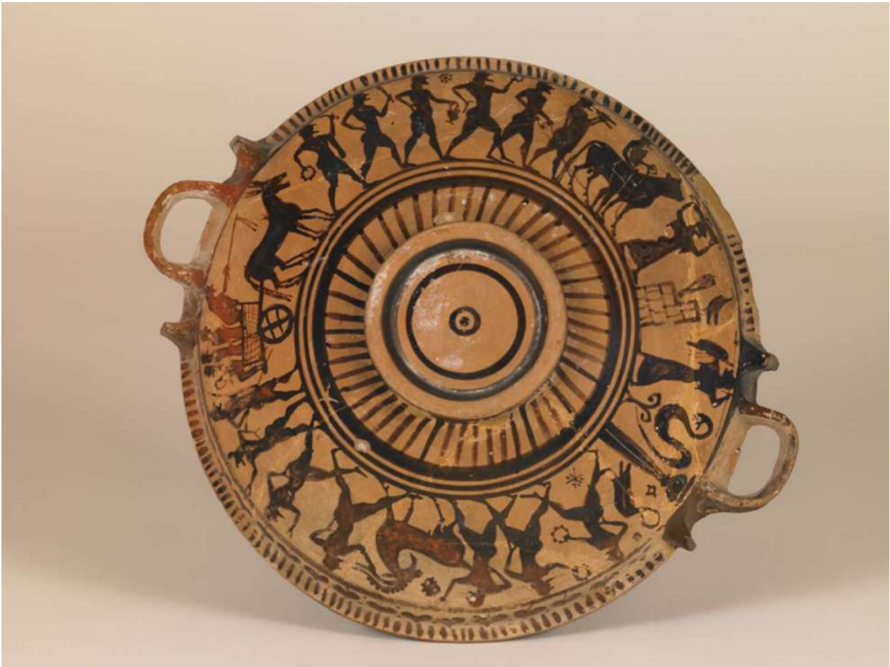
5. Εξωτερική παράσταση της Λεκανίδας του Βρετανικού Μουσείου B80.

Ο Κέρβερος συνδέει την Ιτωνία με μια άλλη λατρεία που μαρτυρείται στην περιοχή της Κορώνειας, αυτήν του Ηρακλέους Χάροπος (Πανσ. 9.34.5), στον οποίο αποδίδονται επίσης τα επίθετα Παλαίμων και Καλλίνικος . 27 Σύμφωνα με έναν τοπικό μύθο που αναφέρει ο Πausanias, στις πηγές του Φάλαρον ο Ηρακλής ανέβασε από τον Κάτω Κόσμο τον Κέρβερο.