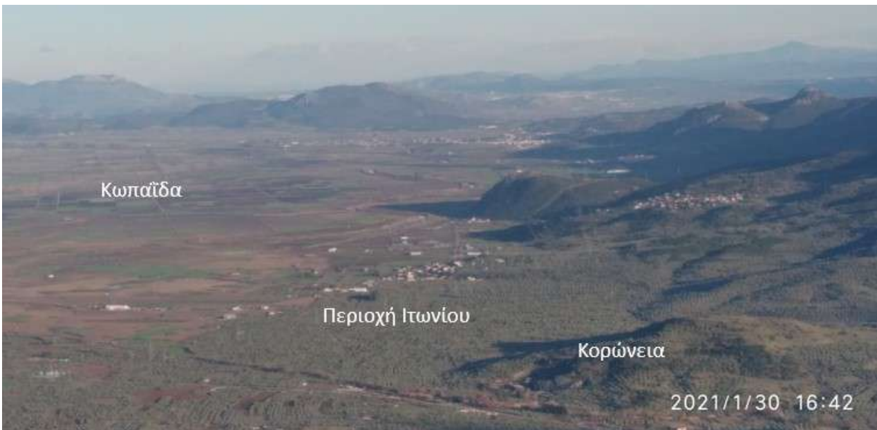
3. Η θέση της αρχαίας Κορώνειας. Άποψη από το Λαφύστιο Όρος, Δυτικά.

Το ιερό βρισκόταν πλησίον της αρχαίας πόλης της Κορώνειας (εικ. 3), στην οποία τεκμηριώνεται αδιάλειπτη κατοίκηση από τον 10ο αι. π.Χ. έως τον 14ο αι. μ.Χ. 12 Η Κορώνεια βρισκόταν στα νότια της λίμνης Κωπαΐδας, στους πρόποδες του Ελικώνα, κτισμένη σε λόφο που περιβάλλουν δύο ποτάμια, δυτικά ο Φάλαρος (σημερινή Πότζα) και ανατολικά ο Κουάριος (σημερινό ρέμα Κάκαρι/Κάρκαρι). Μυθικός ιδρυτής της ήταν ο Κόρωνος, αδελφός του Αλιάρτου. Ήταν γιοι του Θέρσανδρου και εγγονοί του Σίσυφου, του τραγικού ήρωα που βασίλευσε στην Κόρινθο και θεωρείται σύμβολο της ανθρώπινης μοίρας. Η καταγωγή του Κόρωνου τον συνδέει με τον Αίοιο, τον Δευκαλίωνα και τον Προμηθέα. Όμως τα εδάφη, όπου έκτισαν τις πόλεις τους τα δύο αδέρφια, τους παραχωρήθηκαν από τον θείο τους τον Αθάμαντα, τον γιο του Αίοιου, θρυλικό ήρωα των Μινύων του Ορχομενού στην αυλή του οποίου μεγάλωσε ο Θέρσανδρος. Άλλες παραδόσεις παρουσιάζουν τον Κόρωνο γιο του Αθάμαντα, όπως και πολλούς άλλους οικιστές της Βοιωτίας. 13 Ο Αθάμας παραδίδεται πως ήλθε από τη θεσσαλική Άλω, όπου βασίλευε (Ηρόδοτος 7.197· Στράβων 9.5.8), και έχει συνδέσει το όνομά του με την Κωπαΐδα ( Αθαμάντιον πεδίον ) 14 και με τη λατρεία του Δία Λαφύ-