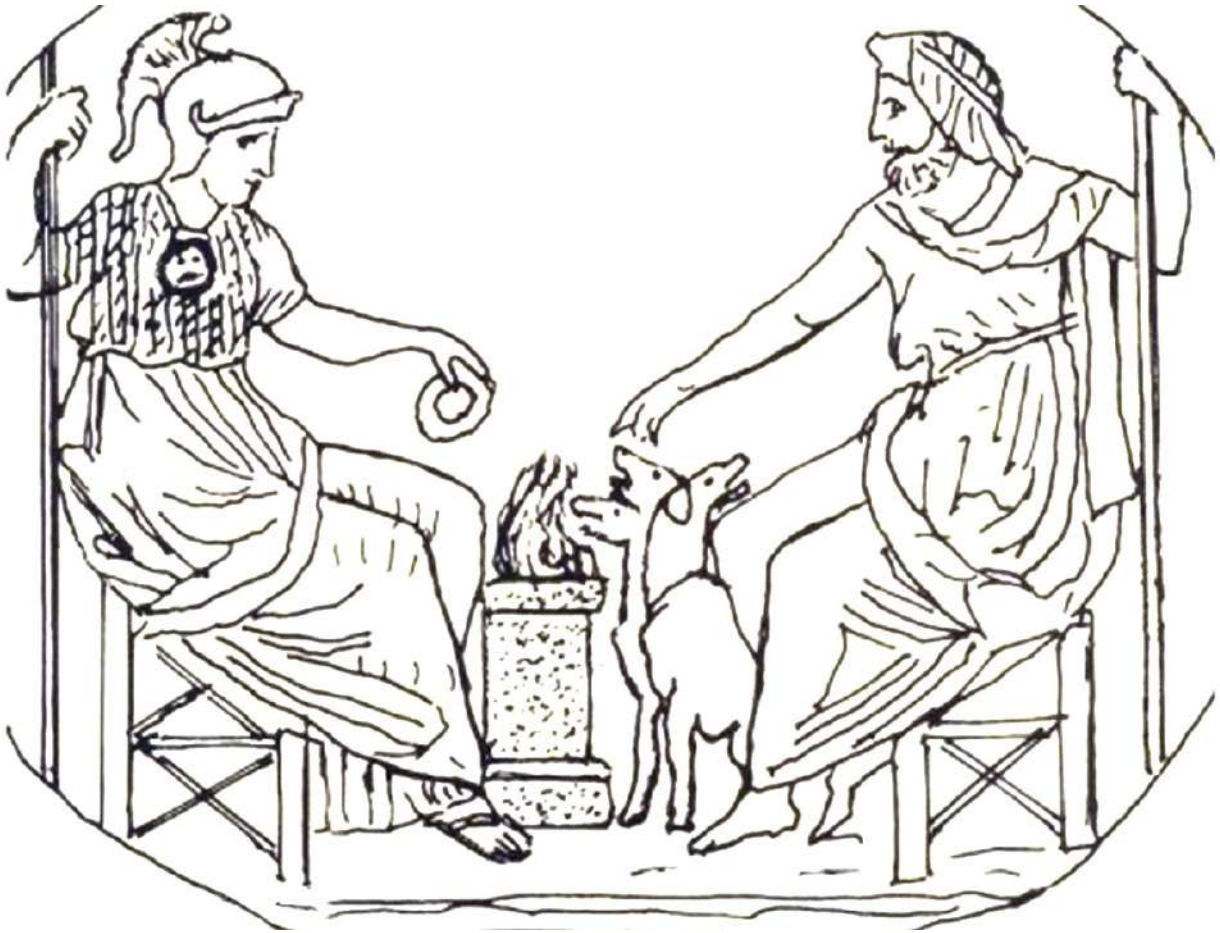
6. Δακτυλιόλιθος της Φλωρεντίας (σχεδιαστική απεικόνιση).

Οι απελευθερωτικές επιγραφές που προαναφέρθηκαν τεκμηριώνουν ότι στην λατρεία του Ηρακλέους Χάροπος υπήρχε ιέρεια, στοιχείο ασυνήθιστο για λατρεία του Ηρακλή που έχει συνδεθεί με τοπικές παραδόσεις, όπως και ο όρκος των απελεύθερων δούλων που αφιερώνονταν στον Ηρακλή Χάροπα . Σε αυτές τις ένορκες αφιερώσεις, η ιέρεια λειτουργούσε ως εγγυήτρια, σαν να αντιπροσώπευε μια παρένθητη μητέρα ή τροφό, ενώ η θεότητα αναφέρεται ως παιδί ή έφηβη. Το όνομα Χάρωψ , που τεκμηριώνεται στη Βοιωτία από τον 6ο αι. π.Χ., συναντάται στην Κορώνεια, στις Θεσπιές και στη Θίβη, αλλά επιβεβαιωμένη επιγραφικά σύνδεσή του με τον Ηρακλή έχουμε μόνο από την πρώτη περιοχή. Η λατρεία του Ηρακλή στη Βοιωτία διαπιστώνεται πως αφορά κυρίως τη γέννηση και τη νεότητά του, και ιδιαίτερα στον Ελικώνα φαίνεται πως τιμάται ως νεαρός ήρωας