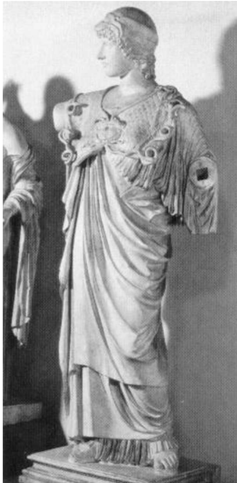
2. Ρωμαϊκό αντίγραφο πιθανώς της Ιτωνίας Αθηνάς του Αγοράκριτου (Villa Albani, Ρώμη).

Ο ιερός λόγος ήταν απόρρητος και ανακοινώνοταν μόνο σ' όσους είχαν μυηθεί, γιατί μόνο οι μυημένοι μπορούσαν να καταλάβουν το βαθύτερο νόημα της λατρείας, ενώ ήταν σκληρή η τιμωρία σε περίπτωση αποκάλυψής του. Σύμφωνα με αυτόν η Αθηνά ήταν η Δέσποινα του Κάτω Κόσμου, πάρεδρος του υποχθόνιου Δία-Άδη. Με αυτή την ιδιότητα θεωρείται ότι παριστανόταν και στο χάλκινο λατρευτικό άγαλμα που είδε στον ναό ο Πausανίας (9.34.1), έργο του φημισμένου γλύπτη Αγοράκριτου, μαθητή του Φειδία και συνεργάτη του στον Παρθενώνα. Ρωμαϊκό αντίγραφο (εικ. 2) χαμένου χάλκινου αγάλματος, χρονολογούμενου μεταξύ 430-420 π.Χ., θεωρείται πως αποδίδει την Ιτωνία Αθηνά του Αγοράκριτου, εξαιτίας του ασυνήθιστου σκούφου που φορά στο κεφάλι της, ο οποίος ερμηνεύεται ως Άδου κνήην, δηλαδή τον σκούφο από δέρμα σκύλου που φορούσε ο Άδης και τον έκανε αόρατο. 11