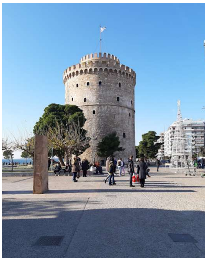
Λευκός Πύργος (φωτ. προσωπικό αρχείο συγγραφέως).

οθωμανικούς χρόνους. Στα τέλη του 19ου αιώνα μετατράπηκε στις γνωστές φυλακές του Γεντί Κουλέ, οι οποίες απομακρύνθηκαν από την περιοχή μόλις το 1989.