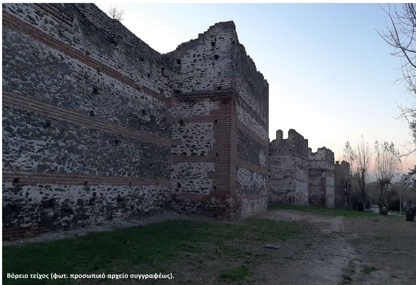
Βόρειο τείχος (φωτ. προσωπικό αρχείο συγγραφέως).

Η Άνω Πόλη αποτελούσε κατά τους οθωμανικούς χρόνους τη μεγαλύτερη μουσουλμανική συνοικία της Θεσσαλονίκης. Η συνοικία πυκνοκατοικήθηκε ιδιαίτερα μετά από την άφιξη προσφύγων κατά τη Μικρασιατική καταστροφή. Σε αυτό το τμήμα της πόλης έχει τη δυνατότητα ο επισκέπτης να θαυμάσει την ισχυρή οχύρωση της Θεσσαλονίκης. Συγκεκριμένα, σώζεται σε πολύ καλή κατάσταση το λεγόμενο «Διάμεσο τείχος», που χώριζε την πόλη από την Ακρόπολη, στο βόρειο άκρο της οποίας βρισκόταν το τελευταίο οχυρό της πόλης, το επονομαζόμενο Επταπύργιο ή αλλιώς Γεντί Κουλέ. Το φρούριο του Επταπυργίου αποτελεί μετασκευή προϋπάρχοντος βυζαντινού φρουρίου και οφείλει το όνομά του στους επτά ορθογώνιους πύργους του. Αποτελούσε έδρα του Τούρκου διοικητή κατά τους