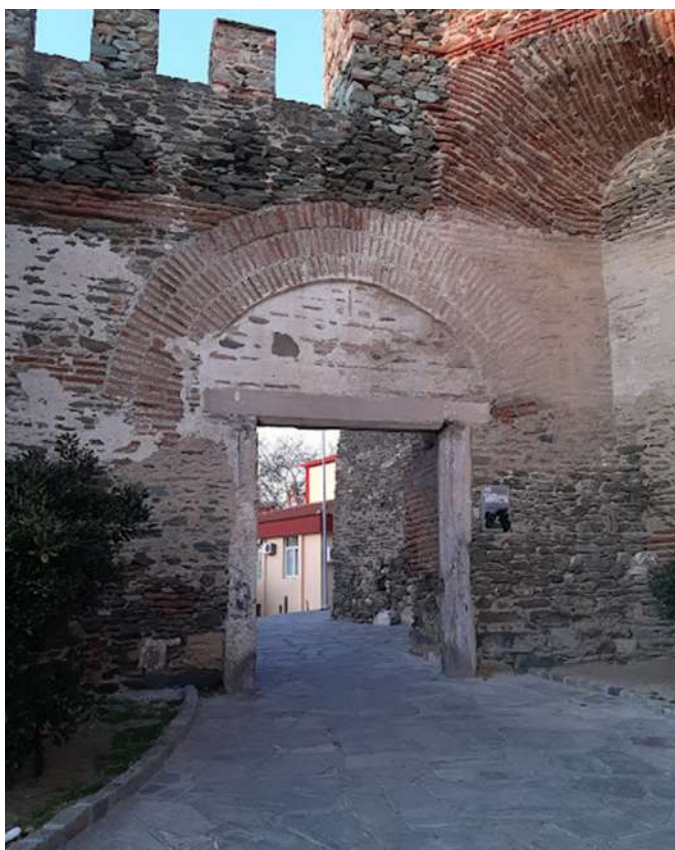
Πύλη Άννας Παλαιολογίνας.