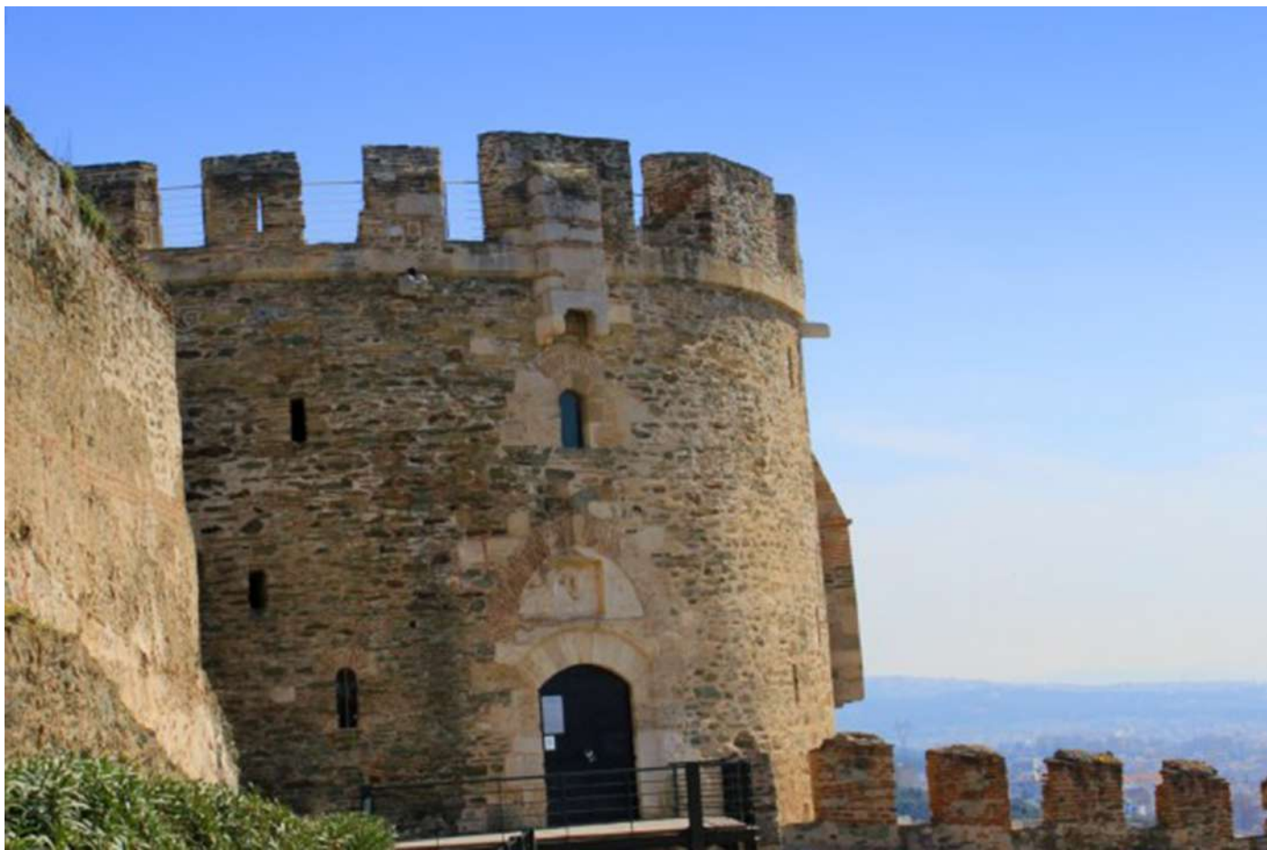
Θεσσαλονίκη. Πύργος Τριγωνίου.