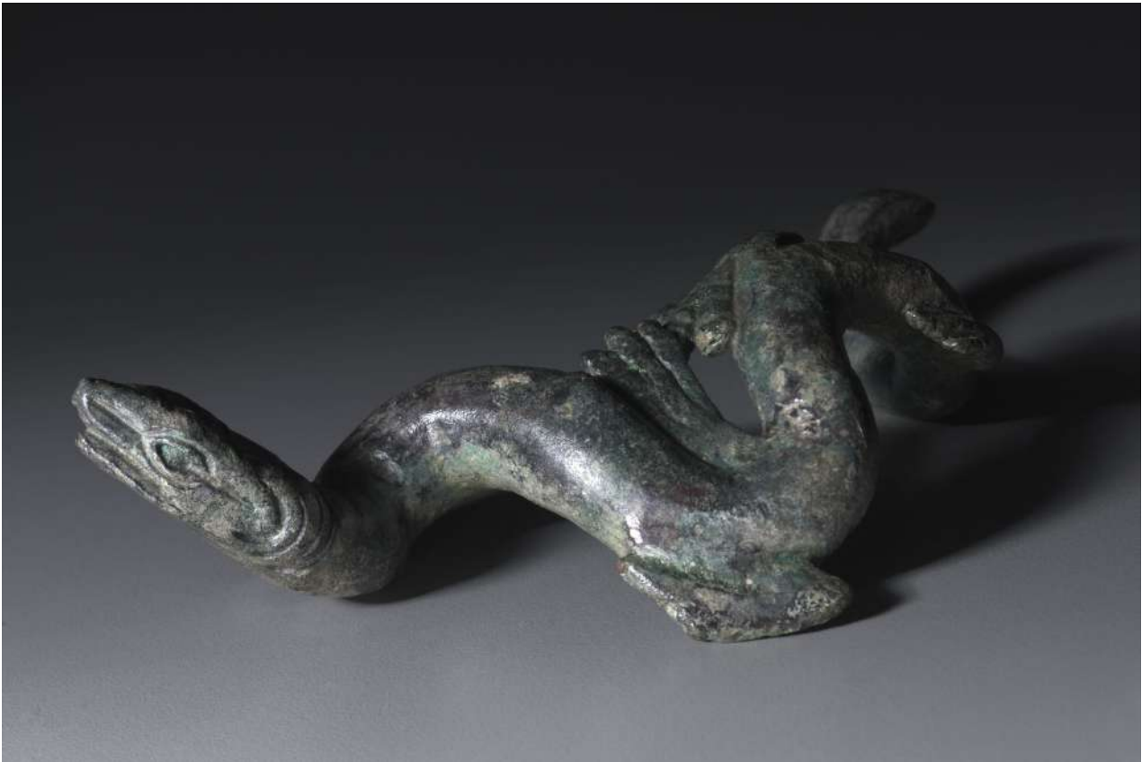
5. Ζωόμορφο σαυροειδές χάλκινο γλυπτό, πιθανώς συνανήκον με τον Απόλλωνα Σαυροκτόνο του Πραξιτέλους που εκτίθεται στο Μουσείο Τέχνης του Cleveland.

ταν πέντε εκατομμύρια δολάρια. Σχετικά με την προέλευση του έργου, το αμερικανικό μουσείο αναφέρει απλώς όσα ισχυρίστηκε η Marinescu. 11