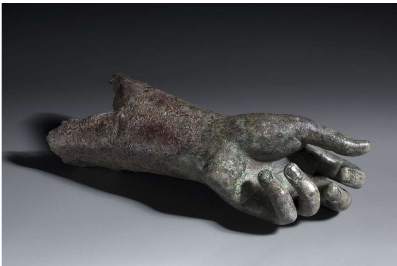
4. Αριστερή παλάμη και τμήμα αριστερού πήχεως από ορείχαλκο, πιθανώς συνανήκοντα στον Απόλλωνα Σαυροκτόνο του Πραξιτέλους που εκτίθεται στο Μουσείο Τέχνης του Cleveland.