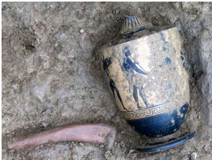
Μελανόμορφη λήκυθος από τον αποθέτη του υστεροαρχαϊκού ναού της Αμαρυσίας Αρτέμιδος στην Αμάρυνθο.

Ήδη από τις πρώτες μέρες της νέας ανασκαφικής περιόδου ήλθαν στο φως σημαντικά ευρήματα από το εσωτερικό του ναού, τα οποία συμπληρώνουν τα αναθήματα του β' ημίσεος του 6ου αι. π.Χ., τα οποία βρέθηκαν το 2020. Πρόκειται για μελανόμορφα αγγεία εισηγμένα από την Αττική, αγγεία τοπικών εργαστηρίων, πήλινα και χάλκινα ειδώλια, κοσμήματα, σφραγιδόλιθους, μία χάλκινη ασπίδα και ένα σιδερένιο κράνος. Κάτω από τον υστεροαρχαϊκό ναό, από τον οποίο μόνο τα θεμέλια σώζονται (10 x 30 μ.), εντοπίστηκαν κατάλοιπα τουλάχιστον δύο παλαιότερων αρχιτεκτονικών φάσεων, ανάμεσα σε αυτά και μία ημικυκλική εστία ή εσχάρα.