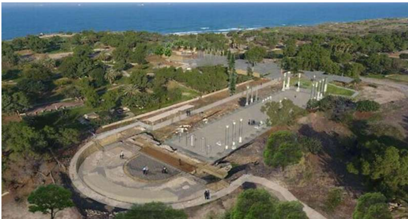
Μια εικόνα για το πώς θα μοιάζει η βασιλική μετά την προγραμματισμένη αποκατάσταση.