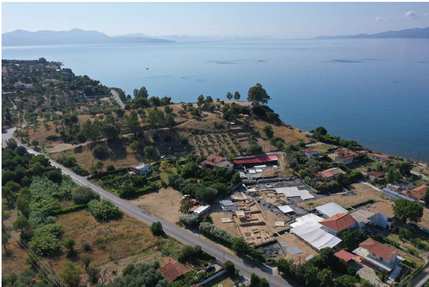
Αεροφωτογραφία της ανασκαφής στην Αμάρυνθο.