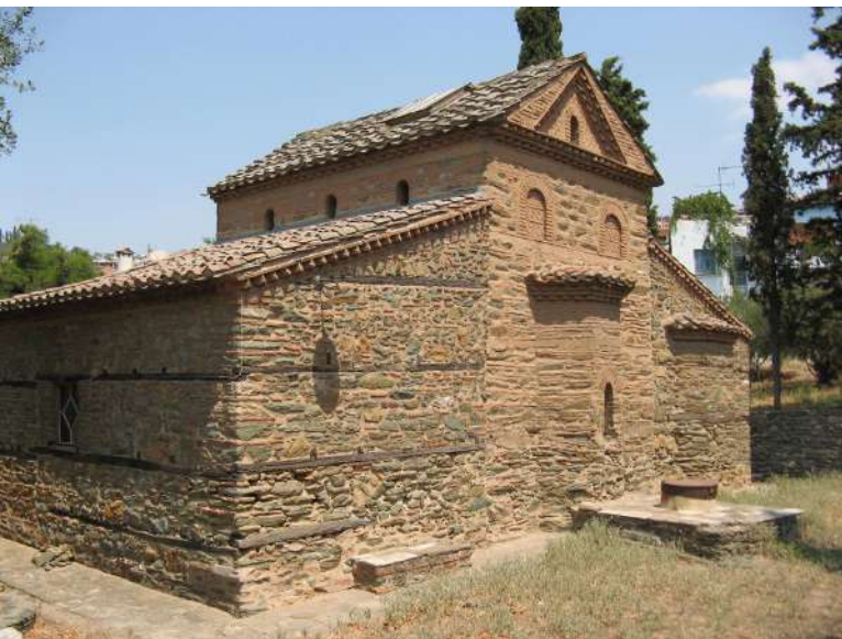
Άγιος Νικόλαος Ορφανός.