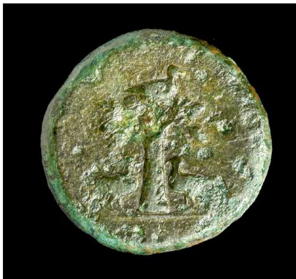
2. Χάλκινο νόμισμα με την ιερή δρυ και τρία περιστέρια στη μία όψη και αετό στην άλλη (ΑΜΙ 403).

Η ερμηνεία των συμβόλων αποτελούσε καθήκον των ιερέων και ιερειών του μαντείου. Οι ιερείς (Σελλοί ή Έλλοι), σύμφωνα με τον Όμηρο ( Ιλιάδα Π, 233 κ.ε.), όπως προαναφέρθηκε, δεν έπλεναν τα πόδια τους ( άνιππόποδες ) και κοιμόταν στο έδαφος ( χαμαιεύναι ) για να βρίσκονται σε άμεση επαφή με τη γη. Ήταν γνωστοί και με τα επίθετα όρειοι (Σοφοκλής, Τραχίνιαι , 1166) λόγω της ορεινής καταγωγής τους και Τομοῦροι από το όρος Τόμαρος, που δεσπόζει στα δυτικά του Ιερού της Δωδώνης (Στράβων, 7.7.11). Οι ιέρειες, τριών εκ των οποίων τα ονόματα διασώζει ο Ηρόδοτος ( Ιστορίαι , 2.55.3),