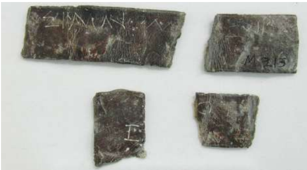
5α-γ. Μολύβδινα ελάσματα με ερωτήματα σχετικά με οικογενειακά θέματα (AMI 12285, 12934, 12949).

στιγμή για να παντρευτεί κάποιος ή με το εάν η μέλλουσα νύφη έχει προίκα, απασχολούν σε σημαντικό βαθμό τους πιστούς. Σε σχέση με αυτό, οι πιστοί, συχνά, αναρωτιούνται και για την απόκτηση παιδιών, «θα αποκτήσω παιδιά με αυτή τη γυναίκα» ή «σε ποιον θεό πρέπει να απευθυνθώ για να αποκτήσω παιδιά» και ειδικότερα αρρένων, υγιών απογόνων (εικ. 5α-γ). 17 Μεγάλο ποσοστό ανάμεσα στα ερωτήματα κατέχουν και εκείνα που αφορούν θέματα υγείας και κυρίως προβλήματα όρασης. 18 Συχνές είναι οι ερωτήσεις που αφορούν μετακινήσεις, χειρσαίες ή διά θαλάσσης. 19 Έντονος είναι ο προβληματισμός των πιστών γύρω από θέματα λατρείας, με κυρίαρχη την αγωνία σε ποιον θεό θα πρέπει να θυσιάσουν, 20 καθώς και γύρω από επαγγελματικά ζητήματα: 21 εμπόριο, γεωργία, κτηνοτροφία, αλιεία, ναυπήγηση πλοίων, ανταλλαγή χαλκού κ.ά.· ιδιαίτερος συχνά και τα ερωτήματα στράτευσης, μετακίνησης, μετανάστευσης, εξ-