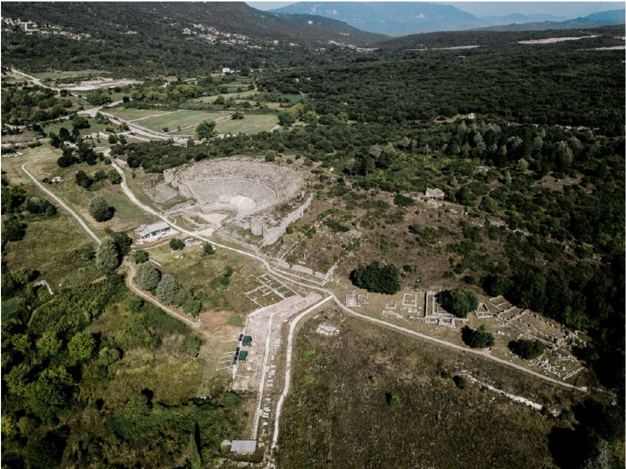
1. Άποψη του αρχαιολογικού χώρου της Δωδώνης.

Τ α μολύβδινα ελάσματα είναι λεπτά φύλλα μολύβδου ορθογώνιου σχήματος πάνω στα οποία οι επισκέπτες του Μαντείου της Δωδώνης χάραζαν τα ερωτήματά τους προς τον θεό Δία και την σύμματό του θεά, Διώνη (εικ 1). 1 Στην πλειονότητα τους ήταν παλίμψηστα, έφεραν δηλαδή χαραγμένες, περισσότερες από μία ερωτήσεις, και για αυτόν τον λόγο καθίστανται συχνά δυσανάγνωστα.