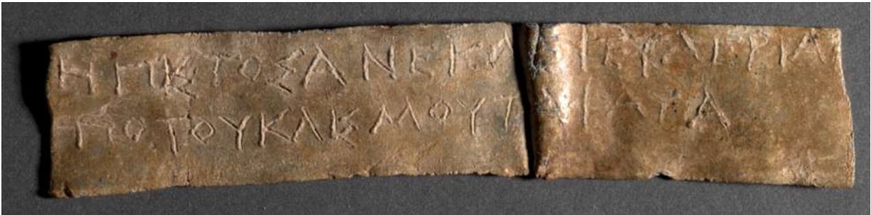
4. Μολύβδινο έλασμα (AMI 8994) στο οποίο ο ερωτών ζητά να μάθει εάν ο Πιστός έκλεψε τα κλινοσκεπάσματα.

βαθμό στο παρελθόν. Οι τελευταίες σχετίζονται κυρίως με εγκληματικές πράξεις (κλοπή, απόπειρα δολοφονίας, απαγωγή). Για παράδειγμα κάποιος ρωτά εάν ο Πιστός έκλεψε τα μαλλιά του κλινοσκεπάσματός του (4ος-3ος αι. π.Χ.) (εικ. 4), 15 ενώ ένας δεύτερος εάν έχει δηλητηριαστεί ο ίδιος και η οικογένειά του από κάποιον που καθοδηγήθηκε από τον Λύσωνα (τέλος 5ου αρχές 4ου αι. π.Χ.). 16 Θέματα οικογενειακά, όπως η επιλογή συζύγου, όπου σε ορισμένες περιπτώσεις κατονομάζεται, ενώ σε άλλες συνδυάζεται με το εάν είναι η κατάλληλη