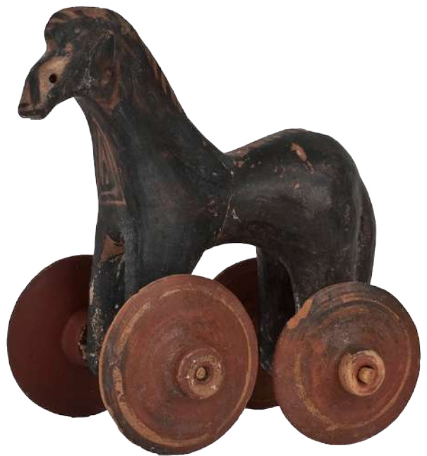
Πήλινο αλογάκι (παιχνίδι) από παιδική ταφή.