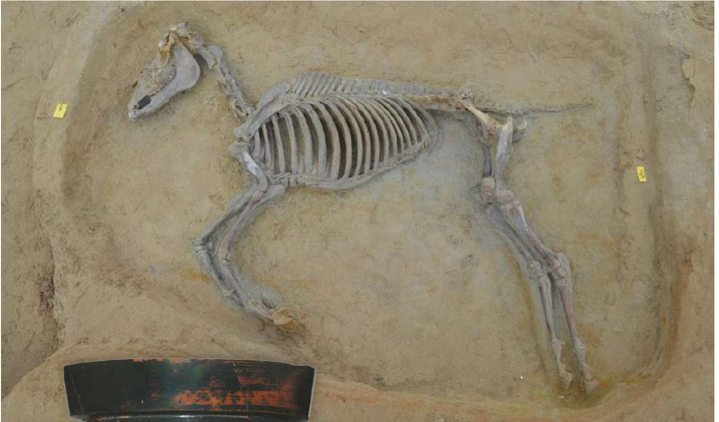
Ταφή αλόγου από το νεκροταφείο Φαλήρου .