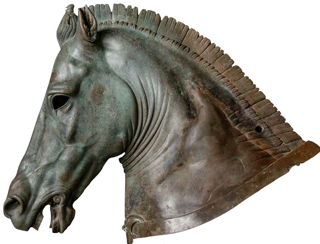
Χάλκινη προτομή αλόγου, σε φυσικό μέγεθος.

Μ ία νέα συναρπαστική έκθεση τέχνης και επιστήμης διοργανώνει η Αμερικανική Σχολή Κλασικών Σπουδών στην Αθήνα, στην Πτέρυγα «Ιωάννης Μακρυγιάννης» από τις 20 Ιανουαρίου έως το τέλος Απριλίου 2022. Με τίτλο «ΙΠΠΟΣ: Το Άλογο στην Αρχαία Αθήνα», η έκθεση θέτει σε πρώτο πλάνο το σημαντικό ρόλο της αρχαιολογικής επιστημονικής έρευνας στην κατανόηση του παρελθόντος.