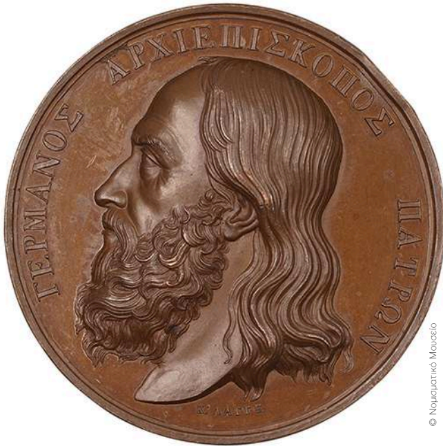
ΓΕΡΜΑΝΟΣ ΑΡΧΙΕΠΙΣΚΟΠΟΣ ΠΑΤΡΩΝ.

ΠΕΡΙΟΔΙΚΗ ΕΚΘΕΣΗ ΤΟΥ ΝΟΜΙΣΜΑΤΙΚΟΥ ΜΟΥΣΕΙΟΥ