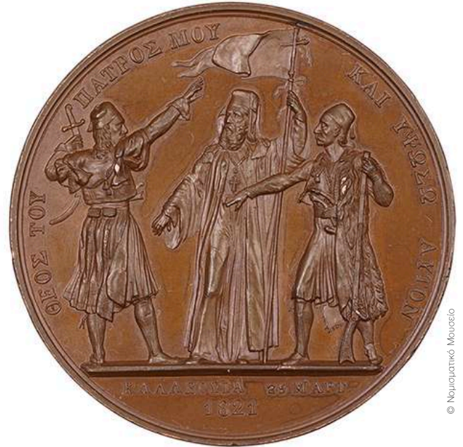
ΚΑΛΑΒΡΥΤΑ 25 ΜΑΡΤΙΟΥ 1821.