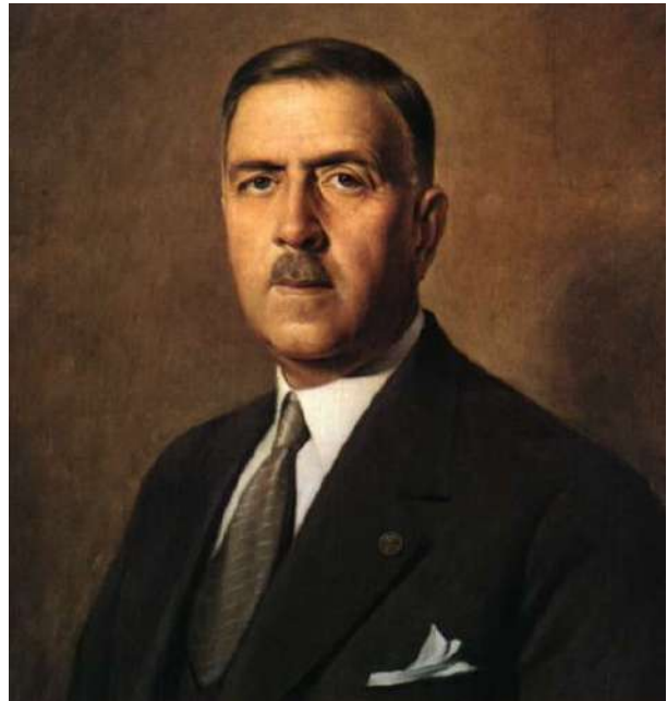
1. Αναστάσιος Ορλάνδος (1887-1979).

Από τα πρώτα χρόνια της λειτουργίας του, στο ΣτΕ προσέφυγαν απλοί πολίτες, δημόσιοι και ένστολοι υπάλληλοι, Νομικά Πρόσωπα Ιδιωτικού και Δημοσίου Δικαίου, Δήμοι και Κοινότητες, κάθε είδους Σύλλογοι, Ταμεία και Εταιρείες. 5 Το Δικαστήριο, πολλές φορές με τρόπο «πραϊτορικό», άνοιξε, με τη νομολογία του, νέους δρόμους στον κλάδο του Διοικητικού Δικαίου. Άλλωστε, τα πρώτα πρόσωπα που κλήθηκαν να το υπηρετήσουν ως δικαστές ήταν εγνωσμένης νομικής αξίας, με προεξέχοντα τον Πρόεδρο του Δικαστηρίου Κωνσταντίνο Ρακτιβάν. 6 Δεδομένων τούτων, στο άρθρο αυτό θα μας απασχολήσει η αίτηση ακύρωσης, κατά δύο αποφάσεων, που κατέθεσε ενώπιον του Δικαστηρίου, τον Ιούνιο του 1934, ο καθηγητής Αρχιτεκτονικής στο Μετσόβιο Πολυτεχνείο Αναστάσιος Ορλάνδος· η αίτηση καταφερόταν αφενός,