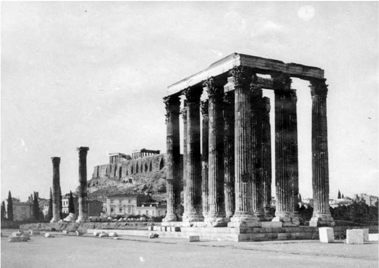
3. Οι στύλοι του Ολύμπιου Διός, το 1920.

Διευθύνσεως μετά τών ύπηρεσιών Θρησκευμάτων καί Αρχαιολογικού καί τά της συγκροτήσεως τών οικείων Συμβουλίων.