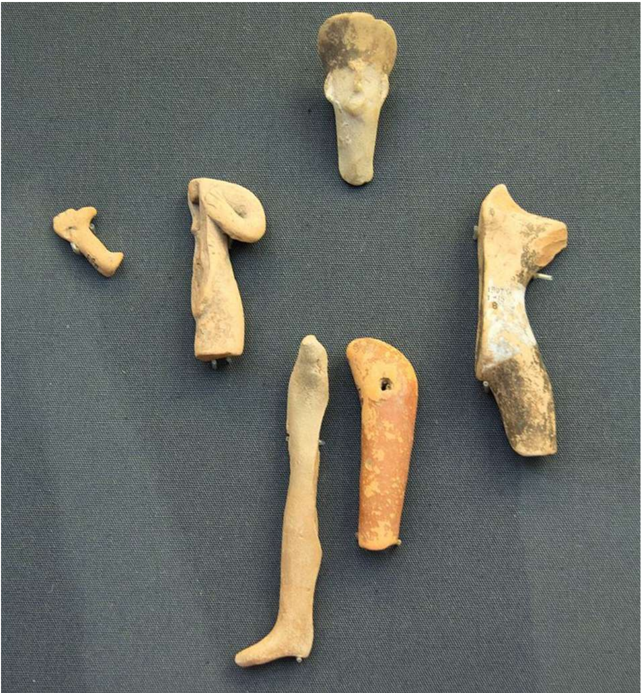
3. «Τάματα» από το μινωικό ιερό κορυφής του Πετσοφά.

τμήματα όρθιων ή καθιστών μορφών και ακόμη φαλλών. 7 Η πλειονότητα των προχειροφτιαγμένων αυτών ομοιωμάτων είναι από πηλό, ωστόσο, υπάρχουν κάποια παραδείγματα και από άλλα υλικά, όπως ο χαλκός. Αξιόλογος αριθμός πήλινων ομοιω-