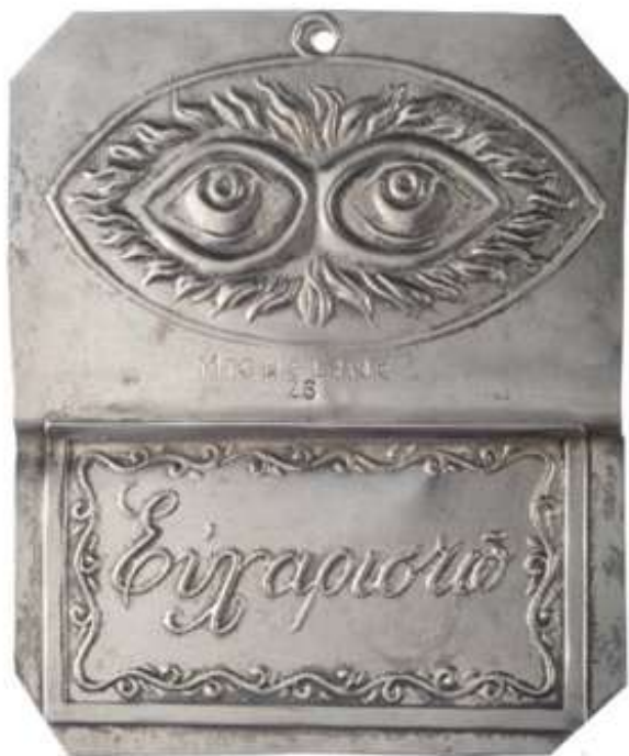
7. Αργυρό τάμα. Εκατονταφυλιανή Πάρου.

τασταθεί η υγεία τους. 33 Γι' αυτό και προτείνεται μια διαφορετική ερμηνεία, η οποία στηρίζεται στη μελέτη των αιγυπτιακών θρησκευτικών συμβόλων, όπως του ποδιού, το οποίο θεωρείτο ισχυρό φυλαχτό που αποσκοπούσε στην επίρρωση του αντίστοιχου σωματικού μέλους. 34 Ωστόσο, το ειδώλιο με το παραμορφωμένο πόδι από τον Τραόσταλο τάσσεται περισσότερο υπέρ της άποψης ότι τα ομοιώματα αυτά είναι ευχαιρικά αναθήματα, που προσφέρονταν, είτε κατά τη διάρκεια της προσευχής για τη θεραπεία ενός ασθενούντος μέλους, είτε αφού αυτή εισακούστηκε και ικανοποιήθηκε το σχετικό αίτημα ίασής του. Το ίδιο, εξάλλου, συμβαίνει και σήμερα με τα τάματα να αφιερώνονται άλλοτε εκ των υστέρων, ως ένδειξη ευγνωμοσύνης και άλλοτε εκ των προτέρων, όταν, δηλαδή, ο πιστός αποζητά τρόπους για τη θεραπεία του. Μολονότι η τυπολογική ομοιότητα των ταμάτων στα μινωικά και τα ιστορικά χρόνια έχει οδηγήσει και σε υπεραπλουστευμένα συμπεράσματα, ωστόσο, αποδεικνύει τουλάχιστον ότι ένα λατρευτικό τυπικό μπορεί να επιβιώνει στον χρόνο άσχετα από το θρησκευτικό σύστημα που εξυπηρετεί, καθώς συνδέεται με τη γενική διάθεση του πιστού να επικοι-