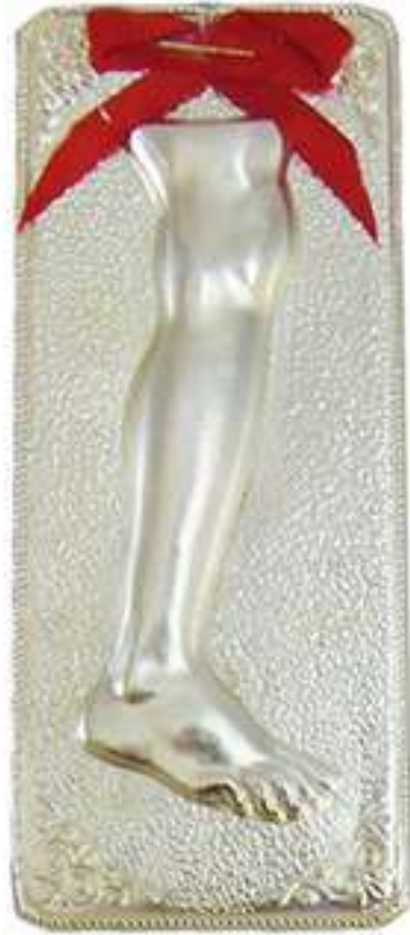
6. Τάμα σύγχρονης εποχής από την έκθεση «Τάματα: Σώμα πάσχον, ψυχή άλγούσα».

Σχολιάζοντας το ζήτημα του παραλληλισμού των μινωικών ιερών κορυφής με τα Ασκληπεία, αξίζει να γίνει μια σύντομη αναφορά στη διαδικασία της θεραπευτικής εγχοίμησης που εφαρμόζοταν στην Αίγυπτο τουλάχιστον από τον 15ο αιώνα π.Χ., γεγονός που έχει οδηγήσει στον εύλογο προβληματισμό εάν την γνώριζαν και οι Μινωίτες. 26 Μάλιστα, όταν την πρωτοσυναντούμε στην Ελλάδα είναι ήδη συνδεδεμένη με τη λατρεία της Γης και των νεκρών, η οποία, ωστόσο, θεωρείται προελληνική. 27 Σύμφωνα, επίσης, με μία παράδοση, το αρχικό, χθόνιου χαρακτήρα, μαντείο των Δελφών, που μάλιστα έχει καθώς φαίνεται στενούς δεσμούς καταγωγής και συγγένειας με τη Μινωική Κρήτη, ήταν ένα ονειρομαντείο· ενδιαφέρον, επίσης, είναι το γεγονός ότι η εγχοίμηση ασκείτο, πέραν των βωμών, και σε χάσματα της γης καθώς υπήρχε η πεποίθηση πως αυτά ήταν φυσικές εισοδοί στον κόσμο των νεκρών. 28 Η σύνδεση ιατρικής και μαντικής είναι βεβαίως γνωστή από τα ιπποκρατικά κείμενα, που τις χαρακτηρίζουν ως ομοαίματες αδελφές, κόρες του Απόλλωνα. 29 Ο Απόλλωνας, πάλι, που είναι υπεύθυνος για τις επιδημίες, αφήνει κάθε κλινική παρέμβαση στον χθόνιο γιο του, Ασκληπιό, γνωστό από τα ομηρικά χρόνια, ο οποίος θεράπευε με φάρμακα, αλοιφές, νυστέρι αλλά και ξόρκια. 30 Προχωρώντας ακόμη παραπέρα, επισημαίνεται η σχέση της εγχοίμησης με τα ήμερα φίδια του Ασκληπιού, που υποτίθεται εμφανίζο-