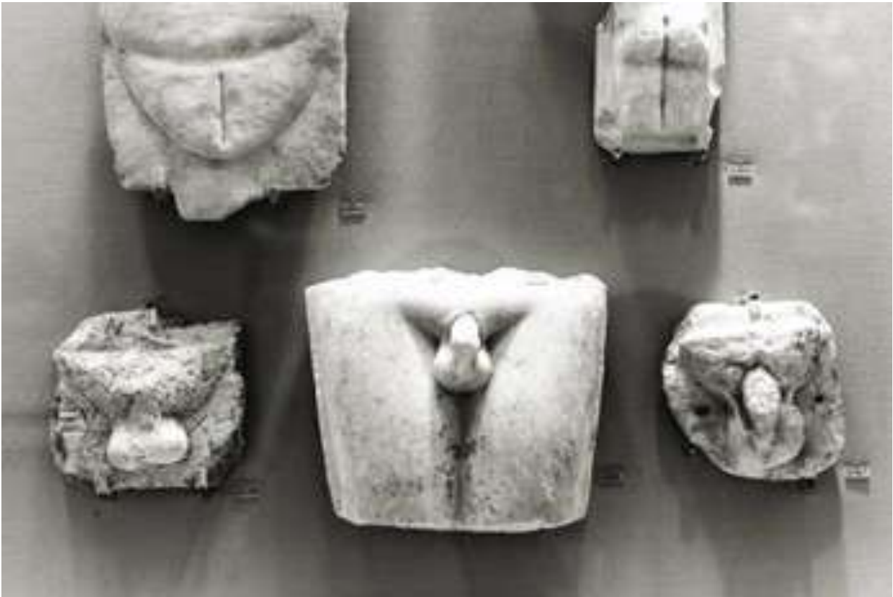
2. Τάματα (Εθνικό Αρχαιολογικό Μουσείο, Αίθουσα 26).

δικασία ακολουθεί, ως προς τη διατύπωση και την εκτέλεσή της, τους ίδιους σταθερά επαναλαμβανόμενους τρόπους, προσφέροντας έτσι την υποκειμενική και σε μεγάλο βαθμό ηθική και κυρίως ψυχολογική βεβαιότητα ότι όλα θα πάνε καλά. Το τάμα, ως λόγος και πράξη, μπορεί να έχει και άυλη υπόσταση, οπότε αφορά σε περιπτώσεις που ο πιστός υπόσχεται ή τουλάχιστον προτίθεται, εφόσον το αίτημά του ικανοποιηθεί, να υποστεί και να φέρει εις πέρας διάφορες «δοκιμασίες», που περιλαμβάνουν την προσωπική στέρωση και απομάκρυνση από διάφορες καταστάσεις, όπως είναι η νηστεία και η αποχή από το φαγητό γενικά, ή την ατομική αφιέρωση και προσφορά διακονίας στις υπηρεσίες του θεού. Η ανάθεση ενός τάματος είναι, λοιπόν, μια οικουμενική ανθρώπινη συνήθεια, αλλά και ανάγκη, που πηγάζει από το θρησκευτικό συναίσθημα και συνδέεται άμεσα με τις καθημερινές απλές ή σύνθετες ανθρώπινες λειτουργίες, γι'