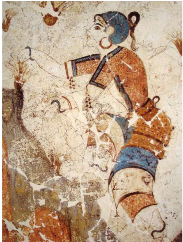
4. Η νεαρή κροκοσυλλέκτρια από την τοιχογραφία στην Ξεστή 3 της Θήρας.

Στην κατηγορία των εθίμων μετάβασης από την ηλικία της νεαρής παρθένου κόρης σε εκείνη της γυναίκας εντάσσεται και η ετήσια θητεία των κορασίδων της μεσσηνιακής άρχουσας τάξης στο ιερό της Αρτέμιδος Ορθίας στην αρχαία Μεσσήνη, καθώς και κορασίδων της αθηναϊκής άρχουσας τάξης στο ιερό της Βραυρωνίας Αρτέμιδος στην Αττική, σύμφωνα με τις φιλολογικές και τις επιγραφικές μαρτυρίες καθώς και τα μαρμάρινα αγάλματα των κοριτσιών που έχουν έλθει στο φως σε αμφότερα τα ιερά και εκτίθενται στα τοπικά μουσεία. 15 Οι τελετές μήσης νεαρών κοριτσιών σε ιερά της θεάς Αρτέμιδος ήταν μέρος θρησκευτικής και πολιτιστικής παράδοσης. Η Αρτεμις, θεά του κυνηγιού, της άγιας φύσης και του τοκετού, ήταν