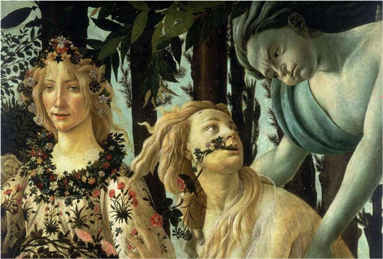
1β. «Η Αλληγορία της Άνοιξης». Λεπτομέρεια του πίνακα του Σάντρο Μποτιτσέλι (Sandro Botticelli).

Ιεροτελεστία της Άνοιξης (Le Sacre du Printemps) είναι ο τίτλος του μοναδικού μουσικού χορογραφικού έργου του Ιγκόρ Στραβίνσκι (Igor Stravinsky), με χορογράφο τον περίφημο χορευτή Waclaw Nizyński. Το έργο αυτό έκανε πρεμιέρα στο Παρίσι τον Μάιο του 1913 με άκρως αρνητικά αλλά ταυτόχρονα και άκρως υμνητικά σχόλια εκ μέρους των κριτικών. Η υπόθεση, βασισμένη σε παγανιστικούς θρύλους της βόρειας Ευρώπης, στρέφεται γύρω από μια κόρη που χορεύει ασταμάτητα με πάθος μέχρι θανάτου, κατ' ουσία θυσιάζεται, ενώπιον χορού γερόντων και νυμφών. Το πρώτο μέρος του έργου έχει τον τίτλο «L'adoration de la Terre», το δεύτερο «La sacrifice». Παίζεται έκτοτε τακτικά μέχρι σήμερα ως ένα ξεχωριστό δημοφιλές και εμπνευσμένο μουσικοχορευτικό δημιούργημα με νέες κάθε φορά χορογραφικές προτάσεις από διάσημους χορογράφους, όπως για παράδειγμα ο Maurice Béjart.