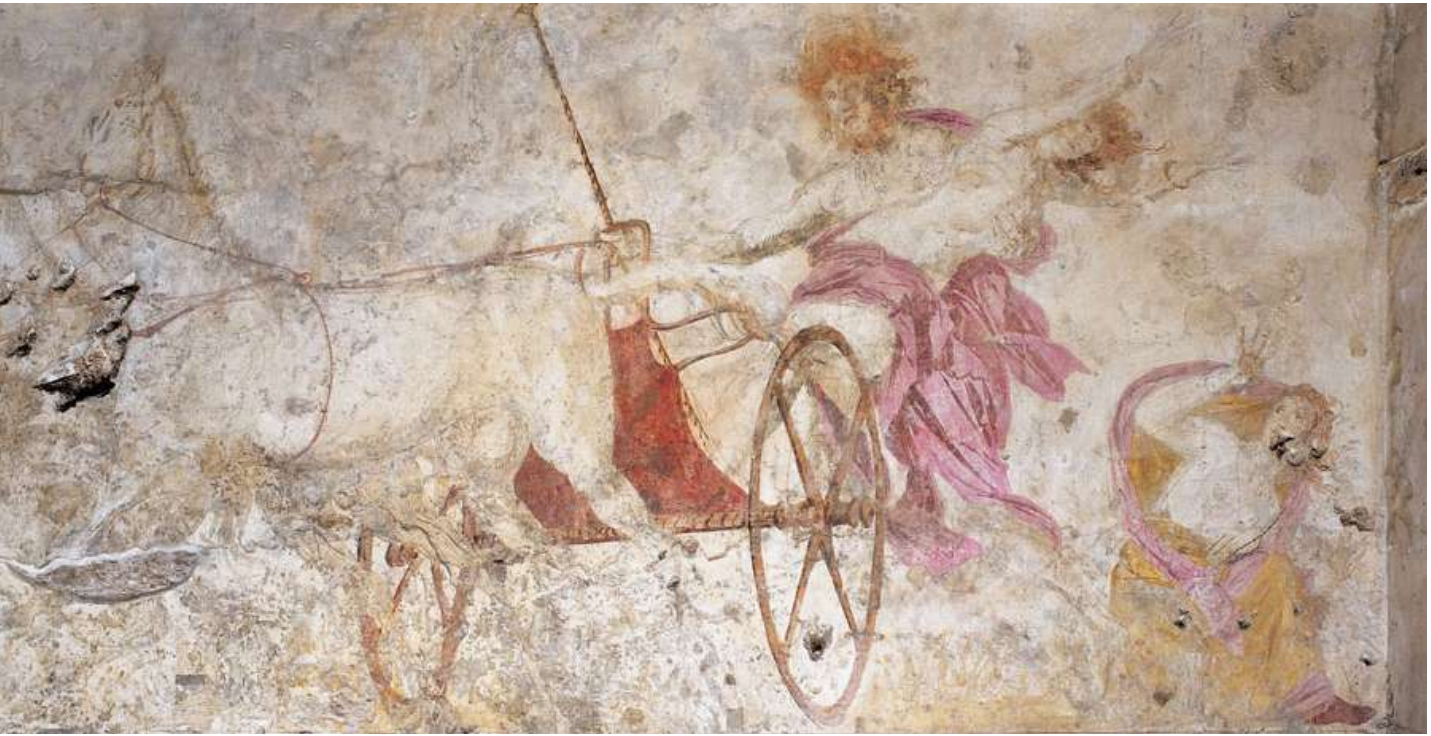
3β. Η τοιχογραφία με την αρπαγή της Περσεφόνης από τον Πλούτωνα (Βεργίνα).

θαυμάσιο άνθος που έθαλλε και θάμπωνε τους πάντες απ' τους αθάνατους θεούς κι απ' τους θνητούς ανθρώπους κι από τη ρίζα του εκατό ξεφύτρωσαν βλαστάρια, και σκόρπαε οσμή γλυκύτατη κι όλος ψηλά διάπλωτος εγέλαε ουρανός και σύμπασα η γη και το αλμυρό της θάλασσας το κύμα, κι έκθαμβη η Κόρη άπλωσε τα δύο της τα χέρια το πάγκαλο άθυρμα να πιάσει, άνοιξε η γη η ευρυάγνια στο Νύσιον πεδίον κι όρμησε τότε ο Πολυδέγμων άρχοντας ο ένδοξος του Κρόνου γιος με αθάνατα άλογά του. Κι αφού την άρπαξε άθελά της πάνω σε ολόχροσο άρμα την πήγαινε θρηνούσα, εκείνη τότε κραύγασε με δυνατή φωνή καλώντας το πατέρα της, το άριστο και ύπατο του Κρόνου γιο».