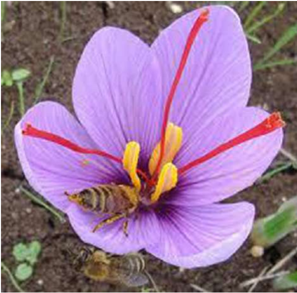
6. Άνθος κρόκου της Κοζάνης, από τον ύπερο του οποίου παράγεται το σαφράν.

ζωής και πιστεύεται ότι φέρνει τύχη, ευημερία και ευτυχία σε όσους συμμετέχουν.