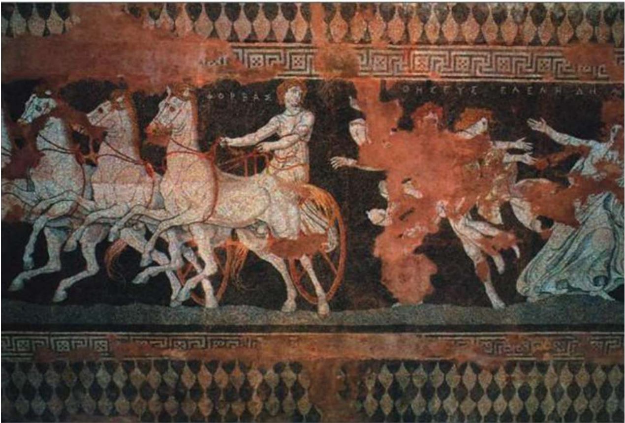
2. Η ψηφιδωτή παράσταση αρπαγής της Ελένης από τον Θησέα (Αρχαιολογικό Μουσείο Πέλλας).

αρνήθηκε, αλλά ο θεός Ενκί συμφώνησε να βοηθήσει. Δημιούργησε δύο μορφές, οι οποίες στάλθηκαν στον κάτω κόσμο για να επαναφέρουν στη ζωή την Inanna. Είχαν επιτυχία, αλλά ο κάτω κόσμος ζήτησε ένα υποκατάστατο για την Inanna, καθώς κανείς δεν επιτρεπόταν να φύγει από τον κάτω κόσμο χωρίς να αφήσει αντικαταστάτη. Ο σύζυγος της Inanna, ο θεός Dumuzid, επιλέχθηκε τελικά ως αντικαταστάτης και δέχτηκε να περνά τον μισό χρόνο στον κάτω κόσμο ενώ η αδερφή του, Geshtinanna, δέχθηκε να παραμένει στον κάτω κόσμο τον άλλο μισό χρόνο. 6