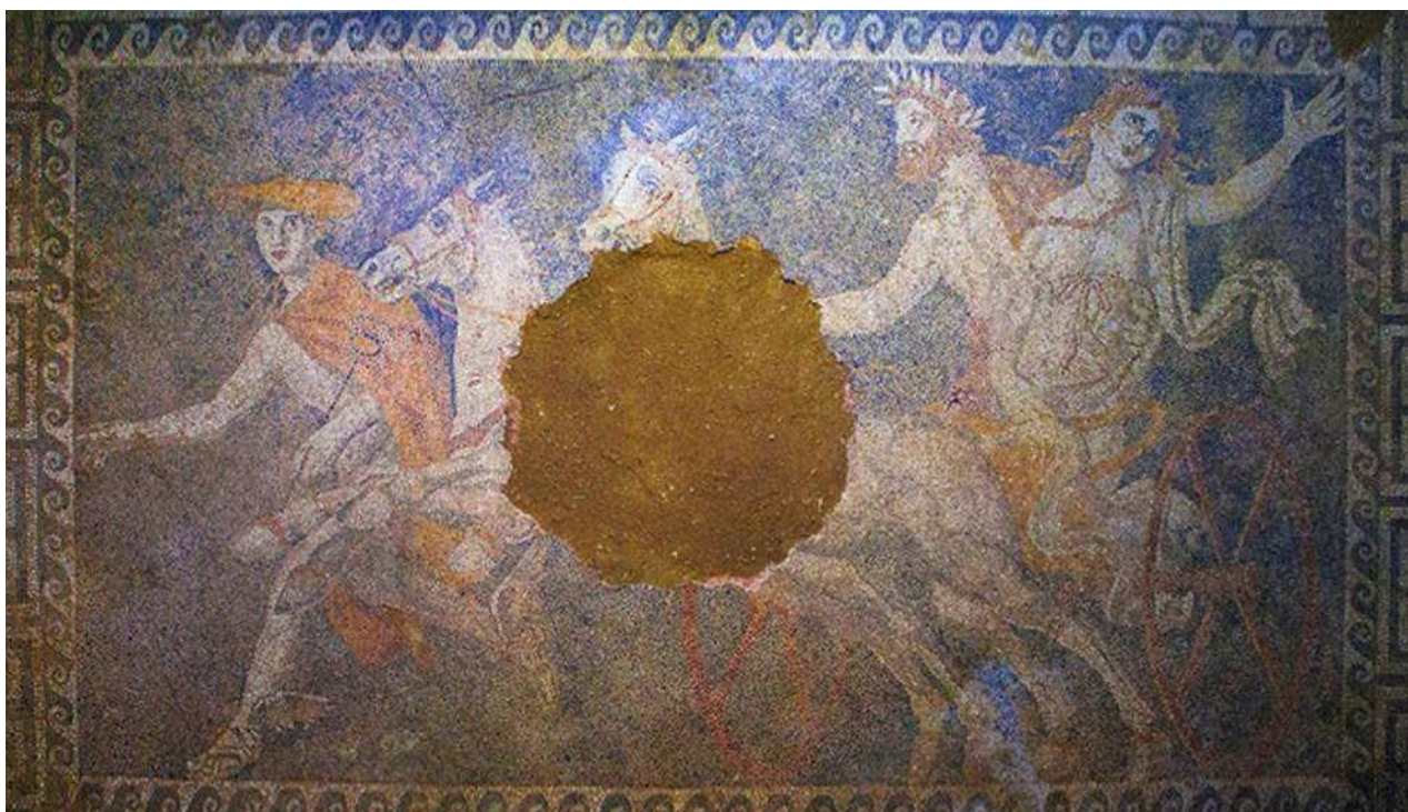
3α. Η ψηφιδωτή παράσταση αρπαγής της Περσεφόνης από τον αρματηλάτη Πλούτωνα, με νυμφοπομπό τον Ερμή (Αμφίπολη).

μενες σημαντικές παραστάσεις αρπαγής της Ελένης από τον Θησέα συγκαταλέγεται το ψηφιδωτό δάπεδο του 4ου αι. π.Χ. από την Πέλλα (εικ. 2).