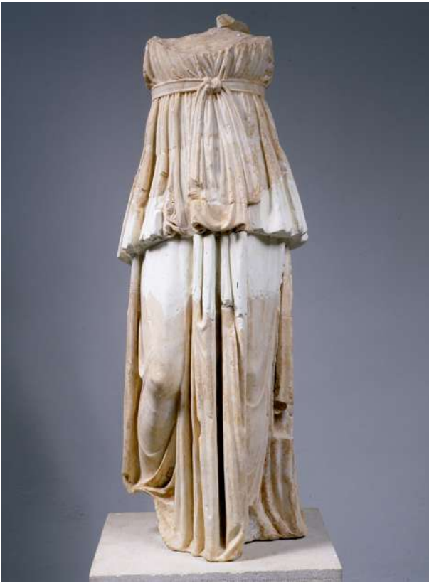
5. Μαρμάρινο άγαλμα κορασιάδας από το Αρτεμίσιο της Μεσσήνης.