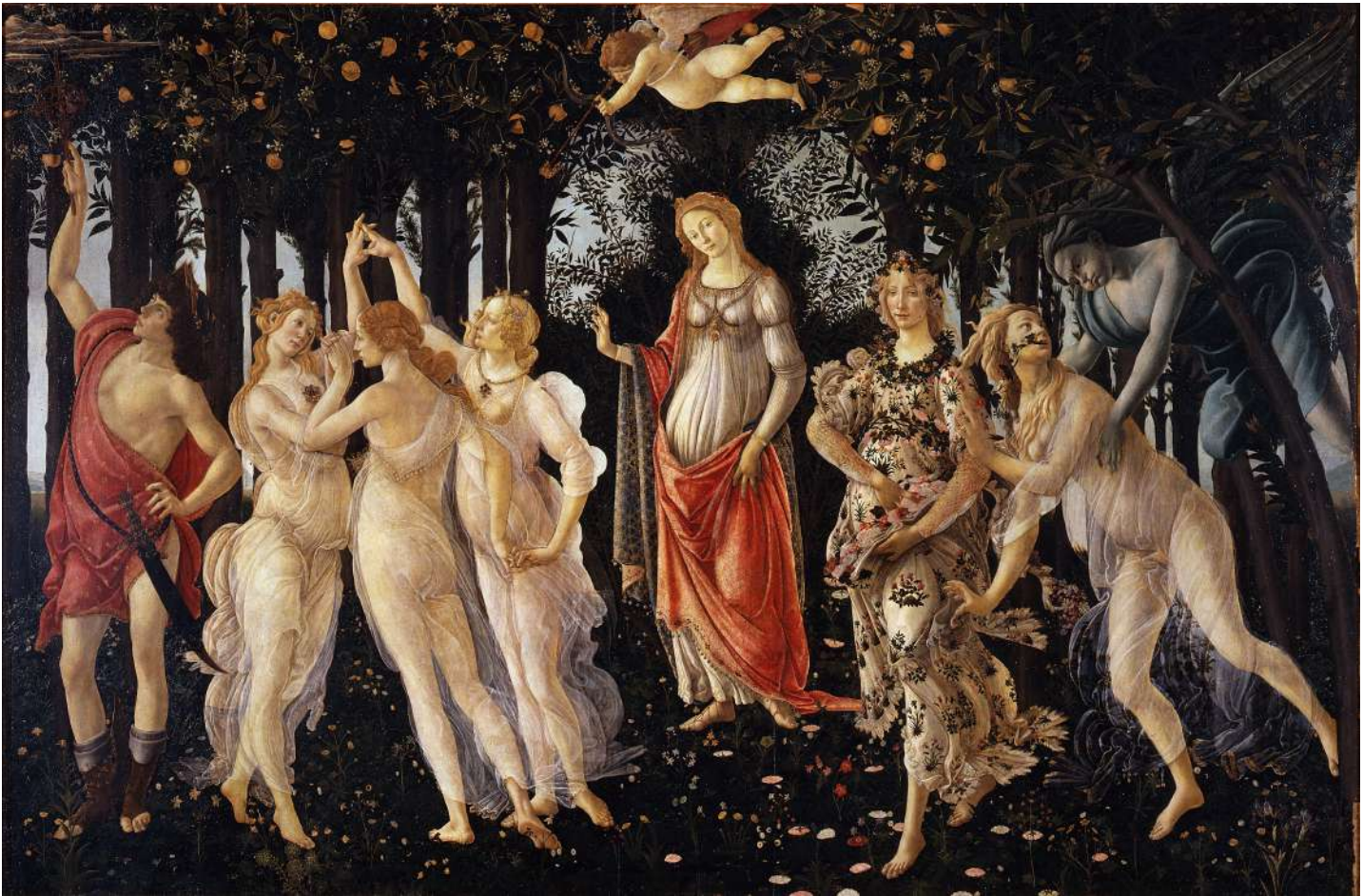
1α. «Η Αλληγορία της Άνοιξης» του Σάντρο Μποττιτσέλι (Sandro Botticelli).

Στην αρχαία Αίγυπτο, ο ερχομός της Άνοιξης είχε συνδεθεί με τις τελετουργίες του Wepet Renpet που εορταζόταν προς τιμή του θεού της νέας χρονιάς που άρχιζε την Άνοιξη και περιλάμβαναν διασκέδαση με χορούς, ανταλλαγή δώρων και προσφορές σε θεότητες. Στην Περσία, η εαρινή ισημερία γιορταζόταν στις 21 Μαΐου με την ονομασία Now-ruz (=νέα ημέρα). Οι τελετουργίες της εορτής σηματοδοτούσαν την έναρξη του περσικού νέου έτους, όπως στην Αίγυπτο, και περιλάμβαναν επίσης διασκέδαση με χορούς και άλλες μορφές εκδήλωσης χαράς για τον ερχομό της Άνοιξης και του νέου έτους. 2 Ο ιστορικός του 4ου αιώνα π.Χ. Ξενοφών αναφέρει ότι οι τελετουργίες της Νέας Ημέρας ( Now-ruz ) εορταζόνταν και από τους Αχαιμενίδες βασιλείς. 3 Η εβραϊκή γιορτή Purim της εαρινής ισημερίας τελείται κατά τον πρώτου μήνα της Άνοιξης