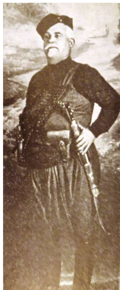
4. Ο John D.S. Pendlebury και ο Αντ. Γρηγοράκης (Σατανάς) σε γερμανική έκδοση του 1942, υποδεικνυόμενοι ως υπαίτιοι της αντίστασης κατά των Γερμανών αλεξιπτωτιστών στην Κρήτη.

επιτελική του θέση δεν τον κρατούσε φυσικά αμέτοχο των συνεπειών του κινδύνου. Η πίστη όμως του ελεύθερου ανθρώπου δεν άφηνε να σκεπασθή από βαρεία σύννεφα ο ουρανός της αισιοδοξίας του.