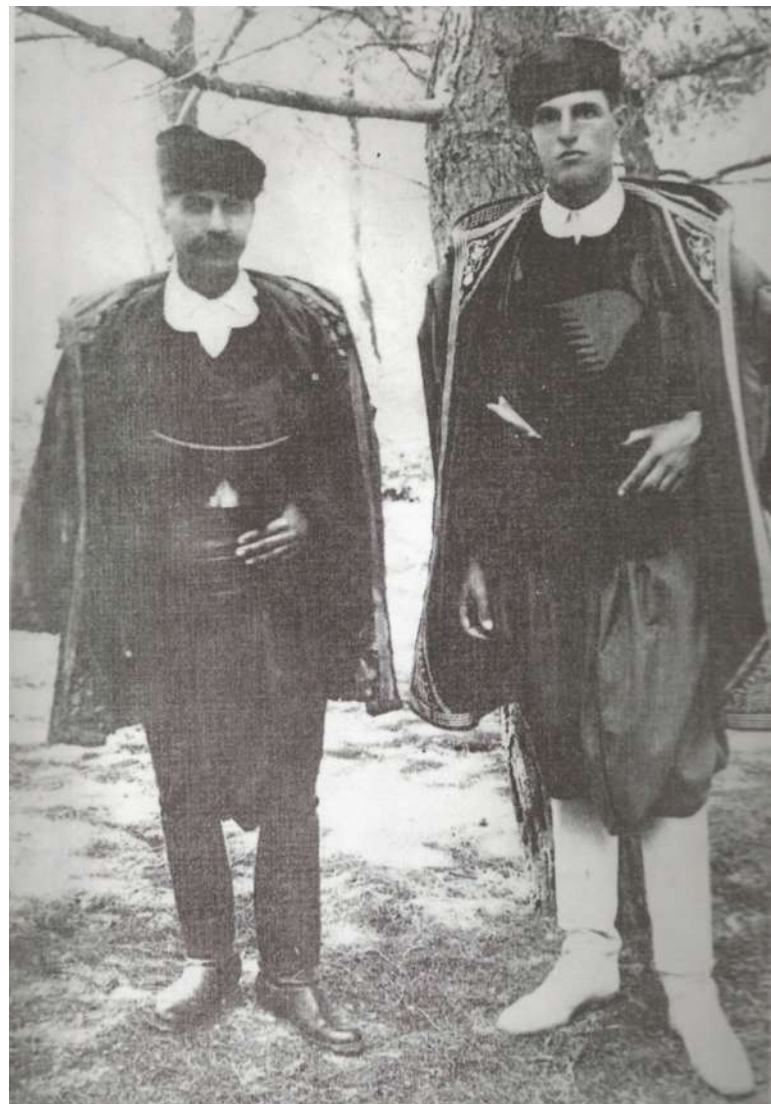
2. Ο John D.S. Pendlebury, με κρητική ενδυμασία. Δίπλα του ο οδηγός στις αρχαιολογικές εξορμήσεις και μετέπειτα υπασπιστής του, Χρόνης Βαρδάκης.

Τις γνώσεις του αυτές για την Κρήτη, τη μοναδική σχέση με τους ανθρώπους της θα επικαλεστεί, επίμονα, για να υπηρετήσει την πατρίδα του στο ξέσπασμα του Β' Παγκοσμίου Πολέμου, στρατολο-