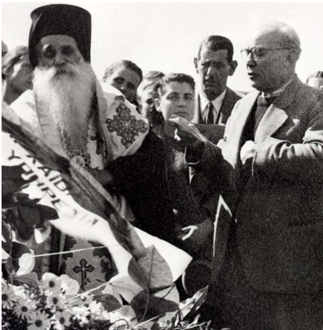
9. Λεπτομέρεια της εικόνας 8, όπου διακρίνεται ως αναθέτης του στεφάνου η ΑΡΧΑΙΟΛΟΓΙΚΗ ΥΠΗΡΕΣΙΑ.

Η αναστροφή της φωτογραφίας από την αρχική της θέση (εικ. 9) αποκαλύπτει και τον αφιερωτή του κεντρικού στεφάνου στο μνήμα: διακρίνεται, με κεφαλαιογράμματα γραφή στην ταινία του στεφάνου, η φράση ΑΡΧΑΙΟΛΟΓΙΚΗ ΥΠΗΡΕΣΙΑ, σαν να επιχειρείται εδώ, οριστικά, η αποκατάσταση της αρχαιολογικής ιδιότητας του τιμωμένου νεκρού, σε αντιπαράθεση με τη μονομερή υπόμνηση, στον ξύλινο σταυρό, του στρατιωτικού ρόλου του.