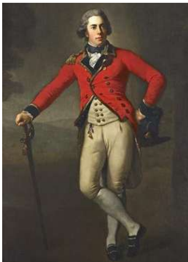
2. Τόμας Μπρους, 7ος Κόμης του Έλγιν.

Τα Μάρμαρα του Παρθενώνα αφαιρέθηκαν από τον ναό μεταξύ του 1801 και του 1804 από τον Λόρδο Έλγιν όταν ήταν πρέσβυς της Αγγλίας στην Υψηλή Πύλη (1799-1803) κατά τη διάρκεια της Οθωμανικής Αυτοκρατορίας. Ο Έλγιν εκμεταλλεύτηκε τη θέση του και τη μεγάλη επιρροή που ασκούσε η αγγλική πολιτική στην τουρκική κυβέρνηση λόγω της στρατιωτικής βοήθειας που οι Άγγλοι είχαν προσφέρει στους Τούρκους την περίοδο εκείνη στον πόλεμο εναντίον των Γάλλων του Ναπολέοντα στην Αίγυπτο. Η αφαίρεση έγινε κατά τους ισχυρισμούς των Βρετανών στη βάση ενός φιρμανιού. Νεότερες μελέτες ωστόσο αποδεικνύουν ότι δεν υπήρχε φιρμάνι παρά μόνον μία απλή επιστολή που είχε υπογραφεί από τον Καϊμακάν Πασά και απευθυνόταν στον Βοεβόδα (Διοικητή) και τον Καδή (Δικαστή) των Αθηνών. 6 Φιρμάνι εξέδιδε μόνον ο Σουλτάνος, ο οποίος ήταν και ο μόνος που μπορούσε να δώσει άδεια μετακίνησης αντικειμένων από αρχαιολογικό μνημείο σύμφωνα με όσα ίσχυαν την εποχή εκείνη δεδομένου ότι τα αρχαιολογικά μνημεία αποτελούσαν προσωπική του περιουσία. 7 Ένα φιρμάνι έφερε συγκεκριμένες υπογραφές που δεν αναφέρονται στην ιταλική μετάφραση (η οποία εί-