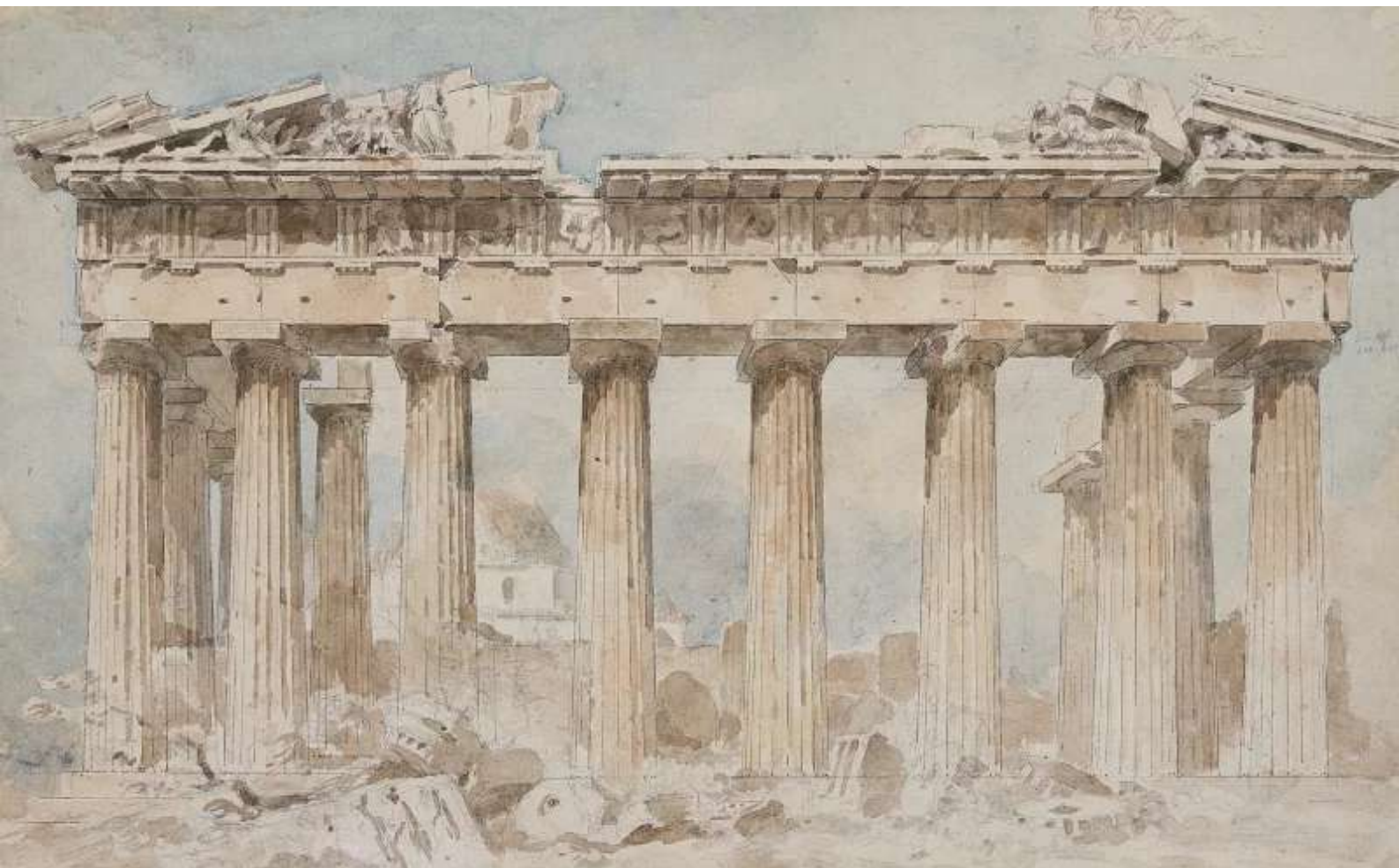
1. Η ανατολική πλευρά του Παρθενώνα, έργο του Louis François Sebastien Fauvel (αχρονολόγητο).