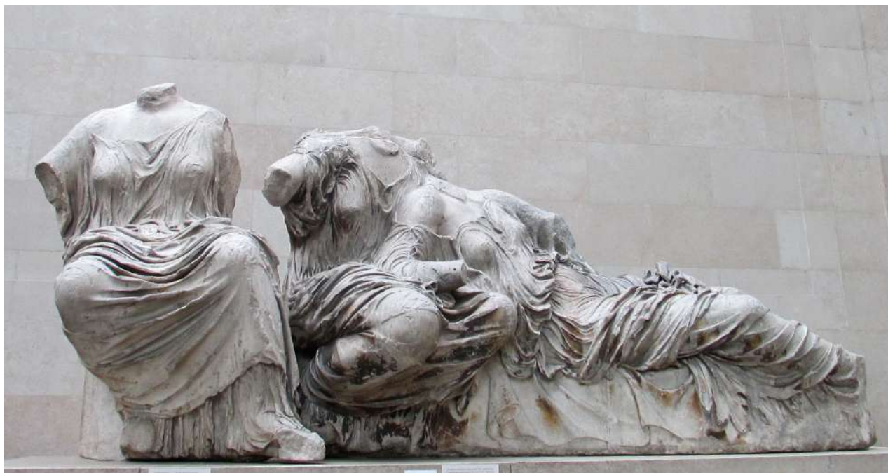
9. Αετωματικό γλυπτό του Παρθενώνα στο Βρετανικό Μουσείο.

και η πολιτιστική κληρονομιά κατά γενική ομολογία συμβάλει στην ολοκλήρωση της εθνικής και πολιτιστικής ταυτότητας ενός λαού, θα πρέπει ωστόσο να διατηρείται και να φυλάσσεται προς όφελος όλης της ανθρωπότητας. Κανείς θα ισχυριζόταν ότι η άποψη αυτή αποτελεί μίγμα της εθνικιστικής και της διεθνιστικής θεωρίας, όπως αυτές έχουν εκφραστεί στο δίκαιο της πολιτιστικής κληρονομιάς, οι οποίες εκ πρώτης όψεως είναι εκ διαμέτρου αντίθετες. Ωστόσο η πραγματικότητα υπαγορεύει ρεαλιστικές λύσεις που να ανταποκρίνονται στα ζητούμενα των καιρών λαμβάνοντας υπόψη τις ευαισθησίες και τις απόψεις (στο μέτρο του εφικτού) όλων των πλευρών. Συνεπώς το ζήτημα δεν είναι σε ποιον ανήκουν τα Μάρμαρα, αλλά που εκτίθενται καλύτερα προς όφελος όλων. Στο Λονδίνο ή στην Αθήνα;