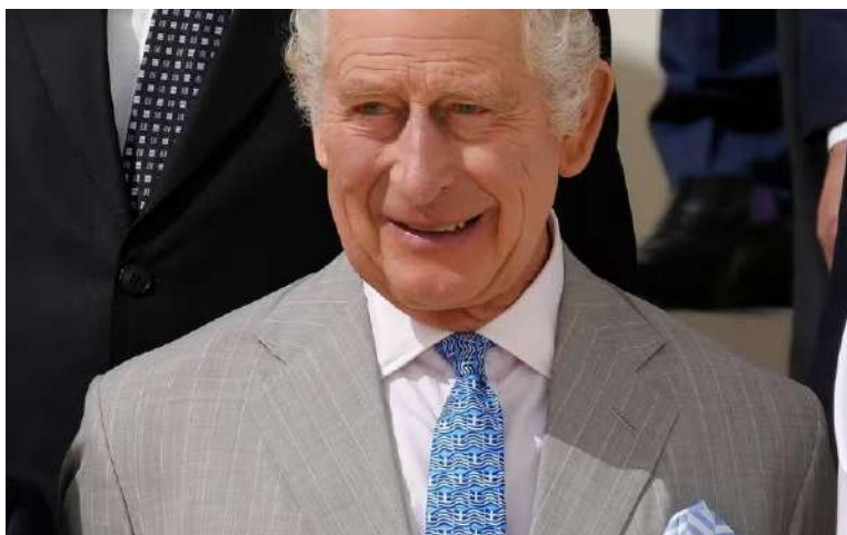
8. Ο βασιλιάς Κάρολος, φοράοντας γραβάτα με την ελληνική σημαία, στην 28η Διάσκεψη των Ηνωμένων Εθνών για την Κλιματική Αλλαγή στο Ντουμπάι.

νικής πλευράς εμφανιζόμενος στην 28η Διάσκεψη των Ηνωμένων Εθνών για την Κλιματική Αλλαγή στο Ντουμπάι φορώντας γραβάτα με την ελληνική σημαία.