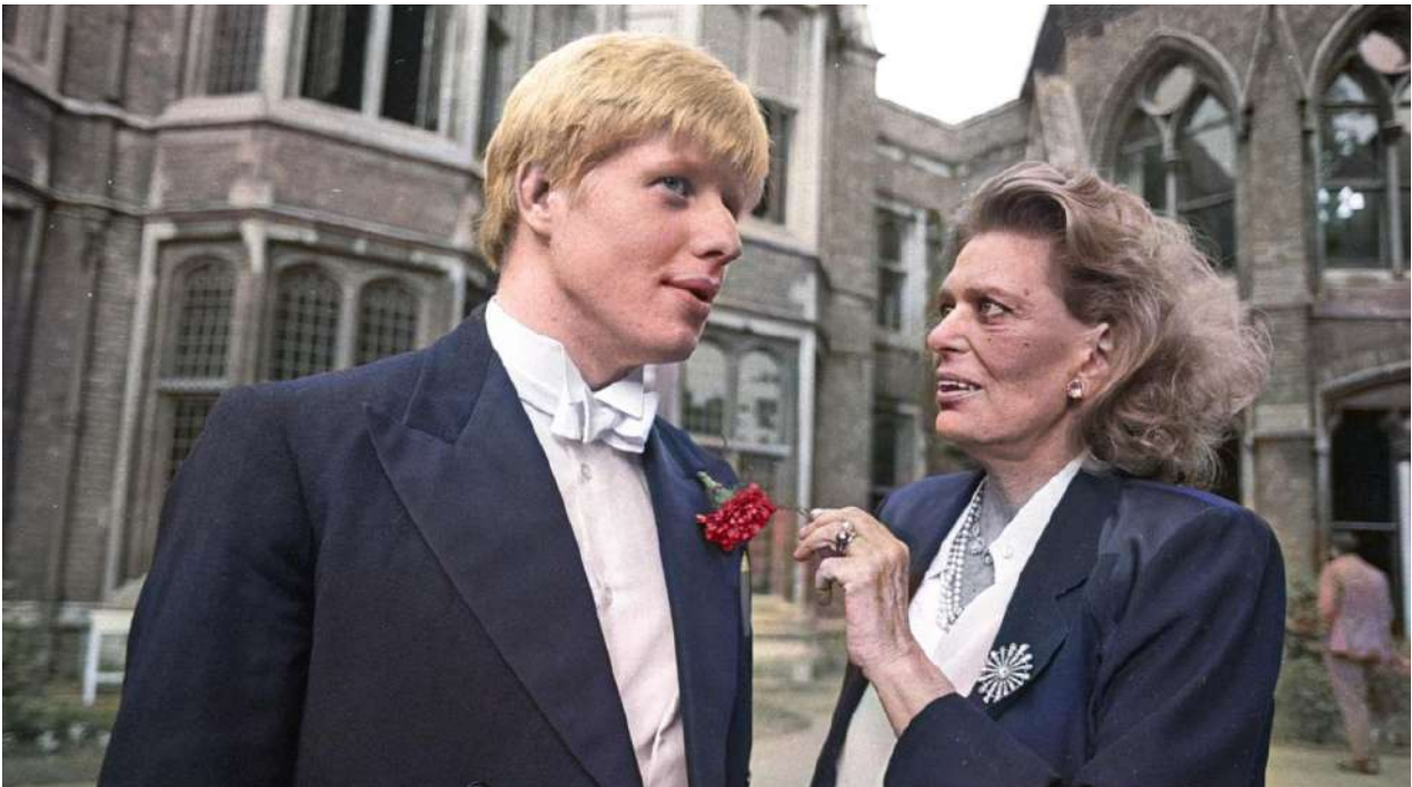
4. Η Μελίνα Μερκούρη συνομιλεί με τον 22χρονο - τότε, 12 Ιουλίου 1986 - Μπόρις Τζόνσον για τα Μάρμαρα του Παρθενώνα, έξω από το Πανεπιστήμιο της Οξφόρδης.

Το 1984 το ζήτημα των Μαρμάρων του Παρθενώνα εντάχθηκε για πρώτη φορά στην ατζέντα της UNESCO και στη συνέχεια εντάχθηκε στο πλαίσιο της ατζέντας της Διακυβερνητικής Επιτροπής για την Επιστροφή Πολιτιστικών Αγαθών στις Χώρες Προέλευσής τους (ICPRCP), όπου παραμένει μέχρι σήμερα. Η Επιτροπή αυτή ασχολείται με υποθέσεις, οι οποίες δεν εμπίπτουν στο πλαίσιο της Σύμβασης της UNESCO του 1970 18 για επιστροφές αρχαιοτήτων στις χώρες προέλευσής τους, όχι επειδή δεν πληρούν κατ' ανάγκη τα κριτήρια, αλλά γιατί η σύμβαση αυτή δεν έχει αναδρομική ισχύ. Το γεγονός βέβαια ότι δεν έχει αναδρομική ισχύ αποτελούσε σημείο συμβιβασμού κατά τις διαπραγμα-