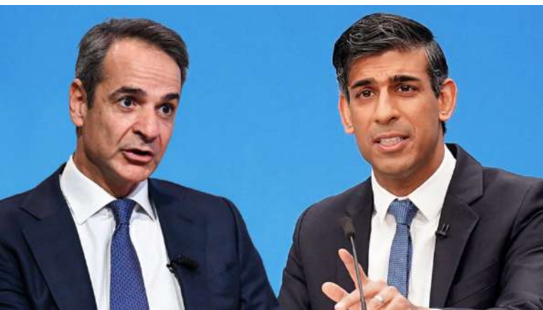
7. Ο Βρετανός πρωθυπουργός Rishi Sunak ακύρωσε την προγραμματισμένη συνάντηση που είχε μαζί με τον Έλληνα πρωθυπουργό, στις 28 Νοεμβρίου 2023, λόγω δηλώσεων του δεύτερου στον τύπο υπέρ της επιστροφής των Μαρμάρων.