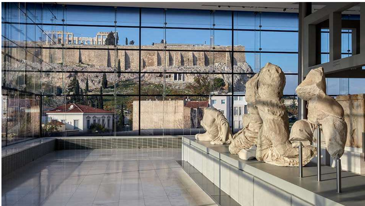
12. Αίθουσα του Μουσείου Ακρόπολης με θέα προς τον Ιερό Βράχο.

Η δεύτερη οδός είναι η νομοθετική παρέμβαση. Η Βρετανική Κυβέρνηση ψήφισε το 2004 την Human Tissue Act που επέτρεψε σε Βρετανικά Μουσεία να επιστρέψουν υπολείμματα Αβοριγίνων σε Αυστραλία και Νέα Ζηλανδία. Το 2009 ψηφίστηκε η Holocaust Act, η οποία έδινε άδεια σε 17 Βρετανικά μουσεία να επιστρέψουν στους ιδιοκτήτες τους έργα τέχνης που είχαν απομακρυνθεί παράνομα από τους Ναζί κατά την περίοδο 1933-1945. Ωστόσο ο Πρωθυπουργός της Βρετανίας Rishi Sunak διεμήνυσε στο τέλος του 2023 ότι δεν σκοπεύει να αλλάξει τον νόμο που απαγορεύει στο Βρετανικό Μουσείο να απεκδύεται αντικείμενα από τις συλλογές του εκτός περιορισμένων περιπτώσεων.