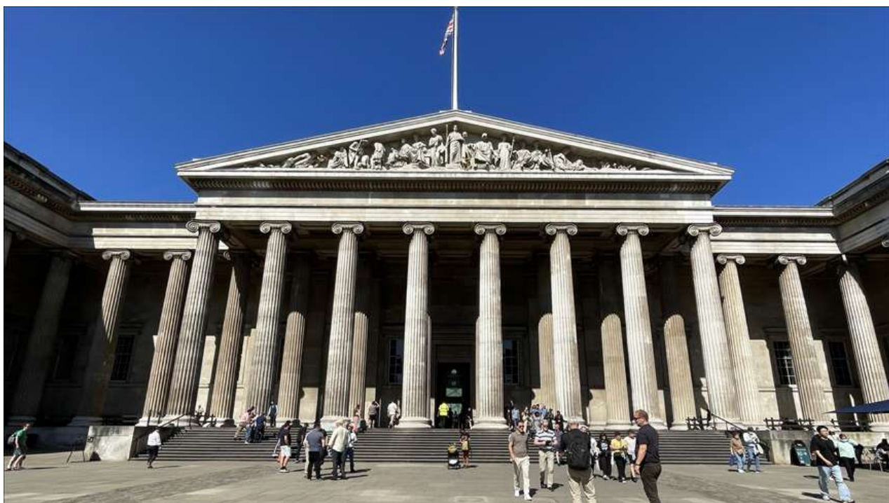
5. Βρετανικό Μουσείο, Λονδίνο.

Το 2013 η Ελλάδα αποφάσισε ύστερα από πρόταση της Συμβουλευτικής Επιτροπής των Μαρμάρων του Παρθενώνα που είχε συστήσει ο τότε Υπουργός Πολιτισμού, 19 να ζητήσει από την UNESCO να κάνει χρήση της δυνατότητας που της έδιναν οι Κανόνες Διαμεσολάβησης και Συμφιλίωσης του 2010 20 και να ζητήσει από τη Βρετανία να προσέλθει σε διαμεσολάβηση με την Ελλάδα για την επίλυση του ζητήματος. Πράγματι τον Αύγουστο του 2013 η UNESCO (μέσω του γραφείου της Γενικής Διευθύντριας της, Irina Bokova)