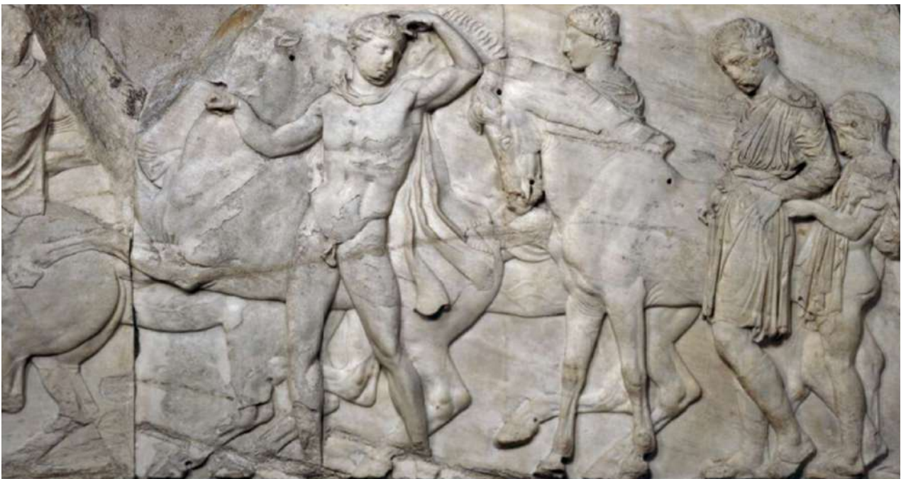
10. Τμήμα της ζωφόρου του Παρθενώνα στο Βρετανικό Μουσείο.

Το 2002 δεκαοκτώ (18) μεγάλα μουσεία της Δύσης και της Βόρειας Αμερικής που δημιούργησαν τις συλλογές τους σε περιόδους αποικιοκρατίας, πολέμων, και ιμπεριαλισμού εξέδωσαν Διακήρυξη για το Παγκόσμιο Μουσείο. 35 Σύμφωνα με την θεωρία του «Παγκόσμιου Μουσείου» τα Μάρμαρα του Παρθενώνα λένε δύο ιστορίες: μία στο Μουσείο της Ακρόπολης για την ιστορία της Αθήνας και μία στο Βρετανικό Μουσείο για την ιστορία της ανθρωπότητας. Στην τελευταία αυτή περίπτωση ο