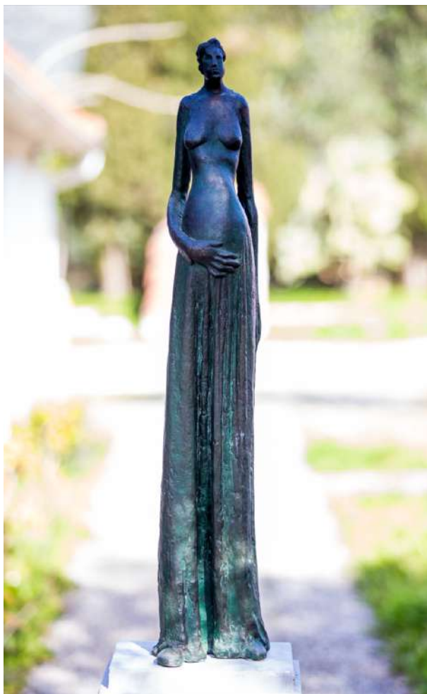
Εγκυμονούσα, 1990, ορείχαλκος, 88 x 18,5 εκ.

Ανδριάντα Χρυσοστόμου Σμύρνης στη Νέα Σμύρνη το 1965. Ο Απάρτης, ειδικότερα, κατά τη μαρτυρία του Μεμά, 4 «Ήταν ένας δάσκαλος που δεν σου δίδασκε μόνο γλυπτική, σου δίδασκε και κοινωνιολογία, πώς να βλέπεις του ανθρώπους, πώς να τους αγαπάς, πώς τους βλέπεις να περπατάνε, πώς μιλάνε, ποιες κινήσεις κάνουν, τι τους χαρακτηρίζει, δηλαδή ήταν ένας ουσιαστικός δάσκαλος, δεν επέμενε στα έργα μας, μας εξηγούσε τι πρέπει ένα έργο να είναι, πώς ο όγκος πρέπει να βγαίνει έξω, πώς οι εσοχές πρέπει να μπαίνουν μέσα, πώς η γλυπτική είναι σαν κρεμμύδι που βγαίνει από μέσα προς τα έξω, δηλαδή ένας φιλικός άνθρωπος ήταν (...) μας έλεγε να κάνουμε καλά τη δουλειά μας, όπως ο μαραγκός, όπως ο ράφτης, είμαστε κι εμείς μια τέτοια ράτσα, που φτιάχνουμε