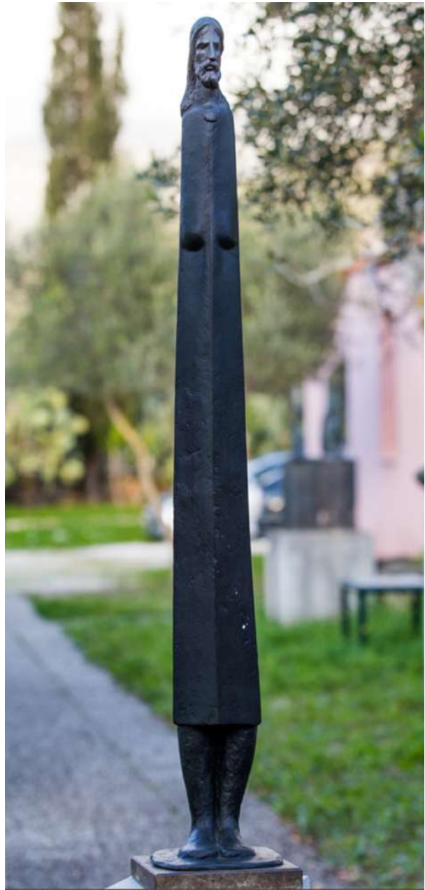
Φιγούρα ανδρός (μύστης), 2000, ορείχαλκος, 121 x 28 εκ.

Όπως έχει τονίσει στην πρόσφατη μελέτη του για εκείνον ο ιστορικός της τέχνης Μάνος Στεφανίδης, ο Μεμάς Καλογηράτος είναι «ένας γλύπτης, ο οποίος εκ των πραγμάτων συνυπάρχει με τον Auguste Rodin (1840-1917), δηλαδή ένα πρόσωπο-ορόσημο ανάμεσα στην ακαδημαϊκή-κλασική γλυπτική και την υπέρβασή της. Τη ρομαντική μεγαλοστομία και την επώδυνη νεωτερικότητα». 8 Η ανεξάρτητη