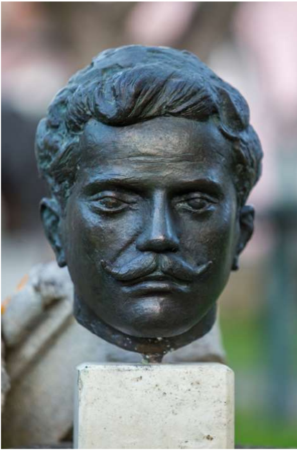
Προτομή Μαρίνου Αντύπα, 1978, ορείχαλκος, 32 x 21 εκ., αντίγραφο της στημένης μπροστά στην πρώην Αγροτική Τράπεζα (νυν τράπεζα Πειραιώς) στο Αργοστόλι.

είναι το Μνημείο Εθνικής Αντίστασης στο Αργοστόλι, όπου ο Μεμάς, εμπνευσμένος από την ποίηση του Νικηφόρου Βρεττάκου, πλάθει τη χαρακτηριστική φιγούρα του, η οποία αποτυπώνει τον άνθρωπο εν γένει, να αιωρείται μπροστά στο εκτελεστικό απόσπασμα· με τα λόγια του ποιητή: «Ψήλωσα / Ψήλωσα / Ψήλωσα / σαν μια κολόνα φάνταξα / με λιονταρίσια χαίτη / μπροστά στα είκοσι στόματα / των τουφεκιών». 7