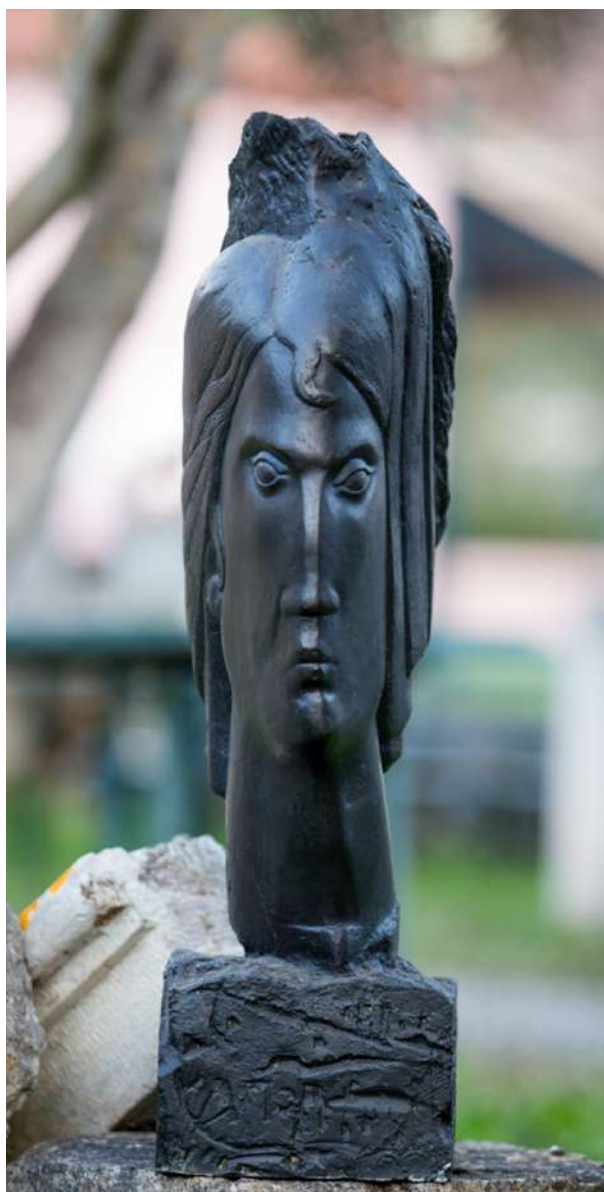
Αττική, 1979, ορείχαλκος, 68 x 19 εκ.

Τη γόνιμη και ευχάριστη εκείνη περίοδο της μαθητείας του στην Α.Σ.Κ.Τ. ο Μεμάς θα λάβει μέρος στους κοινωνικούς αγώνες, ενώ ως μέλος του διοικητικού συμβουλίου της Σχολής θα κατηγορηθεί στη δίκη της Ε.Φ.Ε.Ε., μετά από μια μεγάλη διαδήλωση το 1965 (ίσως ο γλύπτης αναφέρεται στη διαδήλωση όπου έχασε τη ζωή του ο Σωτήρης Πέτρουλας), με συνέπεια να κρατηθεί στο Μεταγωγών, για να αθωωθεί έναν μήνα αργότερα. Παράλληλα, θα εργαστεί για ένα διάστημα ως σκηνογράφος με τον Βασίλη Βασιλειάδη (1927-1991) στην Επίδαυρο. Μετά τη μακρά θητεία του στο στρατό