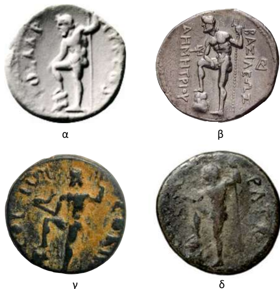
5. Ποσειδώνας: α. Ποσειδώνας. Πάτρα, από εκμαγεία της συγγραφέως. β. Ποσειδώνας. Μακεδονία, επί Δημητρίου Πολιορκητή. γ. Ποσειδώνας. Κόρινθος, επί Δομιτιανού. δ. Ποσειδώνας. Πάτρα, επί Μάρκου Αυρηλίου. ε. Ποσειδώνας Λατερανού, 2ος αιώνας μ.Χ.