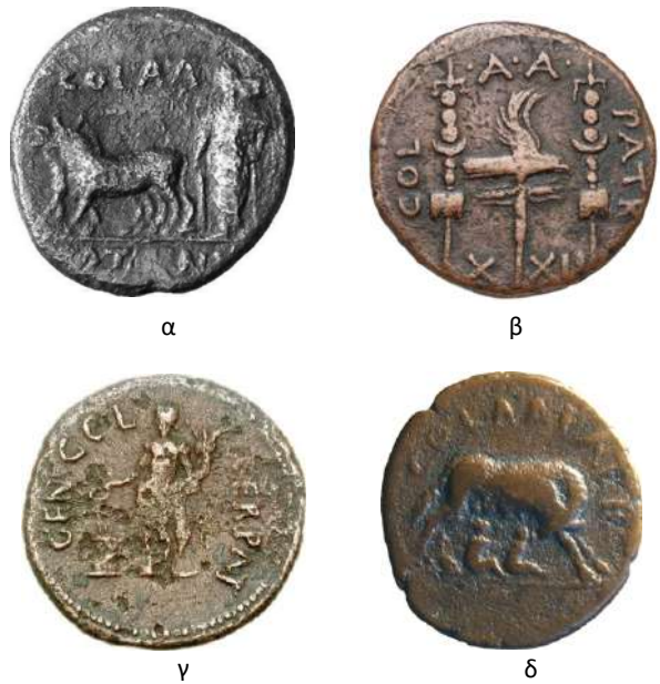
8. Αποικιακοί τύποι από την Πάτρα:

Αλλά και το διαρκώς μεταλλασσόμενο περιβάλλον επέβαλε ανάλογες επιλογές, καθώς μέσα στην παγκοσμιοποιημένη ρωμαϊκή επικράτεια, στο πλαίσιο της pax romana , όπου ο χρόνος έδρασε καταλυτικά στην άμβλυνση της τραυματικής μνήμης των πρώτων συγκρούσεων και της κατάκτησης, οι πο-