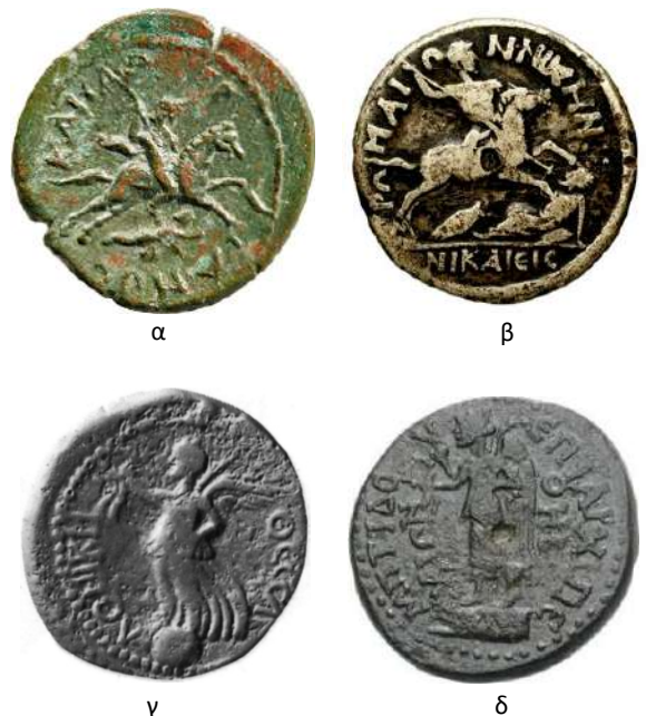
9. Αυτοκράτορας και Νίκες: