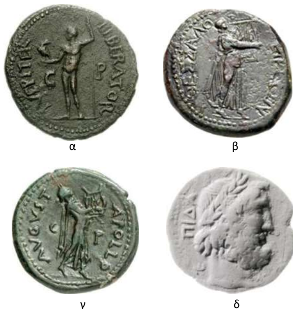
4. Ταύτιση αυτοκρατόρων με θεότητες: α. Πάτρα. Νέρων ως Jupiter Liberator . β. Θεσσαλονίκη. Απόλλων με λύρα, επί Νέρωνα. γ. Πάτρα. Απόλλων με λύρα, επί Νέρωνα. δ. Επίδαυρος. Αδριανός.

Ωστόσο, οι κοπές των πόλεων της κυρίως Ελλάδας ουδέποτε έφθασαν στην ποικιλία και την φαντασία που παρατηρείται στα νομισματοκοπεία της Ανατολής, πιθανότατα λόγω της υπάρχουσας μακράς παράδοσης απεικόνισης λιτών εμβληματικών τύπων που συνδέονταν άμεσα και μακροχρόνια με την πόλη ως εκδίδουσα αρχή. Στην Ανατολή η τοπικού χαρακτήρα εικονογραφία φθάνει στο απόγειό της, πιθανότατα λόγω του διαφορετικού πληθυσμιακού υπόβαθρου στο οποίο συγχέονται γηγενείς και ελληνικές παραδόσεις που επέτρεψαν, τελικά, μεγαλύτερη ευελιξία, τόσο στις επιλογές, όσο και στον τρόπο απόδοσης. Εδώ, ένα από τα κύρια χαρακτηριστικά είναι η αίσθηση της αφήγησης σε ρέοντα χρόνο με τη συμμετοχή περισσότερων